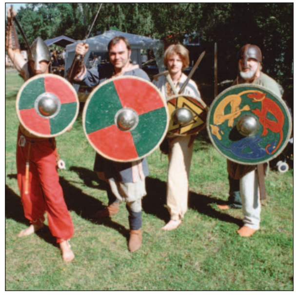
Wikinger des „Drachenclans Düsseldorfer Wikinger“, denen allerdings die kunst handwerkliche Herstellung originalgetreuer Wikingerausrüstung und das Nachempfinden der Geschichte und des häuslichen Alltags wichtiger ist als (unblutige) Kämpfe.