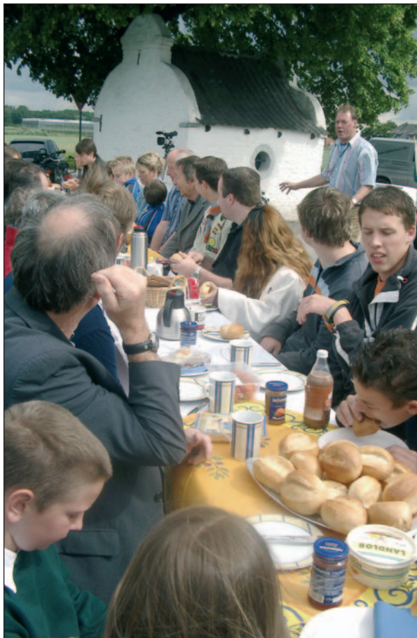
Probefrühstück am Samstag, den 11. Juni an einem kurzen Teilstück der Frühstückstafel vor der Dionysius Kapelle