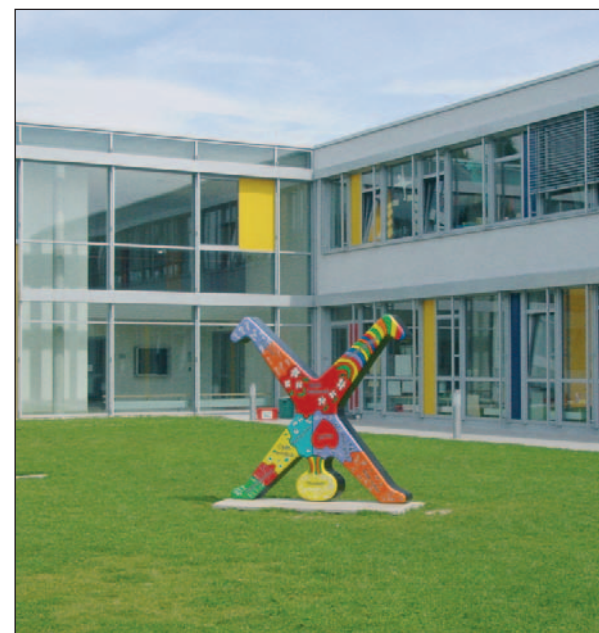
Verbindendes Element zwischen Neubau und Düsseldorf am Rhein: der Radschläger im Innenhof der Primary School

Kinder ab 3 Jahren ohne Englisch-Vorkenntnisse werden auf das lebenslange Lernen vorbereitet. „ESL“ English as second language nimmt viel Raum im Unterrichtsplan ein, außerschulische Aktivitäten wie Sport ebenso. Der Schulalltag, in dem ein Counselor