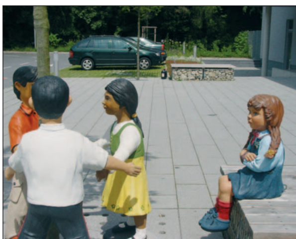
Ein Hingucker: die Kinderplastiken am Eingang des Neubaus