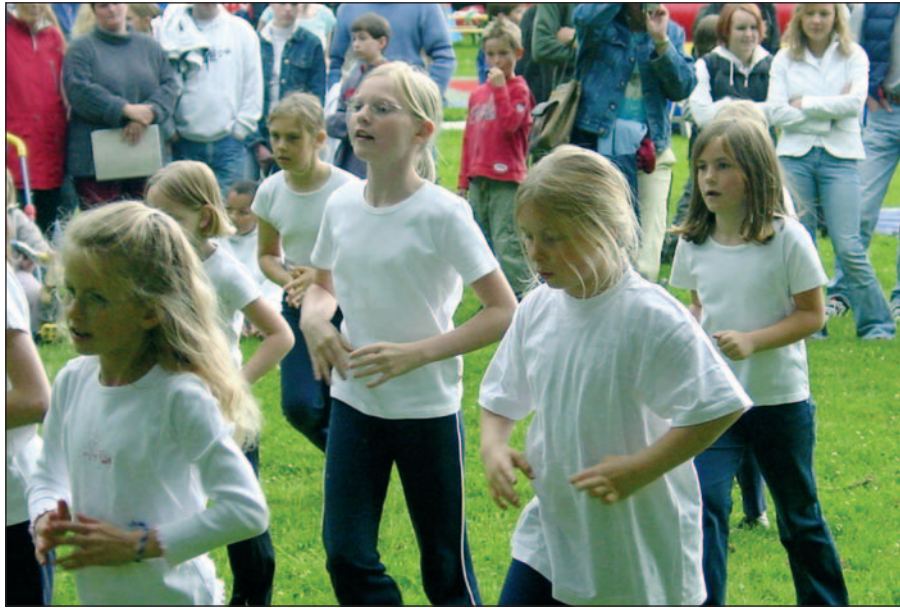
Bei einem so großartigen Fußballturnier wie dem des Kindergarten im Düsseldorfer Norden am 25. Juni geht es natürlich nicht ohne attraktive Cheerleader. Hier ein Teil der Truppe anlässlich des Turniers im vergangenen Jahr.