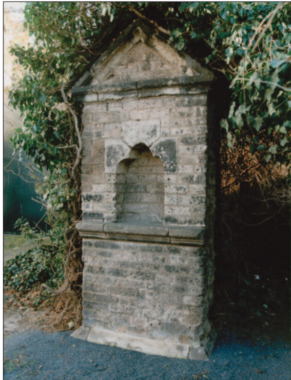
Eine der letzten erhaltenen Stationen des ehemaligen Prozessionsweges vor den Stadttoren der alten Reichsstadt Kaiserswerth, ein Bildstock an der alten Landstrasse. Leider ist er seines Schmucks beraubt. Er steht an Stelle der früheren St. Walburgis Kirche, die 1688 von der französischen Garnison in der Festung Kaiserswerth abgebrochen wurde.

fälle (Heiligenhäuschen und Darstellungen vom Leidensweg Christus), der seit 1717 sowohl von Einheimischen als auch von Pilgern im Gebet begangen wurde. Die „Via Suitbertina“ begann am Klemenstor (Klemensbrücke) und verlief über die Arnheimer Str. bis zur Kalkumer Schloßallee, dann zurück über die Alte Landstrasse, über den Ritterskamp bis zur Basilika. Erhalten sind nur noch an der Alten Landstr. ein Heiligenhäuschen (siehe Foto) und ein Kruzifix auf der Fußballwiese des Diakoniewerks, auf heute evangelischem Grund und Boden ein sichtbares Zeichen für Ökumene. Die barocke Kreuzigungsgruppe in der Vorhalle (Paradies) der Basilika ist sicher die Endstation der „Via Suitbertina“ gewesen. Die übrigen Stationen sind spätestens in der 1. Hälfte der 20. Jahrhunderts verschwunden.