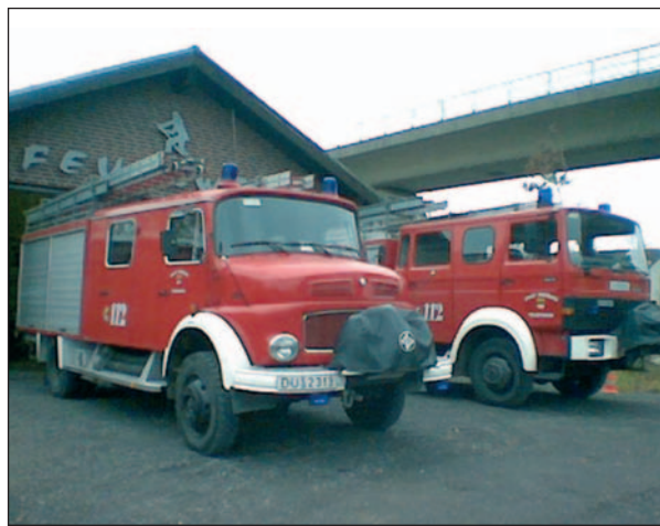
Die beiden Einsatzfahrzeuge der Löschgruppe 704 vor dem Gerätehaus am Steinhof

Die Löschgruppe 704 der freiwilligen Feuerwehr Duisburg, zuständig für die Bereiche Huckingen, Hüttenheim und Ungelsheim, möchte am Samstag, den 25. Juni zu einem Tag der offenen Tür am Steinhof in Huckingen, Düsseldorf Landstraße 347a einladen. An diesem Tag soll der Bevölkerung von Huckingen und Umgebung Räumlichkeiten, Fahrzeuge und die Jugendfeuerwehr vorgestellt werden. Das Programm beginnt um 11:00 Uhr mit einer Fahrzeugschau. Auch für das leibliche Wohl ist unter anderem mit einem