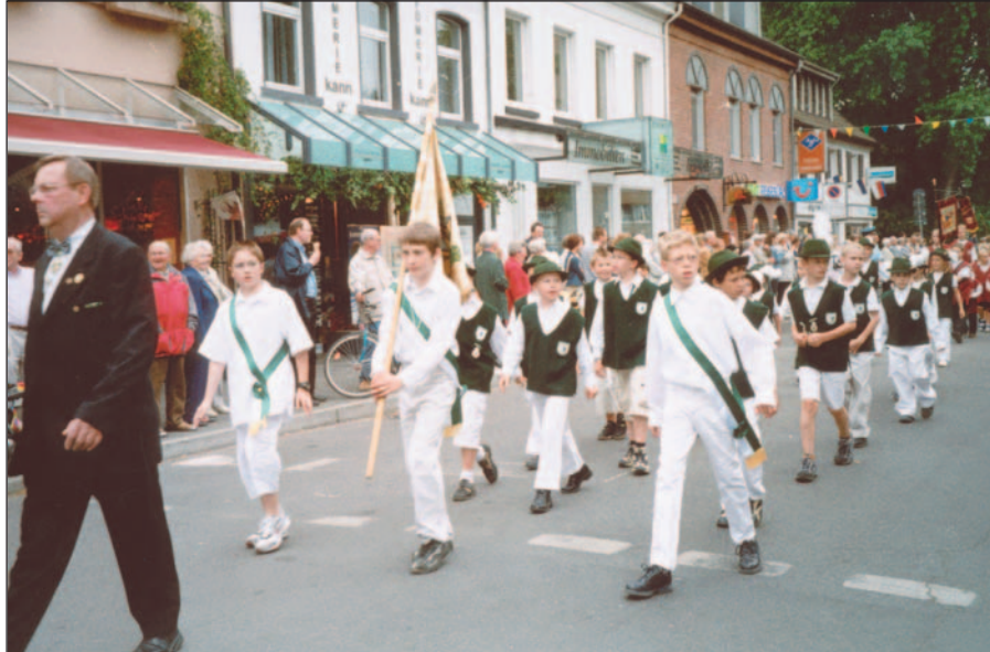
Nachwuchs wird bei der Kaiserswerther Bruderschaft ganz groß geschrieben.