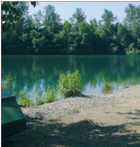
Ruhe vor dem Segleransturm am Rahmer See.

Text: Gabriele Schreckenber