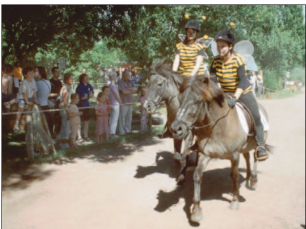
„Biene Maja“ und „Willi“ in vollem Galopp auf Isländerpferden.