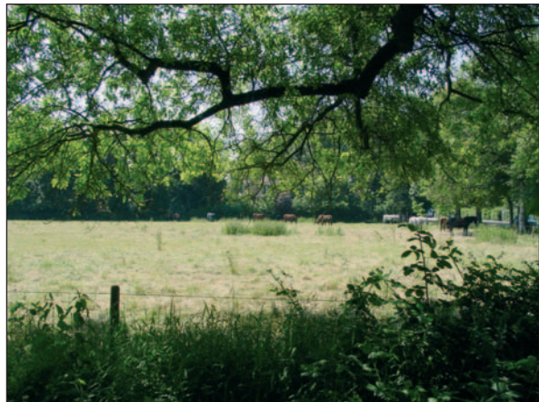
Noch grasen die Pferde vom Brokerhof friedlich auf der Wiese neben dem Katharinen-Kloster.

Historisch gesehen birgt die Wiese manches Geheimnis. Noch bei der letz-