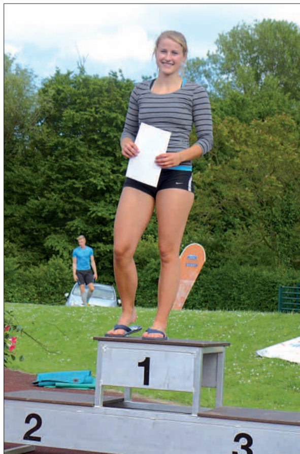
Mit 19 Jahren ist das TVA Ausnahmetalent schon sehr weit oben, nicht nur, was ihre übersprungene Höhe angeht. Wir dürften noch viel Gutes von ihr hören.

sprach noch nicht so richtig ihrem Niveau. Nur zwei Tage später trat die junge Spitzensportlerin in Soest an. Hier übersprang sie souverän 4,10 m und erfüllte damit deutlich die U20 Weltmeisternorm, die bei 4,05 m liegt. Das sichert ihr auch künftig die Führung in der Riege der Deutschen U20 und beste Aussichten, im Juli in Eugene, USA, für Deutschland antreten zu können. G.S.