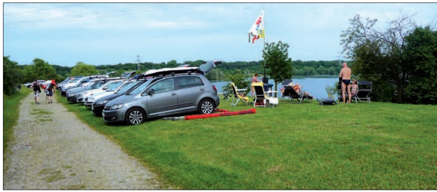
Die ideal und idyllisch direkt am See gelegene Anlage des Windsurfing Clubs Angermund e. V.

Kalkumer Surfclub am Lambertussee mit mächtigen stählernen Toren. Wegen der PFT-Belastung des Wassers ist dort möglicherweise aber neuerdings der Spaß an der Vereinsanlage reduziert. Hervorzuheben ist im Zusammenhang mit dieser kommunalen Förderung des Wassersports in Angermund, dass dieser See und auch die Baggerseen westlich der Bahntrasse, bei anderen Wasser- und Schwimmsportlern ebenfalls sehr beliebt sind, obwohl das Baden offiziell ja verboten ist. Ihnen wird mit dieser kommunalen Förderung suggeriert, dass es mit dem Badeverbot nicht so ernst gemeint ist. Über Pfingsten bei hochsommerlichem Wetter hatten sich wieder hunderte Schwimmsportler, Sonnenanbeter, Grillfreunde und Nackedeisdrift sehr wohl gefühlt. Dass