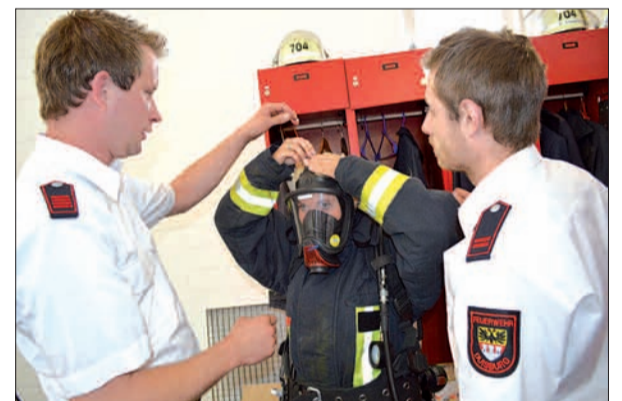
Etwas 20 Kilo wiegt die Ausrüstung, die Feuerwehrmänner mit Atemschutz tragen – die Gäste durften es ausprobieren. Beim Pfingstunwetter waren die Huckinger Blauröcke von 22 bis 12 Uhr im Einsatz und halfen bei der Beseitigung der Schäden im Duisburger Süden.

ben weiteren Frauen auch mehr Kameraden mit und ohne Migrationshintergrund, die seinen Löschzug mit derzeit 33 Aktiven verstärken könnten. Geübt werde dienstags ab 18 Uhr. Auch die Jugendfeuerwehr ist in Huckingen sehr aktiv. Hier stehen die Proben jeden Donnerstag um 18 Uhr auf dem Programm. sam