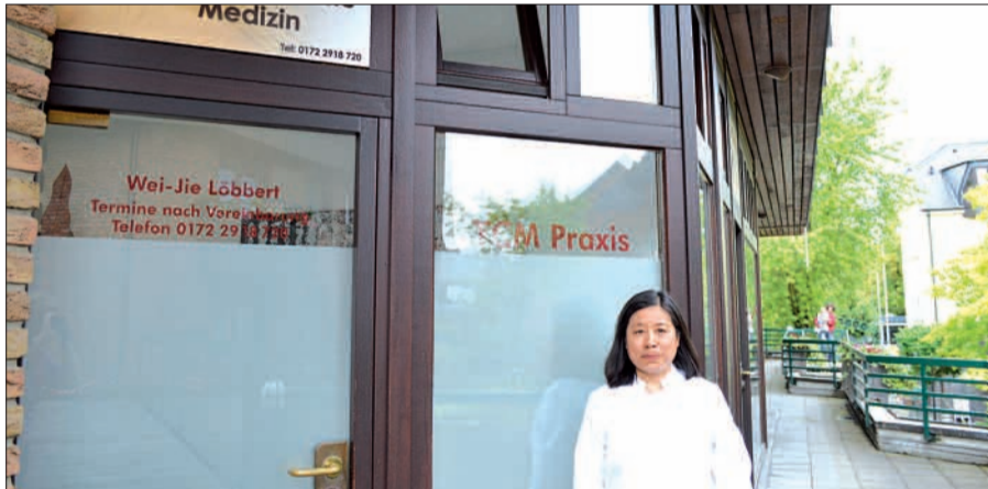
Die TCM-Praxis ist gut zu erreichen. Sie befindet sich in der oberen Galerie des Klemensviertels, Am Kreuzberg 3 in Kaiserswerth.

In der TCM werden verschiedene Techniken verwendet, um diese Blockaden zu beseitigen. Deshalb bietet die Ärztin in ihrer gemütlichen TCM-Praxis Akupunktur, Akupressur, Tuina-Massage, Moxibustion oder Schröpfen an. „Diese Techniken“, so die Medizinerin, „setzen vor allem auf die körpereigenen Selbstheilungskräfte und gelten von daher als weitgehend nebenwirkungsfrei.“ Insbesondere bei Kopf-, Rücken- und anderen chronischen Schmer-