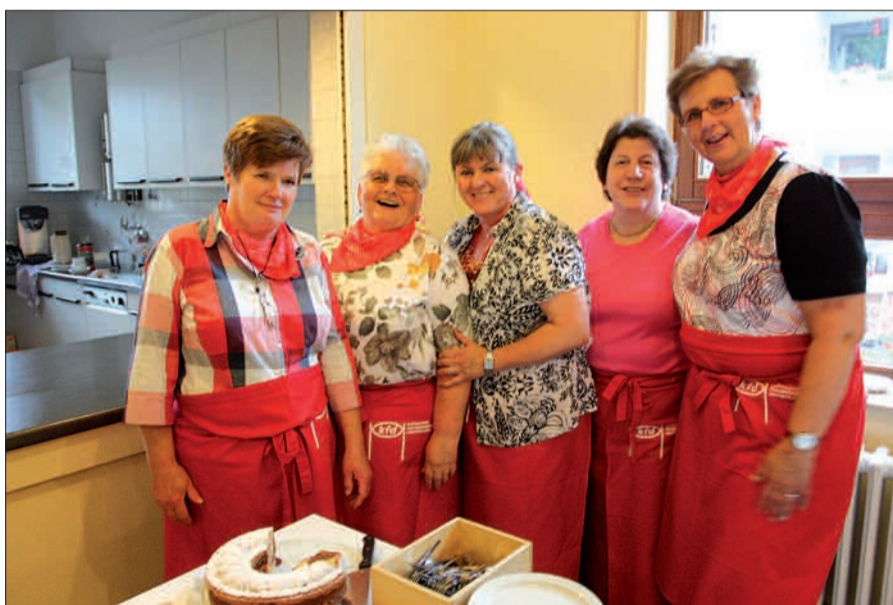
Ohne die leckeren Kuchen der ehrenamtlichen Bäckerinnen läuft beim Angermunder Pfarrfest nichts.