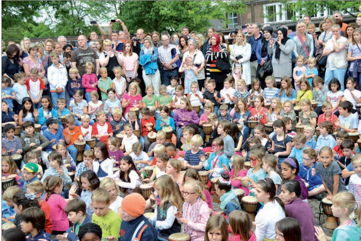
Mehr als 300 Mädchen und Jungen flogen in Huckingen mit dem Zauberflugzeug nach Tamborena. Auch die Gäste hatten am Trommelzauber großen Spaß.

ne Langeweile aufkam. Selbstverständlich war auch wieder für das leibliche Wohl gesorgt. Neben Kuchen gab es zudem Würstchen und Sucuk vom Grill. Es war ein gelungenes Fest, bei dem auch das trockene Wetter mitspielte. Das nächste dieser Art findet in vier Jahren statt.