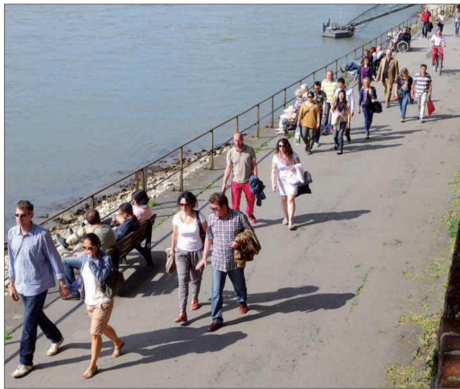
Mit der Rheuferpromenade und auch im Übrigen kann Kaiserswerth mit Urlaubs- und Erholungsorten mithalten.

Wie haben die Einzelhändler in Kaiserswerth den verkaufsoffenen Sonntag trotz kurzfristig abgesagtem Weinblütenfest erlebt? Brigitte Braun von Kindermoden Braun im Klemensviertel: „Es war insgesamt nicht