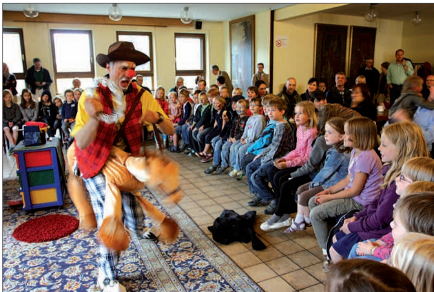
Wie oft hat der Zauberclown Ferdi schon die Stimmung gerettet, wenn es draußen geregnet hat? Hoffentlich scheint diesmal wieder die Sonne.