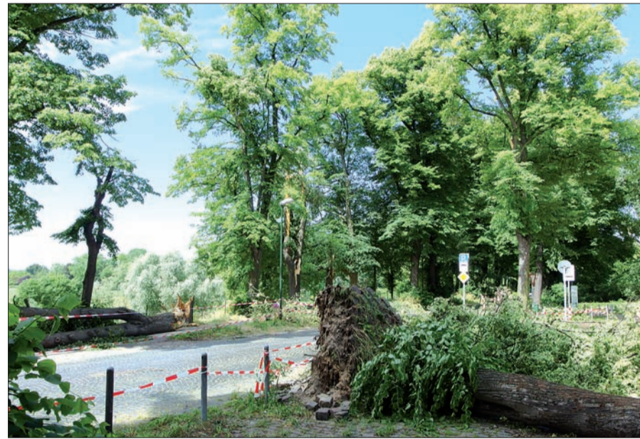
Lücke in der Allee „An St. Swibert“ nach dem Unwetter am Pfingstmontag.