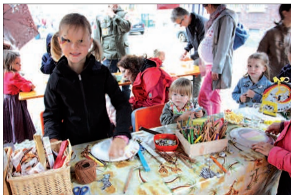
Die Kinder sind auf jeden Fall dabei und immer bester Laune, ob es regnet oder die Sonne scheint.