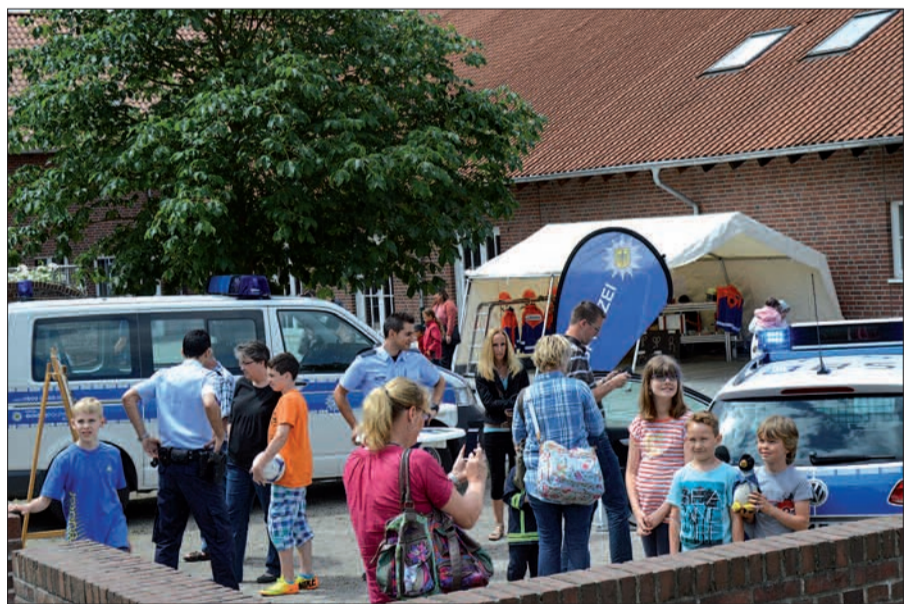
Auch die Polizei war am Steinhof vor Ort, um die Bevölkerung über ihre Arbeit zu informieren.