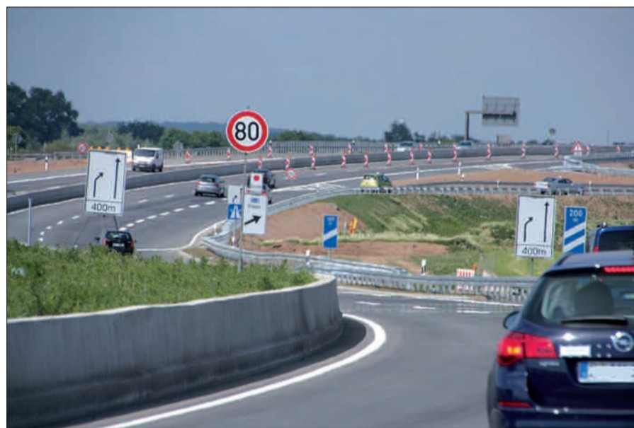
Die B8n zwischen Angerbrücke und B288 am ersten Tag nach der Freigabe.