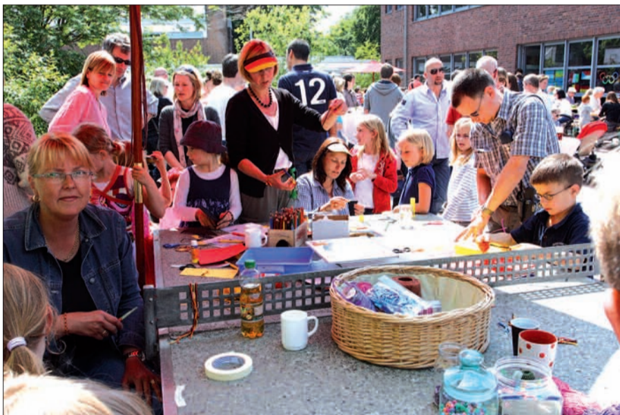
Die Basteltische waren heiß begehrt.

schnell abgegrast war, und genügte sich viele hundert kleine und große Menschen an den bunten Spielständen. Und als Trost für die, die am Internationalen Buffet nicht mehr fündig geworden waren, gab es immer noch die Bratwurst mit Brötchen und leckeren Kuchen. G.S.