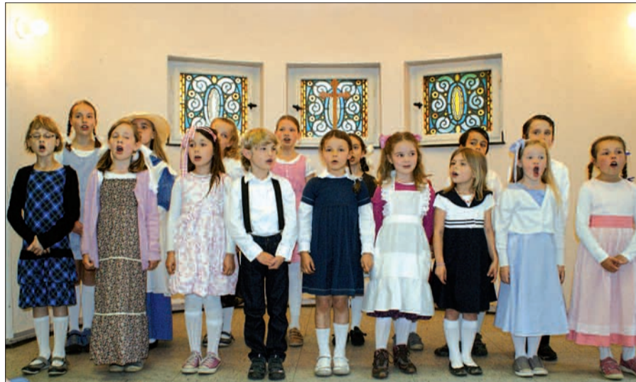
Selbst die Mitglieder des Kinderchores waren in historischen Kostümen erschienen, um das Jubiläum gebührend zu feiern.