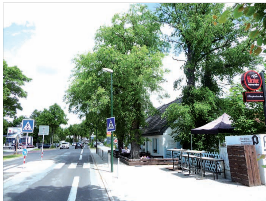
Ein idyllisches Stück der Niederrheinstraße in Höhe (gegenüber) der Jonakirche.

fahrradfreundlichen Stadt überall vorstellt (siehe Niederlande). Leider werden auf der „neuen“ Niederrheinstraße im Übrigen die Radler nach wie vor auf einen aufgemalten Radweg verwiesen. Bei der sicher aufwendigen Erneuerung der Niederrheinstraße wurde die Chance vertan, einen wirklich fahrradfreundlichen Radweg, völlig getrennt vom Kfz-Verkehr auf der Fahrbahn, über die Gesamtstrecke anzulegen. Das kleine Stück Muster-Radweg vor Kirche und Kindergarten muss man aber positiv sehen. Hier kann der Radweg nicht zugeparkt werden.