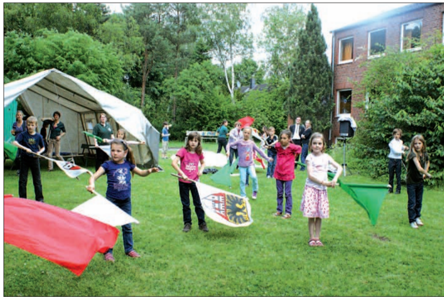
Mit großer Ausdauer probten die Mädchen und Jungen auf der katholischen Pfarrwiese in Rahm das Fahnen-schwenken.

„Auf den Spuren von Nikolaus Groß“ und führt nach Köln. Neben einer Messe in St. Agnes ist eine Rhein-Rundfahrt geplant. Eine Anmeldung ist bis Montag, 18. Juni, im Gemeindebüro möglich. sam