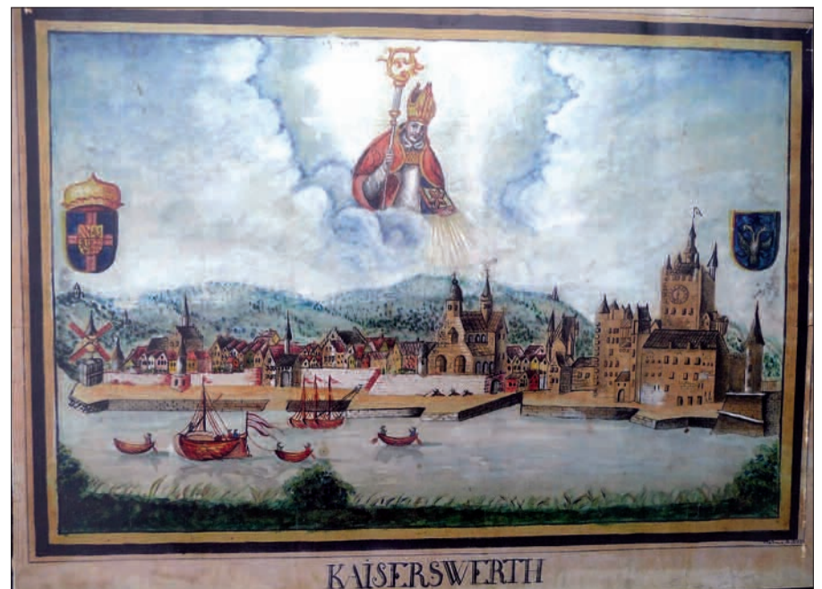
Dieses Bild soll in Theodor Fliedners Arbeitszimmer gegangen haben und aufzeigen, dass auch St. Suitbertus als Kaiserswerther Schutzpatron geschätzt habe.