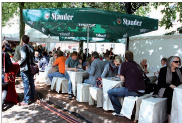
Hübsch im Schatten ließ es sich beim Weinblütenfest gut aushalten.