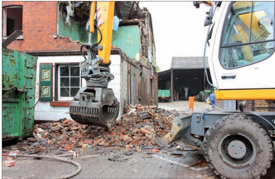
Alt Angermund ade.