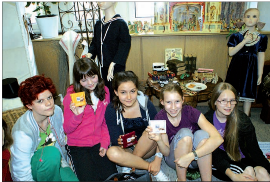
Auch die jüngere Generation schaute interessiert zu, wie ein Zimmer vor 100 Jahren ausgesehen hat. Es gab interessante Details zu bestaunen.