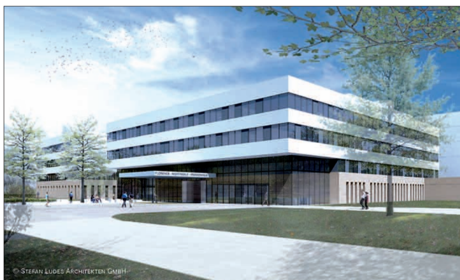
Das ist die Animation des geplanten Anbaus an das Florence-Nightingale-Krankenhaus vom Architekten Stefan Ludes aus Berlin.