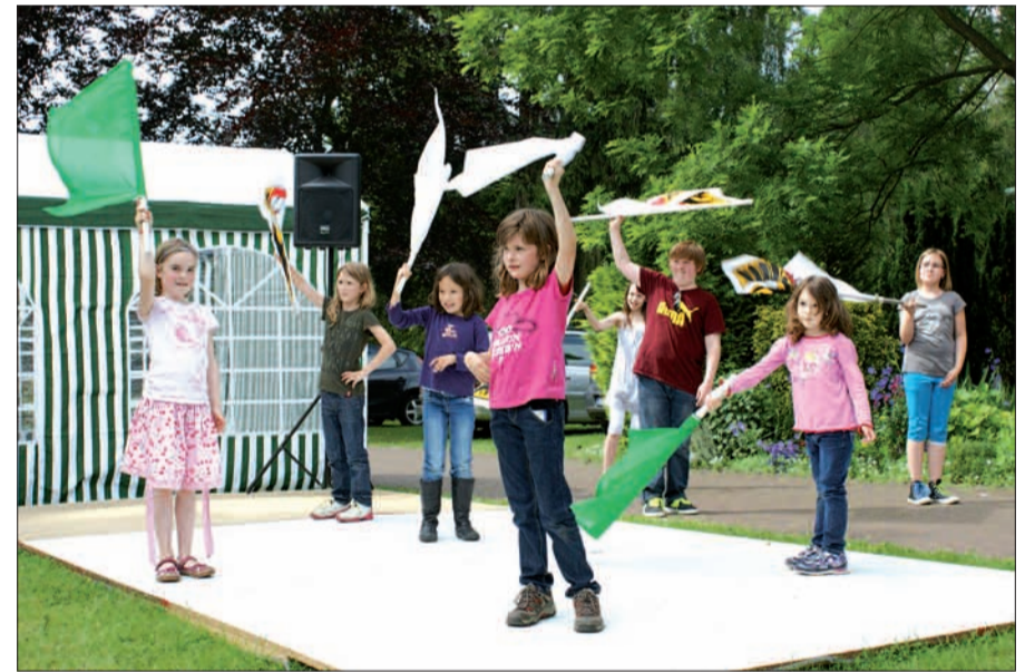
Das Üben hat sich gelohnt: Viel Applaus bekamen die neuen Fahnen-schwenker von Eltern und Gästen des Gemeindefestes.