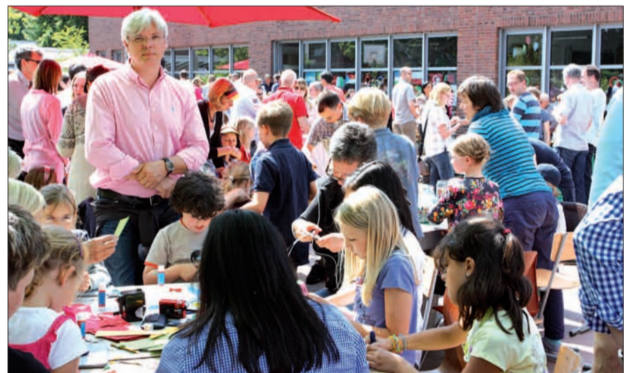
Und das bunte Getümmel auf dem Schulhof hielt den ganzen Nachmittag.

In wenigen Minuten geht es los, die Kinder bevölkern bereits die Bühne.