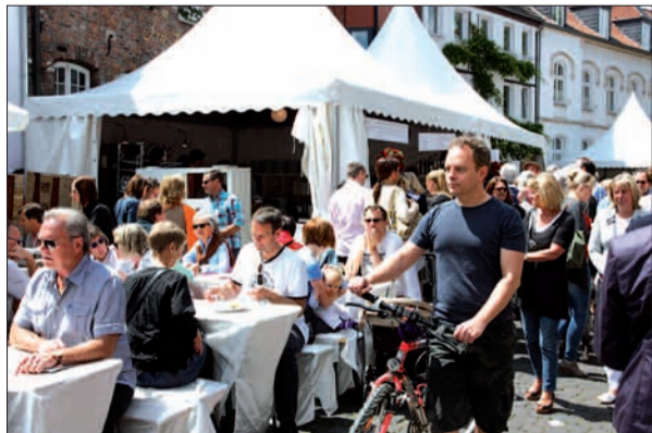
Vor dem Schiffchen herrschte dichtes Gedrängel - kein Wunder, bei dem gastronomischen Angebot.