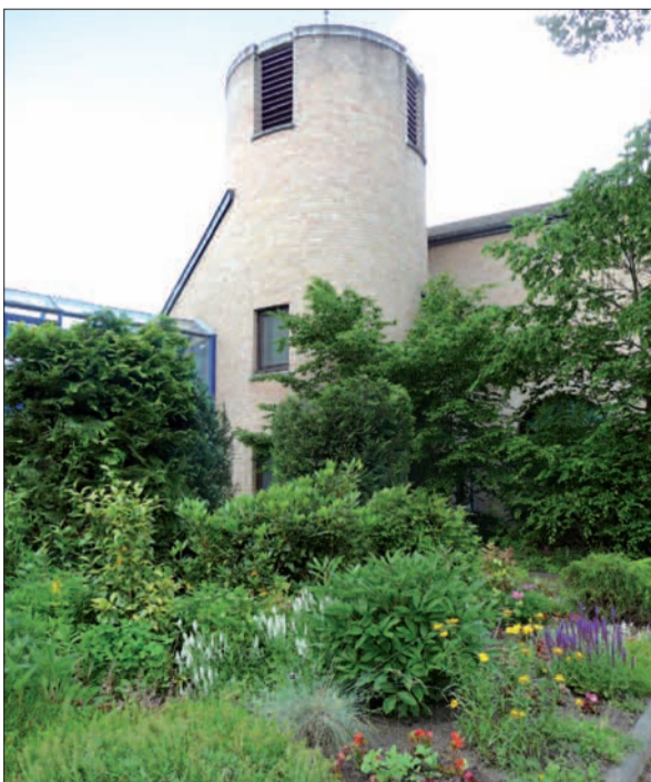
Fleißige Gärtnerinnen und Gärtner bringen das Umfeld der Jonakirche in Lohausen jedes Jahr zum Grünen und Blühen.

gungen vorbereiten und das Kindermusical „Ein General steht stramm“ vortragen. Für die Größeren und Großen gibt es Mitmachaktionen zum Raten und Bewegen und ab 15 Uhr Lieder und Texte aus dem Pop-Oratorium „Adam. Auf der Suche nach dem Menschen“ mit der Kantorei und den Jonasingers. Essen und Trinken ist reichlich im Angebot für Jung und Alt und für jeden Geschmack, natürlich auch Kaffee und Kuchen in gemütlicher Runde. Für den Abend ist geplant, gemeinsam beim EM-Fußballspiel Deutschland gegen Dänemark mitzufiebern. Herzlich willkommen! H.S.