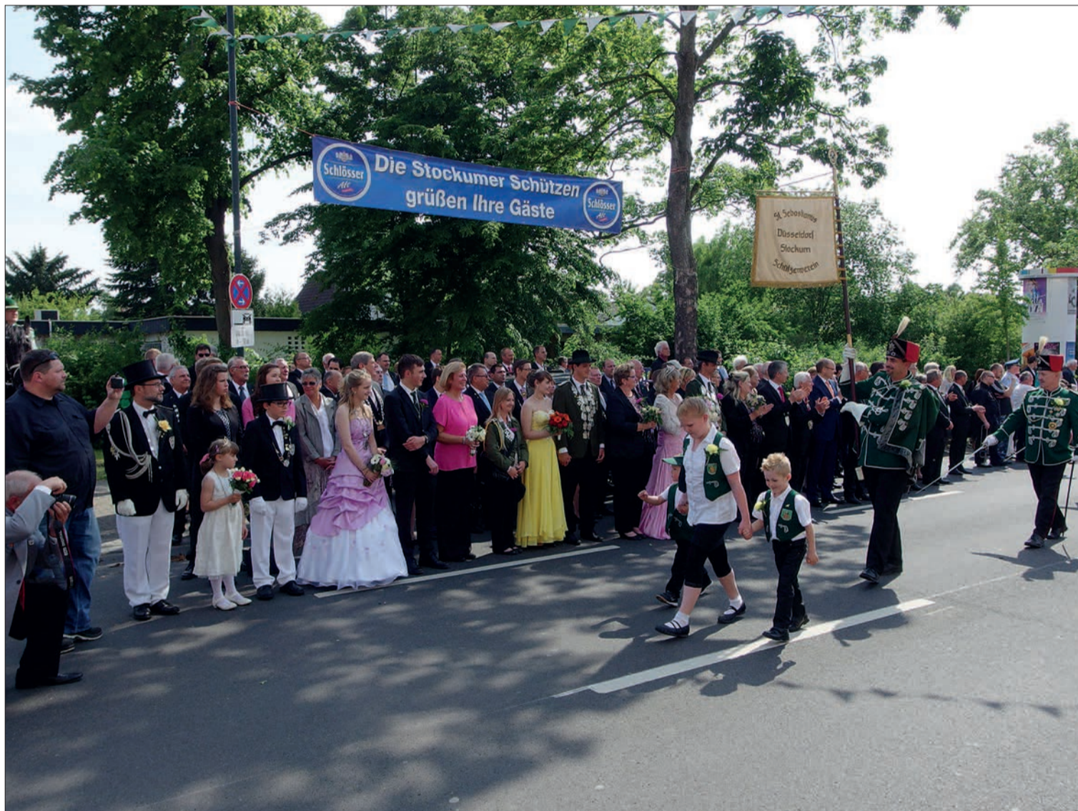
Abnahme der Parade vor den Majestäten und Ehrengästen auf der Stockumer Kirchstraße.