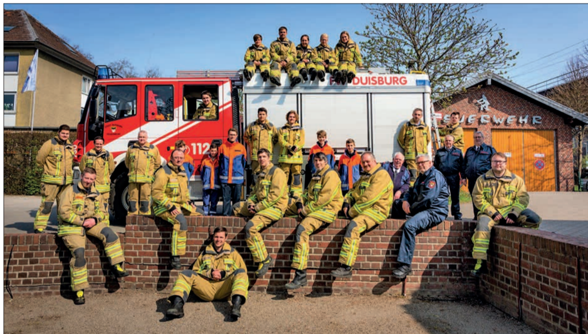
Die Mitglieder des Löschzugs 730 decken aktuell folgendes Einsatzgebiet ab: Großenbaum, Huckingen, Rahm, Ungelshiem und Hüttenheim.

Die Freiwillige Feuerwehr (FFW) Huckingen besteht seit 125 Jahren – der NORDBOTE berichtet ausführlich. Zum Jubiläum des Löschzugs 730 steigt am Samstag, 11. Juni, im Steinhof im Rahmen eines Verbandsfestes eine große Party, zu der die Party-Band „Klar!“ aufspielt. In ihrem Live-Programm hat die Band Party-Hits dabei – von den 80er Jahren bis heute. Auch ein Saxophonist sowie ein DJ sorgen für die richtige Stimmung. Abgerundet wird der Abend mit kühlen Getränken und heißen Steaks oder Würstchen vom Grill. Die Türen öffnen sich um 17 Uhr, der offizielle Teil mit Ehrungen und Reden beginnt um 18 Uhr. Als Ehren Gäste werden unter anderem Bundestagspräsidentin Bärbel Bas, Stadtdirektor Martin Murrack und Lothar Böhm, Vorsitzender des Stadt-Feuerwehrverbands Duisburg, erwartet. Die engagierten Blauröcke freuen sich auf viele Gäste, sowohl Kameraden als auch Bürgerinnen und Bürger aus dem Duisburger Süden und Düsseldorf-Norden. Die Karten kosten 15 Euro und sind jeden Dienstag