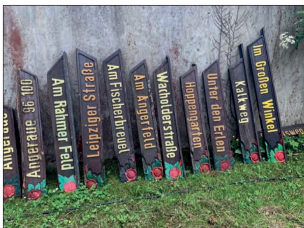
Das Picknick im Bürgerhausgarten war gut besucht, die Versteigerung der Holzschilder zugunsten der ukrainischen Kinder brachte weit mehr als 1.000 Euro ein.

Angermunder und Anrainer am 22. Mai an weiß gedeckten Tischen, genossen Kuchen und Kaffee und Bratwurst mit Brötchen. Hübsch geschnittene Straßenschilder, die Wahrzeichen der Rosenstadt, wurden für einen guten Zweck versteigert, nämlich zugunsten der ukrainischen Kinder in Angermund. Mehr als 1.000 Euro kamen spontan zusammen. Ein tolles Ergebnis. Und wer den schönsten Hut getragen hat, verraten wir beim nächsten Mal. G.S.