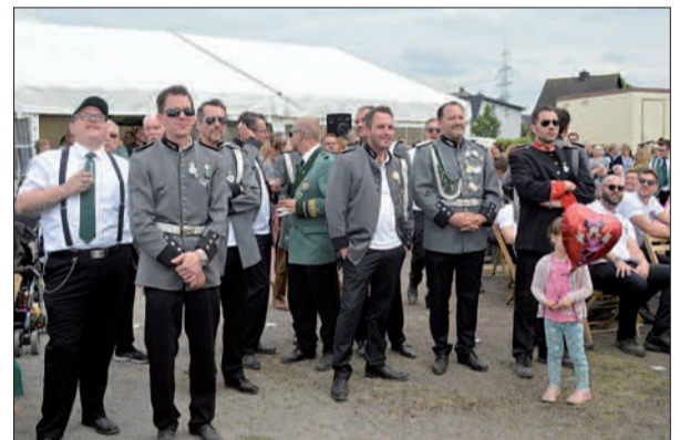
So viele Anwärter auf den Königstitel hatte es wohl noch nie gegeben: 25 Schützen reihten sich in die Schlange ein, um auf den Königsvogel zu zielen. Alle blieben bis zum Schluss bei der Stange.