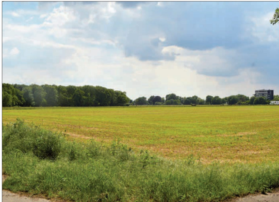
Viele Bürger aus Rahm und Umgebung genießen den Blick vom Wald aus auf das Landschaftsschutzgebiet mit seiner ökologischen Vielfalt.