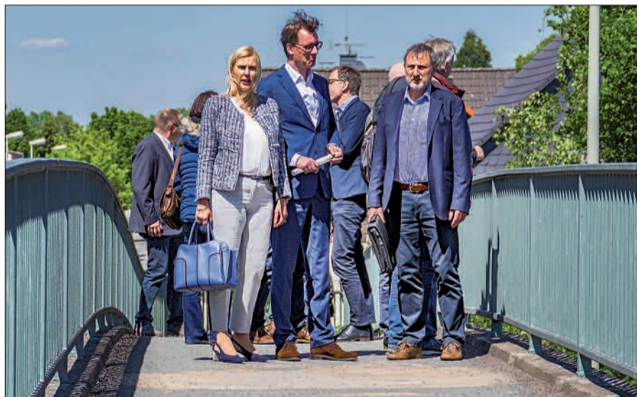
NRW-Verkehrsminister Hendrik Wüst (Mitte) ließ sich nicht nur von Petra Vogt (MdL) und Bezirksvertreter Wolfgang Schwertner die problematische Verkehrssituation vor Ort erklären, auch Mitglieder des Bürgervereins waren vor dabei.

Wie sehr die zahlreichen Laster und Autos die Verkehrssituation in Mündelheim beeinflussen, bemerkte NRW-Verkehrsminister Hendrik Wüst neulich am eigenen Leib: Erst im zweiten Anlauf gelang es ihm, auf die Tankstelle an der Kreuzung B 288/Uerdinger Straße zu fahren, weil die Einfahrt von LKW und PKW staumäßig zugestellt war. Von dort aus ging er mit Vertretern der Bürgervereine und CDU auf die Fußgängerbrücke. Er machte sich von den Problemen eigenhändig ein Bild und versprach, dass seine Planer sich schon bald