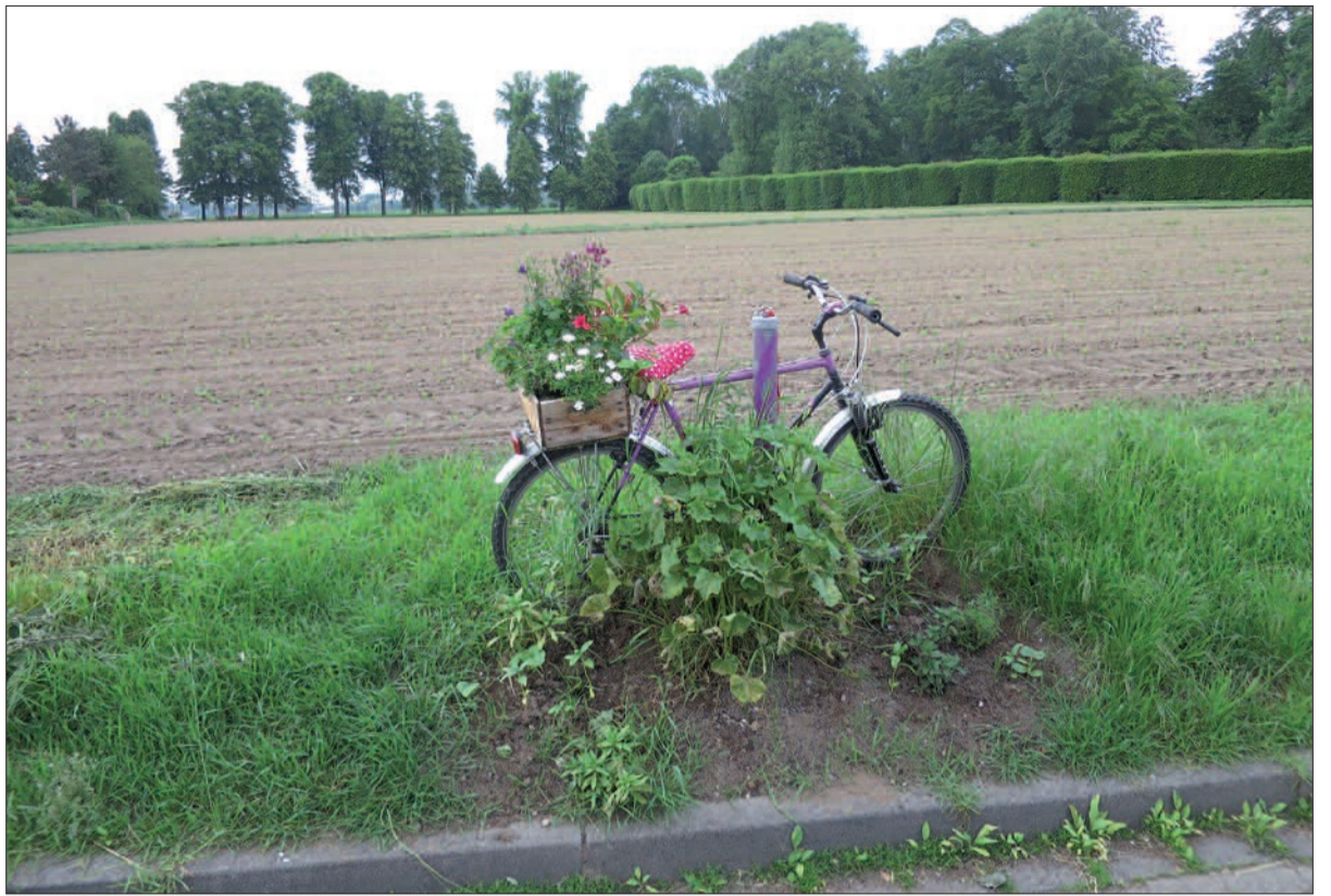
Dieser liebevoll von einem Anwohner geschmückte Acker soll zwecks Refinanzierung des Kaufpreises für den Käufer von Schloss Kalkum zum Bauland umgewidmet werden.

sch der Kalkumer Schlossallee im Norden und der Oberdorfstraße im Süden besteht derzeit kein Baurecht. Daher gilt auch in diesem Fall, dass eine Entscheidung, für diese Flächen ggf. bauleitplanerisch tätig zu werden, unabhängig von dem Wunsch des Käufers nach Bebauung, in der Planungshoheit der Stadt Düsseldorf liegt. Da der neue Eigentümer für die o.g. Flächen eine Bebauung vorge schlagen hat, ist beabsichtigt, gemeinsam mit Vertretern der Bezirksvertretung 5 und des Ausschusses für Planung und Stadtentwicklung und der Verwaltung in einem Workshop offen zu diskutieren, ob eine Bebauung infrage käme und wenn ja, in welcher Form