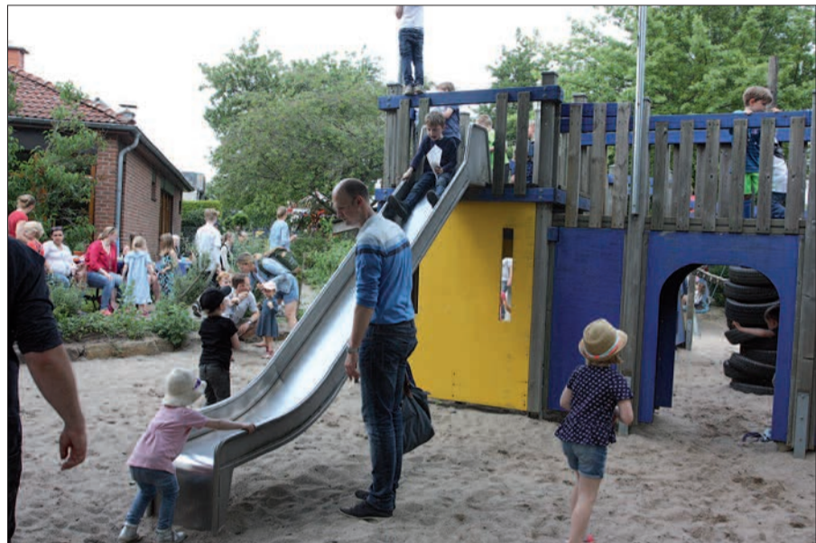
80 Kinder passen in die Ritterburg, ohne, dass es eng wird.

Bunt wie das Leben war das Buffet. Indische, marokkanische, italienische, französische Gerichte wechselten ab mit herrlichen Kuchen, Muffins, Salaten aus der deutschen Küche. Die Vielfalt macht's, eben auch am Buffet. Trotz-