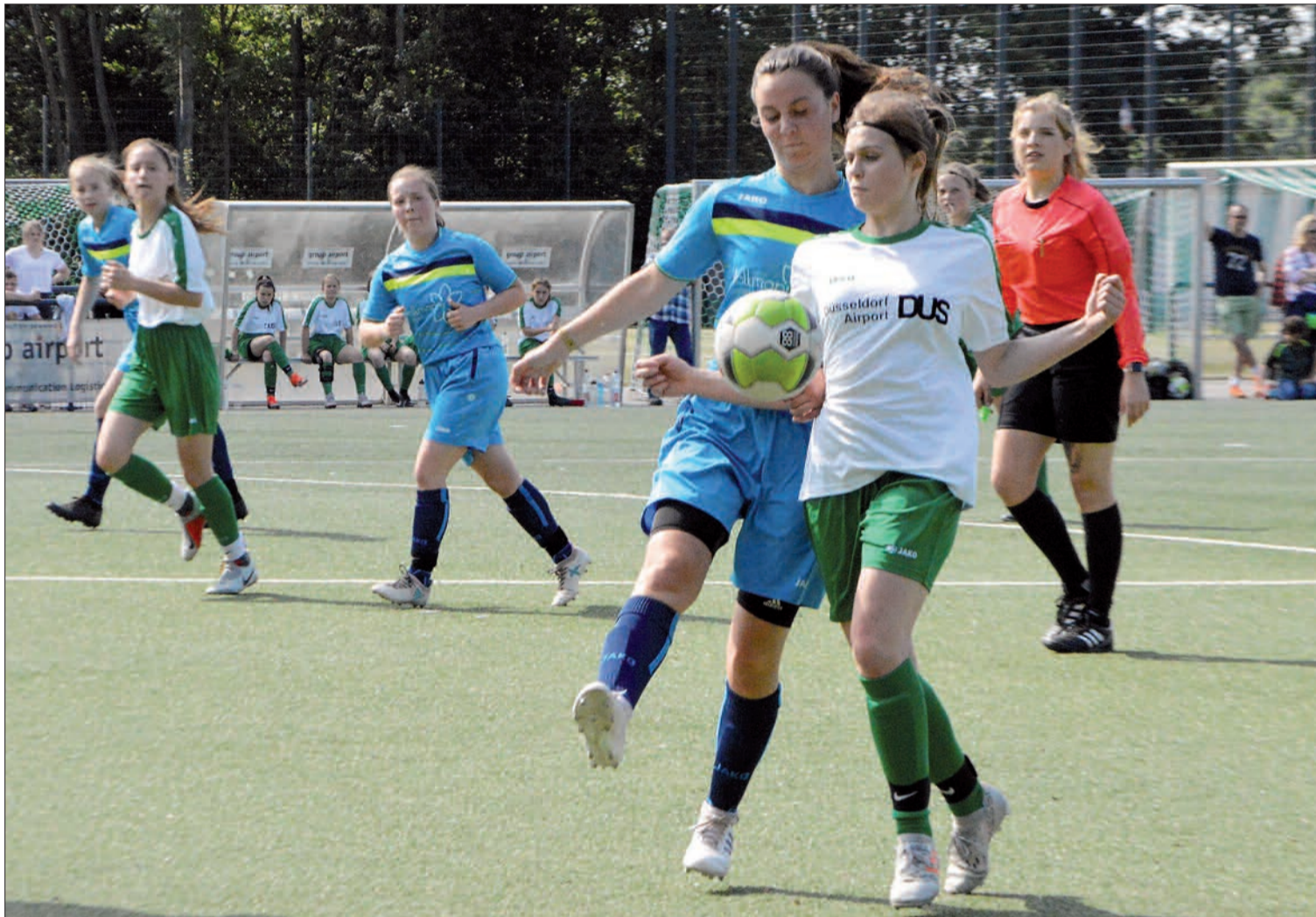
6:2 siegten die U 19-Juniorinnen des LSV auf dem eigenen Platz. Insgesamt fanden am Samstag vier Pokal-Endspiele der Mädchen am Neusser Weg statt.