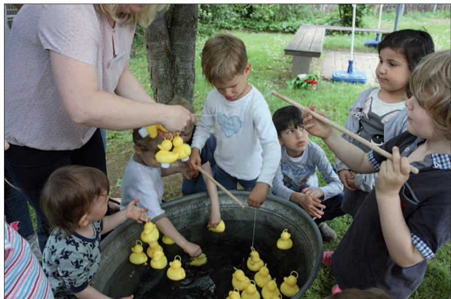
Volle Konzentration beim Enten-Angeln. Als Preis gab's Eis.

dem war die gute alte Bratwurst vom Grill in aller Munde. Und nicht nur das Entenangeln war begehrt. Auch an der Popcornmaschine (von De Elf Pille) und unter den blauen Sonnenschirmen (von Handwerk & Handel) ließ es sich an diesem lebhaften Nachmittag bestens aushalten. Doch es gab noch mehr Attraktionen, etwa die Ritterburg mit vier Türmchen. Sie ist so groß, dass 80 Kinder darauf spielen können, ohne dass es voll wird.