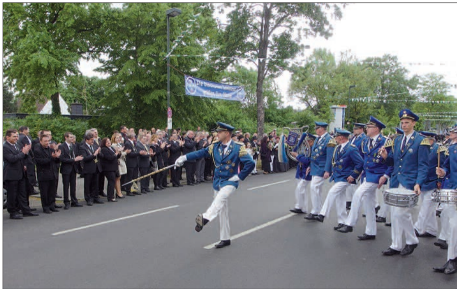
Die Parade auf der Stockumer Kirchstraße ist ein eindrucksvolles Erlebnis.