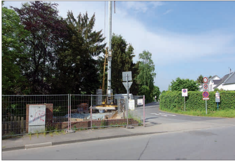
Bauen im Engpass. Die Einfahrt zur Franz-Vaahsen-Grundschule und zum Schützenplatz in Wittlaer.

bei einem Blick auf die derzeitige Baustelle kaum vorstellen, dass dort noch Platz für einen angemessenen Garten bleibt, wohl aber eine Sichtbehinderung bei der Ausfahrt auf die Bockumer Straße. Wie groß muss die Not im Hinblick auf Baugrundstücke sein, wenn auf diese Ecke noch ein Einfamilienhaus gesetzt wird! Diese Not ist auch in Lohausen unübersehbar, wenn direkt in der Einflugschneise noch Neubauten für Mehrfamilienhäuser entstehen, wie der NORDBOTE leider berichten musste. Wäre es nicht eher angebracht, auf einem ökologisch toten Maisacker Häuser zu errichten mit ökologisch wertvollen, grünen und idyllischen Gärten darum herum? H.S.