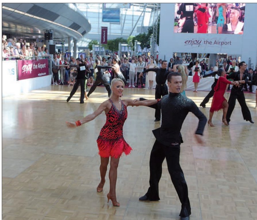
Neben Anfängern und Fortgeschrittenen unter den Besuchern kommen beim Airlebens-Sonntag am 3. Juni auch wieder Profis mit Showtänzen auf die Tanzfläche, mitten auf der Abflugebene im Flughafen-Terminal.

Wer Walzer bereits beherrscht, kann ein spezielles Stiltraining besuchen. Und wer Lust hat, sich in einem Walzer-Wettbewerb zu beweisen, sollte sich bis 13.15 Uhr an der Airlebens-Info anmelden. Es sind attraktive Preise zu gewinnen. Ab 17 Uhr steht die Tanzfläche beim Open-Dance für Jedermann zur Verfügung. Für Nicht-Tänzer gibt es ein attraktives Rahmenprogramm wie Fotobox, Portraitzeichnen und tolle Tanzformationen. Der Eintritt ist überall frei. Das günstige „Park-Spezial“ (€ 5,- für 6 Std. auf P 7 und 8), Gewinnspiele wie die Airport-Ralley und „Sie buchen- wir zahlen“, 60 Shops, Bars, Restaurants und 40 Reisebüros (alle auch sonntags geöffnet) garantieren darüber hinaus einen erlebnisreichen, wunderbaren Sonntag im Duft der weiten Welt. H.S.