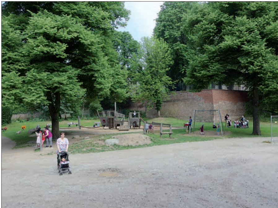
Der Spielplatz unterhalb der Klemensbrücke liegt nach Ansicht der Verwaltung im Landschaftsschutzgebiet „Rheinaue“, und die Verwaltung lehnt deswegen weitere Spielgeräte ab. Es handle sich um „bauliche Anlagen“, die dort „grundsätzlich nicht zulässig“ sind.

Der Kinderspielplatz unter der Klemensbrücke ist der einzige im historischen Kaiserswerth. Er ist sehr beliebt und wird nicht nur von Anwohnern gern angenommen, sondern auch von Besuchern und Kunden mit Kindern. Verständlich, dass die Bezirksvertretung 5 zusätzliche Spielmöglichkeiten beantragte, wie zum Beispiel eine Nestschaukel und eine Seilbahn. Die Verwaltung lehnt dies aber ab. Der Spielplatz läge im Landschaftsschutzgebiet „Rheinaue“. „Das Errichten baulicher Anlagen ist an dieser Stelle gemäß Landschaftsplan der Stadt Düsseldorf grundsätzlich nicht zulässig“, so die Begründung der Verwaltung. Auch die Sanierung des Spielplatzes vor einigen Jahren sei an die Grenzen gestoßen, was im Rahmen des Landschaftsschutzes zu vertreten war. Die Denkmalbehörde läge zudem Wert darauf, die sanierte Bastionsmauer freizuhalten. Offensichtlich „wiehert hier der Amtsschimmel“. Vielleicht fragen die Vertreter dieser „Verwaltung“ mal die Kollegen in der Forstverwal-