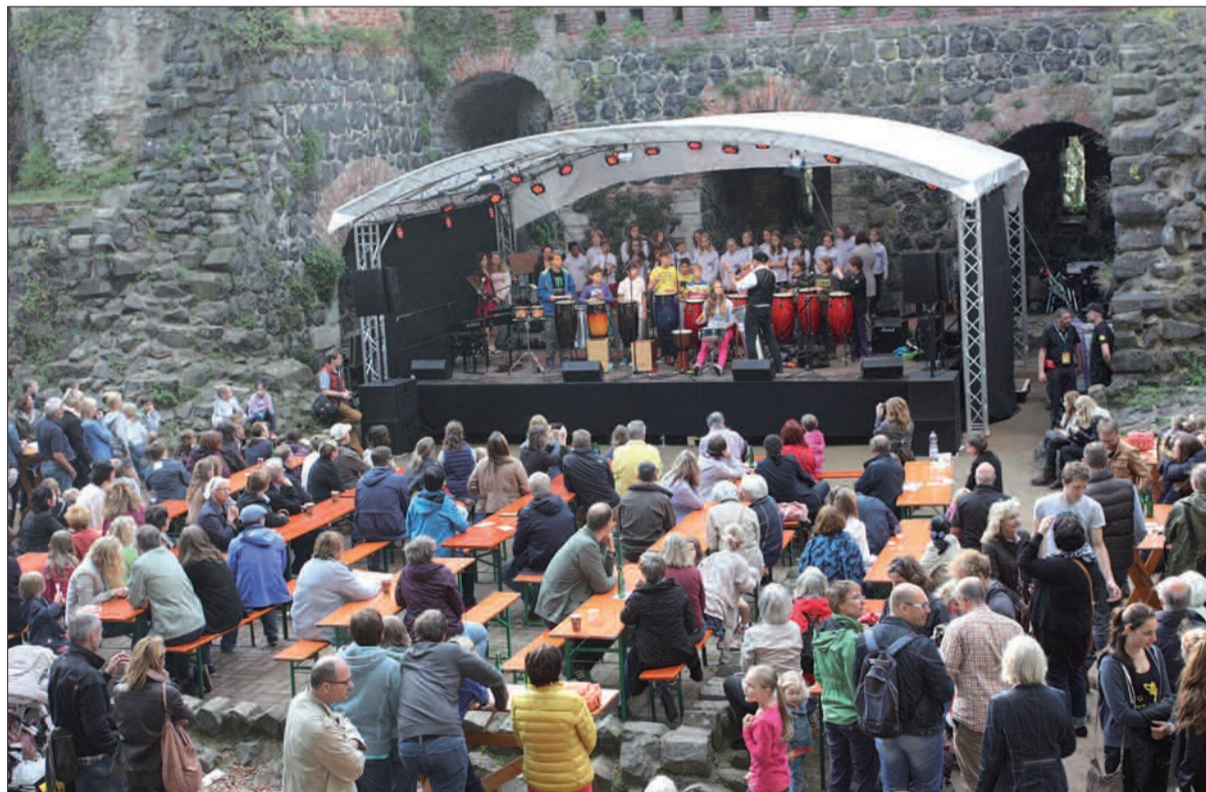
Die Kaiserpfalz ist herrliche Kulisse für Konzerte, bei dem regelmässig auch die Big Band und das Vokalensemble vom Theodor-Fließner-Gymnasium auftritt.

ist, bleibt bestehen erforderlich sind, wird noch Inwieweit Maßnahmen im geprüft. Diese Anlage ist Hinblick auf die Trinkwasservorsichtshalber derzeit nicht sergewinnungsanlage auf in Betrieb. H.S. dem Werth in Kaiserswerth