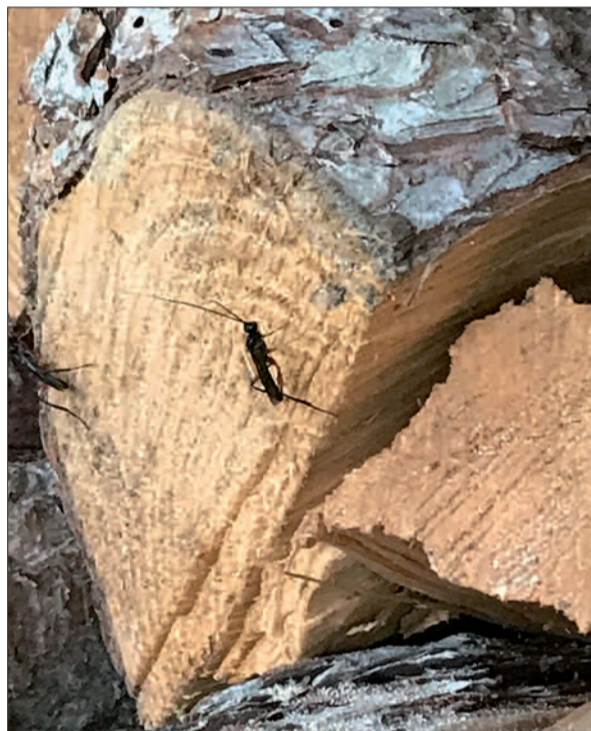
Viele Mücken und andere Insekten machen den Menschen im Duisburger Süden im Moment das Leben schwer.

Naturschutzbehörde vor, die sowohl die Bekämpfung der Mücken als auch Präventionsmaßnahmen ablehnt: Der Begriff Plage sei nicht zutreffend. Das erhöhte Mückenaufkommen sei auf die überdurchschnittlich warme Witterung im April zurückzuführen. Das Auftreten sei lokal beschränkt, in der Umgebung von Wasserflächen und Feuchtwaldgebieten – wie beispielsweise in Rahm. Es gebe gute Mückenmittel, weiterhin könne man sich durch entsprechende Kleidung schützen. sam