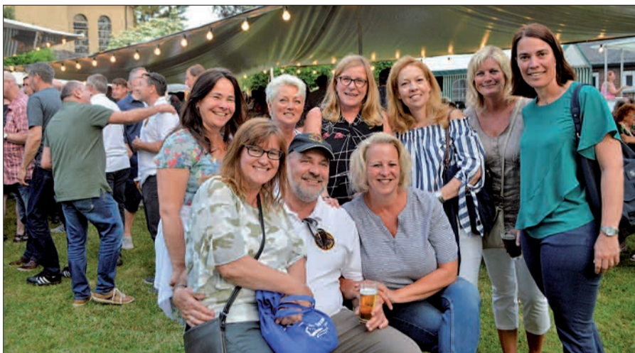
Geselligkeit wird bei Schützen und Rahmern groß geschrieben.