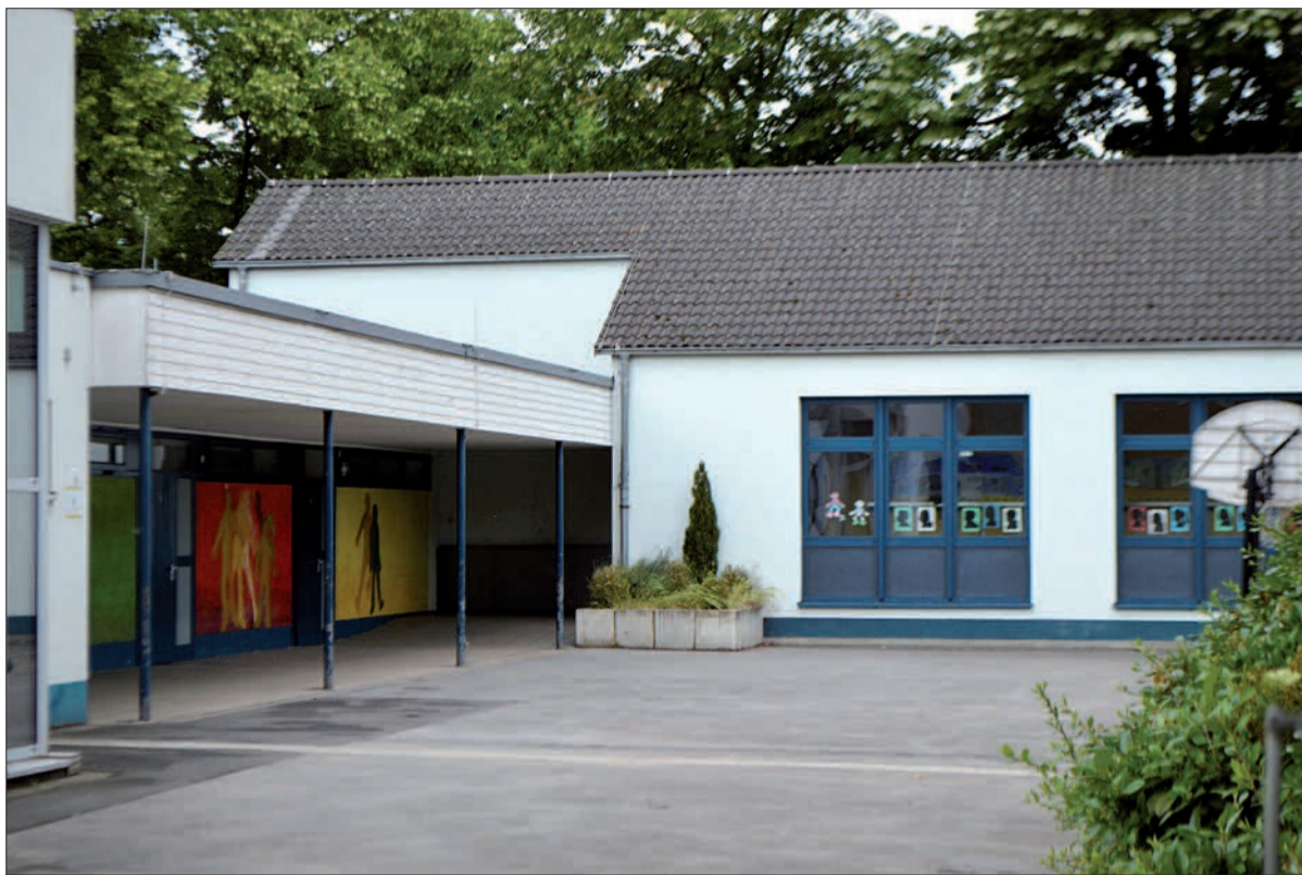
Viele Eltern finden es schade, dass ihre Kinder in Serm kein warmes Mittagessen bekommen können. Der Oberbürgermeister soll nun prüfen, welche Voraussetzungen dafür nötig seien, um beispielsweise die Mahlzeit im Gemeindehaus einnehmen zu können.

Schülerzahlen Bei den Grundschulen wurden folgende Anmeldungen für das Schuljahr 2018/2019 angegeben: In der Albert-Schweitzer-Straße in Huckingen kommen voraussichtlich 119 Mädchen und