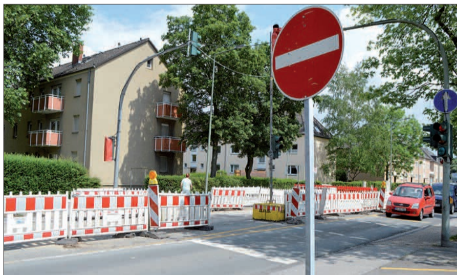
Wenn das Wetter mitspielt, sollen die Arbeiten an der Dauerbaustelle Mündelheimer Straße in Huckingen Ende 2018 beendet sein. Foto: sam

Seit vielen Monaten beherrscht die Dauerbaustelle an der Mündelheimer Straße den Verkehrsfluss in Huckingen. Doch ein Ende ist in Sicht. Der Kanalbau ist nach Angaben der Wirtschaftsbetriebe (WB) Duisburg abgeschlossen: „Im Rahmen von KIDU wird nun die Straße weiter ausgebaut. Je nach Wetterlage werden die Baumaßnahmen Ende November 2018 abgeschlossen sein.“ Die Straßenbaukosten betragen etwa 1,1 Millionen Euro. Sie befinden sich zurzeit im geplanten Rahmen, heißt es auf Anfrage des NORDBOTEN.