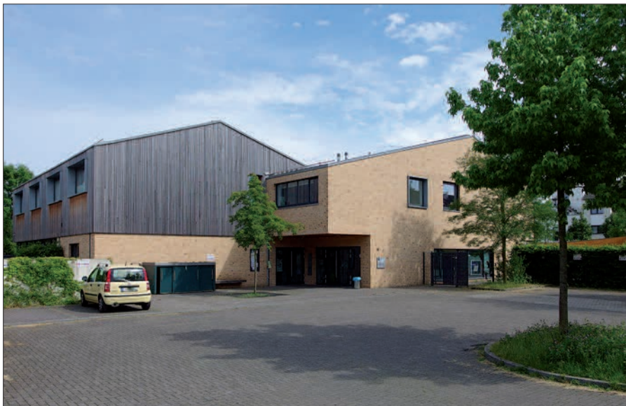
Das Haus der „Nordkap-Familie“ in Wittlaer.

Stadtteil sehen“. Kinder von 4 bis 16 Jahren haben fotografiert. Eröffnet wird das Fest durch den Wittlaerer Kinder- und Jugendchor unter Leitung von Petra Verhoven. Es gibt Sekt, Kaffee und Kuchen, Fingerfood und Aktionen für Kinder. Neben weiteren Aktionen wird gegen 16 Uhr ein Bild für eine gute Sache versteigert. Das Fest kommt zustande in Kooperation mit dem Heimat- und Kulturkreis Wittlaer e. V. und mit Unterstützung des Gartencenter Böhmann-Ilbertz und dem Weinhof Wittlaer. H.S.