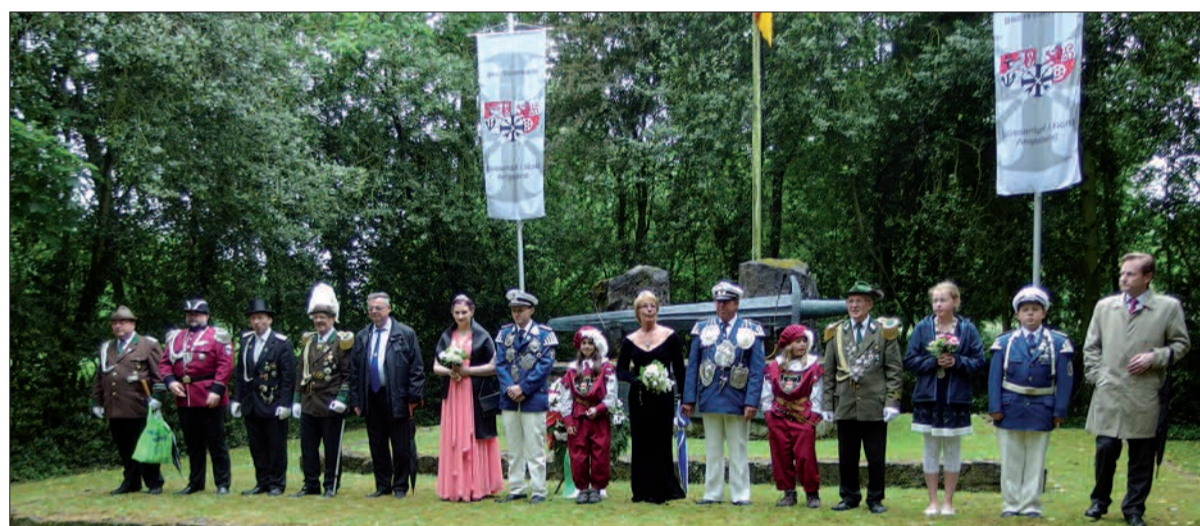
Abnahme der Parade beim Kalkumer Schützenfest durch die Majestäten und Honoratioren am Ehrenmal.