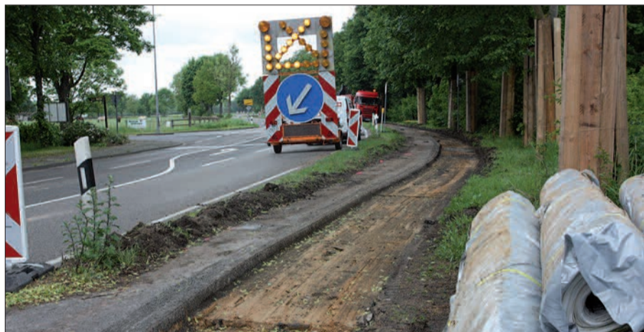
Endlich! Der kombinierte Rad- und Fußweg zwischen Angermund und Rahm wird saniert und ist ab Mitte Juni wieder allen zugänglich.

Und nicht nur die Reiter vom benachbarten Brockerhof werden sich freuen. Unzählige Radfahrer/innen müssen künftig nicht mehr auf die Landstraße 60 ausweichen, wo reger PKW-Verkehr herrscht. G.S.