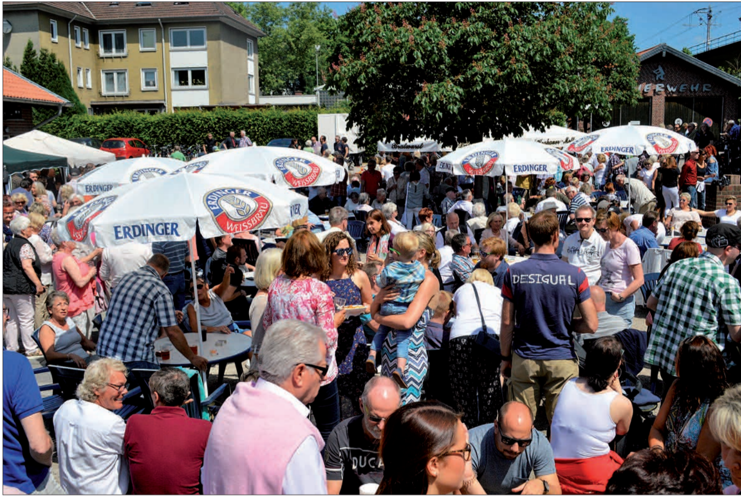
Mehr als 2.000 Gäste feierten gemeinsam Vatertag am Steinhof in Huckingen und genossen sowohl die entspannte Atmosphäre als auch die gute Musik.