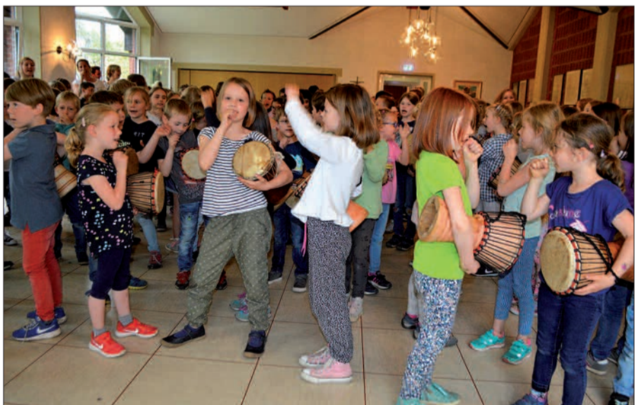
Die Rahmer Grundschüler hatten viel Spaß bei diesem außergewöhnlichen Unterricht, bei dem sie viel gelernt haben – sowohl musikalisch als auch durch das gemeinsame Erlebnis.