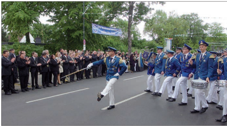
Schützenparade auf der Stockumer Kirchstraße.