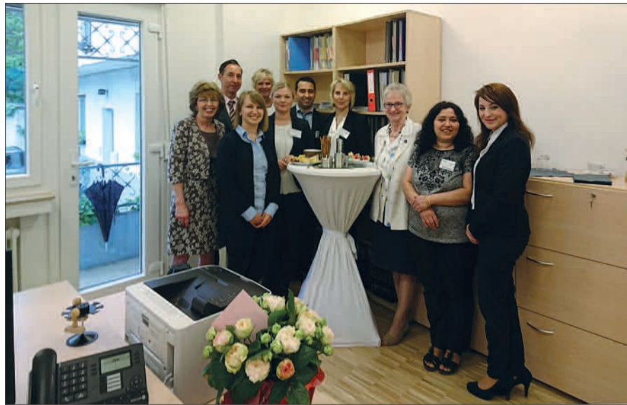
Viel los war am Tag der offenen Tür bei Kusserow auf der Angermunder Straße. Die Expansion und Renovierung ist geglückt.