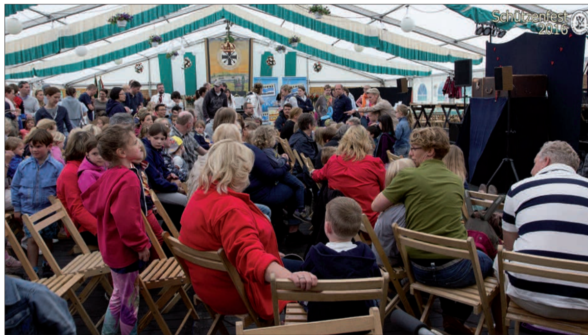
Auch in diesem Jahr lockt in Kalkum wieder der "Familiensonntag" am 11.06.2017 von 13:00-15:30 Uhr.