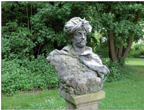
Der türkische Großwesir aus Hartblei-Guss (18./19. Jahrhundert) steht einsam hinter der Lantz'schen Villa.

der Ausstellung wird erbeten. Weitere Kunstwerke könnten in dem weitläufigen Park auch vor der beabsichtigten Vermietung der Lantz'schen Villa aufgestellt werden. Der Antrag der CDU-Fraktion ist mit Nachdruck formuliert: „es seien schon 8 Jahre ohne Tätigkeit vergangen“. Die Vermietung der Lantz'schen Villa schleppt sich ebenfalls schon Jahre hin. Nach Auskunft der Verwaltung an den NORDBOTTEN wird mit einem Interessenten über einen Erbbaurechtsvertrag verhandelt. Wegen des komplexen Vertragswerkes und auf Grund der Besonderheiten des Objekts würden die Verhandlungen weiter Zeit in Anspruch nehmen. Derweil verfällt das Gebäude. H.S.