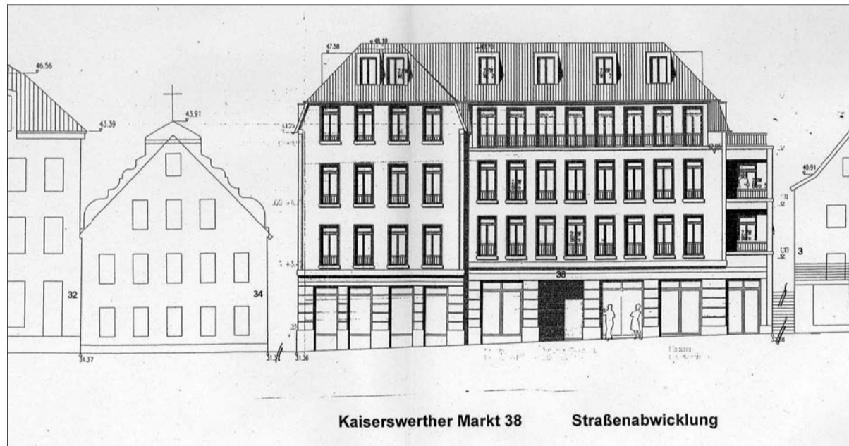
Das Bauvolumen beträgt 7.073 Kubikmeter, übersteigt also das alte Kaufhaus Strauß erheblich.

staltet werden. 12 Stellplätze müssen nachgewiesen werden, 4 davon sollen in einem so genannten Doppelparker nachgewiesen werden, weitere acht Stellplätze sollen abgelöst werden. Man darf gespannt sein, wie die Bezirksvertretung am 28. Mai über diese Verwaltungsvorlage abstimmen wird. G.S.