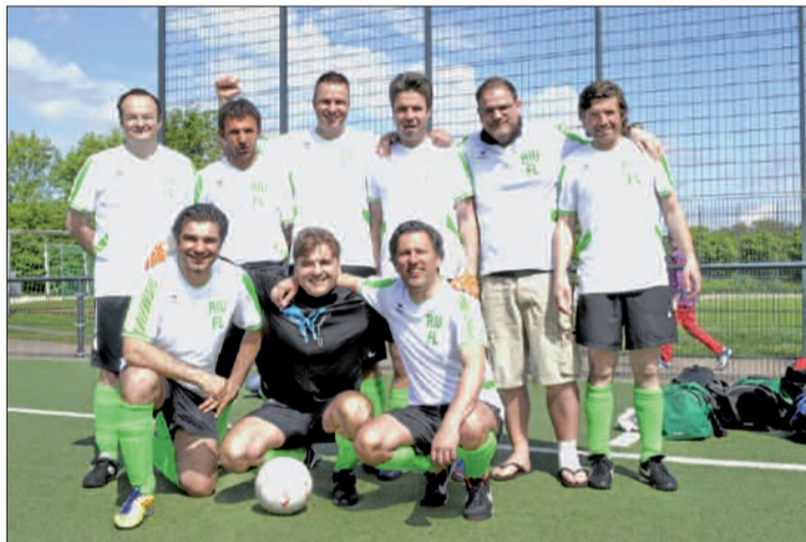
Großen Spaß am Fußballspielen haben die Ritter unterdachter Flächen (RiuF), die regelmäßig trainieren.

Milliarden von Würmern können nicht irren! Mit Holz lässt es sich gut leben!