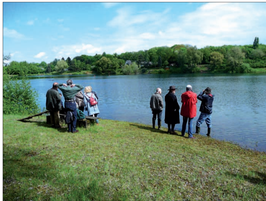
Die Kaiserswerther Seenplatte mit Spee-Biotop, Suitbertus-, Fliedner- und Lambertussee ist eine wunderbare Landschaft und erlaubt herrliche Ausblicke, das Wasser ist aber mit PFT belastet. Hier sind Mitglieder des Heimat- und Bürgervereins Kaiserswerth auf der traditionellen ornithologischen Wanderung am Himmelfahrtstag unterwegs.

Schon seit einigen Jahren ist bekannt, dass das Grundwasser in Kaiserswerth, Kalkum, Zeppenheim und im nördlichen Teil von Lohausen mit PFT belastet ist. Der NORDBOTE hatte seinerzeit darüber berichtet. PFT ist ein Sammelbegriff für perfluorierte Tenside, synthetisch hergestellte, organische Stoffe. Sie sind aktuell nicht giftig, bauen sich im Körper von Mensch und Tier jedoch nicht ab. Mit einigen Ausnahmen und Übergangsfristen sind Verwendung und Inverkehrbringen seit einigen Jahren verboten. PFT