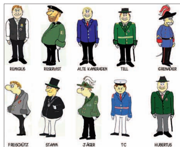
10 pfiffige Cartoons beschreiben die Gruppen der Wittlaerer St. Sebastianus Bruderschaft - noch Fragen??