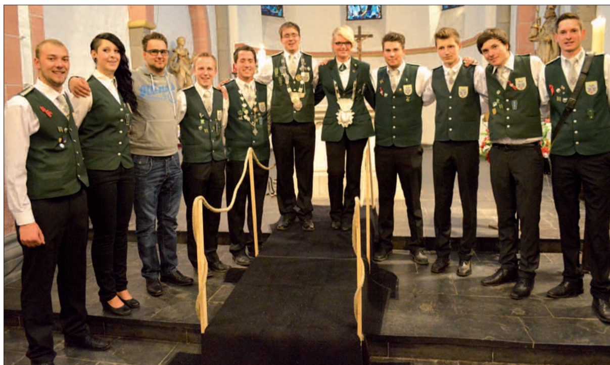
Die Jungschützen aus dem Diözesanverband Duisburg-Essen trafen sich zur Geburtstagsfeier in Mündelheim. Nicht nur im Jugendgottesdienst bauten sie eine Brücke.