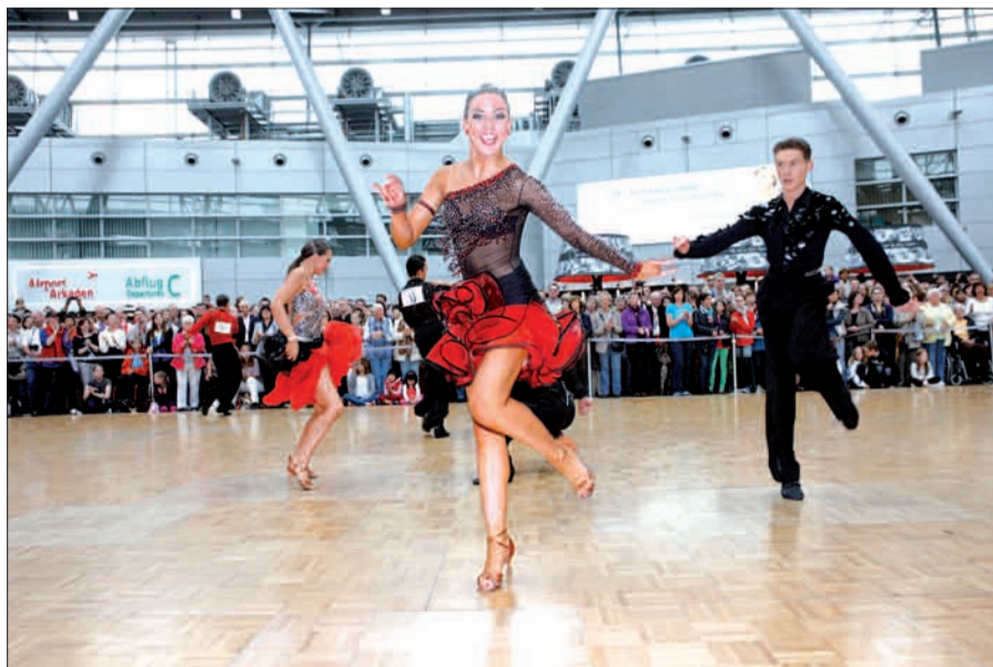
Tanzen steht im Mittelpunkt des Airlebnissonntags am 2. Juni auf dem Flughafen.

Auch auf den „Tag der Luftfahrt“, eine Woche später am 9. Juni, möchten wir schon hinweisen. Erstmals in diesem Jahr laden die Luftverkehrsunternehmen bundesweit zu einem Aktionstag auf den Flughafen ein. Flüge mit Flugzeug-Oldtimern, Fuhrpark- und Geräteausstellung, Flughafen-Rundfahrten und vieles andere mehr wird geboten. Der ganze Flughafen wird für Groß und Klein, nicht nur für Technik- und Luftfahrtfans, zum Abenteuer- und Erlebnispark. Wir kommen mit weiteren Angaben zum Programm in der nächsten Ausgabe des NORDBOTEN am 7. Juni auf dieses riesige Event zurück. H.S.