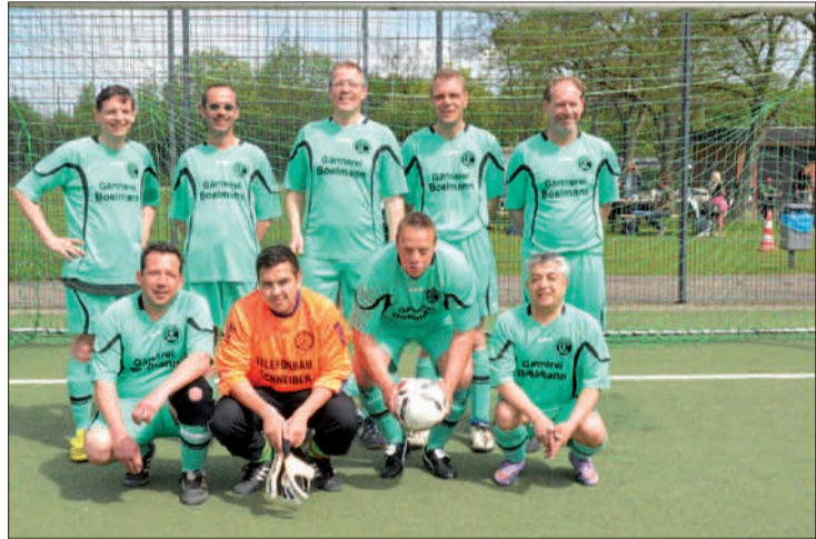
Nach der Vorrunde erkämpften sich die Väter der D3 im Neun-Meter-Schießen den vierten Platz fürs Halbfinale.

Das beste Trikotoutfit wurde mit einem 10-Liter-Fass Bier belohnt und ging an das Väterteam D4/D5. Doch egal, welchen Platz die einzelnen Mannschaften belegten: Beim abschließenden Beisammensein stand die Geselligkeit im Vordergrund. Viele ehrenamtliche Helfer sorgten stets für Nachschub. Den Muskelkater spürten die Männer meist erst später. Glücklicherweise gab es keine schweren Verletzungen – ein Ansporn für andere Vätermannschaften, sich im nächsten Jahr auch zu beteiligen.