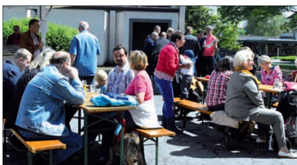
Viele Gäste nutzten das schöne Wetter, um mit den Mandatsträgern ins Gespräch zu kommen.