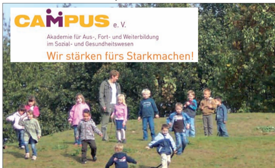
Pädagogische Fachkräfte kümmern sich beim Campus-Ferienprogramm zweisprachig liebevoll um das Wohlergehen der Kinder.

wissenschaftliche Experimente. Die Anmeldungen für die einzelnen Wochenbetreuungen nimmt Nicole Schlangen vom Campus e.V., Zu den Rehwiesen 5 in 47055 Duisburg entgegen. Sie ist unter der Rufnummer 0203/75991520 oder per E-Mail unter info@campus-akademie.org zu erreichen. sam