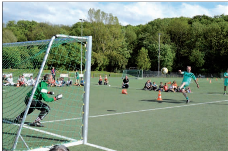
Spannende Neun-Meter-Schießen waren bei den sechs teilnehmenden Teams immer wieder zu sehen.