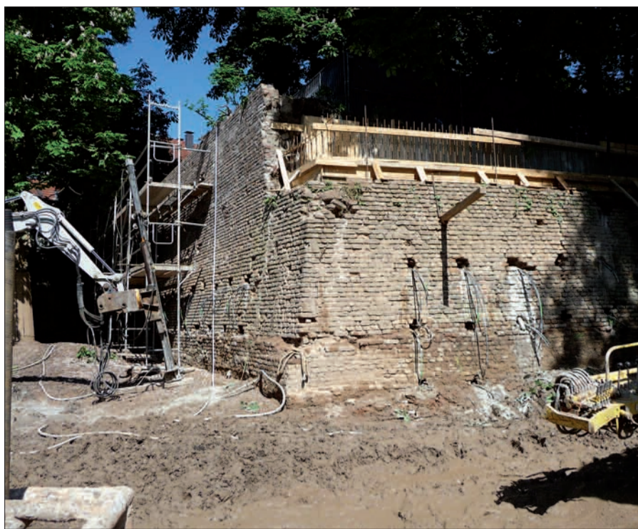
Im Eingemeindungsvertrag 1929 hatte sich die Stadt Düsseldorf verpflichtet, die noch vorhandenen Kaiserswerther Festungsanlagen dauernd zu erhalten. Jetzt hat sie dieser Verpflichtung an der Bastion St. Suitbertus erfreulicherweise und endlich entsprochen. In der Öffentlichkeitsarbeit dazu ist die Verwaltung aber sehr zurückhaltend.

Jahres beantragt. Die Festungsmauer der Bastion St. Suitbertus unterhalb des Schulhofes sollte in voller Breite saniert werden und nicht nur zu zwei Dritteln. Benötigt der Schulhof im restlichen Drittel (versteckt hinter Bäumen, teils in der Mauer, die das Mauerwerk beschädigen) keine verstärkte Stützmauer? Warum wurden die Sanierungsarbeiten mit Erläuterungen der begleitenden Archäologen über das, was vorgefunden und erneuert wurde, nicht der Öffentlichkeit vorgestellt und erläutert? Immerhin werden hier € 1,6 Mio. Steuergelder ausgegeben. Das historische Vorbild sei nicht ausreichend berücksichtigt worden, so der Heimat- und Bürgerverein in seinem Schreiben an die zuständigen Ämter. Nach den dem NORDBOTE vorliegenden Informationen sollen die Arbeiten bis Ende September abgeschlossen werden. H.S.