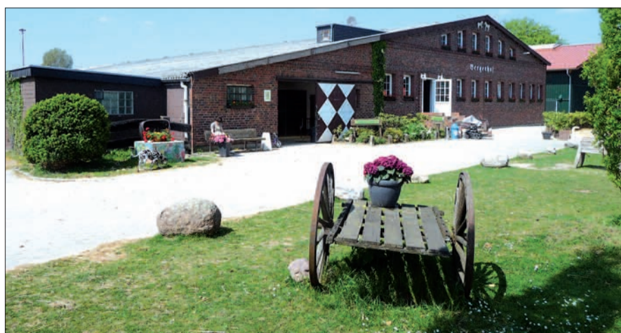
Unabhängig von den ausgezeichneten Reitsportanlagen hat der Berger Hof auch eine idyllische Seite.

te mit Christian Renette sowohl den Stadtsieger als auch die Mannschaftssieger im Ringstechen, die wohl am meisten beachtete Disziplin in diesem Turnier. Aber auch im Springen, in Dressur und in der Führzügelklasse der ganz Kleinen wurde Können und Sportlichkeit bewiesen. Ausrichter des SVR-Reitersportfestes 2014 wird das Amazencorps Flehe sein. H.S.