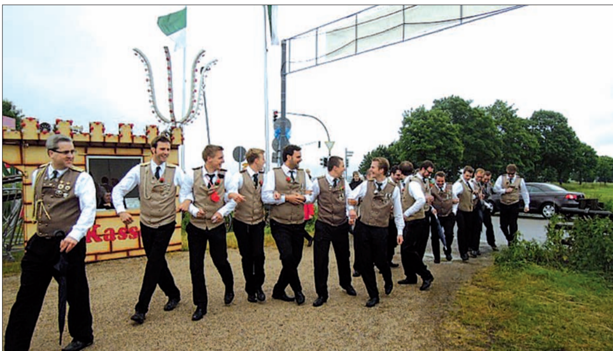
Ein Schnappschuss vom Schützenfest 2012. In Kalkum darf man auch beim Einmarsch auf den Festplatz Spaß haben.

Das Schützen- und Heimatfest in Kalkum ist von Traditionen geprägt. Traditionen sind aber auch im Wandel, heißt es nicht ohne Grund in der Einladung an alle Kalkumer und Gäste. So ist zum Beispiel der Fackelzug zum Kriegerehrenmal mit Ehrung der Toten ein fester unverzichtbarer Programmpunkt zu Beginn des Schützenfestes am Samstagabend. Da zum ansonsten üblichen Zeitpunkt ein wichtiges Fußballspiel stattfindet, wird auf dieses eher „moderne event“ nicht verzichtet, ohne die Tradition zu brechen. Immerhin handelt es sich um das Champions-League-Endspiel Borussia Dortmund gegen Bayern München, das Spiel des Jahres oder gar Jahrzehnts. Der Sternmarsch zum Schloss beginnt deswegen bereits um 17.45 Uhr (Samstag, 25. Mai), und der Fackelzug zum Ehrenmal startet um 18.15 Uhr. Der anschließende Festabend ab 18.45 Uhr im Festzelt schließt das Fußballspiel mit ein, aber auch das Sextett Oliver Bendels und das Tambourcorps „Frisch Auf Kalkum“ werden mit zur Stimmung beitragen. Natürlich wird auch das übrige Programm am Sonntag und Montag