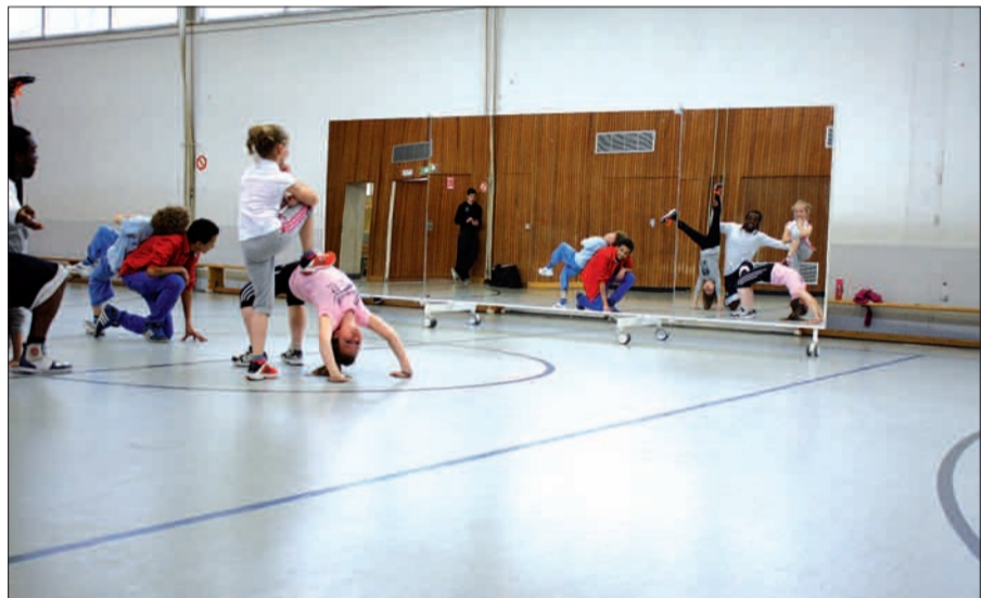
Neu beim TV Kalkum Wittlaer ist auch die mobile Spiegelwand, die gern bei allen Kursen in der Sporthalle der Franz-Vaahsen-Grundschule eingesetzt wird.