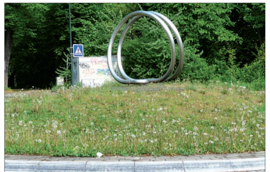
Der von Pusteblumen umkränzte „Doppelloop“ im Verkehrskreisel am Kaiserswerther Stadteingang.