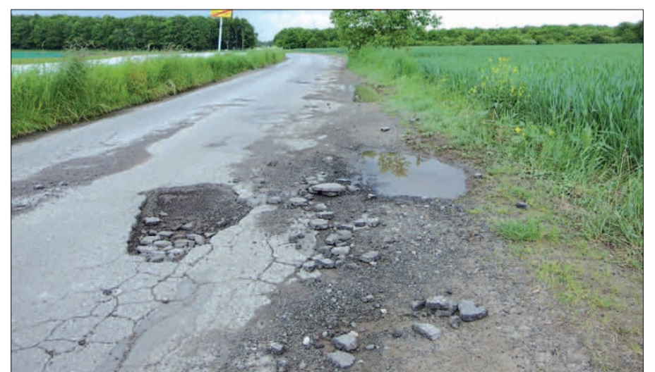
Derzeitiger Zustand der Wittgatt bei Wittlaer-Bockum.