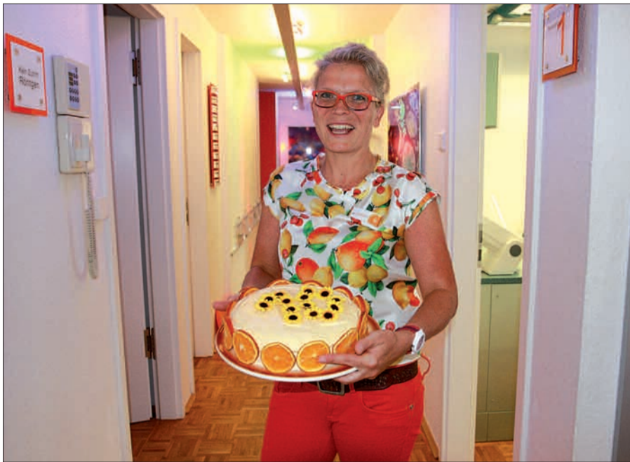
Zum 10-jährigen Praxisjubiläum gab es stيلة eine Torte mit Orangenscheiben und Blüten.

Zum zehnjährigen Praxisjubiläum, das sie mit ihrem Team Anfang Mai feiern konnte, gab es neben Blumen auch eine fruchtige Orangentorte, passend zum Interieur und zur Stimmung. „Mit meinem engagierten siebenköpfigen Team kann ich den großen und kleinen Patienten eine ganze Behandlungspalette anbieten“, fügt sie hinzu. Ein Blick auf die Homepage: Neben Wellness-Angeboten wie Zahnaufhellung und Belagsentfernung gehören schmerzarme Kariesbekämpfung mit Heal-Ozon ebenso hinzu wie die Halitosisprechstunde (Mundgeruch, Ursachen und Behandlung), Laser- und Ozonbehandlung und vieles mehr ( www.zahnarztpraxis-beurich.com ). „Wir arbeiten seit zehn Jahren mit einem exzellenten Labor im Bergischen Land zusammen. Außerdem verfügen wir über beste interdisziplinäre Zusammenarbeit mit Kieferorthopäden und Fachleuten aus der Kieferchirurgie“, erklärt die lebensfrohe Zahnärztin. Gebürtig aus Dresden, war sie zunächst im Bergischen Land tätig und praktiziert nun seit zehn Jahren in der Rosenstadt und lebt mit ihrer Familie im benachbarten Rahm. Als Mutter von zwei Kindern