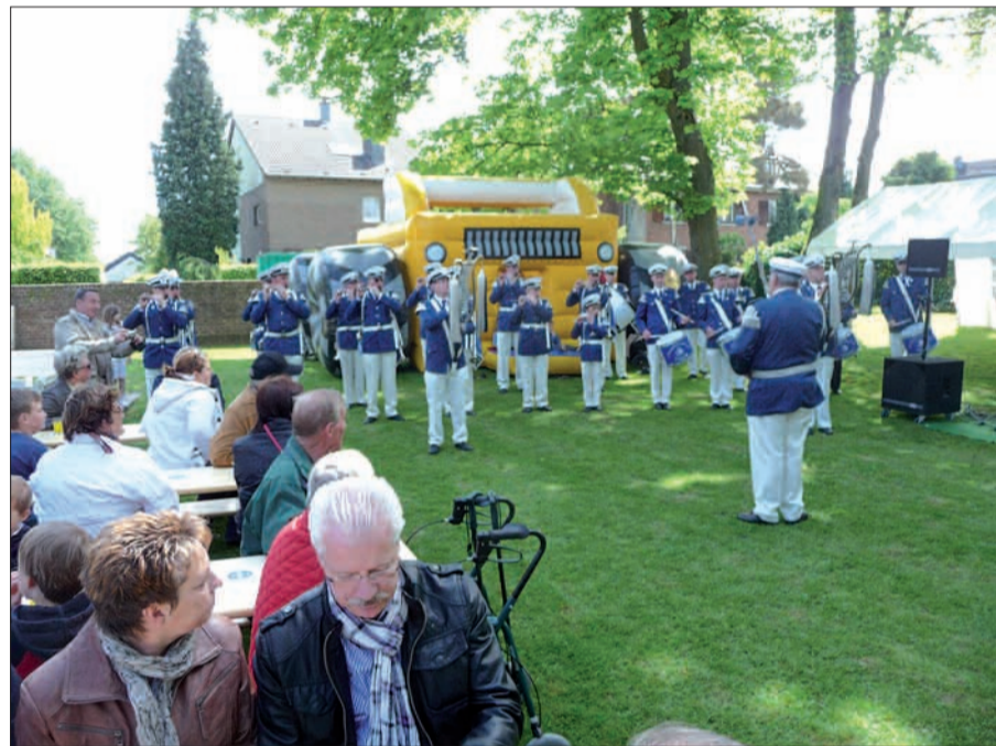
Ziel für den Himmelfahrtsausflug: Das Fest der Goldenen Mösch in Kalkum.