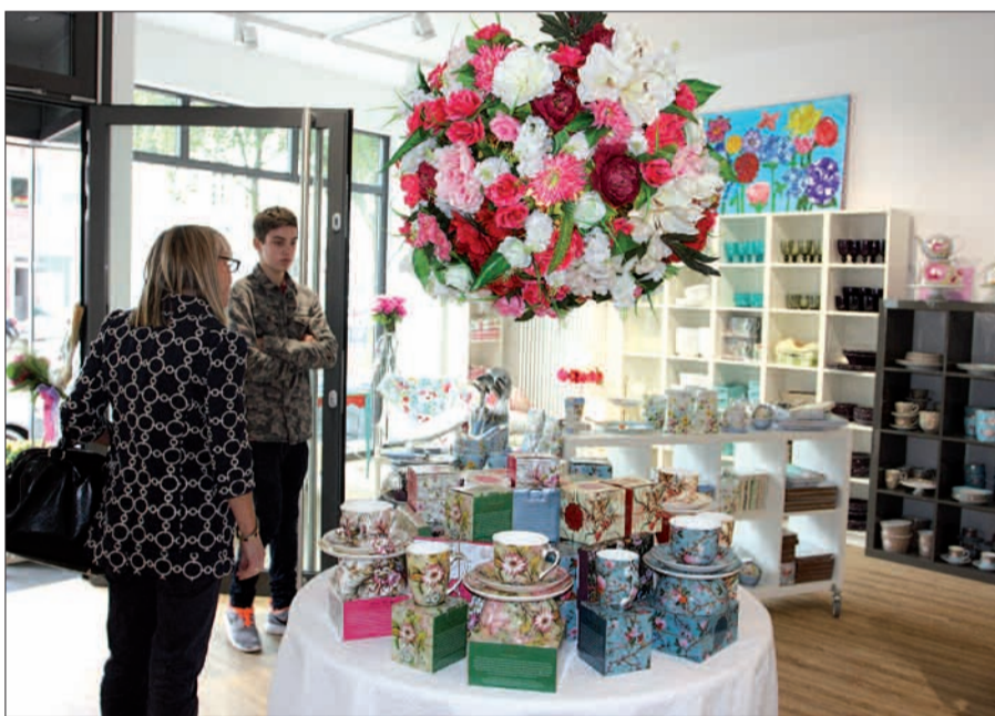
Der Name ist das Motto: Traumhafte Dinge rund um die Tafel gibt es nun am Kaiserswerther Markt.