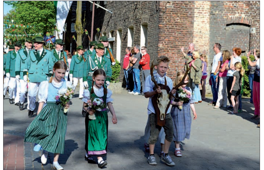
Durch die bunt geschmückten Sermer Straßen werden die Schützenbrüder auch in diesem Jahr wieder ziehen.

Ab 14 Uhr wird „Mc Wib“ ein Kinderzauberprogramm für alle Mädchen und Jun-