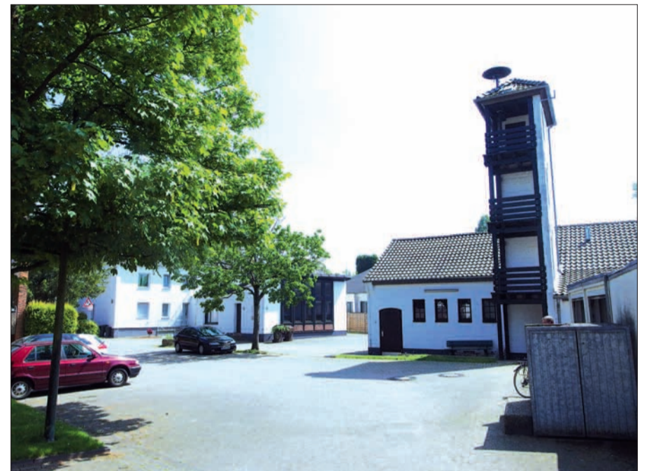
Die Kalkumer Freiwillige Feuerwehr gehört ins Dorf wie der Verbandkasten in Küchenschrank und Kofferraum.

Feuermelder-beratung und Erläuterungen zur oft lebensrettenden „Rescue-Card“ im Auto ist keine Voranmeldung erforderlich. Natürlich gibt es auch sonst alle Informationen rund um die Feuerwehr (retten, löschen, helfen, bergen), auch wie man selbst eine(r) der dringend benötigten freiwilligen Feuerwehrmänner/frauen werden kann. H.S.