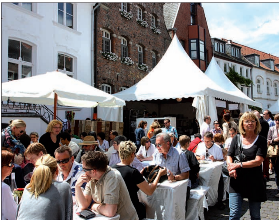
Eingebettet in historische Fassaden ist der Gaumenschmaus rund um den Kaiserswerther Markt jedes Jahr wieder ein Fest.

Veranstalter konnte Winzer nen, die passenden Tropfen zu den Speisen zu kreden- oder aus Südafrika gewinnen. Mehr dazu in Ausgabe 10. G.S.