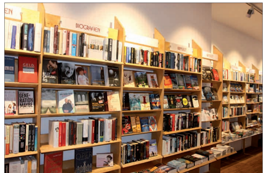
Das Sortiment in der neuen Lesezeit am Kaiserswerther Markt ist geblieben, die Vielfalt in der Tiefe gestiegen.

nende Neuheiten. Das sind zuallererst die Veranstaltungen, die nun endlich Raum für mehr als 25 Teilnehmer finden. Das Sommerprogramm für Juni bis einschließlich August steht längst fest. Es beginnt am 4. Juni mit Literarischen Landschaften Brasiliens, bietet zahlreiche Lesungen für