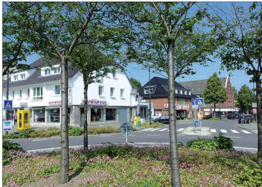
Zwischen einem der größten Flughäfen und einem der größten und modernsten Messegelände in Deutschland ist Lohausen idyllisch und lebenswert geblieben, in Einwohnerzahl und Infrastruktur gestärkt.

Es gibt keinen Anlass anzunehmen oder zu befürchten, dass sich an dieser Entwicklung in Lohausen etwas ändert, auch wenn sich der Flughafen und der Luftverkehr parallel dazu, durch eine geänderte Betriebsgenehmigung mit flexiblerer Nutzung der beiden Start- und Landebahnen, ebenfalls positiv entwickelt. H.S.