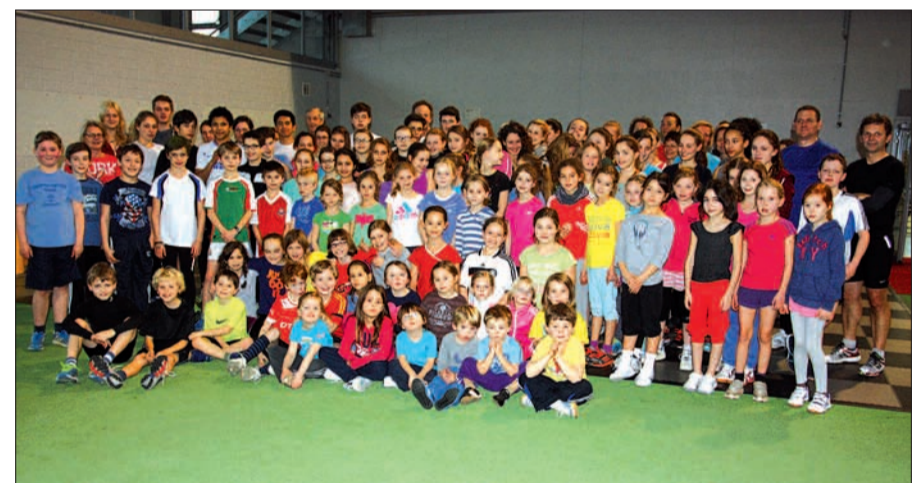
Ein starkes Bild gibt die Leichtathletikabteilung des TVA, hier bei einer Trainingseinheit in der Espritarena in Stockum