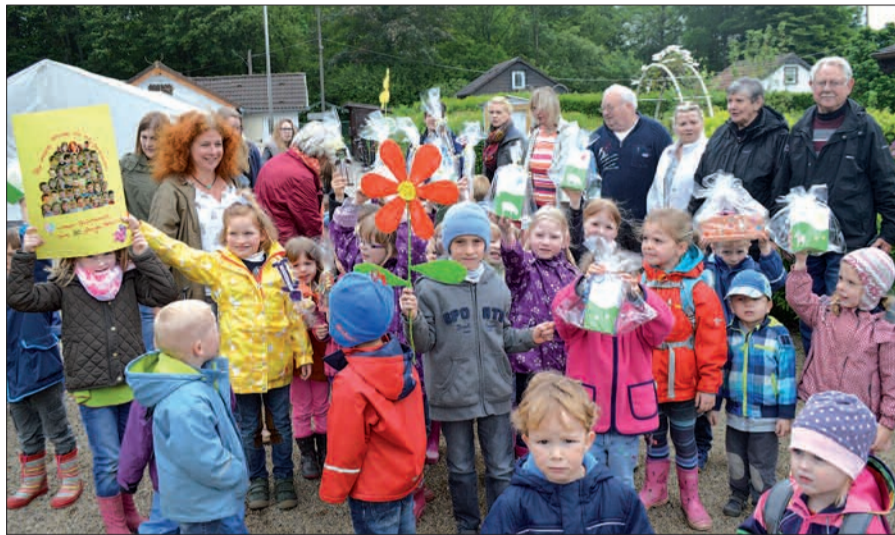
Die Mädchen und Jungen der Kindertagesstätte „Unter dem Regenbogen“ hatten zum Geburtstag der Kleingärtner viele Geschenke mitgebracht.

litik einen Blick in die Vereinsgeschichte: Die Kleingärten wurden 1994 auf der ehemaligen Mülldeponie angelegt. Es entstanden 42 Lauben auf 16.000 Quadratmeter Boden. Nicht nur das Grün wuchs im Laufe der Zeit, sondern auch die Vereinsgemeinschaft. „Es entstand eine Oase am Rande der Großstadt, umgeben von Schwerindustrie, aber auch umgeben von einem Grüngürtel.“ Um Akzeptanz und Wiedererkennungswert der Kleingartenanlagen in der Bevölkerung zu erreichen, müssen „wir mit offenen und gepflegten Grünanlagen sowie einer offenen Kultur aufwarten. Das Verschließen und Verstecken hinter hohen Hecken hält nicht nur Erholungssuchende und auch mögliche Bewerber ab, unsere Anlage zu besuchen.“ Das Motto laute: „Duisburg, deine Kleingärten blühen auf.“ Der Vorsitzende unterstrich: „Die Kleingärten und insbesondere deren Pächter leisten einen wichtigen städtebaulichen, ökologischen und sozialen Beitrag zur Gestaltung der Städte und Gemeinden.“ Für ihre 30-jährige Mitgliedschaft im Kleingartenverein „Am Heidberg“ wurden Hildegard Schneider, Klaus Koths, Klaus Hohn, Rita Hausmann und Günter Schröttke geehrt. Alle waren oder sind noch ehrenamtlich tätig.