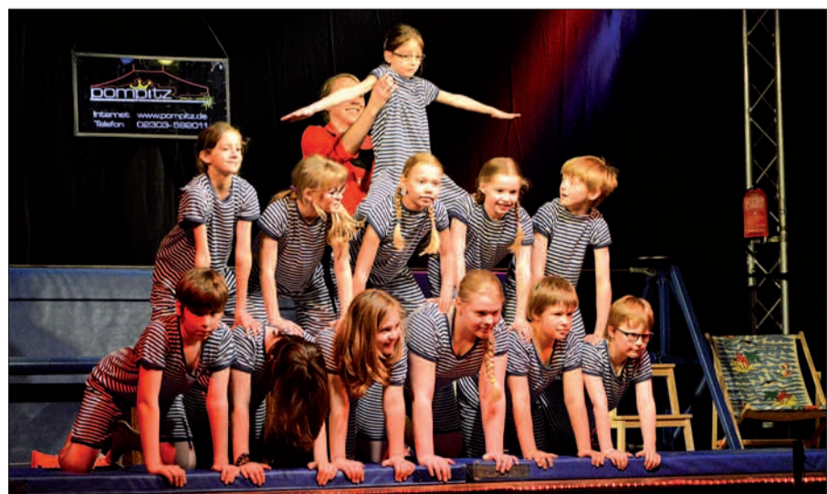
Einen ungewöhnlichen Stundenplan hatten die Rahmer Jungen und Mädchen mit „Zirkus Pompitz“. Stolz präsentierten sie ihren Zuschauern die tollen Ergebnisse.