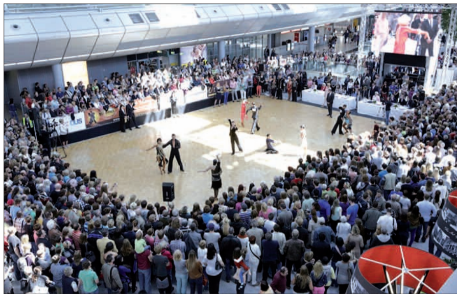
Tanzparkett auf der Abflugebene im Terminal.