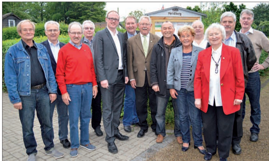
Vertreter aus Politik und vom Verband der Kleingärtner gratulierten den geehrten Mitgliedern in Ungelsheim Am Heidberg. sam