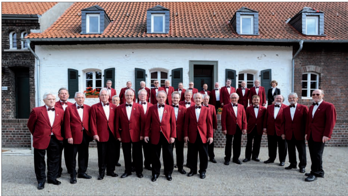
Der Jubiläumschor "MGV Erholung 1866 DU- Huckingen e.V." vor seinem Herbstkonzert Anno 2010 im Steinhof.