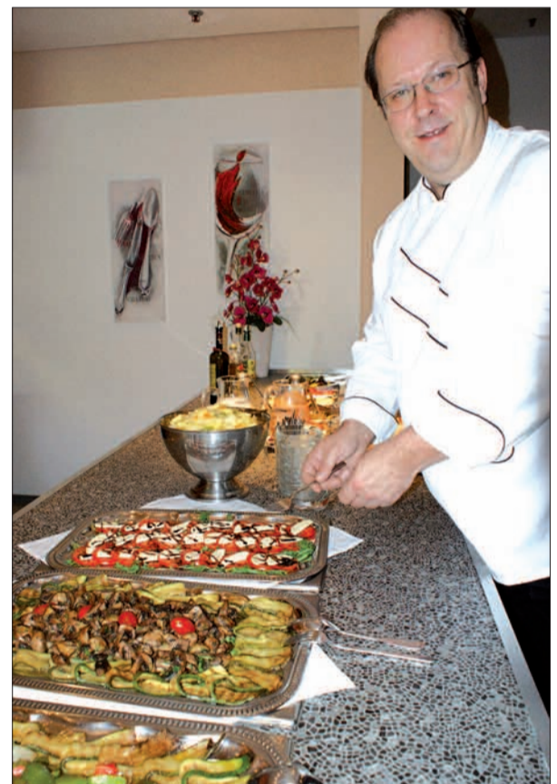
Ein Mittagsbuffet steht für die eiligen Gäste bereit. Ein Gericht ist stets auch vegetarisch.

an der Bar. Auf der insgesamt 900 Quadratmeter großen Fläche befinden sich unter anderem Kegelbahnen sowie verschiedene Säle. So können hier Gruppen von zehn bis 60 Personen ebenso gut bewirtet werden wie 150 Personen. Ab Ende Mai kann man sich bei schönem Wetter sogar auf der Terrasse niederlassen. Geöffnet ist „Franky's Club Restaurant“ von 11.30 bis 15 Uhr sowie von 18 Uhr an. Samstags, sonntags sowie feiertags sind die Türen ab 17.30 Uhr geöffnet. Wer möchte, kann sich die Speisekarte per E-Mail zusenden lassen. Zu erreichen ist „Franky“ unter der Rufnummer 0203/2890 1371. sam