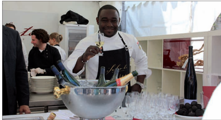
Auch dieses Jahr ist der TV Koch Nelson Müller wieder mit dabei.