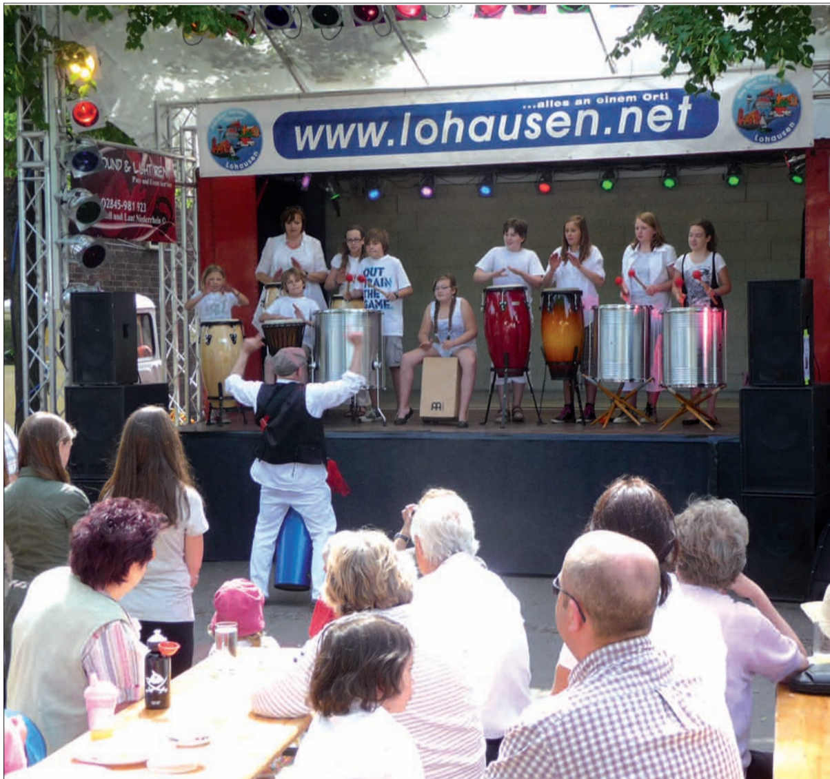
Die Trommler der Samba-Arbeitsgemeinschaft des Max-Planck-Gymnasiums begeisterte die Zuschauer.