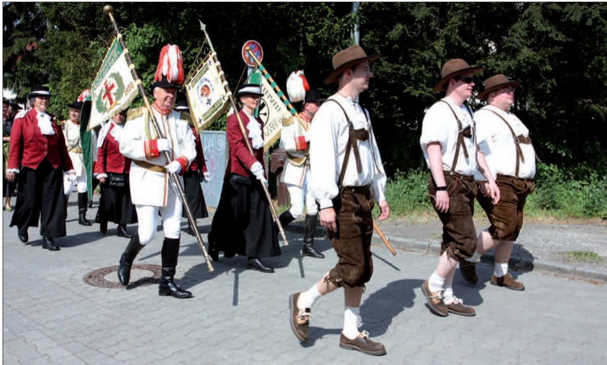
Das Reitercorps beim Einzug in die Halle.

Langsam kommen die Feierlichkeiten rund um das Jubiläumsjahr – 500 Jahre St. Sebastianus Bruderschaft Angermund 1511 e.V. – in Fahrt. Vor wenigen Tagen erst die festliche Matinee, wenige Tage später die Eröffnung einer Ausstellung mit zum Teil antiken Schätzen der Bruderschaft, die leider nur bis heute in der Filiale der Stadtsparkasse Angermund zu sehen waren.