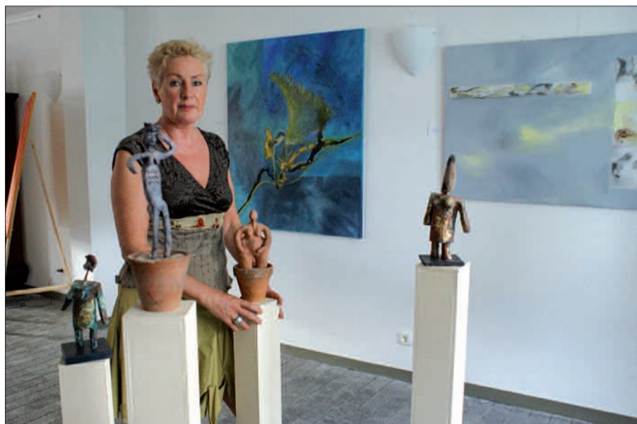
Noch bis zum 2. Juni sind die Arbeiten unter dem Titel „Werkstoffe – Bilder und Objekte 2005 bis 2010“ im Turmzimmer und Raum Kreifeltshof im Steinhof in Huckingen zu sehen.