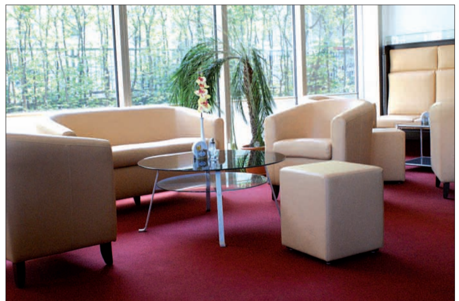
Gemütliche Sitzcken laden im Loungebereich dazu ein, auch einfach mal ein gutes Glas Wein, ein leckeres Bier oder eine Kaffeespezialität zu genießen.

an der Bar. Auf der insgesamt 900 Quadratmeter großen Fläche befinden sich unter anderem Kegelbahnen sowie verschiedene Säle. So können hier Gruppen von zehn bis 60 Personen ebenso gut bewirtet werden wie 150 Personen. Ab Ende Mai kann man sich bei schönem Wetter sogar auf der Terrasse niederlassen. Geöffnet ist „Franky's Club Restaurant“ von 11.30 bis 15 Uhr sowie von 18 Uhr an. Samstags, sonntags sowie feiertags sind die Türen ab 17.30 Uhr geöffnet. Wer möchte, kann sich die Speisekarte per E-Mail zusenden lassen. Zu erreichen ist „Franky“ unter der Rufnummer 0203/2890 1371. sam