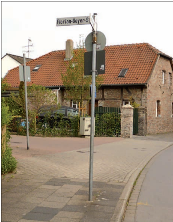
Sie gibt es schon lange die Florian Geyer Str., ehemals Mittelstraße. Hier an der Einmündung in die Raiffeisenstraße.

herrschte geistliche Obrigkeit, sondern auch gegen die weltliche Ordnung. Thomas Müntzer stand im Gegensatz zu Luther für die gewaltsame Befreiung der Bauern und betätigte sich als Pfarrer in der Marienkirche, in dem Thüringer Ort Mühlhausen, als Politischer Aufklärer und Förderer zur Umsetzung einer gerechten Gesellschaftsordnung. Wegen seiner radikalen, sozialrevolutionären Bestrebungen, die sich in Müntzers vielen kämpferischen Texten und Predigten niederschlugen, distanzierte sich Luther zu Beginn des Bauernkrieges von ihm. Im Gegensatz zu Luther war Müntzer für eine gewaltsame Befreiung der Bauern. Er versuchte, seine Vorstellungen von einer gerechten Gesellschaftsordnung umzusetzen. Privilegien wurden von ihm aufgehoben, Klöster aufgelöst, Räume für Obdachlose geschaffen und eine Armenspeisung eingerichtet. Doch seine Bestrebungen, verschiedene Thüringer Bauernschaften zu vereinigen, scheiterten. Im Mai Anno 1525 wurde er schließlich gefangengenommen, gefoltert und hingerichtet.