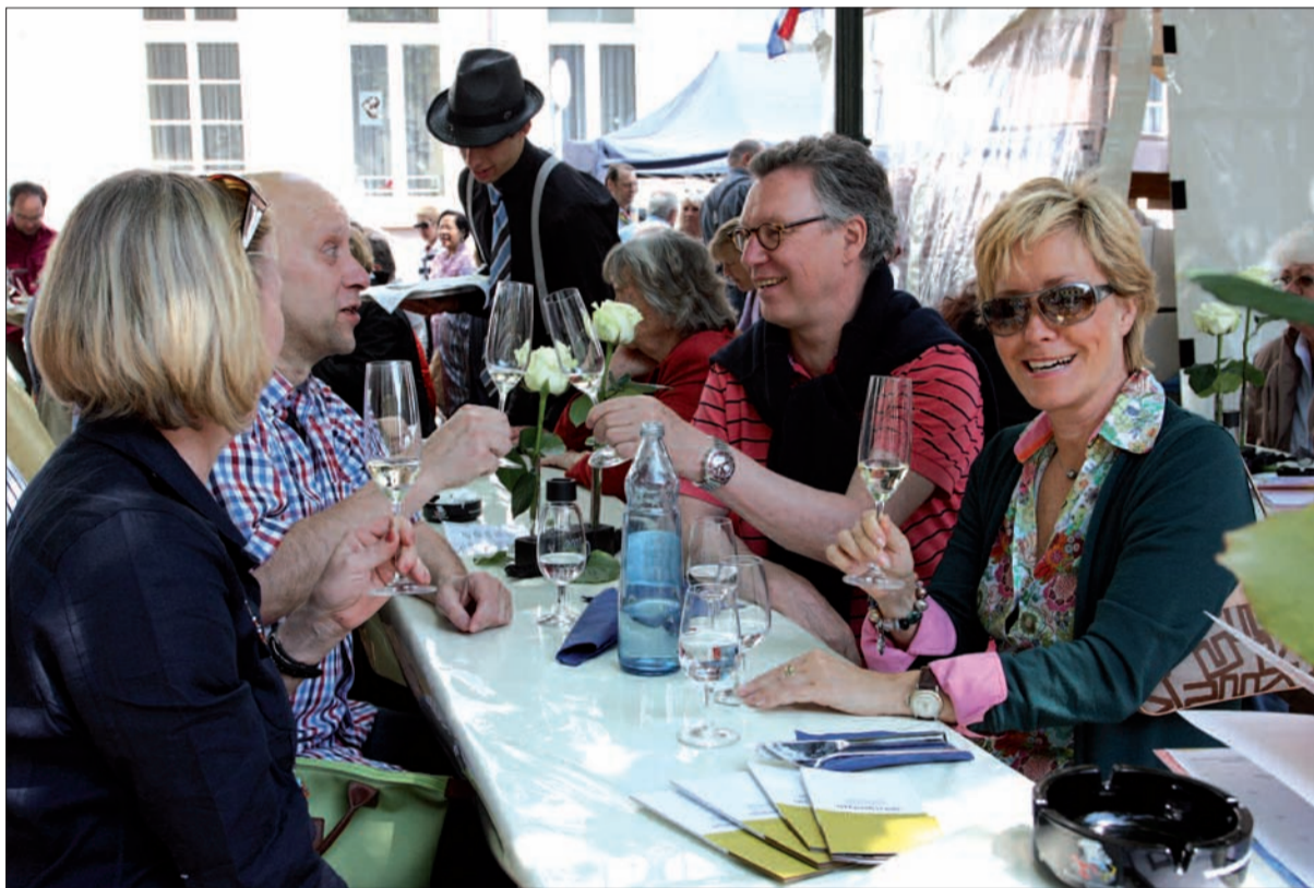
Schlemmen der Extraklasse auf dem Kaiserswerther Markt

nicht, denn es gibt allerhand Neues auf dem diesjährigen Weinblütenfest. Das Monkey's West aus Düsseldorf präsentiert neben seinen Köstlichkeiten aus der Küche Delikatessen in einem Extra Zelt, die zu Hause leicht nachgekocht werden können. Das exzellente Olivenöl aus dem Hause Jordan wird ebenso verkauft wie der Kräuterlikör von Brand Support, die hier erstmalig einen neuen Weinblütenlikör anbieten. Stilecht zubereitete Cocktails, ob gerührt oder geschüttelt, wird der Barkeeper vom Tulip Inn Arenaho-