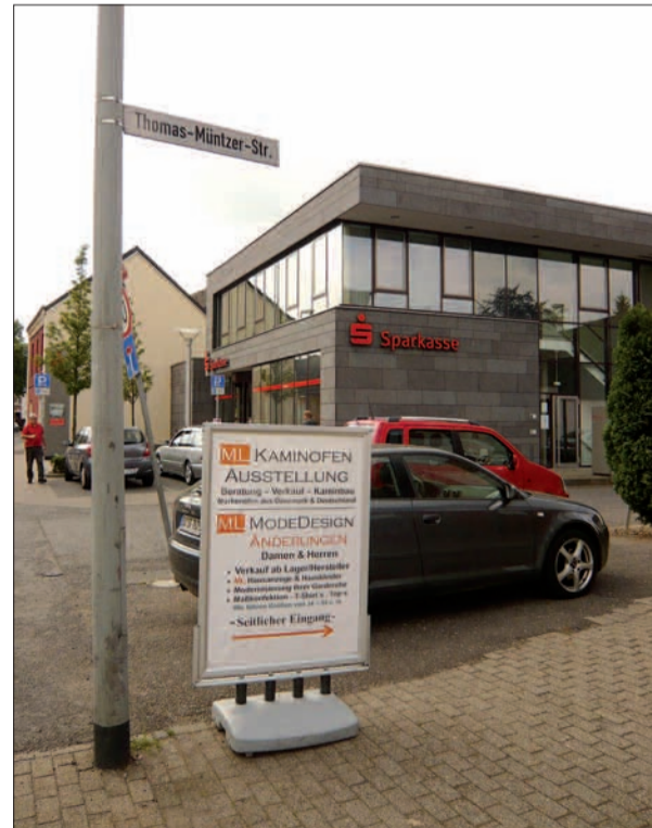
Mit der Thomas-Müntzer-Str. will man nun in Huckingen an den zweiten großen Bauernführer erinnern.