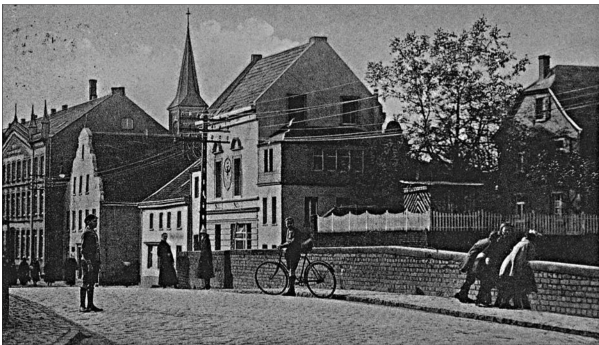
Vom ländlich-kleinstädtischen Charakter hat Kaiserswerth viel verloren, aber Straßenzüge und Topografie sind weitgehend wie im Mittelalter geblieben. Hier ein Blick von der Klemensbrücke auf das bis 1890 genutzte Kaiserswerther Rathaus. Diese Ansichtskarte stammt aus den 30er Jahren des vergangenen Jahrhunderts.