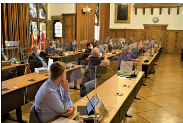
Die Bezirksvertreter Süd tagten im großen Ratssaal – mit Maske und hinter Plexiglasscheiben. Die ursprünglich für den 29. April geplante Sitzung wurde wegen der hohen Corona-Fallzahlen abgesagt.