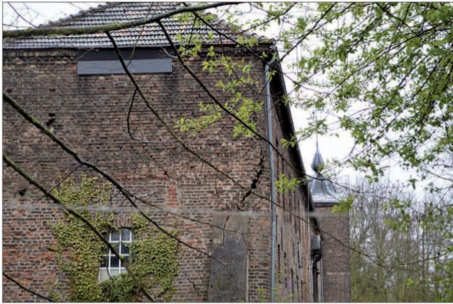
Tiefe Risse im Mauerwerk von Gut Böckum sind gut zu erkennen. Wie und wann geht es weiter? Leider hat sich der neue Eigentümer auf Nachfrage nicht geäußert.

Aus Sicht der Unteren Wasserbehörde könne die Bau-