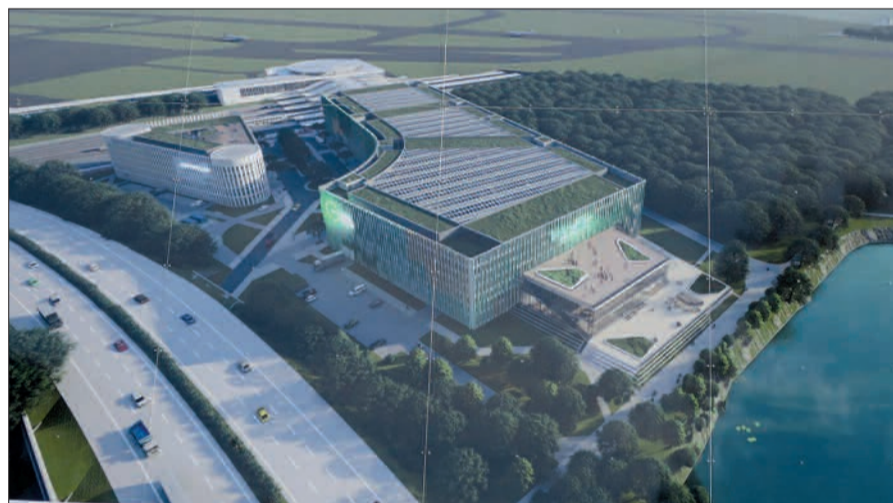
Das Bauschild für den Innovationscampus am Kalkumer Forst steht schon seit Ende vergangenen Jahres.

Während um das Baugebiet Airport-City-West noch um den Erhalt von einem Waldstreifen gerungen wird, ist am östlichen Ende des Flughafengeländes schon im vergangenen Jahr eine große Fläche, direkt am Kalkumer Forst, von allem Bewuchs geräumt worden. Über Einwände und Proteste ist nichts bekannt geworden. Das Bauschild ist aufgestellt (siehe unser Foto) und die Baugenehmigung erteilt. Ein „Innovationscampus und Reallabor“ soll hier entstehen, ein „Schau-fenster der Energie- und Mobilitätswende“. Im Endausbau reicht der riesige Komplex vom Fernbahnhof bis zum Tiefenbroicher Bag-gensee. Geworben wird mit ICE-, Regio- und S-Bahn-Anschluss, Sky-Train zum