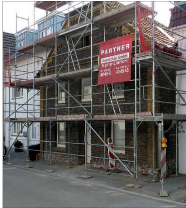
Derzeitiger Stand der Restaurierung des Hauses vom verstorbenen „Jyppi“ Perpeet an der Graf-Engelbert-Straße (Vorder- und Rückseite).