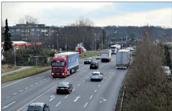
Der Knotenpunkt an der B 288/Uerdinger Straße sorgt oft für lange Staus und großen Ärger. Auf den frühzeitigen Bau einer Umgehungsstraße - den Mannesmann-Acker - hatten viele gehofft. Doch dieser kann laut Autobahn.GmbH erst nach Fertigstellung der A 524 in Mündelheim erfolgen.

Schlechte Nachrichten gibt es für alle, die auf einen schnellen Bau des Mannesmann-Ackers warten: In der jüngsten Sitzung der Bezirksvertretung Süd erklärte Helmut Mahrt, dass diese lang ersehnte Straße wohl erst im Anschluss an den vierstreifigen Ausbau der B 288 verwirklicht werde.