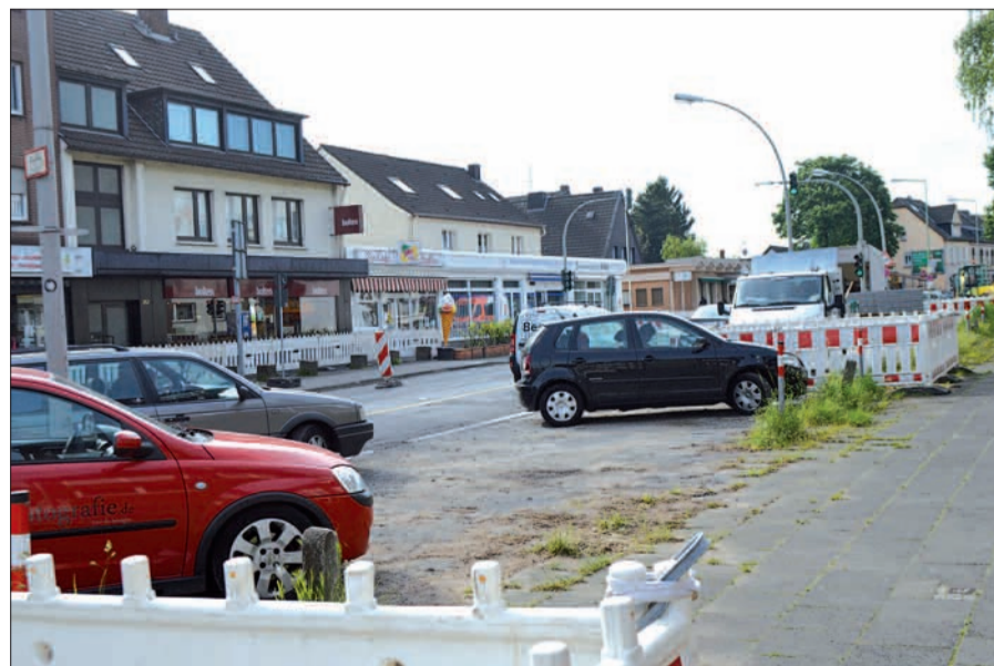
Um ein geordnetes Parken zu ermöglichen und damit den Ortseingang von Huckingen zu verschönern, soll auch diese Fläche nach dem Willen der Bezirksvertreter befestigt werden.

bleiben. Die Fläche bietet sich hervorragend für die Anlage von Stellplätzen an.“ Nach Schätzung der beauftragten Baufirma würden für einen zeitgemäßen Ausbau zusätzlich Kosten in Höhe von etwa 37.000 Euro entstehen, die durch Umschichtungen im Haushalt finanziert werden sollten.