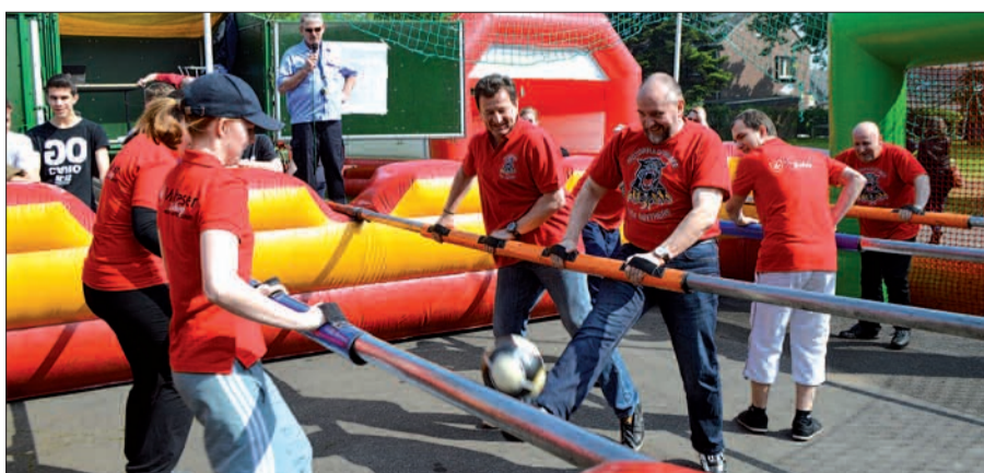
16 Mannschaften rangen beim Menschenkicker-Turnier um den Titel – wie hier die Mündelheimer Motorradfans gegen die Malteser-Ehrenamtler, die erstmals in Mündelheim dabei waren.