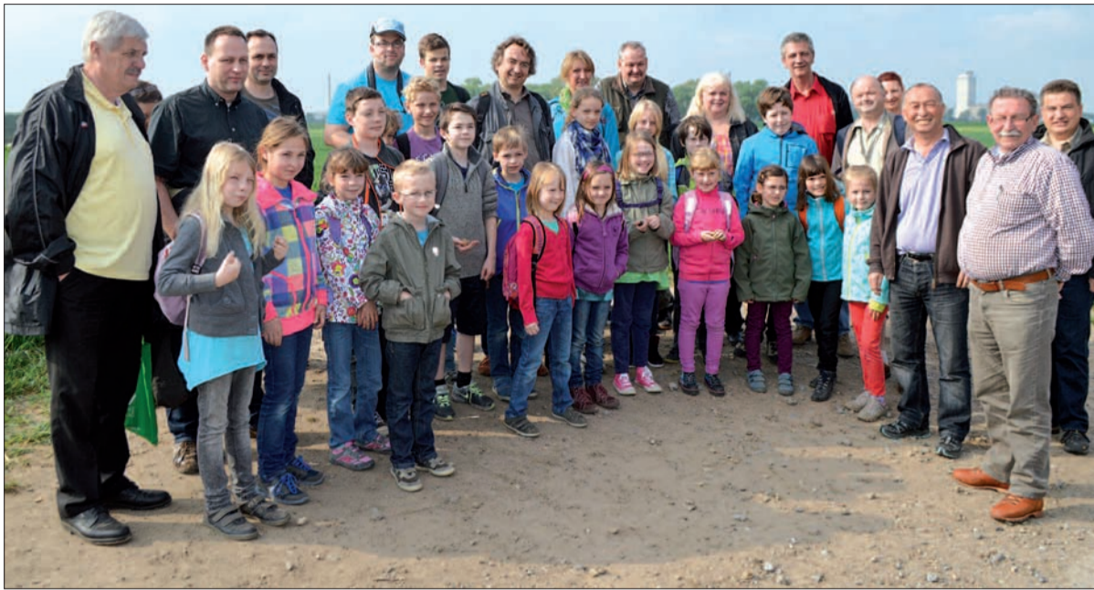
In einer großen Gruppe brachen Kinder, Eltern und Großeltern zu einer Schatzsuche vom Ellerhof aus Richtung Rhein auf.

Immer wieder umringten die jungen Schatzsucher, die teilweise mit ihren Eltern oder Großeltern unterwegs waren, den Mündelheimer Mineraliensammler und wollten wissen, was sie gerade in den Händen hielten. Bereitwillig und geduldig gab Hiermann Auskunft. Zur Stärkung zwischen-