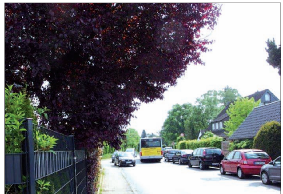
Es ist eng geworden auf der Zeppenheimer Straße.

erhoben werden. An die Einrichtung von Quartiersparkplätzen und/oder Bewohnerparkplätzen sei nicht gedacht. Gibt es bessere Lösungen, oder muss erst ein Unfall passieren? H.S.