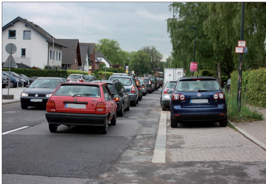
Zur Zeit lassen sich Staus leider nicht vermeiden.

Radwegerampen angelegt und Querungshilfen für Fußgänger eingebaut. Nun ist endlich der Fahrbahnbelag an der Reihe. Mitte Juni sollen die Arbeiten abgeschlossen sein. G.S.