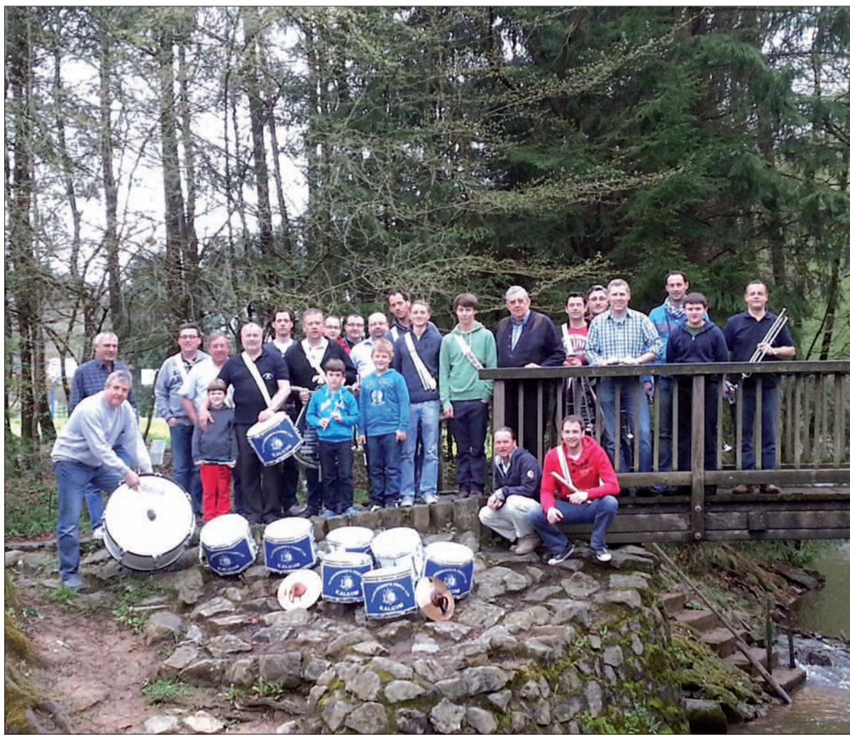
Das Tambourcorps „Frisch Auf Kalkum“ bei seiner diesjährigen Klausur in Asbach/Westerwald.

Musikausbildung und die Einkleidung übernimmt der Verein. Frisch auf! H.S.