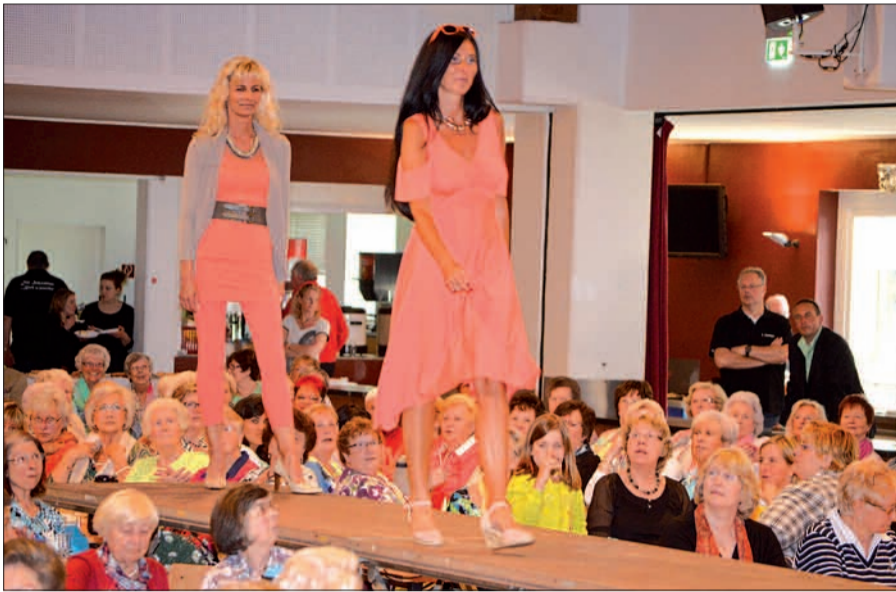
Amateurmannequins stellten den mehr als 300 Gästen im Huckinger Steinhof sommerliche Kombinationen vor.