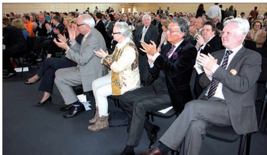
Die Reden kamen gut beim Publikum an, etwa 500 Gäste applaudierten begeistert.

Der Wahlkampf vor den Kommunal- und Europawahlen am 25. Mai ist eröffnet. Und gleich in eine heiße Phase eingetreten. Etwa 500 Menschen sind am 3. Mai um 11 Uhr vormittags der Einladung der CDU Düsseldorf in die moderne Aula und Sporthalle der International School Düsseldorf (ISD) gefolgt. Der Zeitpunkt war geschickt, als Eröffnungsveranstaltung und gleichzeitig Jahresempfang mit eloquenten Rednern gut gewählt. Denn um gleich vorneweg Konrad Adenauer zu zitieren: „Wahlkampf macht Spaß, man muss nur gewinnen“.