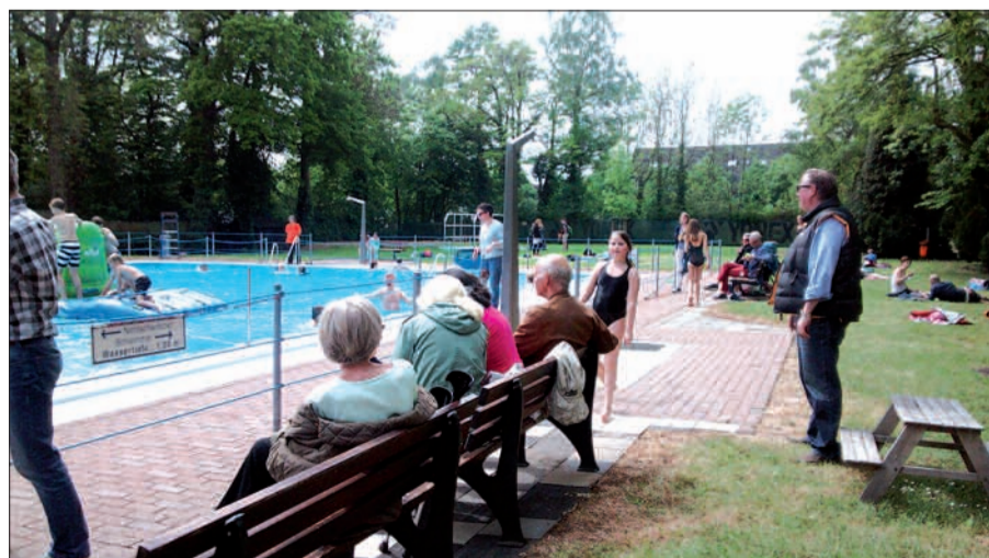
So ist das beim Anschwimmen in Kaiserswerth: Die Kinder toben im Wasser und die Erwachsenen sehen erst noch zu. Obwohl das Wasser mit 26° lockte und die Witterung gnädig war, ist der Nachwuchs schneller.

Lauf der Jahrzehnte hier ihre ersten Schwimmabzeichen erworben haben. Aber das ist wohl eher eine Aufgabe für die dunkle Jahreszeit. Freibad Kaiserswerth, Kreuzbergstr. 33, Kaiserswerth, Tel. 0211/40 89 668, www.flossen-weg.de G.S.