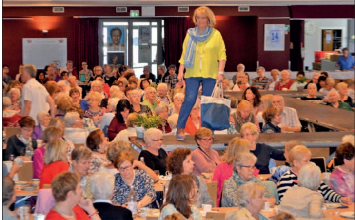
Ein fester Bestandteil im Terminkalender der Huckinger ist der Nachmittag des 30. Aprils: Dann trifft man sich zur Modenschau im Steinhof.

Ein fester Bestandteil im Terminkalender der Huckinger ist der Nachmittag des 30. Aprils: Dann trifft man sich zur Modenschau im Steinhof.