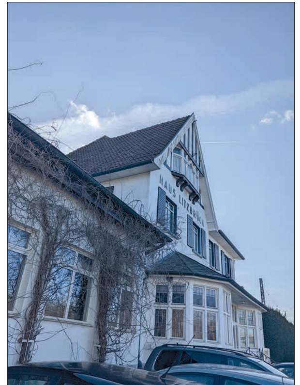
Im Dornröschenschlaf ist das Haus Litzbrück schon seit über zwei Jahren. Bleibt abzuwarten, was der neue Eigentümer damit vor hat.