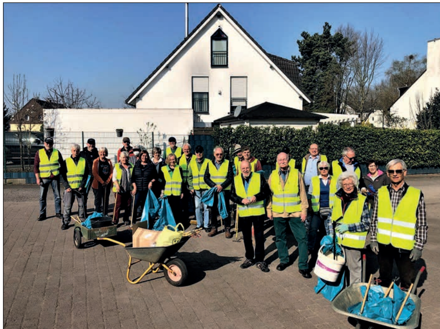
Hoffentlich bleibt Huckingen lange so sauber, wie es jetzt gerade ist – mehr als 30 Personen haben Ende März beim Putztag des Bürgervereins Huckingen mitgeholfen, den Ort von Unrat zu befreien.