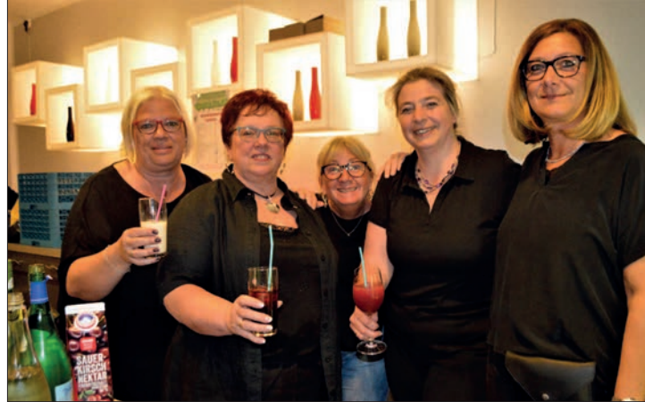
Viele fleißige Helfer werden die Huckinger Schützenbruderschaft unterstützen, um nach zweijähriger Pause wieder den „Tanz in den Mai“ starten zu können.