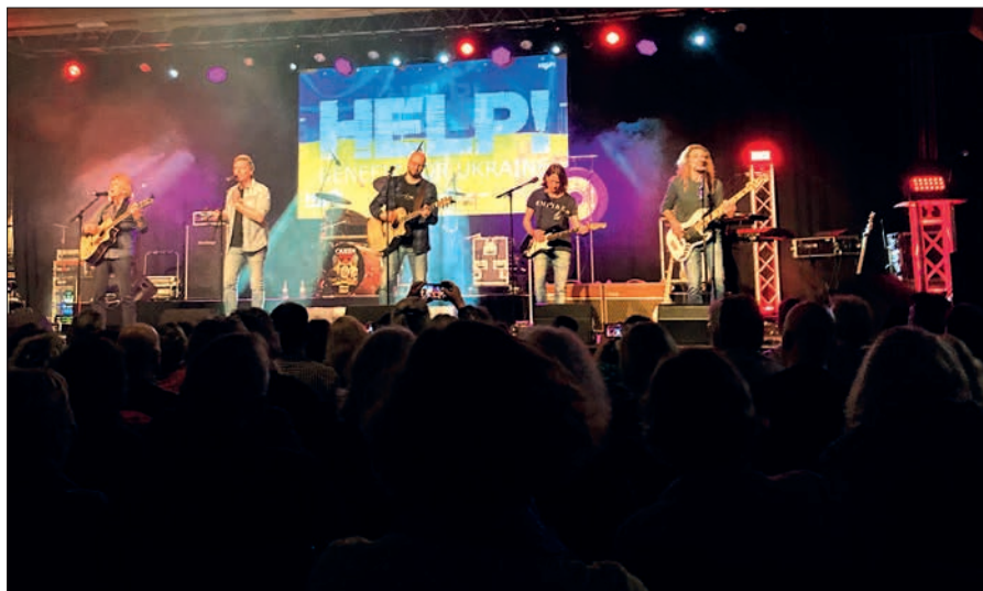
Geballte Band-Power erlebten jetzt die Gäste im Huckinger Steinhof, wie hier die Bläck Fööss aus Köln. Es war eine tolle Aktion zugunsten der Menschen aus der Ukraine. Die Farben Gelb/Blau spielten an diesem Abend eine wesentliche Rolle.