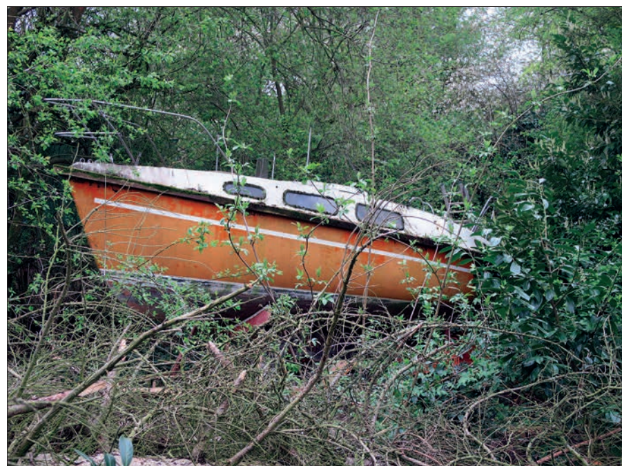
Ein Segelschiff im ehemaligen Kittelbachtal am Ritterskamp.