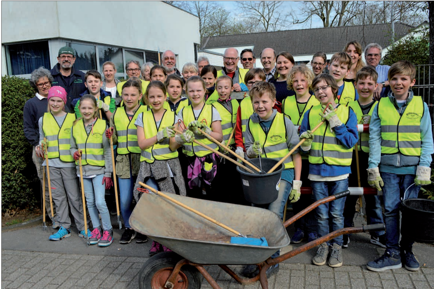
Die Viertklässler zogen mit einigen Eltern und Mitgliedern des Bürgervereins durch Serm, um den Ort vom Müll zu befreien.

Jungen hat sich die Aufräumaktion beim „Dreck-Weg-Tag“ gelohnt: Sie wurden danach mit Süßigkeiten vom Bürgerverein belohnt. sam