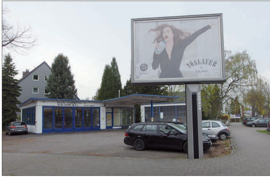
Mit einem 18-Familienhaus an dieser Stelle Niederrheinstraße /Ecke Lantzallee verschönert sich zwar das Stadtbild ganz erheblich, ob aber eine Neubebauung für Wohnzwecke hier angebracht ist, sei dahingestellt.

aufgrund einfacher Bebauungsplänen aus den Jahren 1951 und 2012, die u. a. eine Baufluchtlinie festlegen. Diesen Bauantrag kann somit die Baubehörde nicht ablehnen, nur entsprechenden passiven Lärmschutz zur Auflage machen. Es dürfte aber die Frage berechtigt sein, ob an dieser lärmbelasteten Stelle, in deren Umfeld sich mehr und mehr Gewerbe ansiedelt, eine Verdichtung der Wohnbebauung sinnvoll ist. H.S.