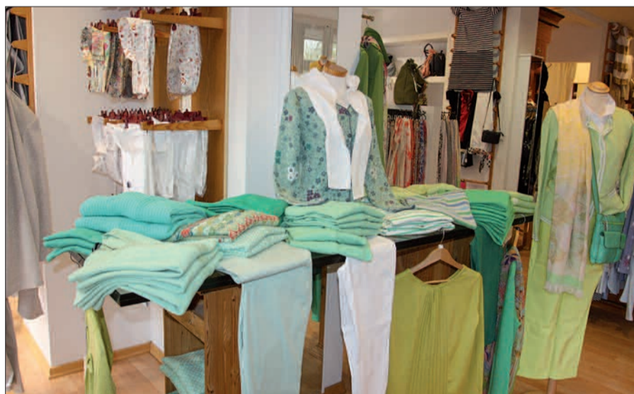
Herrliche Kollektionen gibt es hier, die Lust auf Frühling und mehr machen.

damit ihre Pinnwand dekoriert. Zum Einjährigen Bestehen gewährt sie am 2. Mai 10 Prozent Rabatt auf alles, außer auf reduzierte Waren. „Ich freue mich auf