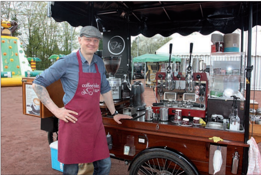
Schönes 3-Tage-Festival in Wittlaer. Der mobile Kaffeewagen war ein Highlight.