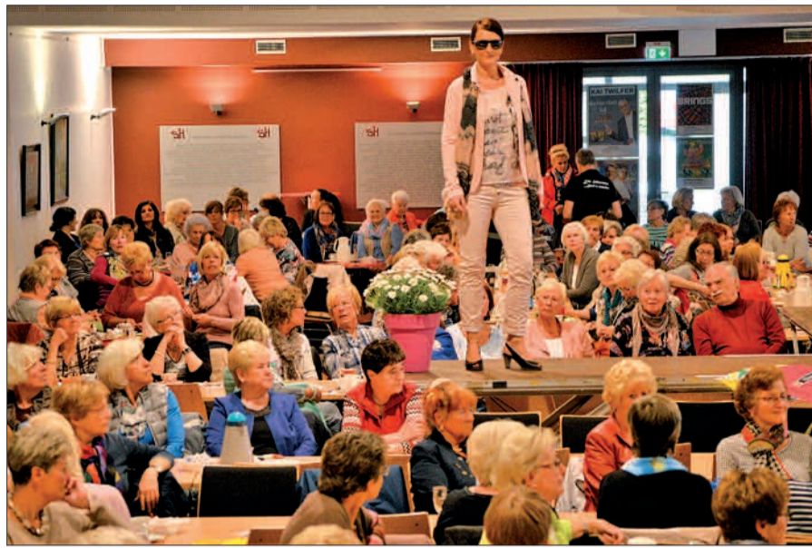
Unterstützt durch örtliche Unternehmen präsentieren die Huckinger Schützen seit vielen Jahren eine Modenschau mit aktuellen Trends – so auch wieder am 30. April.

florale Ideen präsentiert. Der Außenbereich ist von 18 Uhr an geöffnet. Ab 19 Uhr startet dann der „Tanz in Mai“. DJ Tümmel & friends sind für die Tanzveranstaltung gerüstet – „Hier legt der Präsident noch selbst auf“. Der Eintritt beträgt an der Abendkasse 12 Euro. Die Schützen empfehlen, sich im Vorverkauf Karten zu 10 Euro (zzgl. Vorverkaufsgebühr) zu sichern: entweder bei der Ticket-Hotline des Steinhofs unter 0203/72999986 oder bei EURONICS Haas Mündelheimer Str. 11 in 47259 Duisburg. Der Einlass ist ab 18 Jahre möglich, es erfolgt eine Ausweiskontrolle. Die Veranstaltungen finden wieder im Kultur- und Bürgerzentrum Steinhof, Düsseldorf Landstraße 347, 47259 Duisburg statt. sam