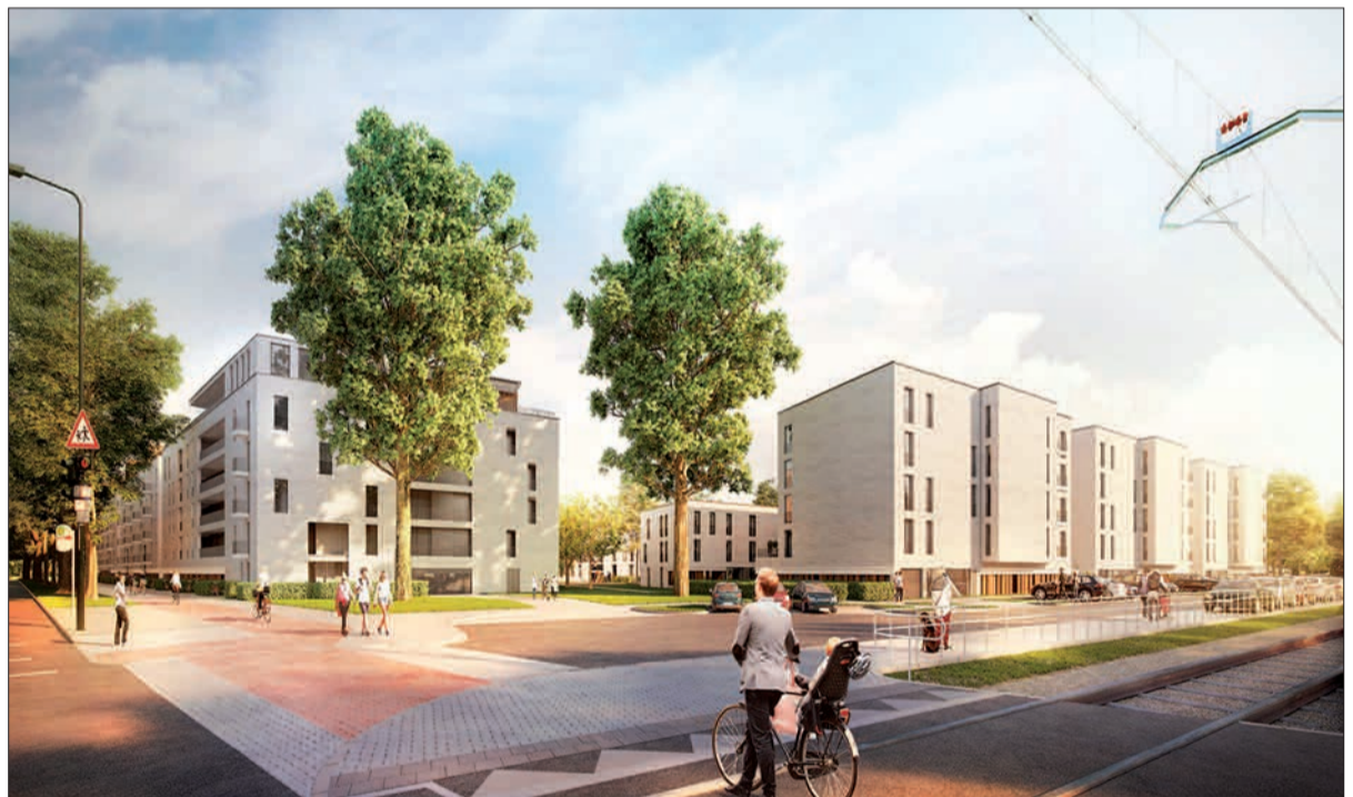
So soll das Quartier der DWG an der Kalkumer Schlossallee/Ecke Alte Landstraße künftig aussehen.

Die Baulücke an der Kreuzung Kalkumer Schlossallee/Alte Landstraße besteht seit mehr als einem Jahr. Hier wurden alte Häuser der ehemaligen Rheinbahnsiedlung gegenüber von den Bahngleisen, angrenzend an das Theodor-Fliedner-Gymnasium, abgerissen, um im Rahmen der Quartiersentwicklung neu zu bauen. Die Düsseldorfer Wohnungsgenossenschaft (DWG) mit Sitz auf der Wagnerstraße ist Bauherr. Sie hat vor einigen Jahren die umfangreichen und sanierungsbedürftigen Immobilien von der Rheinbahn erworben.