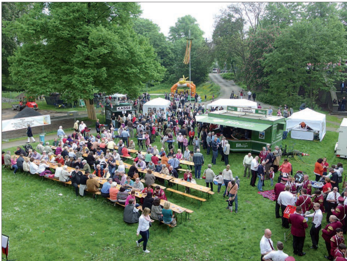
Maifeier in Kaiserswerth.

Auch in diesem Jahr laden die Kaiserswerther Schützen wieder zur Maifeier ein. Am 1. Mai wird auf der Wiese unterhalb der Klemensbrücke um 11 Uhr der Maibaum aufgestellt. Es gibt ein zünftiges Live-Platzkonzert, reichlich und lecker Speis und Trank: Würstchen vom Grill, Champignons aus der Pfanne, Bier vom Fass, alkoholfreie Getränke, Sekt- und Weinbar und ein reichhaltiges Kuchenbuffet. Kinder können sich mit den unterschiedlichsten Spielen vergnügen, natürlich auch auf dem Spielplatz, oder eine Runde auf einem Pony reiten. Ab 14 Uhr spielt die Kultband „Fischgesichter“. Ein Fest für die ganze Familie, zum Sehen und gesehen werden, zum Meinungsaustausch und ganz einfach zum geselligen Feiern. H.S.