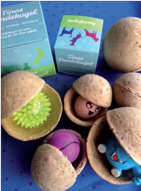
Außen Vollkorn, innen Spielzeug, das ist die neue Hundekugel in zwei Größen.