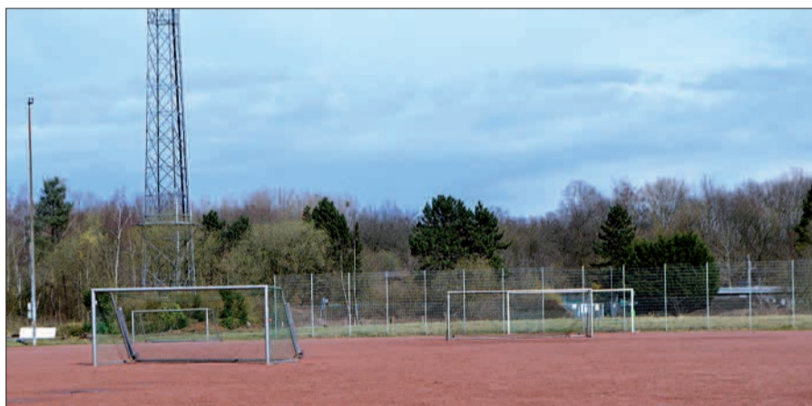
Rund um den Rahmer Ascheplatz waren die Mitglieder der TSR schon fleißig: Sie haben alle Bäume und Sträucher entfernt.

einen Vereinströdelmarkt, dessen Erlös auch dem Bau des neuen Kunstrasenplatzes dienen soll. Für 2018 ist wieder ein Spendenlauf geplant, der genaue Termin steht aber noch nicht fest. Blut spenden In Kooperation mit dem Blutspendezentrum Duisburg (Königstraße) wirbt die TSR um neue Spender. Der anfallende Werbefonus kommt dem Platzbau zu Gute. Kleinen: „Wenn man bereits Spender ist und seine Aufwandsentschädigung dem Verein stiften möchte, ist auch dies möglich. In jedem Fall sollte man mich hier im Vorfeld kontaktieren, da das Blutspendezentrum erst ab einer gewissen Größenordnung ein Vereinskonto einrichten wird.“ Der Vorsitzende ist unter der Rufnummer 0172/7039086 zu erreichen. Wer wissen möchte, wie viele Spenden schon eingegangen sind, kann auf der Internetseite des Fußballvereins www.tsrahm06.de nachschauen: Dort steht nun eine Spendenuhr mit dem aktuellen Stand, und auch die Spendenkontonummer ist angegeben. sam