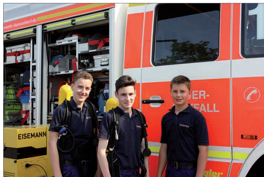
Nachwuchsförderung wird nicht nur bei der Wittlaerer Freiwilligen Feuerwehr groß geschrieben.

Feuerwehr-Aktionstag am 5.5. in Wittlaer, Schützenplatz vor der Franz-Vaahsen-Schule von 11-17 Uhr.