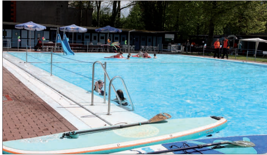
Etwa 450 Quadratmeter groß ist das Freibad in Kaiserswerth, das an Sommertagen für viele Familien aus dem Düsseldorfer Norden zweites Zuhause ist. Text u. Foto: G.S.

Am 02. Juni ist Mondscheinzelten (Übernachtung vom 1. auf den 2. Juni) mit Nachtschwimmen, La-