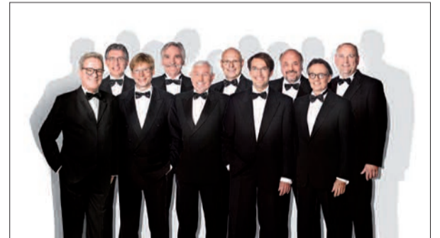
Die Restroom-Singers, ein Vokalensemble der Polizei Duisburg, gestalten den Auftakt zu der neuen Konzert-Reise, zu der der Förderverein des Malteser Krankenhauses St. Anna einlädt.