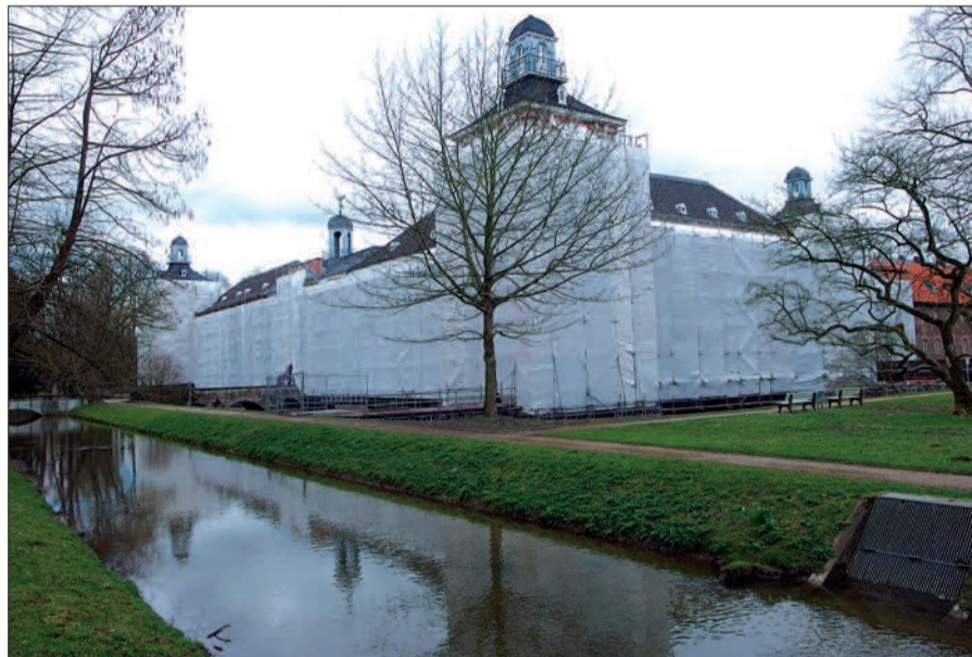
Das für eine Fassadensanierung eigerüstete und eingepackte Kalkumer Schloss.

eingestürzt war. Auf dem Hügel dort stand ursprünglich ein Aussichts- und Teepavillon. Ein Spaziergang durch den Schlosspark lohnt jetzt im Frühjahr auch während der Sanierungsarbeiten. Es blühen dort Tausende weiße Buschwindröschen (Waldanemonen). Forstleute sagen, das sei ein Zeichen für einen gesunden Waldboden. Das mehrstufige Ausschreibungsverfahren für den Verkauf des Schlosses mit Park und den Freiflächen östlich (ehemalige „Schlossgärten“) und westlich läuft. Der NORDBOTE hatte darüber berichtet und wird auch über den weiteren Verlauf von Verkauf und Sanierungen berichten. H.S.