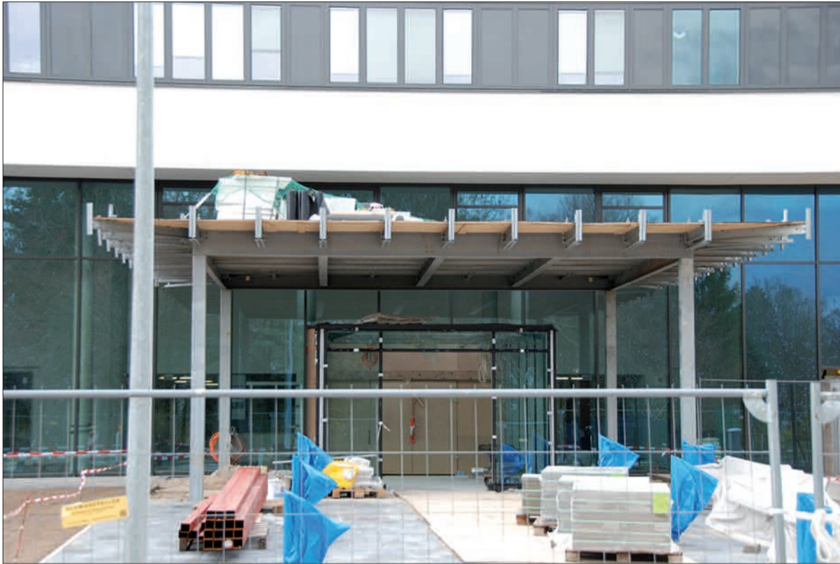
Die Bauarbeiten sind in vollem Gange. Schon in wenigen Tagen, ab dem 23. April, wird das Sanitätshaus Beuthel neben dem Haupteingang des Kaiserwerther Florence-Nightingale-Krankenhauses seine Pforten öffnen. Hier sollen auf 70 Quadratmeter sämtliche Artikel angeboten werden, die im Alter das tägliche Leben erleichtern.

Ob orthopädische Maßschuhe, Rollatoren, Rollstühle, Kompressionsstrümpfe, Orthesen, Bandagen bis zu einer großen Auswahl an Reha-Artikeln und auch Hilfsmittel für die Pflege im Bad und vieles mehr-