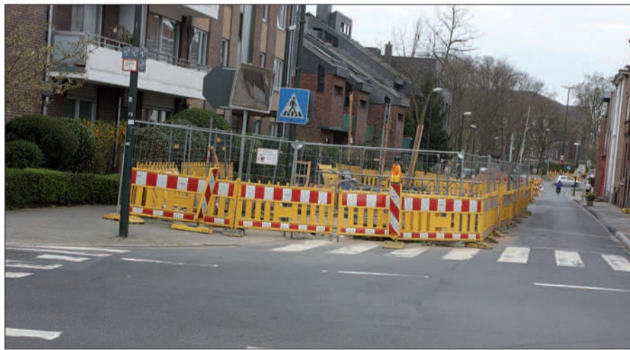
Schon seit vielen Monaten herrscht auf der Kreuzbergstraße/Ecke Arnheimer Straße eine Einbahnregelung, um die Baumaßnahme durchführen zu können. Statt Ende Januar wird es nun Mitte Juni, bis sie fertig gestellt ist und die Druckrohrleitungen vollständig verlegt sind.