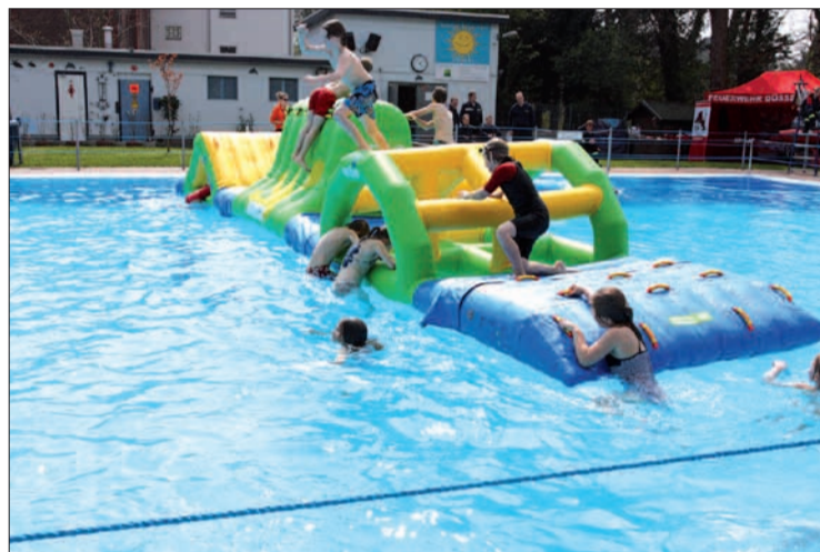
Achtung fertig los – da gabs kein Halten mehr für die Kinder.