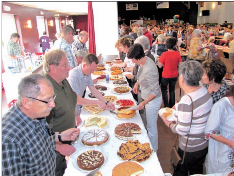
Auch in diesem Jahr wird das Kuchenbuffet gut gefüllt sein und für jeden etwas bieten.

damit eine im Duisburger Süden wohl einmalige Veranstaltung eröffnen. Es ist eine Kombination aus Kaffee & Kuchen und Modenschau. Bis 2007 war man mit dieser Veranstaltung in einem Zelt auf dem Schützenplatz, doch seit 2008 findet sie im Steinhof statt. Zum 5. Mal heißt es also wieder bei Kaffee & Kuchen in der großen Festhalle "Laufsteg frei" für die Präsentationen der neuesten Damen-Früh-