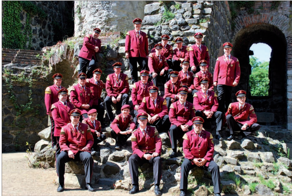
25 Jahre TC Barbarossa Kaiserswerth werden am 29. und 30. April ausgiebig auf der Wiese an der Rheinfähre gefeiert.

den Mai“ mit der Soundcovey und dem Stargast Mickie Krause statt. Die Eintrittskarte (Einzelticket 12 Euro, Gruppen ab 10 Personen 9,50 Euro pro Person, und an der Abendkasse kostet das Ticket 14 Euro pro Person) berechtigt gleichzeitig an der Teilnahme zur Tombola mit attraktiven Preisen. Karten können bestellt werden unter kartenvorverkauf@tc-barbarossa.de oder bei Tappert's am Kaiserswerther Markt 61 gekauft werden. G.S.