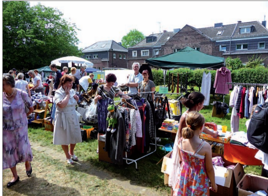
Reiche Auswahl beim Trödel anlässlich des „Frühlingserwachen“ in Lohausen 2011. Auf dem Schützenplatz an der Lohausener Dorfstraße ist in diesem Jahr noch sehr viel mehr Platz.