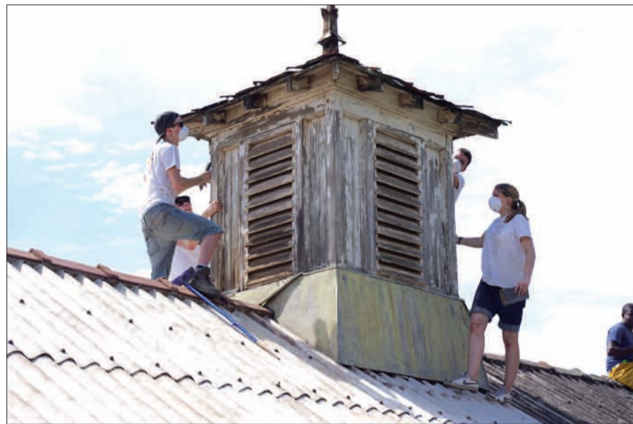
Glockenturm der Mariannahill Primary School vor der Renovierung durch die Düsseldorfer Schüler