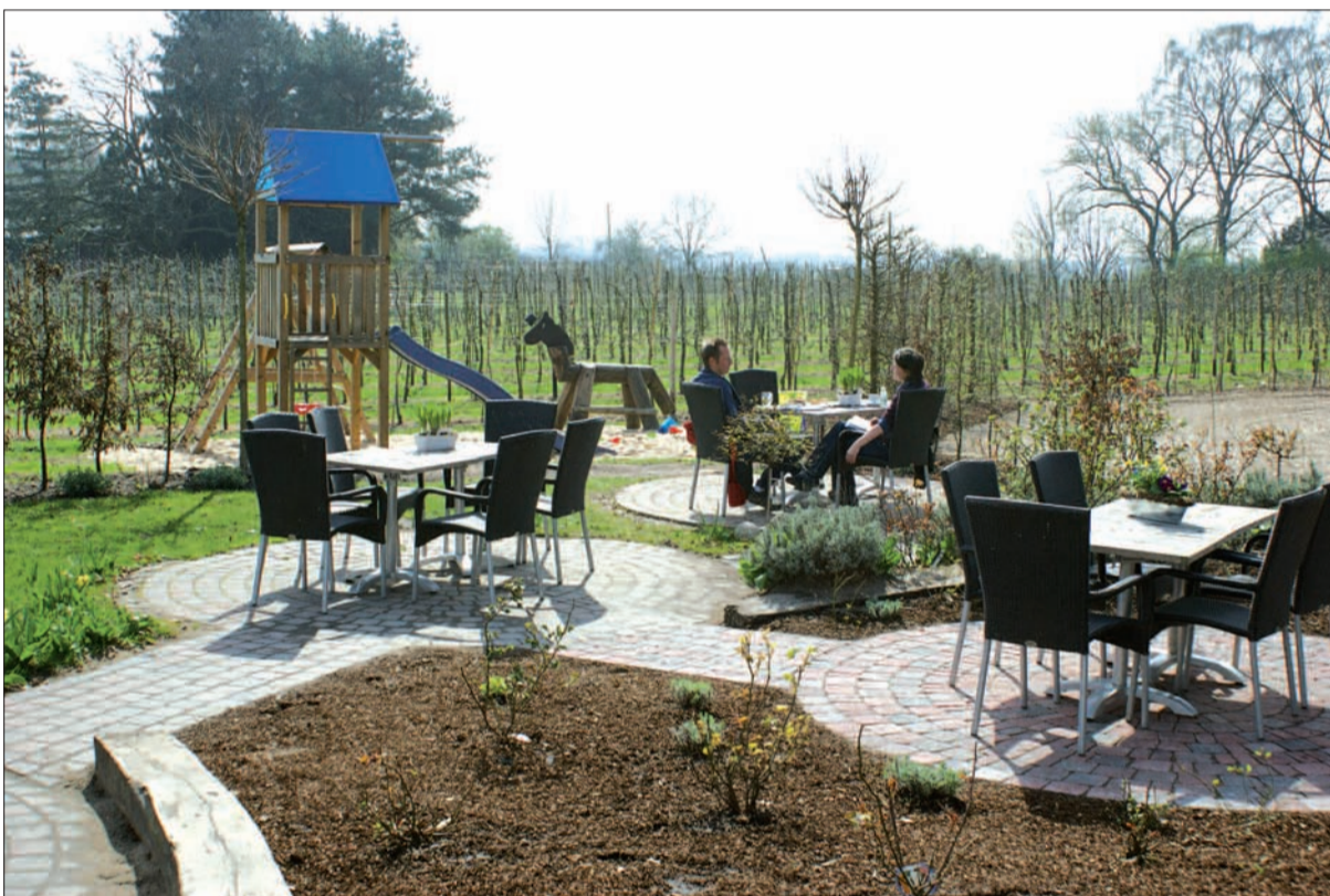
Die Spielgeräte wurden etwas versetzt, um mehr Platz für die nun 60 Sitzgelegenheiten zu schaffen. Die Kinder werden durch eine Hecke vor den Autos geschützt. Für die jüngeren Besucher stehen Muffins oder trockene Kuchen bereit. Neben einem warmen Kakao können sie auch zwischen Apfel- und Birnensaft aus eigener Pressung wählen und es sich schmecken lassen.