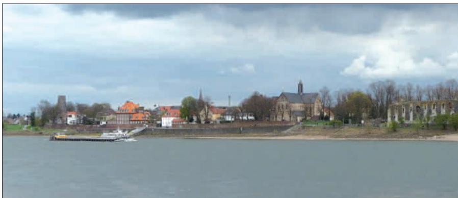
Der Düsseldorfer Norden ist ein Ausflugs- und (Nah-)Erholungsgebiet.

bringen kann ohne abzufliegen. Mit einem VRR-Kurzstreckenticket kann man 2,5 km mit dem Skytrain durch die Luft schweben. Auch das grüne Lohausen wird gewürdigt. Der ganze Stadtbezirk ist wirklich ein Urlaubs- und Erholungsgebiet. Allenfalls die Berge fehlen, aber das dürfte den Radlern doch recht sein. H.S.