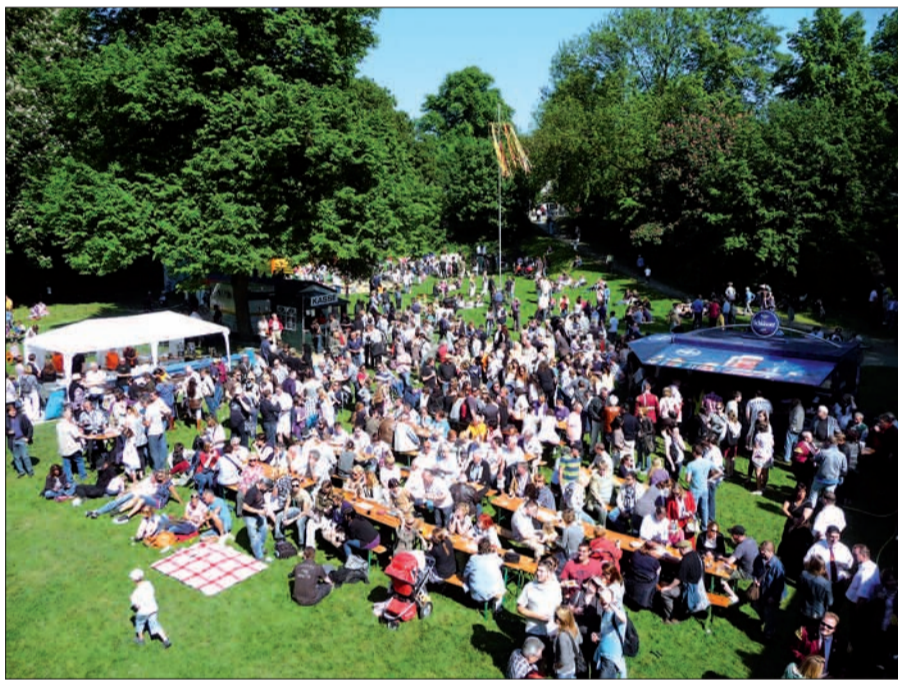
Beste Stimmung rund um den Maibaum in Kaiserswerth.

Es ist jedes Jahr – seit fast 3 Jahrzehnten – am 1. Mai ein spannendes Schauspiel, wenn die kräftigen Männer des 3. Zuges der St. Sebastianus-Schützenbruderschaft Kaiserswerth, unterstützt von Kollegen und Feuerwehrleuten, um 11 Uhr den Maibaum auf der Wiese unterhalb der Klemensbrücke aufrichten. Dann wird der Mai gefeiert. Vormittags spielt in diesem Jahr die Kapelle Stein und das Tambourcorps Barbarossa, nachmittags die Kultband „Fischgesichter“. Für Kinder gibt es reichlich Spiele und Unterhaltung (Hüpfburg und vieles andere mehr). Den Erwachsenen wird von Maibowle bis Fassbier, Softdrinks bis Kaffee, frischen Waffeln und Kuchen, Bratwurst von Holzgrill bis Champignons alles geboten, was Kehle und Magen gut tut. Der Erlös des Festes kommt dem Flo-