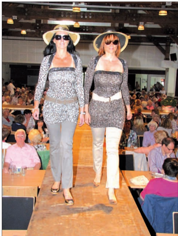
Präsentationen der Damen-Frühjahrs- und Sommerkollektionen Anno 2011.

jahrs- und Sommerkollektionen. Wie in all den anderen Jahren wird die Mode auch dieses Mal von Amateurmannequins vorgeführt, die inzwischen aber auch schon eine gewisse