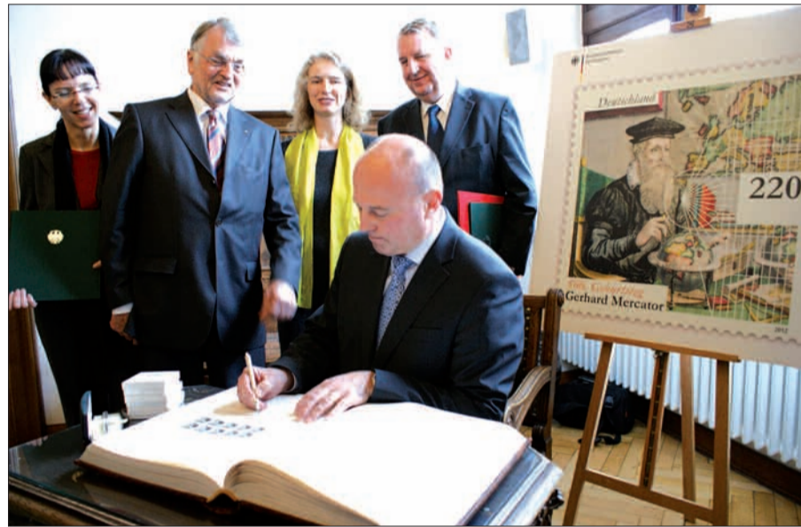
Schwungvoll trug sich Hartmut Koschyk vom Bundesministerium für Finanzen in das Goldene Buch der Stadt Duisburg ein.

Dr. Mona Dahm will mit dem Erste-Hilfe-Seminar Mut machen: „Tierhalter sollen die Scheu verlieren, rasch selbst aktiv zu werden. Zum Beispiel eine Blutung zu stillen oder einen Verband anzulegen“. Also keine Angst, auch vor Maßnahmen wie Herzdruckmassage oder Beatmung. Das Erste-Hilfe-Seminar findet am Mittwoch, 25. April 2012 um 19:00 Uhr in den Praxisräumen im Kaiserswerther Gutshof, Arheimer Straße 18 statt. Die Teilnahmekosten belaufen sich auf 20,00 Euro. Anmeldung unter Tel. 0211 - 22975516 oder Fax 0211 - 22975517 oder per Email an: info@tierarzt-kaiserswerth.de.