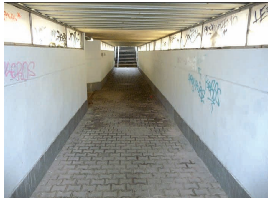
Die Unterführung unter der Bahntrasse in Angermund ist nicht sehr einladend.

Kennzeichen verraten, dass der Parkplatz auch bei Flugreisenden sehr beliebt zu sein scheint. Die Unterführung, die nicht nur Bahnreisenden dient, sondern auch Radlern und Fußgängern den Weg zwischen den beiden Ortsteilen verkürzt, passt mit der schäbigen Beleuchtung nicht ins gehobene Ortsbild der Rosenstadt. Das Urteil der Bahnhofstester des VRR ist viel kürzer gefasst: „Nicht akzeptabel“. H.S.