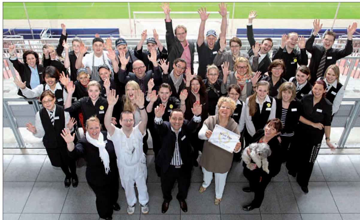
Never change a winning team – das gilt wohl auch für die Düsseldorfer Riege vom Tulip Inn, das gerade wieder zum dritten Mal hintereinander als bestes Hotel in der 3-Sterne-Kategorie ausgezeichnet wurde.