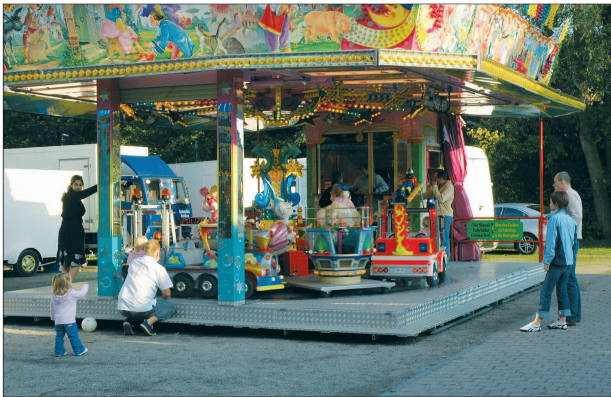
Auf dem Schützenplatz „Im Ährenfeld“ wird es am 19. bis 21. April wieder voll sein, wenn die Sebastianus-Schützen zu Ihrer Frühjahrskirmes nach Huckingen einladen. Text & Foto: Horst Mosebach

Veranstalter, erwarten die großen und kleinen Besucher. Aktuelle Informationen über die Huckinger Schützen gibt es im Internet unter „www.schuetzen-huckingen.de“