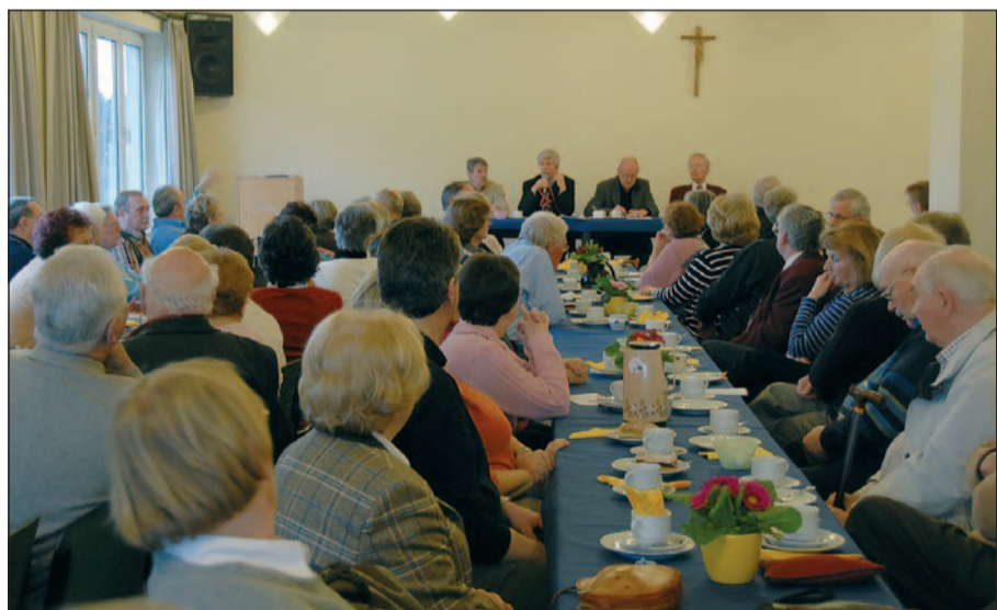
Der Vorstand des Huckinger Bürgervereins stand in der Jahreshauptversammlung Ende März auf alle Fragen seiner Mitglieder Rede und Antwort.

Zu seiner diesjährigen Jahreshauptversammlung lud der Huckinger Bürgerverein am 30. März ins Pfarrheim der katholischen Kirchengemeinde St. Peter und Paul ein. 91 Mitglieder waren diesem Aufruf gefolgt. Auf der Tagesordnung stand neben