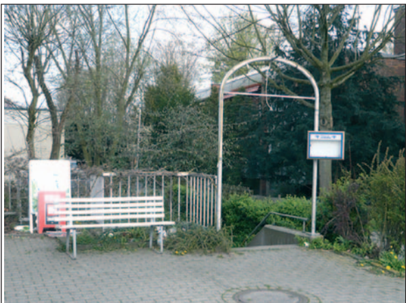
Lange rührte sich nichts, doch jetzt ist ein Ende der Ruhepause in Sicht. Ab Mai geht der neue Gastronom an den Start.