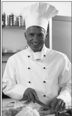
Die Köche von „apetito zuhaus“ haben immer neue Ideen, um die Tischgäste zu begeistern.

„50 Jahre apetito - Ideen die begeistern“, das ist das Motto von „apetito zuhaus“ in diesem Jahr. Als Dankeschön hält der private Menübringdienst ein spezielles