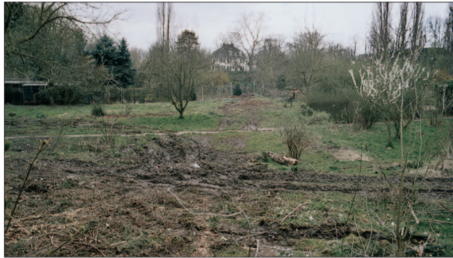
Aus der früheren Gartenidylle und meist wenig ansehnlichen Gartenhäusern im Wallgraben vor Kaiserwerth soll im Laufe des Jahres ein allgemein zugänglicher, gepflegter Grünzug mit Baumwiesen werden. Hier der aktuelle Zustand nach Räumung der Gärten.