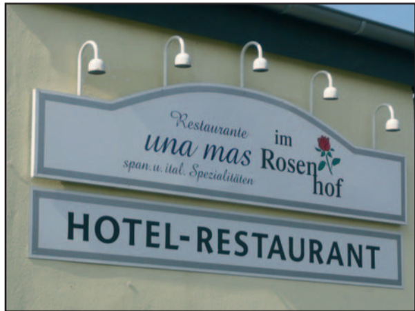
Verlockend schon die Außenwerbung des neuen spanischen Restaurants „Una Mas“ im Rosenhof Angermund. Foto & Text: Gabriele Schreckenberg