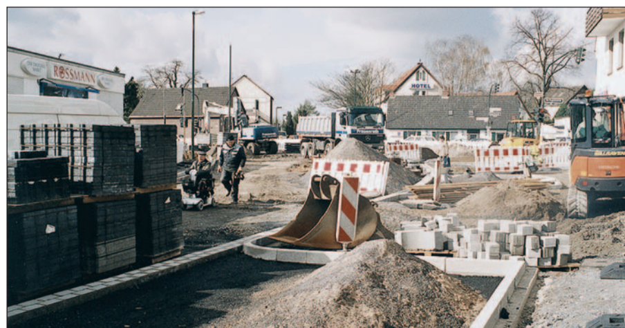
Im Lohausener Geschäftszentrum hilft während der Umbauarbeiten zum Kreisel kein Navigationsgerät. Eine deutliche Wegweisung würde aber ortsfremden Messegästen sehr helfen. Text & Foto: HS