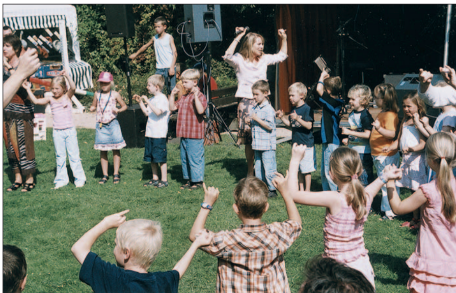
Spielende Kinder auf einem der früheren Lohausener „Frühlingserwachen“.

lecke, Karussell und Torwandschießen, rheinische und internationale Gastronomie, musikalische Unterhaltung mit einem DJ von TSmusic, Super-Tomola, Ponyreiten. Das alles findet statt auf dem Lohausener Marktplatz an der Haltestelle der U 79. Wer da fehlt, verpasst den Lohausener Frühling!