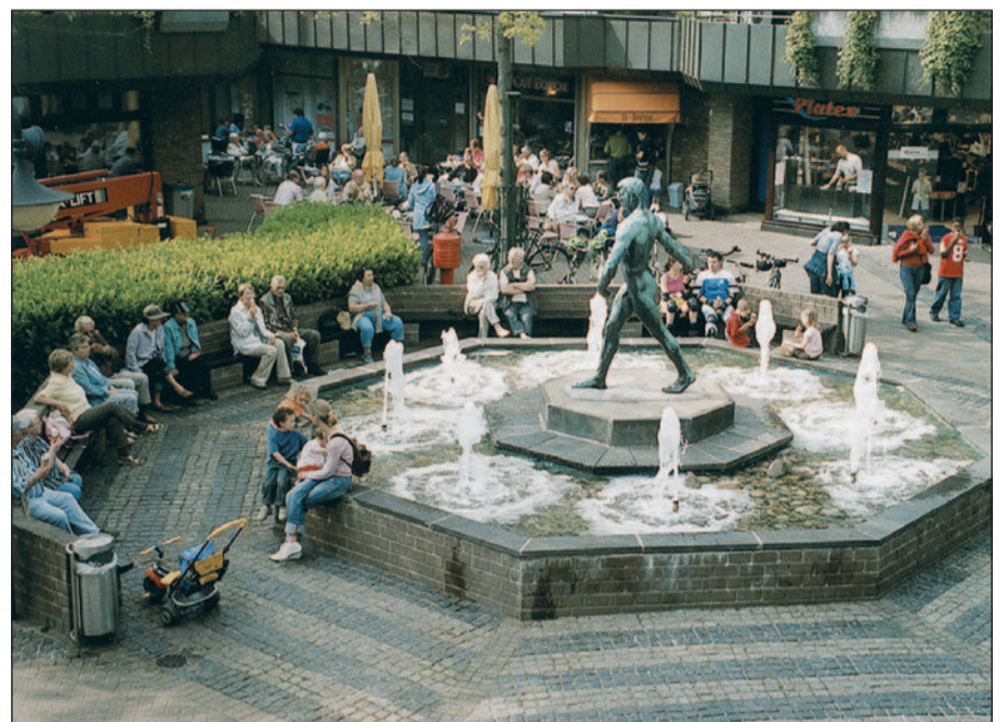
Kaiserwerth hat als Stadtteilzentrum im Düsseldorfer Norden den Einheimischen und den Ausflüglern viel zu bieten, vom modernen Klemensviertel (Foto) bis zur altehrwürdigen Kaiserpfalz am Rheinufer. Das bestätigt auch eine von der Werbegemeinschaft „Wir Kaiserwerther“ und der IHK veranlasste Umfrage.

Programme. Über die Auswertung der Umfrage unter Kaiserwerther Gewerbetreibenden und Bürgern soll in einer späteren Sitzung berichtet werden. Vorweg war als Ergebnis festzustellen, dass Kaiserwerth als Begriff, Stadt(teil) und Einkaufsziel einen hohen Stellenwert besitzt.