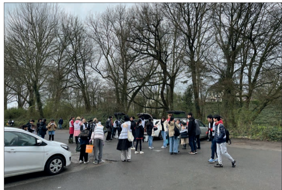
Zum Start rüsten sich alle mit Westen, Greifern, Handschuhen und Tüten aus.