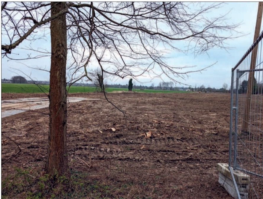
Viele Bäume mussten dem Angerausbau zunächst weichen. Nun wird die Baumaßnahme in 6 Teilabschnitten realisiert.

Immer wieder spannend, zu erfahren, woher die Anger eigentlich kommt. Ihr Ursprung liegt in Wülfrath, und nach etwa 36 Kilometern Fließstrecke verläuft die Anger in Duisburg-Huckingen so, dass sie rechts dem Rhein zufließt. In Ratingen wiederum wechselt sie von dem steilen bergischen Land in die Rheinniederung und wird immer flacher. Gemäß EG-Wasserrahmrichtlinie ist die Anger ein berichtspflichtiges Gewässer. Der gute ökologische Zustand, der durch Fische und Pflanzen gewährleistet wird, steht hier im Vordergrund. Auch ein schnurstracks gradliniger Verlauf ist nicht besonders ökologisch, weil nicht naturnah. Dass durch den Angerausbau auch der Hochwasserschutz für Angermund verbessert wird, ist klar: Die Sekundärauen dienen als natürliches Überschwemmungsgebiet, und die Verbreiterung des Gewässerprofils hilft zusätzlich.