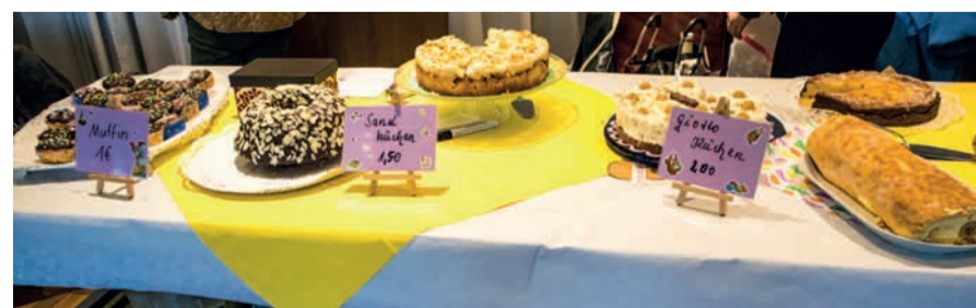
Das Kuchenbüfett ließ keine Wünsche offen.