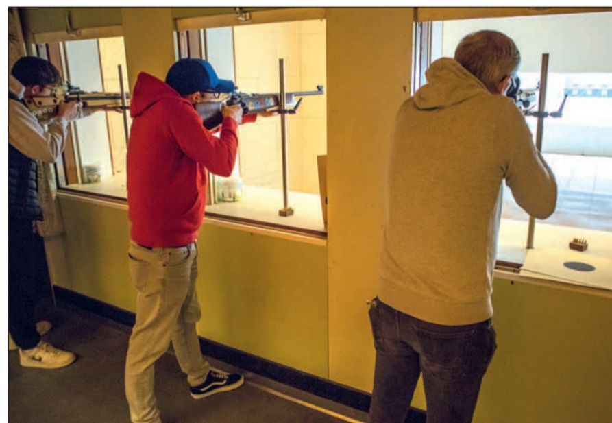
Am Schießstand war absolute Ruhe und volle Konzentration angesagt.

ßen und Curlingwettbewerb wie immer gedacht. Die Belohnung für die Mühen konnte sofort in Form von harten bunten Ostereiern oder weichen Schokoladen- eiern mitgenommen und zum Auffüllen des häuslichen Osternestes verwendet werden. Und wer keinen Appetit auf Eier hatte, der konnte das reichhaltige Kuchenbüfett genießen. VJ