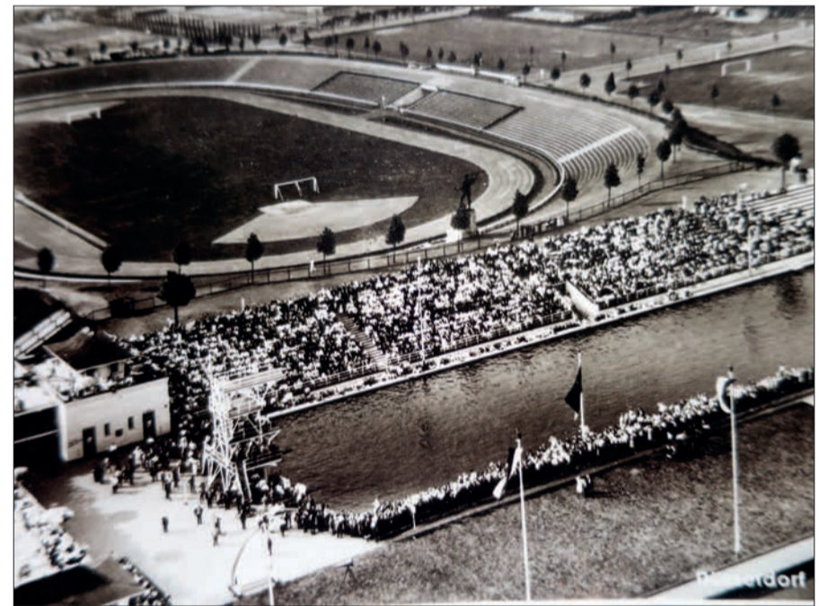
Blick auf die Tribüne des Stadions von 1925.