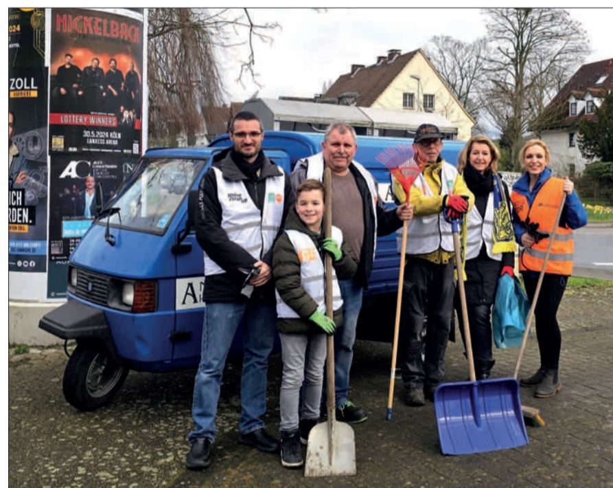
Lediglich fünf Erwachsene und vier Kinder nahmen dieses Jahr am Dreckweg-Tag in Angermund teil. Eine traurige Bilanz.

Die Gruppe hat jedenfalls fleißig Müll eingesammelt. Und hierbei trat natürlich wieder Einiges zutage. In der kurzen Zeit wurden nicht weniger als 250 Kilogramm Unrat, darunter u.a. ein Koffer, ein Kindersitz, zwei Gasflaschen und mehrere Spritzen, zusammengetragen. Jupa's Hotel hatte mit Kaffee und Kakao für die richtigen Startbedingungen gesorgt, so dass das Sammeln wie von selbst ging. Bleibt nur zu hoffen, dass im nächsten Jahr die Teilnehmerzahl wieder wesentlich größer ist. VJ