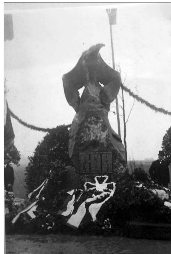
Der Lohauser Adler auf dem Kriegerdenkmal bei der Einweihung im November 1925.

Auch die Tafel mit den Namen der Gefallenen 1914-1918 besorgte ein patriotischer Lohauser wieder zurück. Sie hängt heute neben dem Missionskreuz an der Westseite (Eingang) der Lohauser Kirche. HS