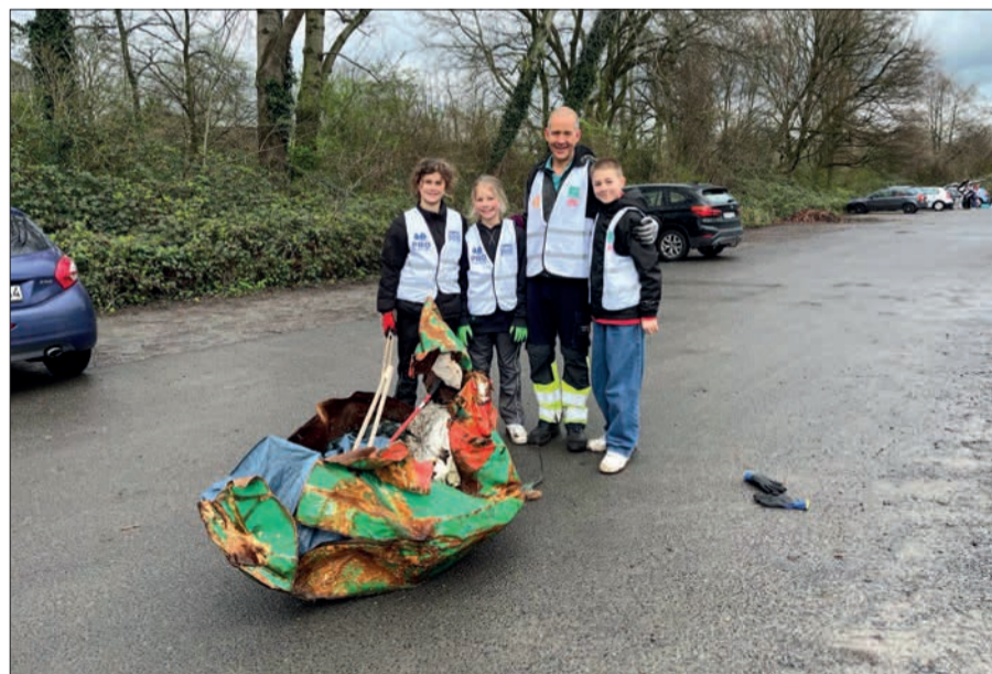
Skurrile Beute: Eine verrostete und verbeulte Boje (haben diese Müllsammler gefunden.)

Umgebung der Schule mit Elan Müll eingesammelt.