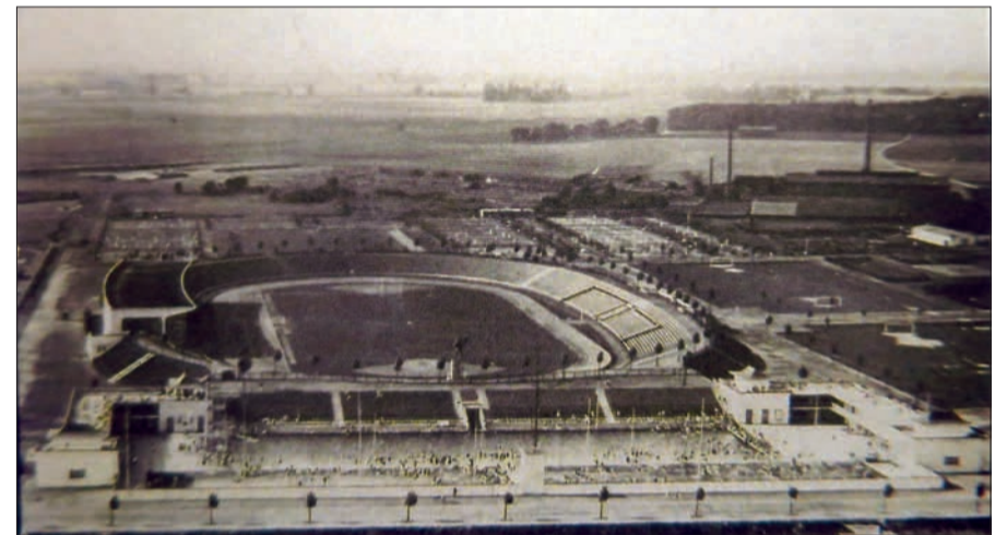
Fußball- und Leichtathletikstadion mit Schwimmstadion, Blick von Süden.

schaft 2024 stattfinden. In dieser hervorragenden Multifunktionsarena haben natürlich inzwischen schon sehr viele großartige sportliche, künstlerische, musikalische und unterhaltende Veranstaltungen stattgefunden. Es fasst je nach Veranstaltung zwischen 52 000 (Liga-Fußball-Spiele) und 66 500 (Konzerte) Zuschauer. Unsere beiden historischen Ansichtskarten zeigen, wie sehr sich die Anforderung an eine solche Sport- und Veranstaltungsstätte geändert haben. HS