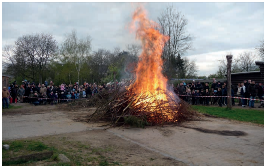
Osterfeuer in Lohausen auf dem Gelände des Islandpferde Reiter e. V. Text u. Archivfoto: HS

chen, aber auch Deftiges wie Pommes und Gegrilltes. Wo? In der Lohauer „grünen Mitte“, Neußer Weg 34. Erstaunlich ist, wie groß und großzügig das Gelände des Vereins ist. Das Osterfeuer wird entzündet, wenn es auf die Dämmerung zugeht.