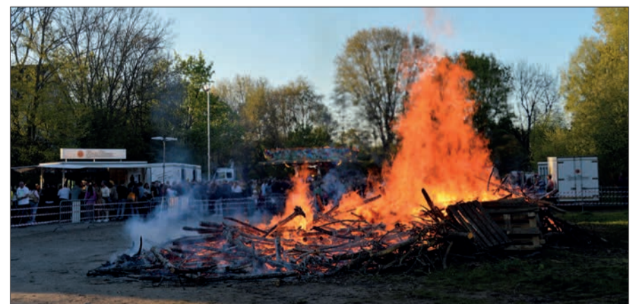
Wie in den Vorjahren wird das Osterfeuer in Huckingen sicherlich wieder viele Gäste auf den Schützenplatz locken.

en uns auf die Huckinger Bürger, Freunde und Nachbarn aus allen Ortsteilen!“, kündigen die Schützen an. sam