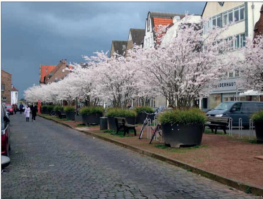
Blick auf den Mittelstreifen des Kaiserswerther Marktes mit blühenden japanischen Brautkirschen.