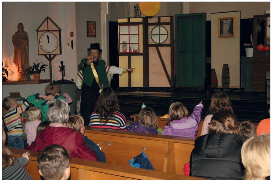
Das Wittener Kinder- und Jugendtheater führte in der Sermer Kirche „Das kleine Gespenst“ auf.

frieden in die Gesichter der applaudierenden Kinder schauen. Die Sermer haben wohl berechtigte Hoffnungen, dass die Kindertheater-Vorstellungen auch in Zukunft angeboten werden. sam