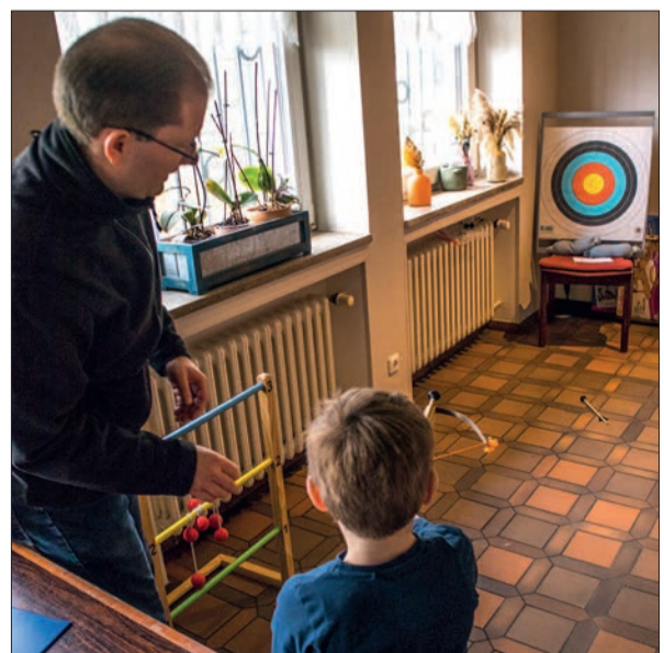
Angelegt ist: Mit den letzten Anweisungen vom „Schießmeister“ muss doch der „Goldene Schuss“ endlich einmal gelingen.