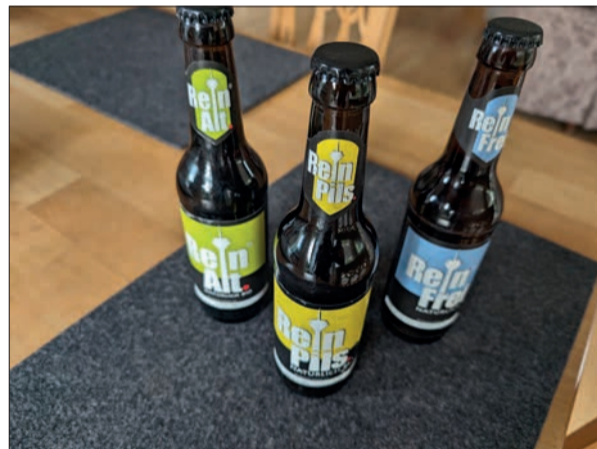
Drei Sorten, die einfach zu allem passen und auch pur lecker sind.

tenmalz, Bio-Hopfen. Zu beziehen ist es im Biohaus einzeln oder in Kästen. Und nicht nur zu Ostern schmeckt es bestens, auch in den kommenden warmen Monaten ist es einfach gut. Beste Auswahl an Bioprodukten Wer ein Fan von frischem Gemüse, Obst, Kräutern, Biokaffee, Demeter-Produkten, gutem Käse und überhaupt von besten Zutaten ist, wird im Biohaus Lohausen immer fündig. Es gibt nichts, was es hier nicht gibt, bis zu Produkten für die Hautpflege, Backwaren, herrlichem Käse und noch viel mehr. Ein Besuch lohnt sich immer! Biohaus, Niederrheinstraße 71, 40474 Düsseldorf 0211/98 48 36 01 www.biohaus-duesseldorf.de. GS