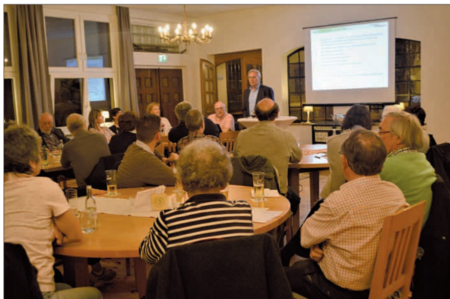
Gut besucht war die Jahreshauptversammlung des Bürgervereins Serm bei „Schenke“. Der Verein zählt 233 Mitglieder.

Der Verein hat 233 Mitglieder, die Zustimmung fand der Antrag eines Mitglieds, den Sermer Friedhof besser aus-