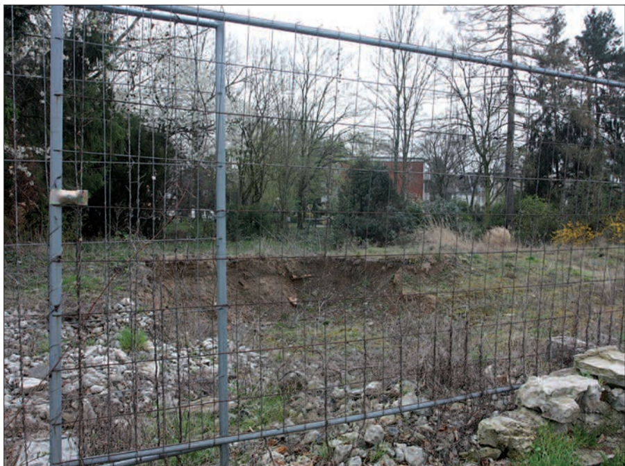
Hohes Unkraut wuchert auf dem Bauplatz Alte Landstraße direkt gegenüber der Haltestelle. Hier soll in drei Neubauten auf vier Geschossen vor allem sozialer Wohnungsbau entstehen.