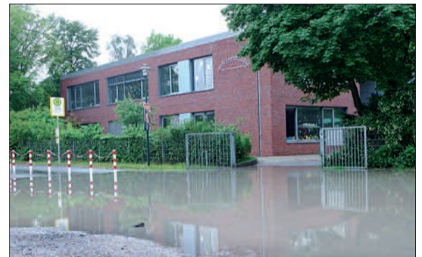
So sah der Schützenplatz oft aus, wenn das Wasser nicht abfließen kann, weil die Anbindung an den Kanal fehlt.