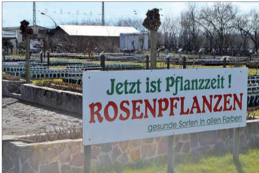
50 Rosensorten in allen Wuchsformen stehen am Grünen Weg zum Verkauf bereit. Ab Juni werden sie in voller Blüte erstrahlen.

Sorten sind vielfach ausgezeichnet und tragen das ADR-Prädikat. Stöbern Sie einfach vorab im Internet durch alle Sorten oder seit Montag, 1. April, auch im Rosengarten, der dann ab Juni in voller Blüte steht. Rosen Ruland befindet sich am Grünen Weg 55 in 47269 Duisburg-Rahm und ist unter der Rufnummer 0203/763793 zu erreichen. Im April gelten noch die eingeschränkten Winteröffnungszeiten: montags bis freitags von 13 bis 18 Uhr, samstags von 9 bis 14 Uhr und sonntags von 10 bis 12 Uhr. Weitere Infos findet man im Internet unter www.rosen-ruland.de . sam