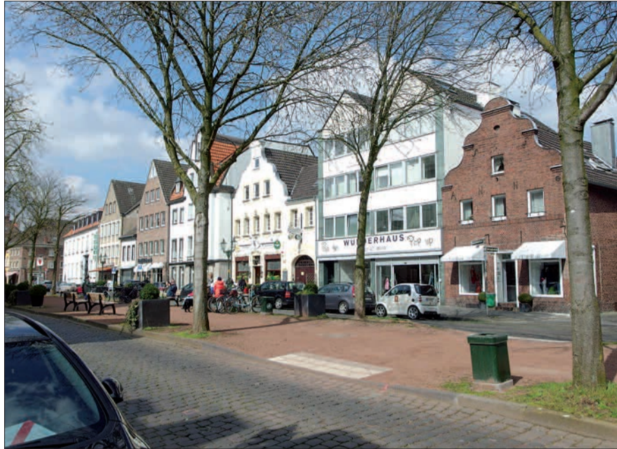
Historische Gebäude, interessante und leistungsfähige Gastronomie und Einzelhandel, aber wenig Aufenthaltsqualität auf dem Kaiserswerther Markt, auch für parkplatzsuchende Kundschaft.

Wann mit den Arbeiten begonnen werden kann, ist bislang offen. Die Bezirksvertretung 5 hatte von der Verwaltung schon im vergangenen Herbst bis Ende 2015 einen Terminplan erbeten, der aber noch nicht vorliegt. Fertigstellung hatte die Bezirksvertretung bis Mitte 2017 erwartet, was aber nicht mehr realistisch ist. In den städtischen Haushalt 2016 sind keine Mittel speziell für den Kaiserswerther Markt eingestellt. Aus Mitteln der Bezirksvertretung sollten aber € 250 000,- bereit stehen. OB Geisel