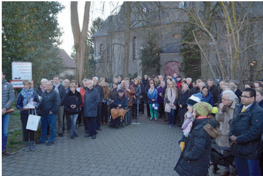
Viele Rahmer Bürger waren gekommen, um die neuen Bienen im Haus nach historischem Vorbild vor der Kirche zu begrüßen.

Nachdem Diakon Löv das Haus von allen Seiten gesegnet hat, trafen sich die Rahmer auf der Wiese hinter dem Pfarrheim. Hier hatten die Pfadfinder ein großes Osterfeuer entfacht. Bei leckeren Getränken, Brezeln und natürlich Ostereiern kamen alle miteinander schnell ins Gespräch. sam