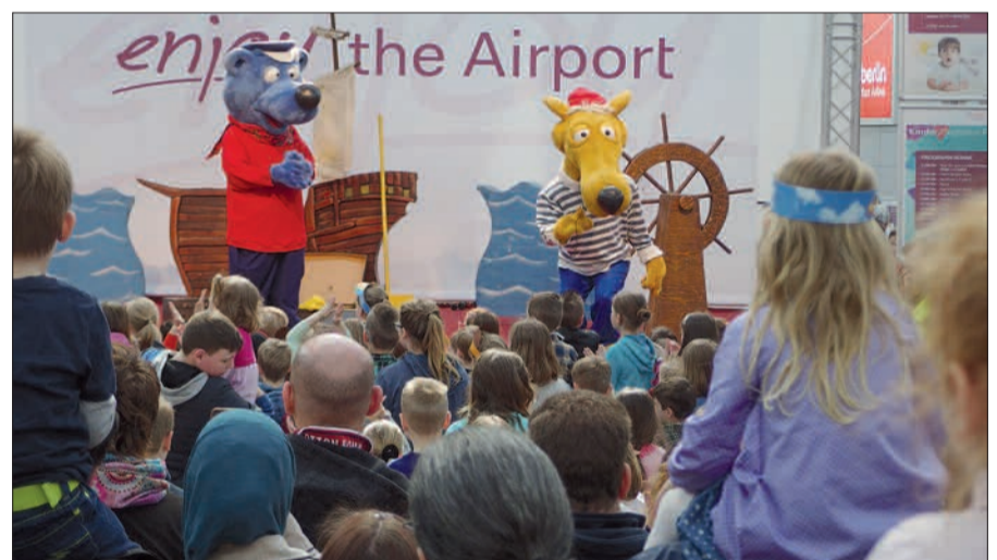
Kapitän Blaubär und Hein Blöd begeisterten die Kinder.

Frühlingsluft gab es auf der Zuschauerterrasse und auf den Flughafenrundfahrten mit Flugbetrieb „in e cht“. Alles kostenlos! Nur fürs leckere Eis und die preisgünstigen Gastronomie-Angebote musste noch ein wenig in der Urlaubskasse übrig sein. Oder fürs Shoppen in den Airport-Arkaden. Es empfiehlt sich, den nächsten Familien-Erlebnis-Sonntag mit dem Thema „Frühlingszeit“ schon mal vorzumerken: Der 1. Mai von 11 bis 18 Uhr. H.S.