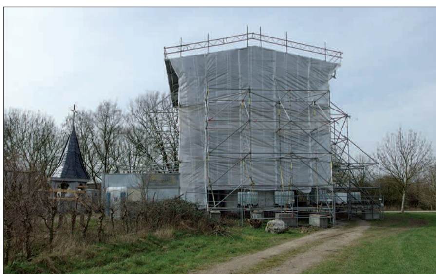
Die zwecks grundlegender Sanierung eingerüstete und verhüllte Hubertuskapelle bei Großwinkelhausen. Das hölzerne Glockentürmchen steht links neben der Baustelle.

Schenkung übereignet hatte. Es wurden aber nur die dringendsten Sanierungsarbeiten durchgeführt. Im Laufe der Jahre verlor die Kapelle wieder an Aufmerksamkeit. Mit dem Bau der B 8n lag sie für Radler und Wanderer nur noch an einer Sackgasse, war aber jetzt als Landmarke und als Entree in die Landeshauptstadt von der 4spurigen Schnellstraße her gut sichtbar. Andererseits verlor sie durch nebenan errichtete landwirtschaftliche Gebäude und abgestellte Pferdeanhänger ihre Alleinstellung in der Landschaft. Heimatfreunde, Bürger und lokale Politiker gründeten 2013 einen Förderverein. Die Bezirksvertretung 5 stellte Mittel zur Verfügung, um eine grundlegende Sanierung der Kapelle in Angriff zu nehmen. Mit diesen Arbeiten, die auf