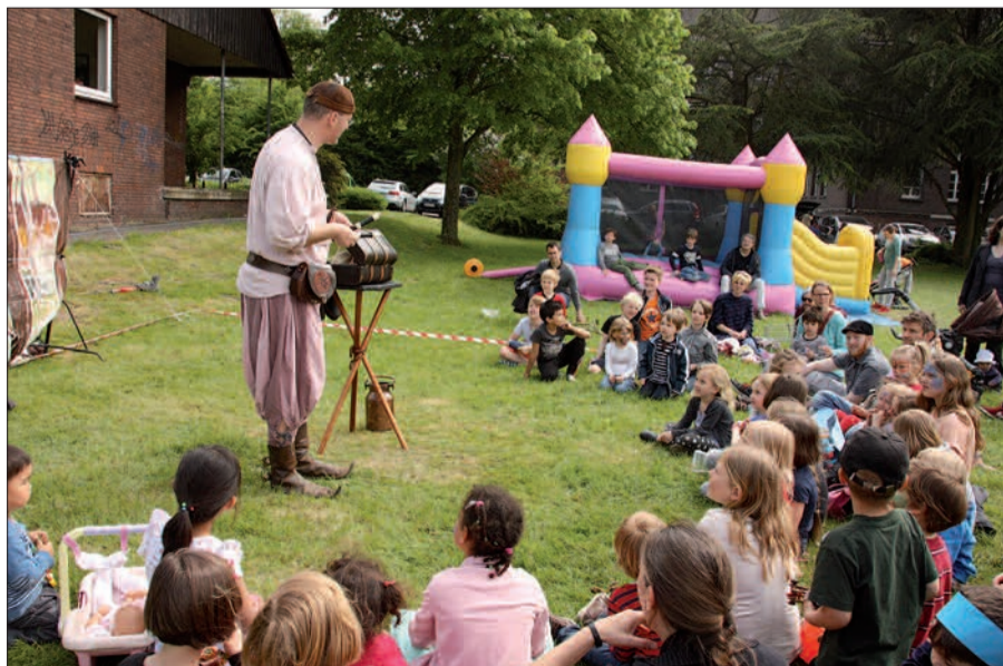
Am 30. April laden die Kitas wieder zum Frühlingsfest auf die Wiese an der Alten Landstraße ein.

beträgt 15 Euro für drei Meter Standfläche sowie eine Salat- oder Kuchenspende. Der Erlös kommt den Kitas zugute“, erläutert Melanie Bodeck, Pressesprecherin der Kaiserswerther Diakonie. Trödler, die sich mit einem eigenen Stand am Frühlingsfest beteiligen möchten, können sich bis zum 29. April anmelden: per E-Mail an kita-birkenhaus@kaiserswerther-diakonie.de oder zwischen 9 und 11 Uhr unter der Rufnummer 0211.409 3180.