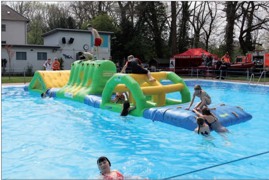
Wann wird's mal wieder richtig Sommer? Spätestens beim Anschwimmen im Kaiserswerther Freibad.

Am 16. April wird die Freibadsaison in diesem Jahr eröffnet. Das traditionelle Anschwimmen ist Startschuss in die warme Saison und wird von zahlreichen Fans genutzt, um als erste in das herrliche Nass zu springen. Um 13 Uhr geht es an diesem Tag los. Schwimmkurse können gebucht werden, die