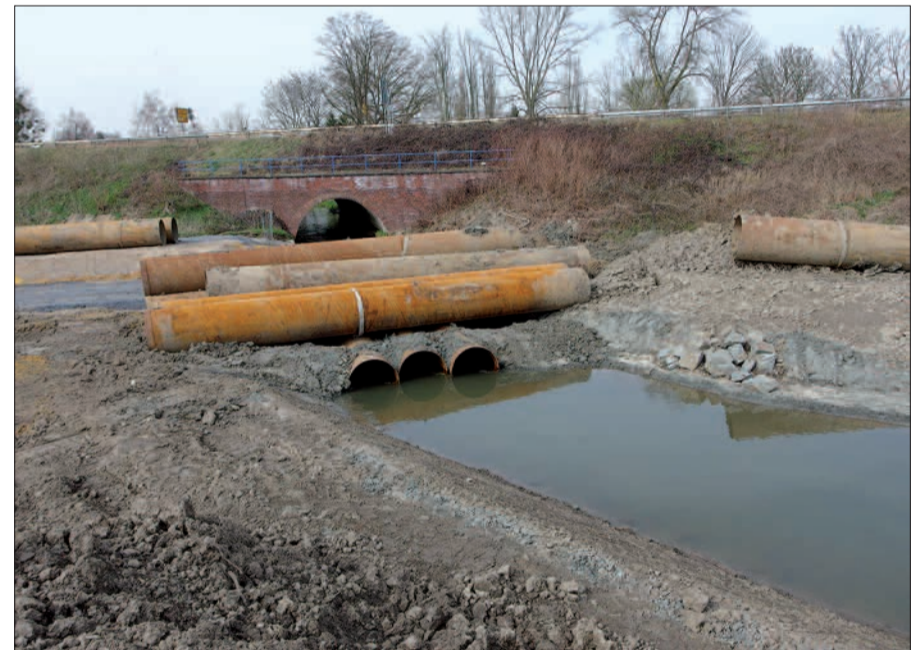
Vorübergehende Verlegung des Angerbachs, um einen vergrößerten Durchlass unter der B 288 herzustellen. Im Hintergrund der bisherige Angerdurchlass.

An der Stadtgrenze zwischen Düsseldorf und Duisburg fließt die Anger bislang durch ein enges Rohr unter der B 288/zukünftige A 524 durch (im Bereich der früheren Winkelhauser Ölmühle, die im Zuge des Straßenausbaus bereits abgebrochen wurde). Autofahrer kennen diese Stelle zur Genüge, denn hier geht's zur Zeit auf der B288/A524 rauf und runter wie auf einer Achterbahn. Jetzt ist mit den Arbeiten begonnen worden, den Durchlass für die Anger ganz wesentlich zu erhöhen und so breit, dass beidseits noch ein Uferstreifen bleibt, auf dem Wildtiere unter der B 288/A 524 wechseln können. Zunächst muss der Angerbach verlegt werden, um die Bauarbeiten an der Stelle zu ermöglichen, an der die Anger bislang verrohrt die B 288 unterquerte (unser Foto). Die Arbeiten erfolgen unter der Regie von StraßenNRW. Die vorgesehene Sanierung und Renaturierung der Anger von der Ortslage Angermund (Durchlass unter der DB-Trasse) bis zur anfangs erwähnten Stadtgrenze nach Duisburg ist noch offen. Die Sanierung oberhalb der Wolff'schen Mühle in Richtung Klärwerk Ratingen steht in absehbarer Zeit bevor, teilte der Bergisch-Rheinische Wasserverband, der für diese Maßnahmen zuständig zeichnet, dem NORDBOTEN mit. H.S.