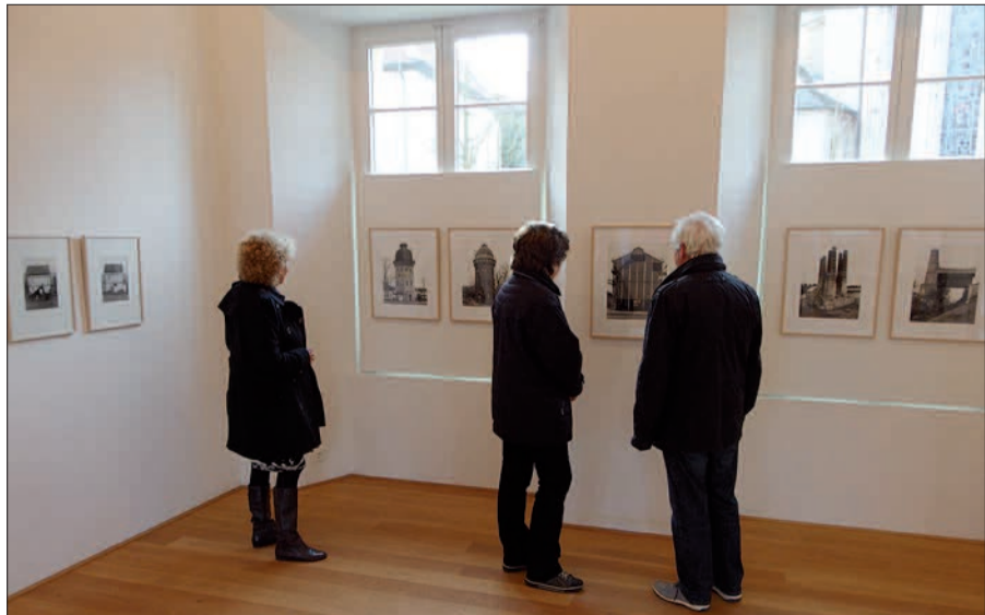
Die Ecke mit Industriefotos von Bernd (1931-2007) und Hilla (1934-2015) Becher im „Kunstarchiv Kaiserswerth“.