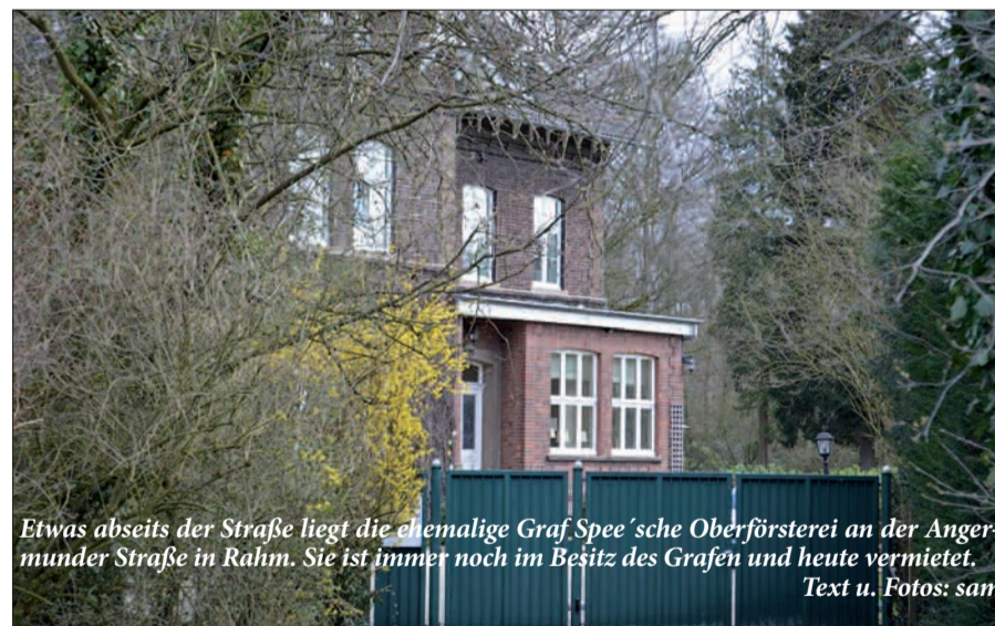
Etwas abseits der Straße liegt die ehemalige Graf Spee'sche Oberförsterei an der Angermunder Straße in Rahm. Sie ist immer noch im Besitz des Grafen und heute vermietet. Text u. Fotos: sam