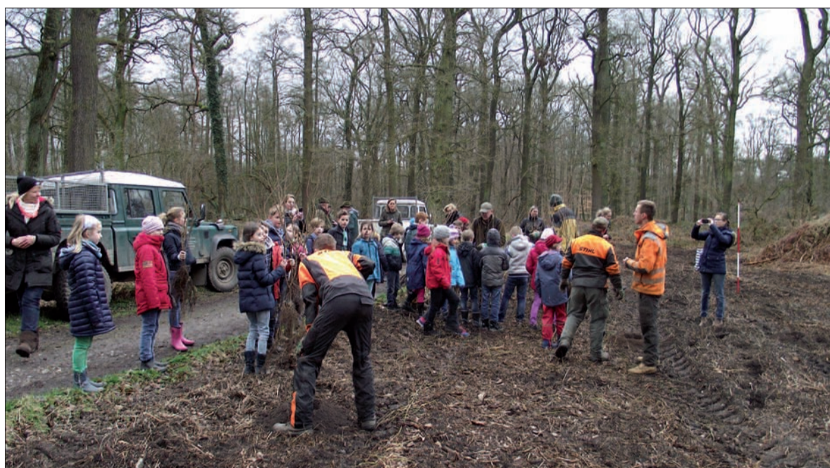
Nichts geht über eine frühlingshafte Baumpflanzaktion mit Kindern, die riesig Freude haben, die jungen Gewächse in die Erde zu bringen und mit ihrem Namen zu versehen.