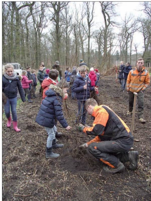
Den Boden bereitet haben die Mitarbeiter der Speeschen Forstverwaltung.

Gemeinschaftsgrundschule Angermund ihr in Plastik eingeschweißtes Namensschild am zarten