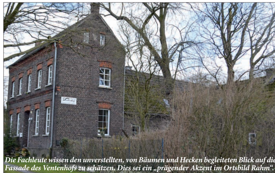
Die Fachleute wissen den unverstellten, von Bäumen und Hecken begleiteten Blick auf die Fassade des Ventenhofs zu schätzen. Dies sei ein „prägender Akzent im Ortsbild Rahm“.