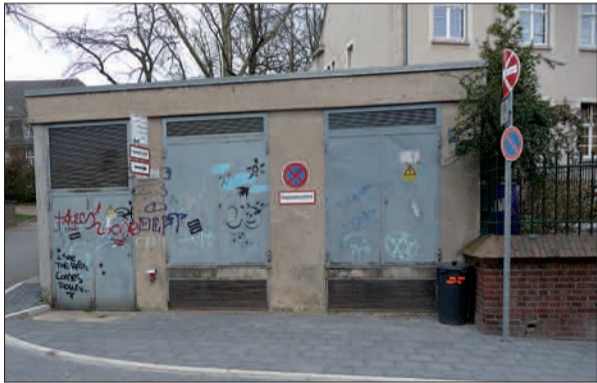
Trafohaus an der sanierten Fliednerstraße.

Die Sanierung der Fliednerstraße hat zwar etwas länger gedauert, aber jetzt entspricht sie eher dem historischen Ambiente, macht den „Historischen Stadtkern in NRW“ (so lautet ein neues Schild an der Klemensbrücke) attraktiver für Ortsansässige, Spaziergänger und Ausflügler. Was noch nicht ins Bild passt, ist die verrostete und verschmierte Front des Trafohauses (unser Foto). Hier ist das Problem zu lösen, dass das Gebäude zwei Eigentümer hat und noch einen Dritten als Mitbenutzer, die sich offensichtlich nicht einigen können, wer den Anstrich übernimmt. Bleibt zu hoffen, dass kreative und kompetente Mitarbeiter dieser Institutionen bald eine Lösung finden. H.S.