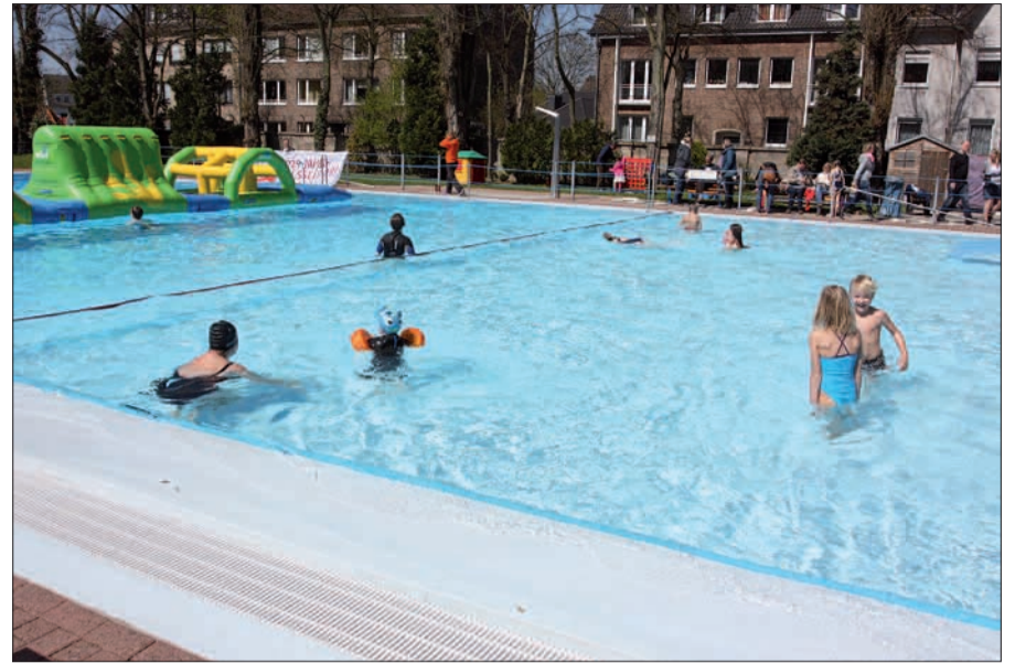
Mit 26° Wassertemperatur ist das Nass nass, aber nicht kühl.

ab 3 Jahren erfreuen sich großer Beliebtheit, und für die Mitglieder des Fördervereins gibt es 30% Rabatt auf alle Kursangebote (www.flossen-weg.de). Frühschwimmer kommen hier auf ihre Kosten, denn sie können montags, mittwochs und freitags ab 7 Uhr ihre Bahnen ziehen (nur für Mitglieder). Dienstags, donnerstags, samstags, sonntags und feiertags ist das Bad ab 8:30 Uhr geöffnet. Für Nicht-Mitglieder übrigens täglich ab 12 Uhr. Der Badebetrieb geht bis 19.45 Uhr. Und wer Lust hat, sich ehrenamtlich zu engagieren, kann es gern tun und sich melden unter flossen-weg@flossen-weg.de G.S.