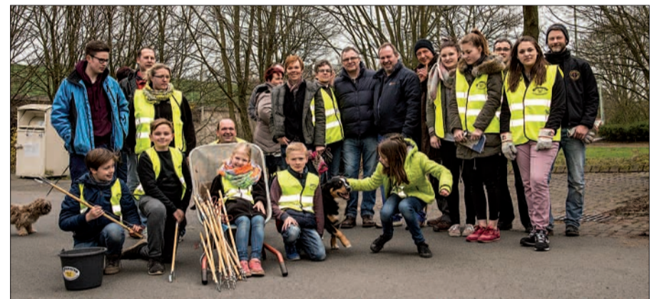
Fleißige Helfer der Rahmer Schützenbruderschaft trafen sich an einem Samstagmorgen, um den Dreck aus ihrem Ort wegzuschaffen. Im nächsten Jahr sollen auch die Bürger mithelfen.