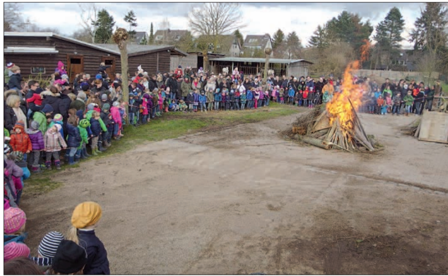
Osterfeuer in Lohausen 2015.

Pferde Reiter, auch im übrigen Angebot, ist bekanntlich hervorragend. Den meisten Gästen war bekannt, dass man sich warm anzieht, wenn es irgendwie um Island geht. Jedenfalls war die Spannung groß und das Frösteln vergessen, als nach einiger Wartezeit erst nach 18 Uhr das Feuer entzündet wurde. Alle Island-Pferde, auf denen ab 16 Uhr in der Runde geritten werden durfte und einige Kinder kein Ende fanden, mussten erst in ihre Paddocke gebracht werden. Fachmännisch angefacht, loderten die Flammen dann aber nach wenigen Minuten. Eine wunderbare Einstimmung in das gerade begonnene Frühjahr! Bitte als nächsten wichtigen Termin den 26. April, 11 bis 18 Uhr vormerken, dann lässt die