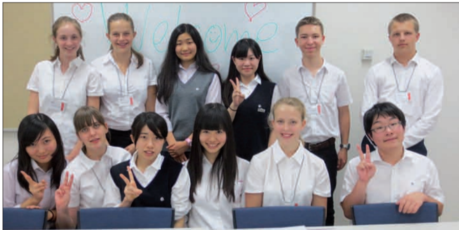
Jump to Japan: Deutsch-japanische Freundschaft hat in Düsseldorf seit den 60-er Jahren Tradition.