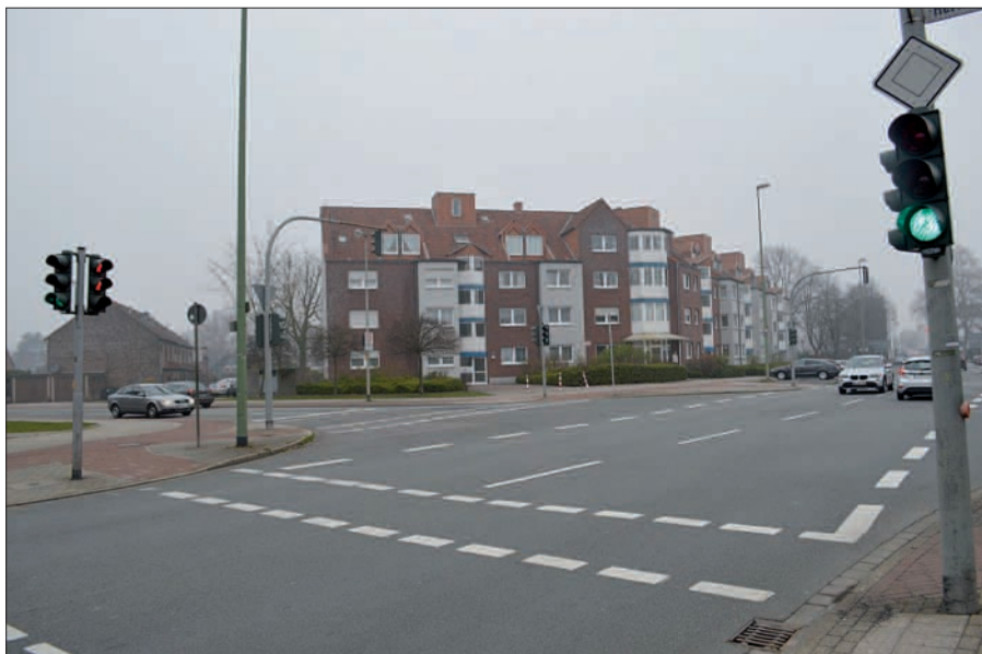
Die Kreuzung Raiffeisenstraße/Düsseldorfer Landstraße/Hermann-Spillecke-Straße in Huckingen ist sehr groß – doch einen Kreisverkehr wird es nach dem Willen von Politik und Verwaltung aus Kostengründen nicht geben.

hof-Parkplatz missverstanden werde könne und viele Autofahrer umkehren würden, wenn die Plätze an der Straße belegt seien, wurde aufgegriffen. Künftig soll eine zusätzliche Beschilderung auf den in weiterer Entfernung liegenden Parkplatz hinweisen. sam