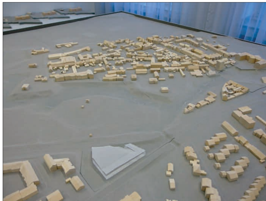
Modell von Kaiserswerth. Im Vordergrund (hellgrau) der geplante Supermarkt auf dem Dreiecksparkplatz.

Größtes Interesse fanden die Architektorentwürfe für eine Markthalle auf dem Dreiecksparkplatz, insbesondere der Vorschlag von Lisa Ocampo mit Eingang und Arkaden zur Niederrheinstraße hin, den der NORDBOTE schon in seiner Ausgabe am 13. Februar vorgestellt hatte. Von unseren Lesern kam der ergänzende Vorschlag, die Arkaden, oder einen gedeckten Promenadenweg, barrierefrei bis zum Klemensplatz fortzuführen, mit einer Brücke über den tiefer liegenden Ritterskamp.