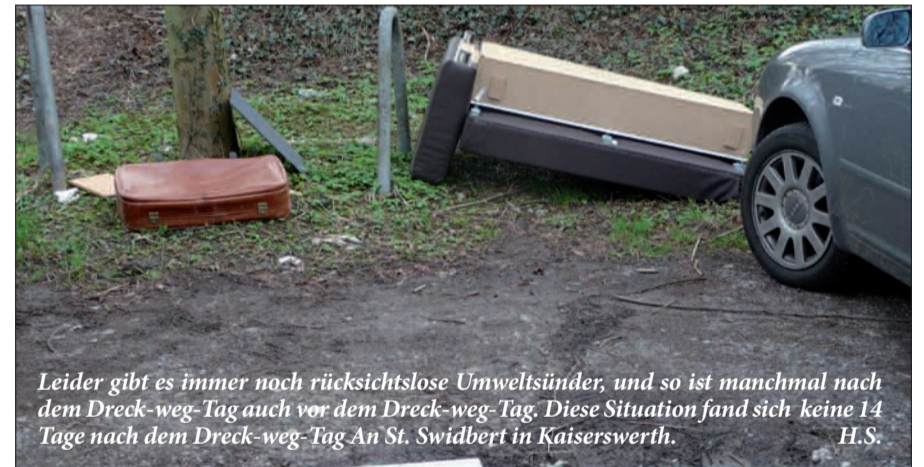
Leider gibt es immer noch rücksichtslose Umweltsünder, und so ist manchmal nach dem Dreck-weg-Tag auch vor dem Dreck-weg-Tag. Diese Situation fand sich keine 14 Tage nach dem Dreck-weg-Tag An St. Swibert in Kaiserswerth. H.S.