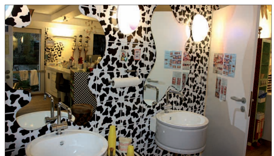
Originell und außergewöhnlich ist die Praxis der beiden Kieferorthopäden eingerichtet.