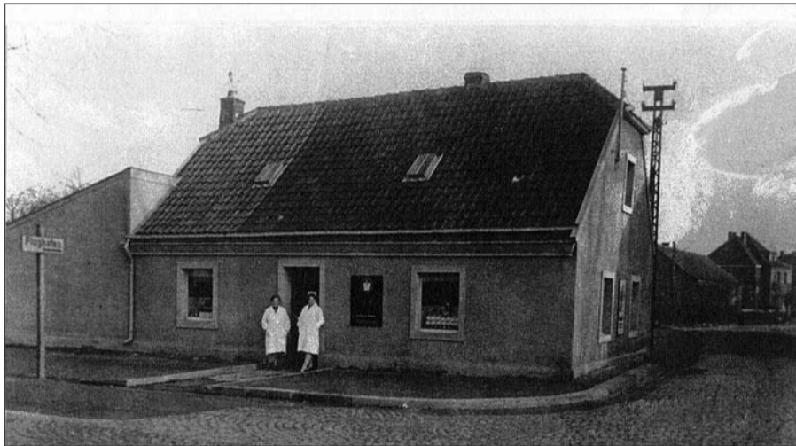
Am heutigen Verkehrskreisel in Lohausen im Jahre 1927.

Von Hektik und großem Kundenandrang ist 1927 im Kolonialwarenhandel Neuhausen in Lohausen, am Standort der heutigen Bäckerei Wolff, Niederrheinstraße/Ecke Alte Flughafenstraße, keine Rede. Heute sind der Betrieb und das Angebot gegenüber bei Kaiser's ganz wesentlich größer, und die Verkäuferinnen haben auch keine Mühe mehr, sich vor die Ladentür zu stellen. Auf der damals noch gepflasterten Niederrheinstraße, obwohl einzige Zufahrt zum Flughafen, bewegt sich ebenfalls nichts.