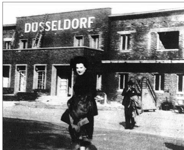
Auf dem Weg vom „Terminal“ zum Flugzeug vor knapp 70 Jahren.