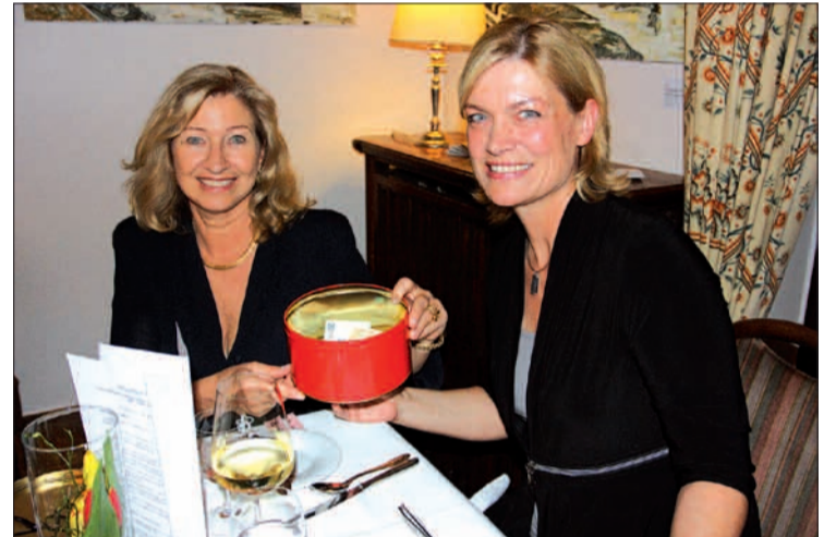
Die charmanten Damen waren für das Geld-sammeln verantwortlich, die Lose verkauften sie auch.