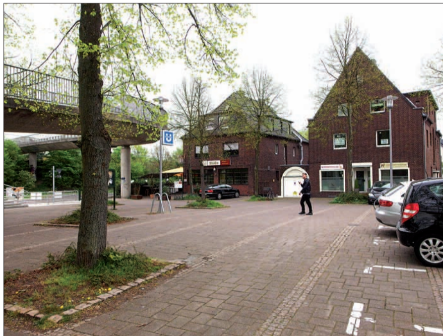
Bürger- und Bezirksvertretung wünschen sich eine Aufwertung des Lohausen „Marktplatzes“ an der Alten Flughafenstraße.

Nachdem in Verbindung mit dem Bau des Hochbahnsteigs in Lohausen im vergangenen Jahr eine umfassende Aufwertung des Lohausen Marktplatzes an der Alten Flughafenstraße nicht erreichbar war, hat die CDU-Fraktion in der Bezirksvertretung 5 auf „nachhaltige“ Initiative des Heimat- und Bürgervereins und der Werbegemeinschaft einen Antrag an die Stadtverwaltung auf den Weg gebracht, die Gesamtfläche aufzuwerten, die Bedingungen für den Mittwochs-Wochenmarkt zu optimieren, Möglichkeiten zur Erweiterung der Außengastronomie zu schaffen, die Nutzung für Veranstaltungen zu verbessern und die Parkplätze auf den