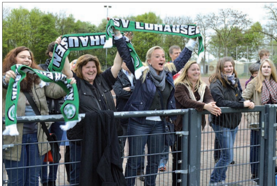
Eifrig feuerten Eltern, Geschwister und Freunde die Lohausener Jungs an.

Ein internationales U9-Turnier findet am kommenden Wochenende, 12. und 13. April, beim SV Lohausen statt: Der LSV unterstützt den FC Mönchengladbach bei der Ausrichtung dieses Turniers, ein Teil der Spiele findet auf der Platzanlage am Neusser Weg statt. Erwartet werden Samstag und Sonntag zwischen 10 und 17 Uhr verschiedene Teams von Bundesligisten sowie Top-Mannschaften aus anderen Ländern. Die U9-Junioren spielen um einen Wanderpokal.