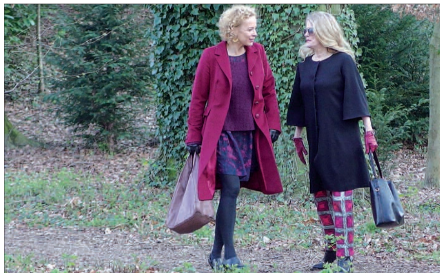
Katja Riemann (links) und Barbara Sukowa bei Dreharbeiten im Kaiserswerther Diakoniegelände.

Katja Riemann und Barbara Sukowa (unser Foto) spielen zwei Geschwister, und das Diakoniegelände diente als Kulisse für ein Altenheim („The Magnolia House“). Zu sehen geben wird es den Film erst 2015. H.S.