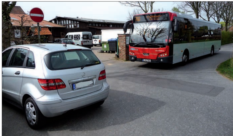
Erst einmal große Pause für den Bus 760 am Zeppenheimer Dreieck, bis Rheinbahn-Leitstelle und Polizei den Weg freimachen.

ße kamen. Der Busfahrer äußerte sich dahingehend, dass er nicht zum ersten Mal blockiert wurde. Lösbar wäre das Problem ganz einfach, wenn entweder ein Halteverbotsschild für 1-2 Fahrzeuge anstelle des unverständlichen „Einfahrt verboten“ aufgestellt würde (unser Foto). Vielleicht täte es auch eine Markierung, um Fahrbahn von Parkstreifen zu trennen (falls Parken dort überhaupt vorgesehen ist). Anscheinend haben diejenigen recht, die Kalkum und Zeppenheim als die „vergessenen Dörfer“ bezeichnen. Wenn schon eine ordentliche Verkehrsführung hier aus finanziellen Gründen derzeit nicht möglich ist, weil im Wasserschutzgebiet dann auch eine aufwändige Straßenkanalisation vorgeschrieben ist, sollte für den Bus während der anhaltenden Kanalbauarbeiten we-