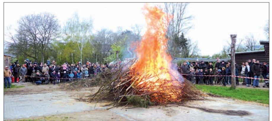
Das Osterfeuer des Islandpferde-Reiter-Vereins am Neusser Weg in Lohausen ist jedes Jahr ein großartiges Erlebnis.

Es ist nicht nur das mächtige Osterfeuer, welches Familien zum Gelände des Island-Pferde-Reiter-Vereins am Neusser Weg in Lohausen lockt. Am Ostermontag, 19. April ab 16 Uhr darf bereits auf den familienfreundlichen Islandpferden durch das großzügige Vereinsgelände geritten werden. Auf dem Rücken dieser sehr ruhigen, kinderfreundlichen Pferde können auch schon die ziemlich Kleinen sitzen, natürlich werden sie von erfahrenen Vereinsmitgliedern geführt. Am Neusser Weg hat eine ganze Herde Islandpferde (über 20) ihr Zuhause. Es gibt Kaffee und Kuchen, Salat und Würstchen und kalte Getränke. Gegen 18 Uhr wird das Osterfeuer entzündet, ein faszinierendes Erlebnis für Jung und Alt. Jedermann ist willkommen. H.S.