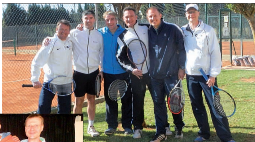
Für die Pflege der kulturellen Beziehungen zwischen Spanien und Deutschland standen die Lohausener Tennisspieler gerne zur Verfügung. Sie siegten im B-Finale.

fand zeitgleich ein traditionelles mallorquinisches Tennis-Doppeltturnier statt und dieser Gruppe fehlten noch Teilnehmer. So lud man die Lohausener zum Mitspielen ein. Nach kurzer Diskussion stand fest: „Für diese Pflege der kulturellen Beziehungen zwischen Spanien und Deutschland stehen wir gerne zur Verfügung.“ Die deutschen Tennisspie-