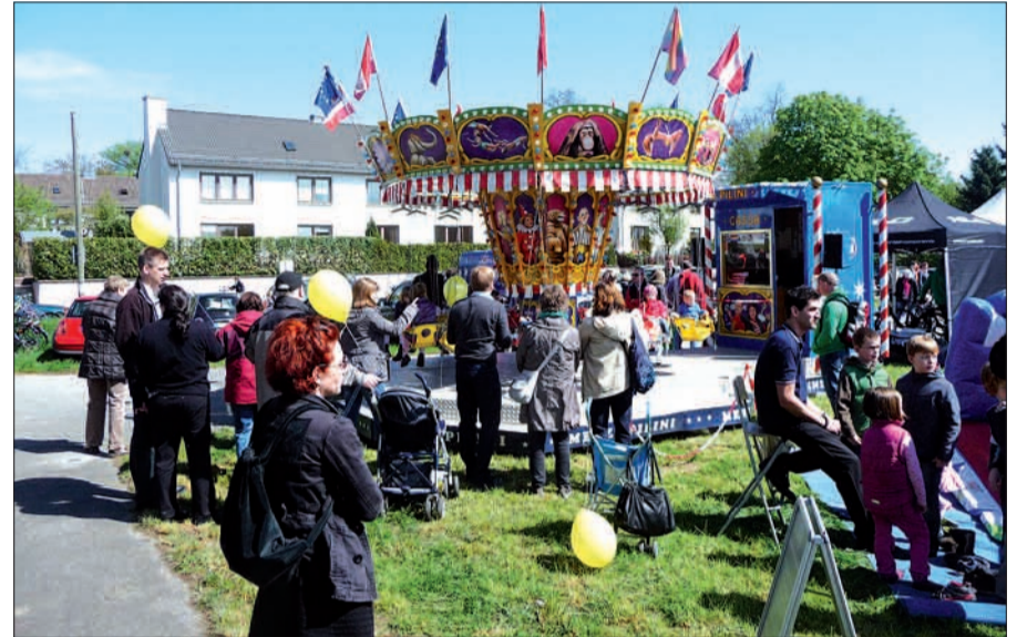
Viel Spaß gibt es beim Lohauer Frühlingserwachen für die Familie. Hier ein Schnappschuss aus 2013.

Diesen Termin am Sonntag, den 27. April von 11 bis 18 Uhr muss man sich vormerken! Dann ist auf dem Schützenplatz an der Lohauer Dorfstraße wieder „Frühlingserwachen“. Dort ist reichlich Platz für das große und attraktive Programm für Groß und Klein. Wir werden in der nächsten Ausgabe des NORDBOTEN am 25. April ausführlich darauf eingehen. Vorweg sei erwähnt, dass auch diesmal wieder eine tolle Band den musikalischen Teil liefert (western und hagen), aber auch sonst ein vielseitiges Programm geboten wird. Höchste Zeit ist es jetzt für Trödler, einen der begehrten Verkaufsstände bei Lotto, Toto und Mehr, Niederreinhstraße 79 zu buchen. H.S.