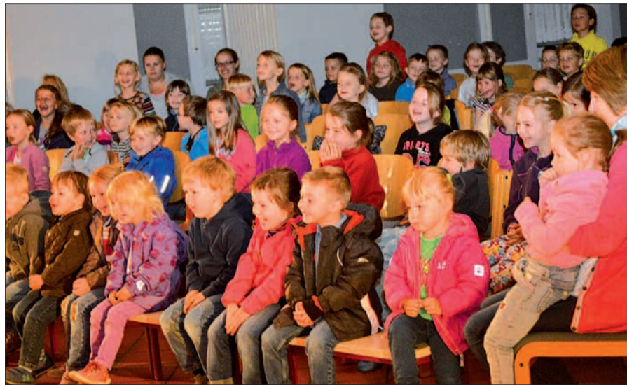
Einen vergnüglichen Vormittag hatten die Serner Mädchen und Jungen, die gebannt die freie Inszenierung von „König Drosselbart“ verfolgten – und immer wieder selbst mit eingebunden wurden.

ger aufgeregter war Prinzessin Dodo, die auf der Suche nach einem Bräutigam war. Einer nach dem andern stellte sich ihr vor, doch keiner genügte ihr. Einer war so dünn, dass die Kinder ihn wegpusteten sollten. Doch was passierte? Die jungen Zuschauer pusteten so kräftig, dass Prinzessin Dodo umfiel und sich auf dem Boden kugelte. Auch das zweite, etwas vorsichtigere Pusten der Kinder endete mit dem Herumkullern von Dodo – alle hatten großen Spaß. Ebenso wie beim Kochen von Kartoffeln, das der Prinzessin enorme Schwierigkeiten bereitete. Es war ein kurzweiliger Vormittag, sehr zur Freude der Kinder und ihrer Begleiter. sam