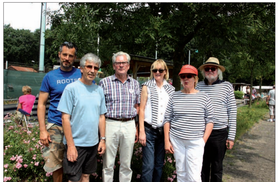
Das Turnier mit dem Verein Sur Place aus Düsseldorf im vergangenen Sommer war ein echtes Vergnügen.