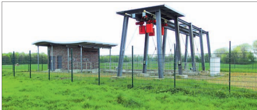
Die derzeitige Pump- und Revisionsstation für das Düsseldorfer Abwasser auf dem Rheindeich in Lohausen.

rund 5 m unter der Rheinsohle verlegt werden. Die gesamten nördlichen Teil des Düsseldorfer Stadtgebiets durchs Lohausener Feld, natürlich unbemerkt und unterirdisch. Ungefähr in Höhe der Messeparkplätze unterqueren die großen Kanalrohre den Rhein. Die Rohre unter der Flusssohle werden Düker genannt. Erkennbar ist die Rohrführung an der Pump- und Revisionsstation auf dem Lohausener Deich. Für rund € 11,5 Mio. soll jetzt ein weiterer Düker