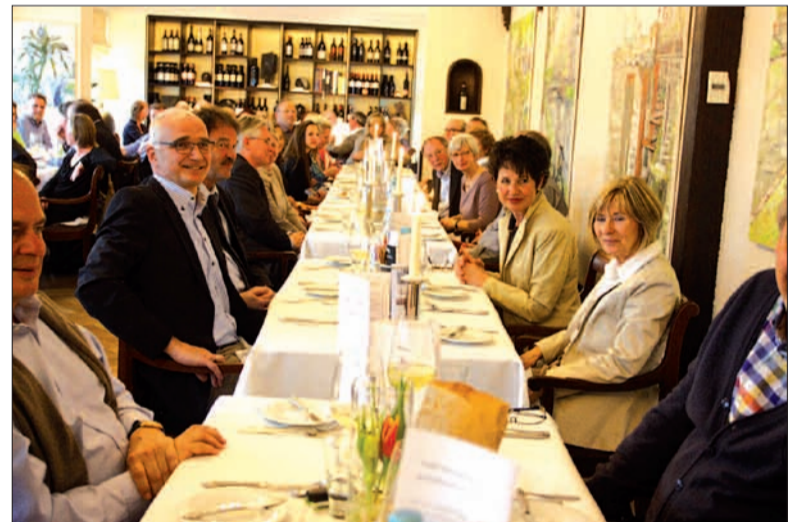
Prall gefüllt war der Saal Christen und das Kaminzimmer im Haus Litzbrück.