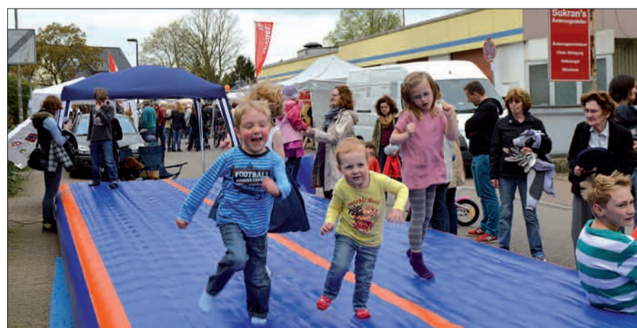
Der TV Angermund hatte ein langes Trampolin aufgestellt, auf dem die Jüngsten herrlich Toben konnten.