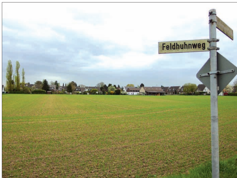
Hier am Nordrand von Wittlaer-Bockum soll aufgrund eines Gerichtsbeschlusses die vor rund 40 Jahren beschlossene dichte Bebauung reduziert verwirklicht werden.

Noch vor der Eingemeindung von Wittlaer nach Düsseldorf 1975 hatte bekanntlich der Kreis Mettmann nördlich von Wittlaer-Bockum, zwischen Wasserwerks- und Feldhuhnweg, in einem Bebauungsplan ein Baugebiet mit 110 Wohnungen, teils in mehrgeschossiger Bauweise, vorgesehen. Die Stadtwerke Duisburg als überwiegender Grundeigentümer hatte von diesem Baurecht jedoch keinen Gebrauch gemacht, so dass die Stadt Düsseldorf entsprechend dem Bürgerwillen und der politischen Beschlüsse das Baurecht zurücknehmen wollte. Dagegen hatten die Stadtwerke Duisburg vor den Verwaltungsgerichten geklagt und schließlich obliegt. Die Landeshauptstadt habe Alternativen nicht ausreichend geprüft. Auf eine Anfrage der SPD-Fraktion in der Bezirksver-