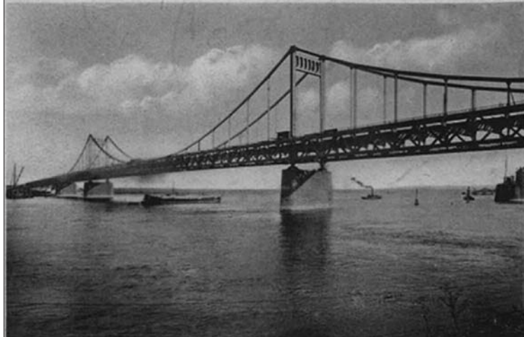
Restaurant Dammhaus 1936 an der Rampe zur „Adolf-Hitler-Brücke“ (heute Ürdinger Brücke)