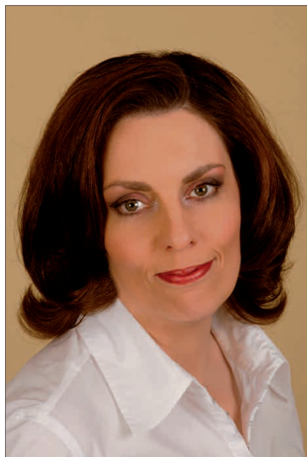
Entspannung pur - Schönheit von innen und außen.