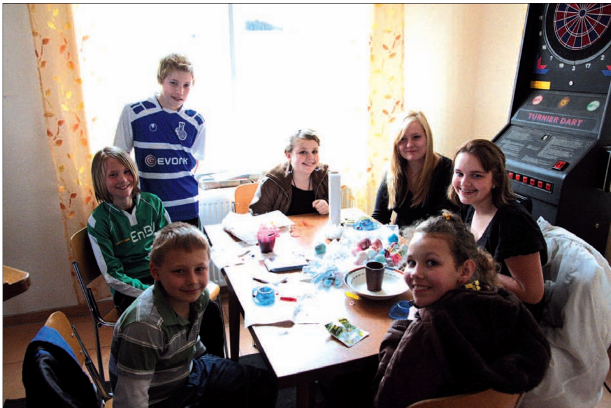
Gemeinschaftliches Eierfärben im Vereinsheim