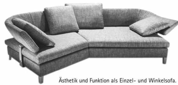
Ästhetik und Funktion als Einzel- und Winkelsofa.