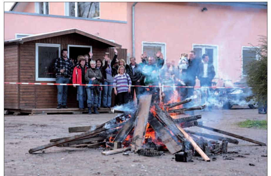
Und es brennt doch: Osterfeuer bei der Turnerschaft Rahm