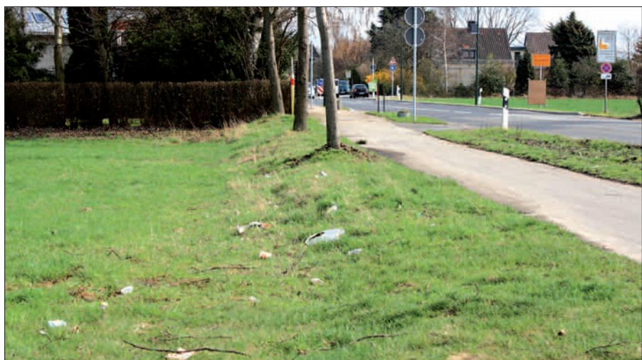
Müll ziert die Grünstreifen neben der Straße am Ortseingang West von Angermund. Keine schöne Visitenkarte für das Entrée in die Rosenstadt.