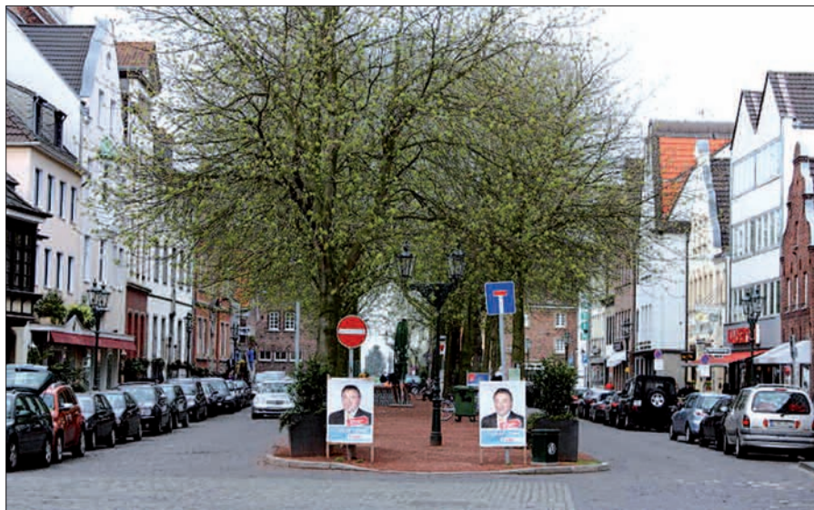
Shared Space für den Kaiserswerther Markt laut Willen des CDU Ortsverbandes

In Duisburg gibt es den Modellversuch bereits vor der Oper. Vielleicht erlaubt es zu viele Freiheiten, an die der Mensch hierzulande nicht gewohnt ist. G.S.