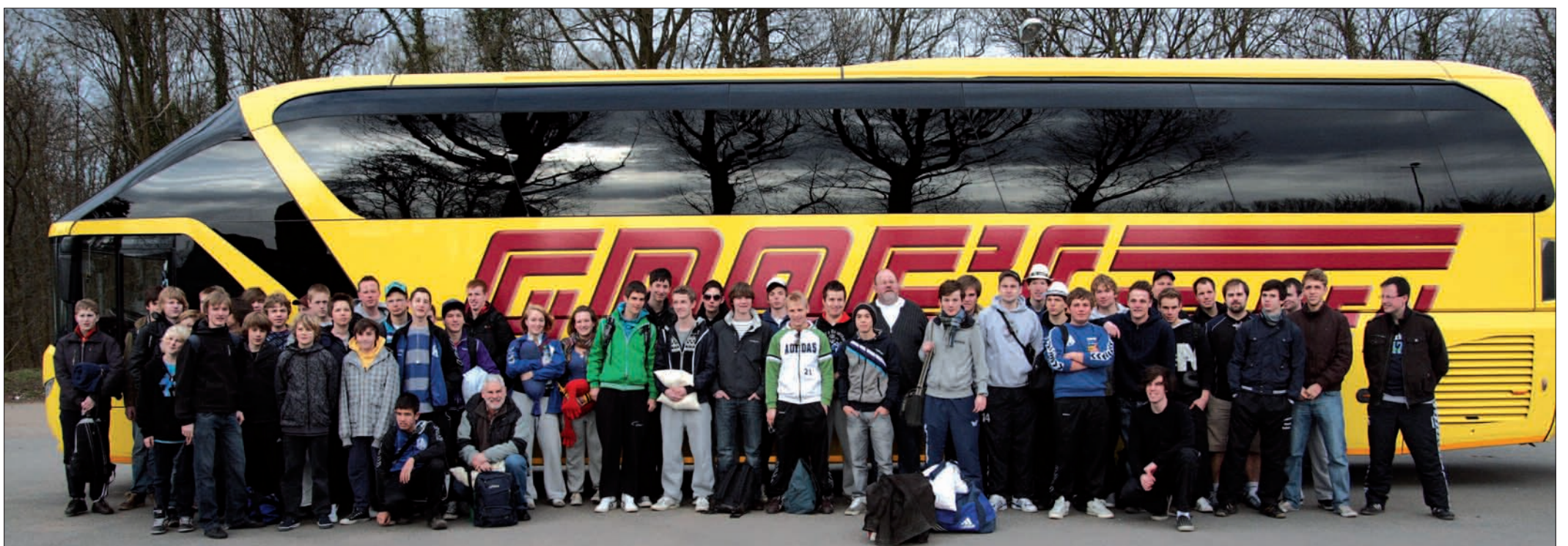
Die Handballer des TV-Angermund kurz vor der Abfahrt ins spanische Calella

selten zu denken ist. Aber am Abend des 9. April geht es ja wieder siebzehn Stunden Richtung Norden. Da wird es dann bestimmt ruhiger als auf der Hinfahrt zugehen und genug Zeit für eine Mütze Schlaf bleiben. Ulrich Spaethe