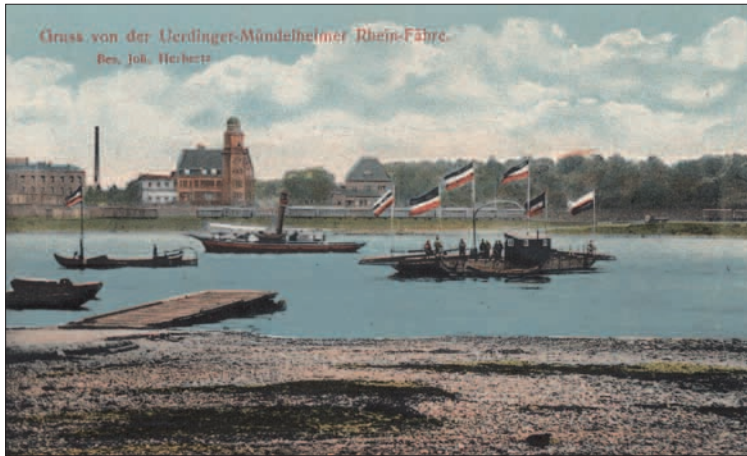
Fährbetrieb auf dem Rhein zwischen Mündelheim und Ürdingen um 1910