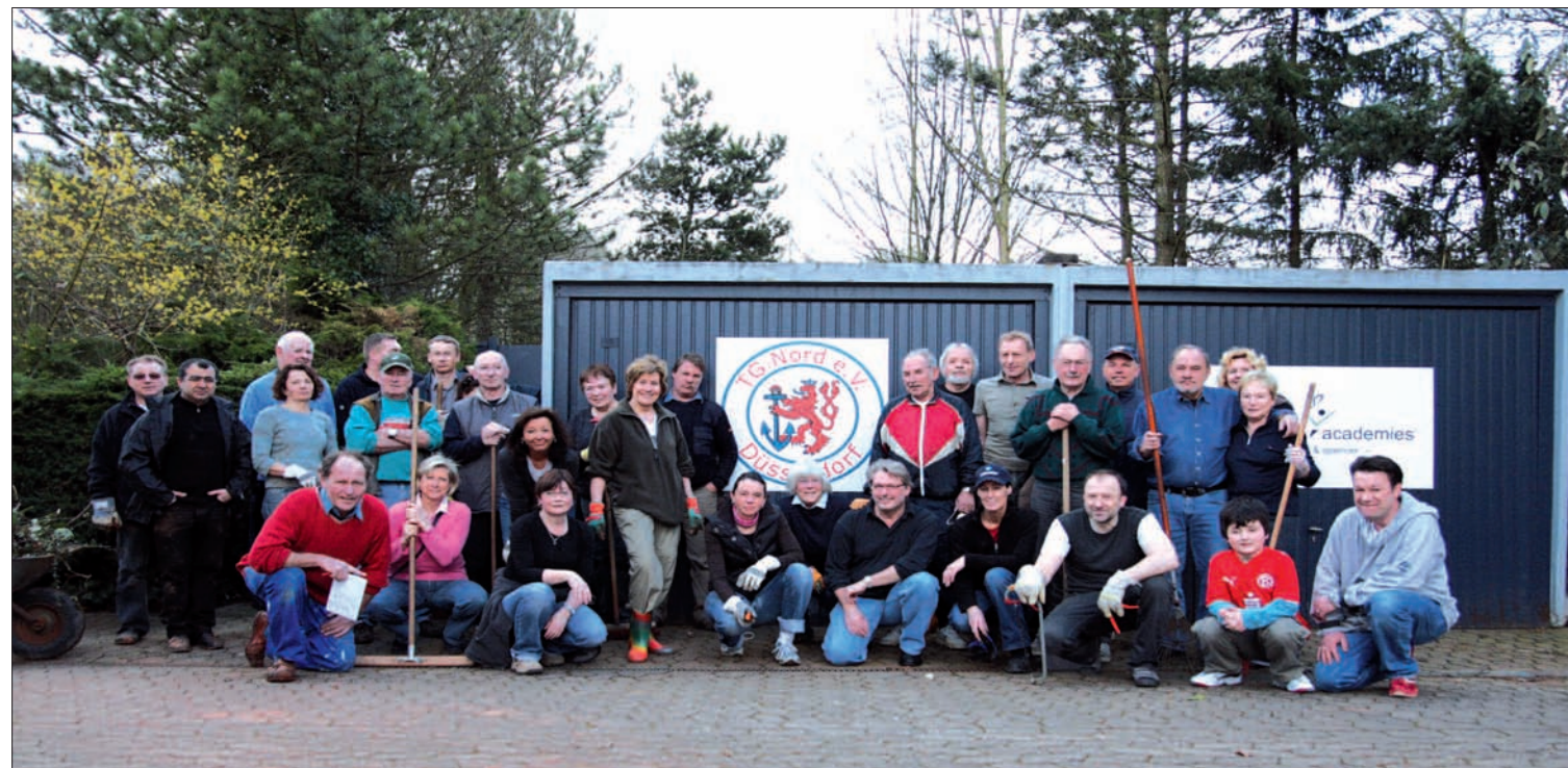
Voll ausgerüstet: Das SEK der TG-Nord