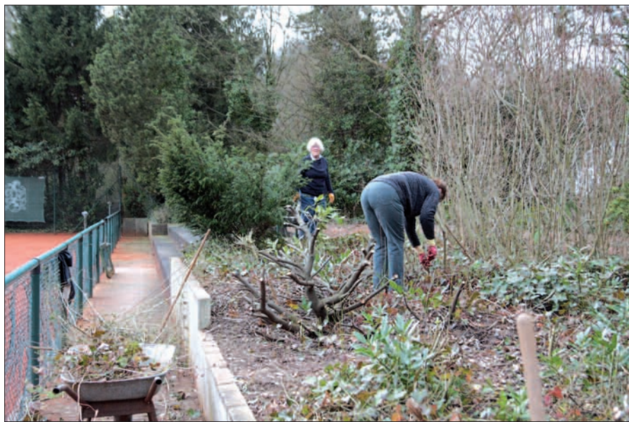
Im Geländeeinsatz: Frühjahrsputz, auch in den Grünanlagen