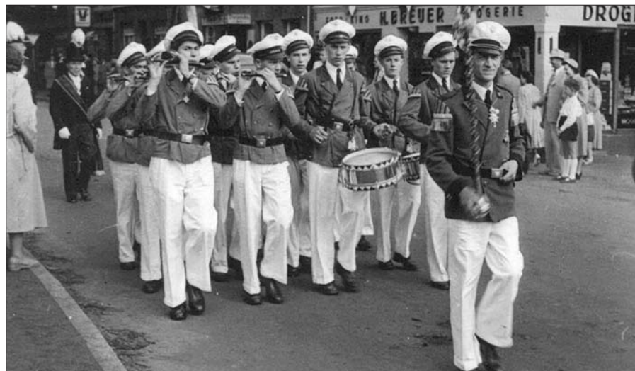
Das Tambourcorps „Rheinklänge“ Düsseldorf-Lohausen 1950 e.V.: Erster Auftritt beim Kaiserswerther Schützenfest im Jahr 1954 Text: U. Spaethe