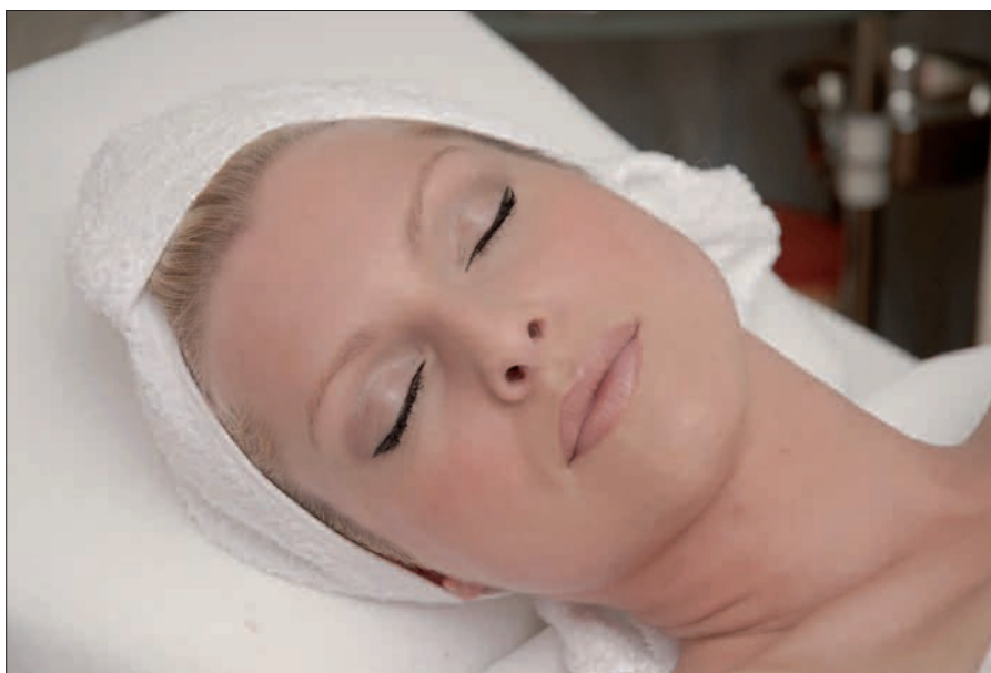
Jeden Monat überrascht sie ihren ausgewählten Kundenstamm mit neuen Extrabehandlungen.