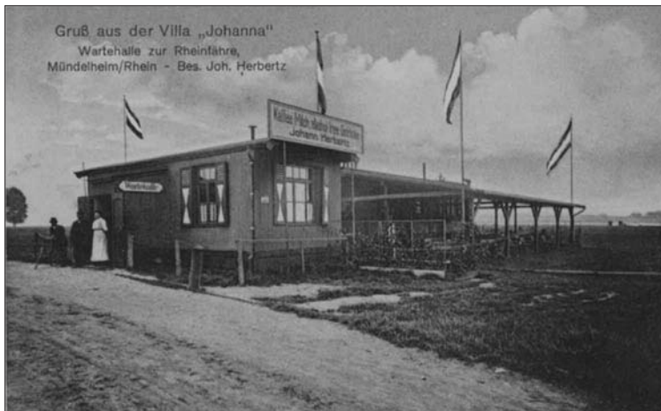
„Villa Johanna“ am Fähranleger im Mündelheimer Bogen (20er Jahre)