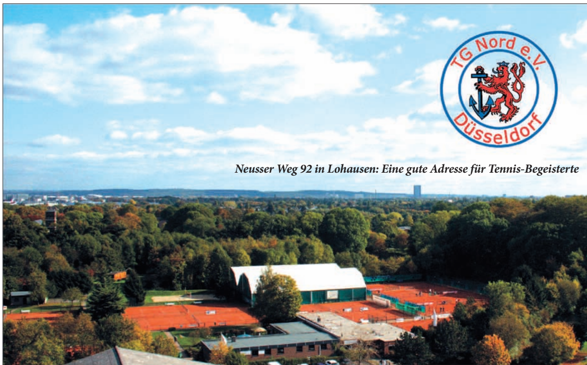
Neusser Weg 92 in Lohausen: Eine gute Adresse für Tennis-Begeisterte

Von der Vergangenheit Am 1. Januar 2007 fusionierten die benachbarten Vereine TC am Park und TC Lantz zur TG-Nord am Lantz'schen Park e.V., die aktuell 450 Mitglieder zählt. Neben vierzehn Außen-Aschenplätzen, die teilweise mit Flutlicht ausgerüstet sind, und zwei Hallen-Aschenplätzen, verfügt der Verein über einen Beachtennis- und -Volleyballplatz, einen Fitnessraum sowie eine Sauna. Seit 2008 weiß der Club mit der Düsseldorf Academies einen verlässlichen Partner an sei-