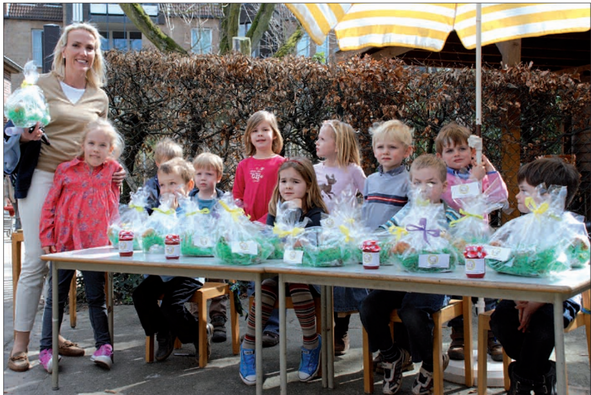
Selbstgemachtes für einen guten Zweck – das Geschäft brummt.

Kindern aus Haiti, über deren dramatische Situation sie in der letzten Zeit viel erfahren haben. Die Aktion kommt gut an, nicht nur bei den 3- bis 6-Jährigen, sondern auch bei ihren Kunden, den Müttern, Vätern, Omas und Opas. So gut, dass schon bald nachproduziert werden musste.