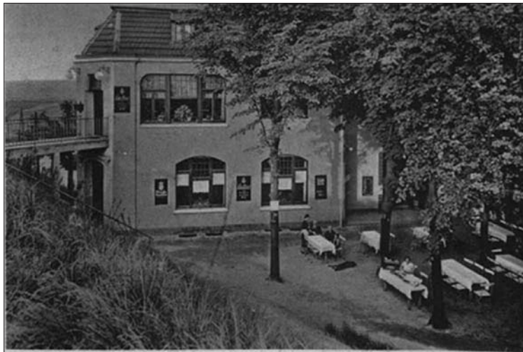
Rest. zum Dammhaus an der Adolf Hitler Rheinbrücke Duisburg Mündelheim