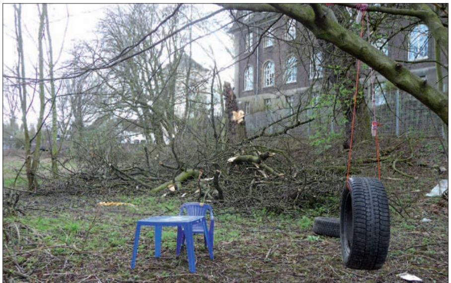
Alarm ist bereits geschlagen, aber bis die morschen Kastanien gesichert oder gefällt sind, stehen den Eltern der hier spielenden Kindern die Haare zu Berge. Es wird zudem als eine Schande für die Landeshauptstadt gesehen, dass die historischen Festungsanlagen in Kaiserswerth über Jahrzehnte so vernachlässigt werden.