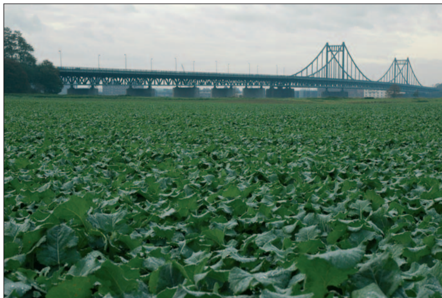
Das Stromvorland im großen Rheinbogen von Mündelheim und EHINGEN mit der Krefelder Rheinbrücke.