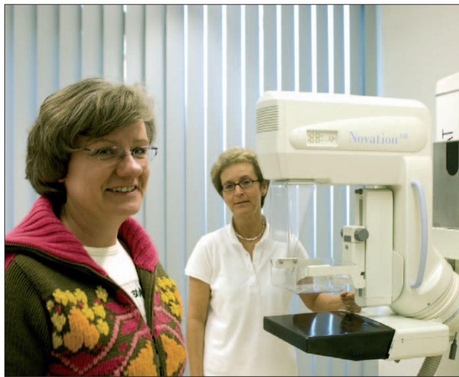
„Mammographie“: Mit einem digitalen Gerät für Vollfeld-Mammographie wird die Brust der Frau geröntgt.