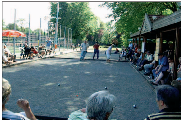
Gemütlich und sportlich geht's zu beim Boule du Nord in Wittlaer. Text: Gabriele Schreckenberg

Zwei besondere Gymnastik-Kurse bietet der TV Kalkum/Wittlaer wieder an: Beckenboden-Gymnastik und Step Aerobic. Von den Krankenkassen wird die Beckenboden-Gymnastik längst als Präventivmaßnahme anerkannt. Dass ein gekräftigter Beckenboden vorbeugt, ist längst bekannt. Die neuen Kurse beginnen am 3. April, immer donnerstags von 18.30 bis 19.45 Uhr. 20 Euro für Mitglieder, 40 für Nicht-Mitglieder, 30 Euro für Wiederholer, Infos unter 0203/746 376.