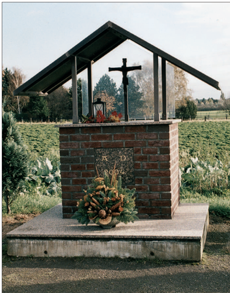
Neuzeitliches Wegekreuz am Südrand von Serm.

Vor 4 Jahren ist an der Bokkumer Str. am Südrand von Serm ein Wegekreuz aufgestellt worden. Es erinnert an ein früheres Wegekreuz auf der gegenüberliegenden Straßenseite. Wegekreuze gab es früher im Umfeld von Serm mehrere, leider sind sie verschwunden und die Standorte in Vergessenheit geraten. Sie waren teils aus Dank, teils in Erinnerung an (überstandene) Katastrophen errichtet worden und waren Stationen bei den früher noch häufigeren Prozessionen. Eine große Prozession jeweils am Sonntag vor Pfingsten führte bis 1831, als Huckingen zur Pfarrei erhoben wurde, in aller Frühe von Mündelheim nach Huckingen, wo ein Hochamt abgehalten wurde, zur Sandmühle, nach Holtum und Rheineim und dann zurück nach Mündelheim. Das war eine große Prozession rund um Serm. Eine der Stationen war ein steinernes Kreuz an der Holtumer Mühle. Es war zur Erinnerung an einen Wirbelsturm errichtet worden, der seinerzeit großen Schaden angerichtet hatte. Die Inschrift ist nicht exakt überliefert (Karl Heck im Düsseldorfer Tageblatt 1920): IESV CRUCIFIXO ET SANCTAE TRANS FIXAE PRO PAROCHIA VVITTLER CONSE