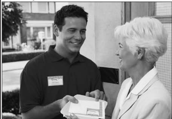
Freundliche Menükuriere bringen das heiße Essen von „apetito zuhaus“ direkt ins Haus.