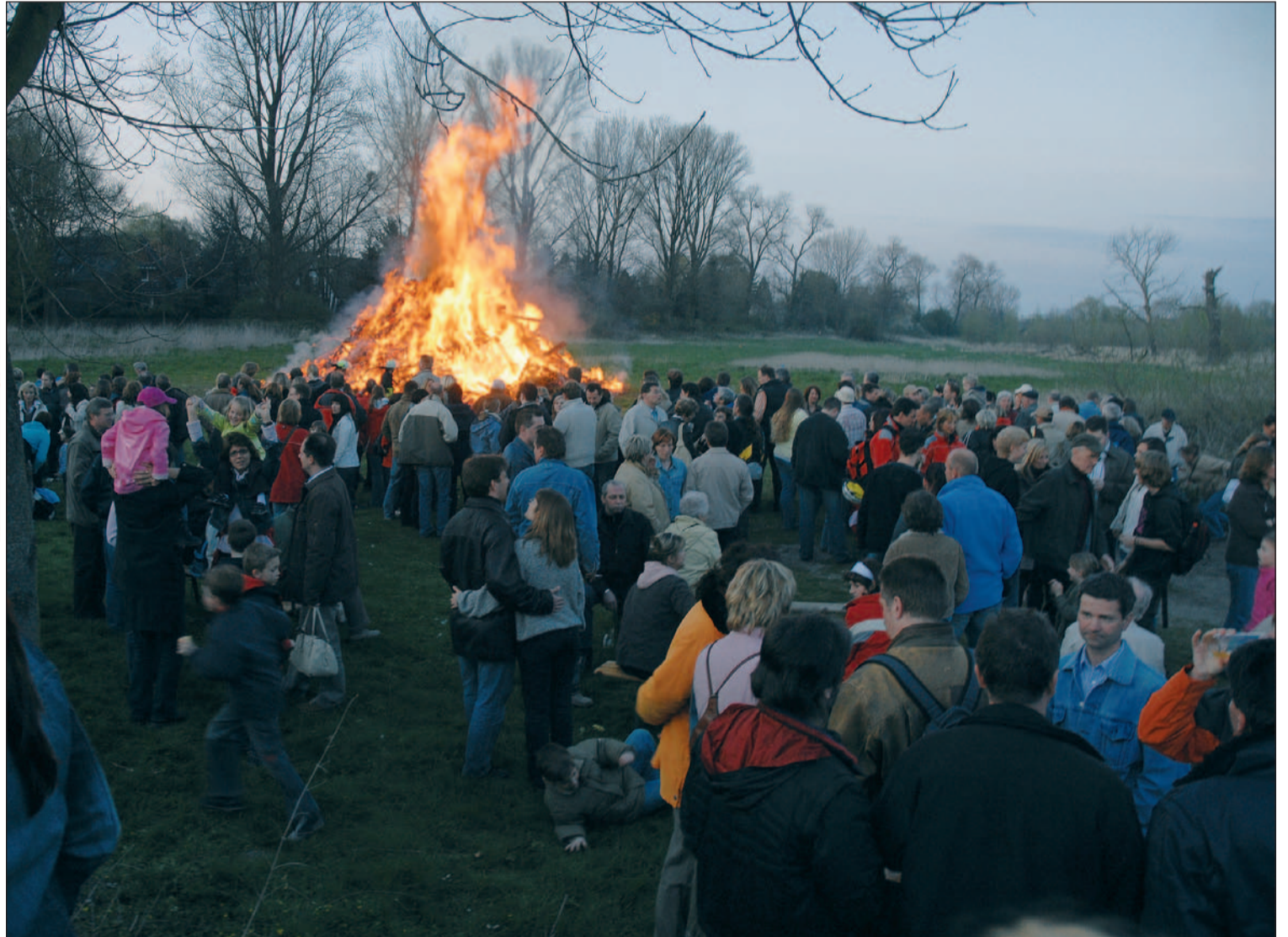
Gebannt schauen die Besucher in die Flammen des Osterfeuers, das am Ostersonntag auf dem Gelände von Haus Böckum in Huckingen angezündet wurde. Dazu hatte auch dieses Mal die CDU des Duisburger Südens eingeladen.

folgt. Ein riesiger Reisighaufen wurde bei Einbruch der Dunkelheit entfacht. Aus den umliegenden Ortschaften waren weit über 1500 Gäste gekommen. Gefeiert wurde mit Eier-Pätschen, Eier Essen, Speisen und Getränken bei fröhlicher Musik und viel guter Laune.