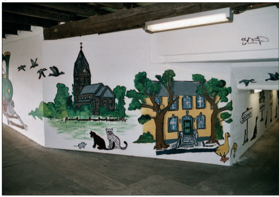
Fortsetzung von Seite 1

Kunst aus Kinderhand statt Schmierereien schlecht erzogener Jugendlicher in der Fußgängerunterführung „An den Kämpen/Zur Lindung“ in Angermund dank der Unterstützung durch die Werbegemeinschaft Handwerk und Handel in Angermund e.V. Text & Foto: HS