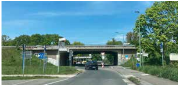
Nach derzeitiger Planung des Rückbaus der B8 alt soll der Start im Bereich der Anschlussstelle Huckingen (A524) und des Apfelparadieses erfolgen.

„Zu den Kosten können aufgrund der aktuellen wirtschaftlichen Entwicklungen derzeit keine abschließenden Aussagen getroffen werden.“ sam