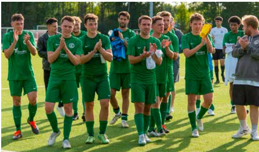
Die LSV-Herren freuen sich auf das Endspiel um den Kreispokal auf der eigenen Anlage am Neusser Weg. Gäste sind Pfingstmontag willkommen.

Ob noch weitere Teams aus Lohausen um den Siegpokal spielen werden, wird noch in den Halbfinalen ermittelt: Das Ü32-Finale wird um 12 Uhr angepfiffen. Es spielen jeweils die Sieger aus den Partien ASV