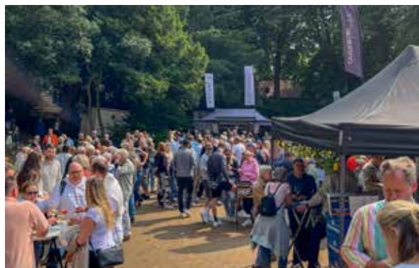
Das Weinfest „KaiserWein“ in der Kaiserpfalz Kaiserswerth geht zu Pfingsten 2026 in die zweite Runde