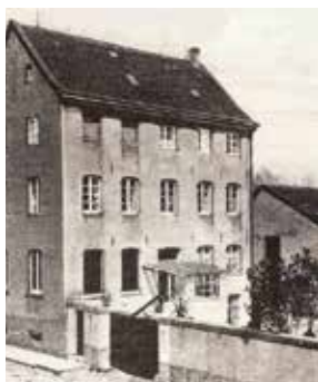
Das ehemalige Marienkloster stand in der Graf Engelbert-Straße.