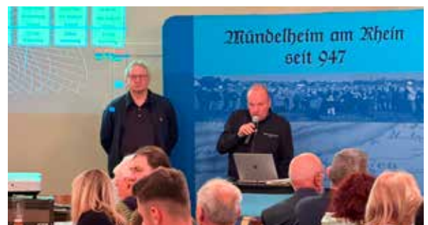
Mehr als 50 Personen waren zur Jahreshauptversammlung in die Gaststätte Kreifelts gekommen.

Weitere Themen umfassten die Verzögerung des Glasfaserausbaus und Fortschritte bei der Deicherneuerung. Der Bürgerverein setzt sich für den sicheren Ausbau von Schulwegen und die Verbesserung der Parkplatzsituation ein. sam