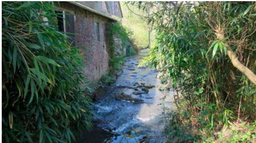
An der Einbrunner Papiermühle fließt der Schwarzbach einem Gebirgsbach ähnlich und durchgängig für Fische, wird aber von standortfremdem, invasivem Bambus gesäumt.

Das Spaltwerk im Kalkumer Wald lässt bei Hochwasser nur so viel Wasser nach Kalkum durch, dass die nahen Wohngrundstücke geschützt sind. Überschüssiges Wasser fließt über den Entlastungsgraben am Flughafenzaun in den Kittelbach und ins Hochwasserrückhaltebecken Kalkum.