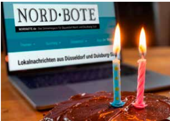
NORDBOTE.de feierte zweiten Geburtstag.

NORDBOTE.de feierte Ende April seinen zweiten Geburtstag. Vor zwei Jahren startete das Onlinemagazin für Düsseldorf-Nord und Duisburg-Süd. Der Zuspruch aus der Leserschaft ist seitdem überwältigend und bestätigt den eingeschlagenen Weg. Im Mittel-