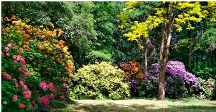
Von Ende April bis Mitte Mai verwandelt sich der Schlosspark Heltorf in Angermund in ein blühendes Farbenmeer.

Wer den Park besuchen möchte, kann sich auf der Website von Schloss Heltorf www.forst-graf-spee.de/schlosspark-heltorf über aktuelle Öffnungszeiten informieren. Festes Schuhwerk wird empfohlen. ah