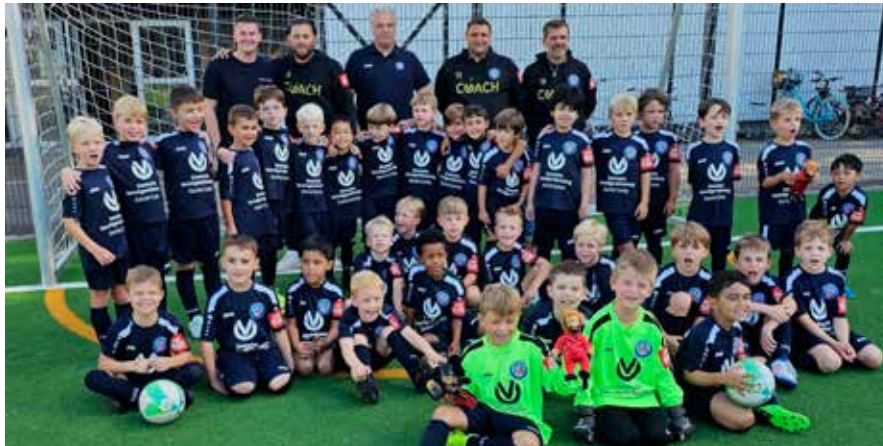
Immer mehr Kinder möchten beim TV Angermund Fußball spielen. Gesucht werden derzeit eine sportliche Leitung für die jüngsten Mannschaften, Trainerinnen und Trainer für die Jugend sowie Stürmer und ein Torwart für die „1. Herren“.

Vor dem Start in die Saison 2026/27 sucht der TVA eine Betreuerin oder einen Betreuer als sportliche Leitung für die Bambini bis zur