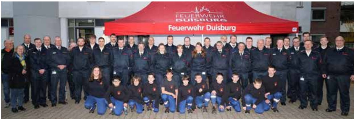
Der Löschzug 710 zählt mit 38 aktiven Ehrenamtlern sowie 25 Mitgliedern von Jugendfeuerwehr und Ehrenabteilung zu den mitgliederstarken Einheiten der Freiwilligen Feuerwehr (FFW) in Duisburg.

den Brandschutz Rechnung trägt, Abläufe und Alarmierungswege verbessert und eine effizientere Einsatzfähigkeit ermöglicht.“ sam