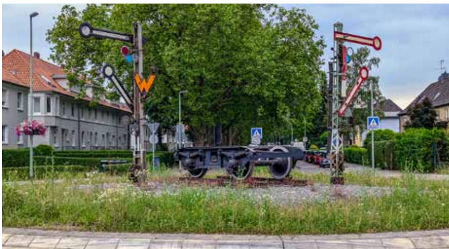
Das Bahn-Denkmal auf dem Kreis an der Wedauer Straße/Kalkweg ist längst fester Bestandteil des Stadtteilbildes.

einen wertvollen Lebensraum, sondern wertet auch das Ortsbild deutlich auf. Für viele Wedauerinnen und Wedauer ist der Kreis längst mehr als nur eine Verkehrsfläche – er ist ein Ort, an dem die Geschichte des Stadtteils lebendig bleibt. Diskutiert wird, ob die beiden Bahnsignale in die richtige Richtung weisen.