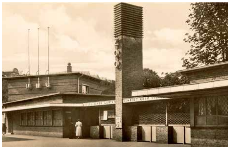
Der Eingang des Zoologischen Gartens Düsseldorf an der Brehmstraße – das Gelände wurde im Zweiten Weltkrieg vollständig zerstört.

Der ursprüngliche Zoo an der Brehmstraße wurde im Zweiten Weltkrieg vollständig zerstört. Als Neuanfang kehrte eine zoologische Einrichtung in Form des „Löbbecke-Museum und Aquarium“ in die Stadt zurück. Seit 1987 ist das Haus unter dem Namen „Aquazoo Löbbecke Museum“ im Nordpark beheimatet. ah