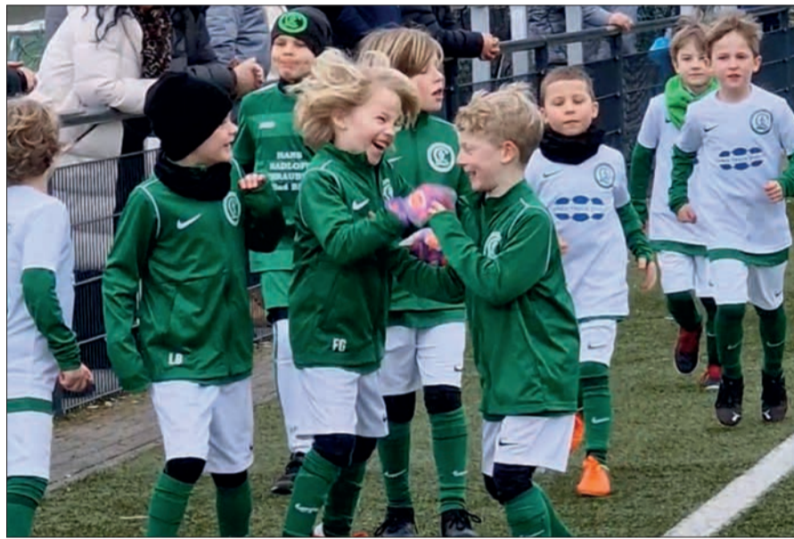
Die Jungs und Mädels der LSV- F1, -G1 und -G2 liefen zusammen mit den Mannschaften und dem Schiedsrichter auf den Platz ein.