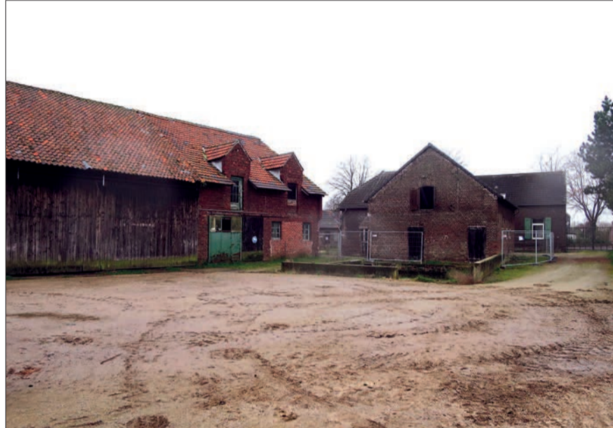
Teilansicht der Hofanlage Unterdorfstraße 5 von Osten.

Ein Bauantrag, den die Bezirksvertretung 5 Ende September 2022 abgelehnt hatte, lag ihr jetzt erneut vor und fand Zustimmung. Er sieht vor, die Hofanlage Unterdorfstraße 5 in eine Wohnanlage umzuwandeln. Zwei Gebäude mit Denkmalwert werden restauriert bzw. umgebaut, eines aus technischen Gründen erneuert. Auf dem Innenhof sind zwei Neubauten vorgesehen. Insgesamt entstehen elf Wohneinheiten. Die nördlich gelegene Wiese im Zipfel von Einbrunger Straße und Gerichtsschreiberweg bleibt als Außenbereich unbebaut. Es sind 14 Kfz.-Stellplätze bzw. Garagen auf dem Grundstück nachzuweisen. Zufahrten gibt es sowohl von der Einbrunger Straße als auch von der Unterdorfstraße her. Im ursprünglichen von landwirtschaftlichen Höfen und Kotten geprägten Kalkumer Unterdorf bleibt dann nur noch eine große, repräsentative Hofanlage: der unter Denkmalschutz stehende Niederhof Unterdorfstraße 2. Das Hauptgebäude war 1784 errichtet worden. Für das Gebiet nördlich der Einbrunger Straße, zwischen Niederhof und Gerichtsschreiberweg, ist ein Bebauungsplanverfahren gestartet und der Öffentlichkeit 2020 vorgestellt worden. Es sollen dort Reihenhäuser errichtet werden. H.S.