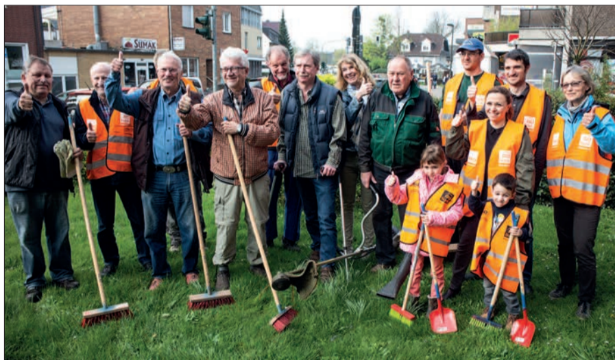
Das Archivfoto zeigt einen Teil der Truppe gut gelaunt beim Start der Säuberungsaktion vor wenigen Jahren vor Lindenlaubs' Buchhandlung. Text und Foto: Volker Jipp

gern gesehene Gäste. Das Ende der Veranstaltung ist für ca. 12 Uhr geplant. Um eine kurze Voranmeldung unter der Tel.-Nr. 0203/74 0337 (Lindenlaubs' Buchhandlung) wäre man dankbar. Über eine rege Beteiligung der Bevölkerung würde sich Handwerk und Handel sehr freuen. VJ