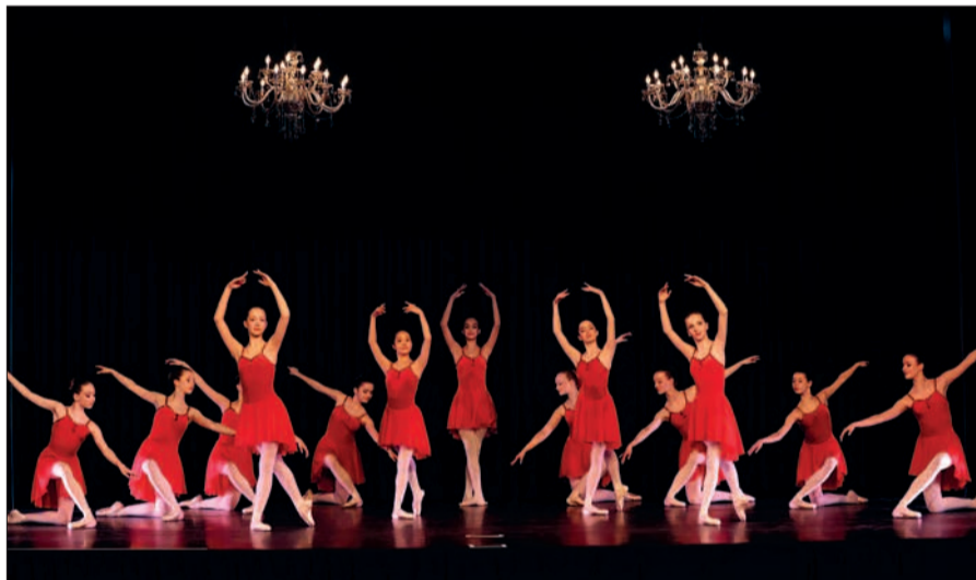
Ein bezauberndes Abschlussbild der Ballettschule Kaiserswerth.