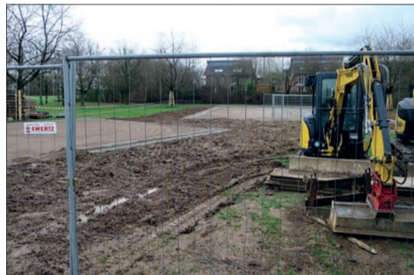
Der noch nicht ganz fertiggestellte „Bewegungspark“ in Wittlaer-Einbrungen (Teilansicht). Links der Basketballplatz, rechts der Bolzplatz.