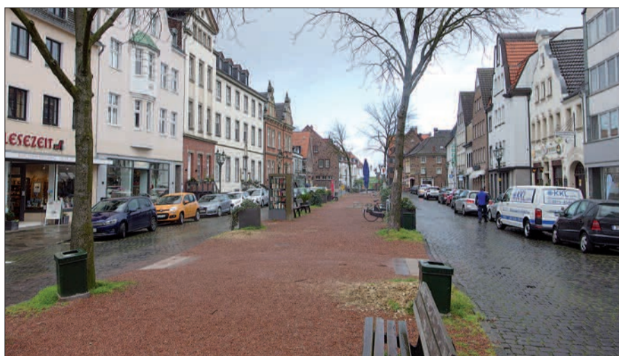
Der Kaiserswerther Markt ist auch mit nur vier „schwer kranken“ Kastanien ein ansprechender Platz, Mittelpunkt und Herz der Altstadt von Kaiserswerth.

nalbau, archäologische Untersuchungen und die Anforderungen an Starkregenereignisse. Es gibt aber für die bisherige Planung keine Zuschüsse, auch nicht, wenn nur die Mittelinsel umgestaltet wird. H.S.