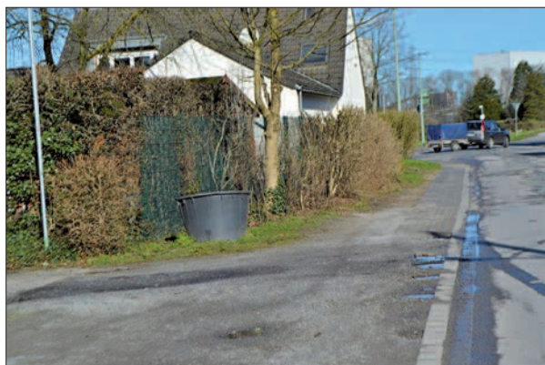
Oft ist dieser Gehweg zugeparkt, und die Schüler müssen auf die Straße ausweichen. Eine Erhöhung soll hier Abhilfe schaffen.

ner Schule einzugreifen.“ Ploum ergänzte: „Ich erwarte Eigeninitiative an der Schule, das darf nicht über die BV gehen. Die Verwaltung hat genug zu tun.“ Norbert Broda (Linke) entgegnete: „Eltern, die gerne ein warmes Mittagessen hätten, wandern in andere Stadtteile ab.“ sam