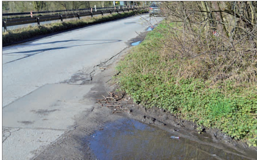
Wegen vieler Schlaglöcher sowie reinragender Sträucher nutzen die Verkehrsteilnehmer oft auf der Straße „Am Heidberg“ in Ungelsheim die Straßenmitte. Die BV Süd fordert, die Gefahren zu beseitigen.

Schlaglöcher und den reinragenden Sträuchern könnten Fußgänger und Radfahrer die Straße nicht gefahrlos nutzen – alle seien fast mittig unterwegs. Auch gegenseitiger Verkehr berge gerade im Kurvenbereich diesbezüglich Gefahrenpotenziale. Weiterhin würden alle Verkehrsteilnehmer in Richtung Ungelsheim im Dunkeln durch den Verkehr auf der B 288 geblendet. Für Abhilfe könnten Blendschutzsysteme auf den Leitplanken der Bundesstraße sorgen, die vor längerer Zeit abmontiert worden waren. Für die SPD stimmte Hartmut Ploum zu: „Die Straße wirkt verwahrlost. Das ist eine ziemlich üble Kiste.“