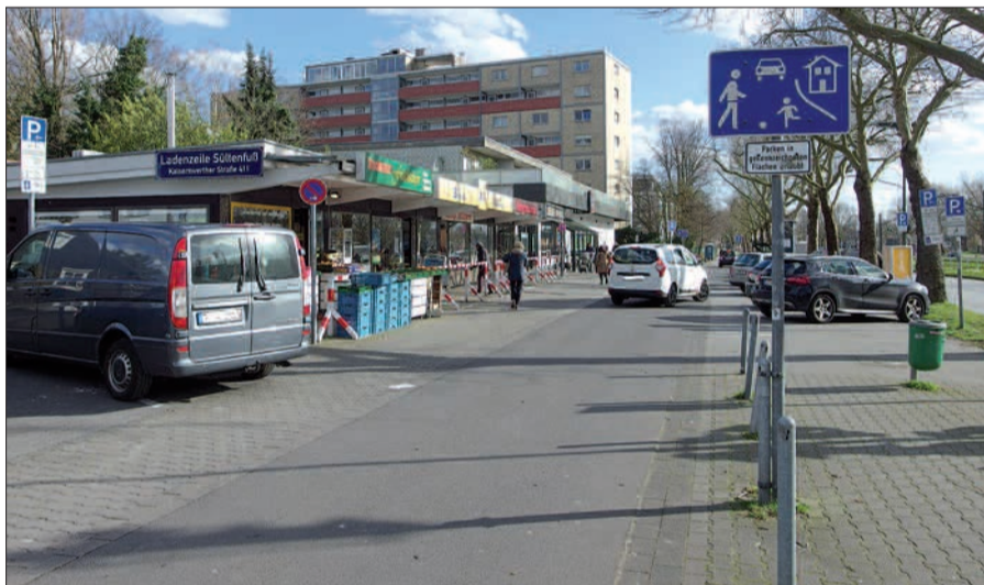
Direkt vor der Ladenzeile im Zentrum von Stockum verläuft ein Radhauptweg.

mangelhafter Wartung??) vom Nordpark zur Rheinuferpromenade nur durch eine Bedarfsampel ersetzt werden soll, deutet er als Geringschätzung des wunderbaren Nordparks mit Aquazoo. Die Messeplaner haben dagegen zwei direkte Übergänge vom außergewöhnlich repräsentativen und großzügigem Eingang Süd zum Nordpark vorgesehen. Er steht kurz vor der Fertigstellung und dürfte in Zukunft zu den Stockumer Sehenswürdigkeiten zählen. Die Stadtverwaltung teilte jetzt der Bezirksvertretung mit, sie konzentriere sich beim Ausbau des Radweghauptnetz zunächst auf Strecken mit dringenderem Handlungsbedarf. Unser Leser bedauert auch, dass die Verwaltung mitteilt, sie befasse sich derzeit nicht