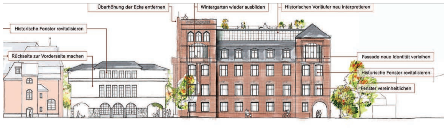
Copyright Plan: RKW Architektur+ Investor: kueppersliving Immobilienentwicklung GmbH & Co. KG, Landschaftsarchitektur: FSWLA, Visualisierung: Form-tool Anton Kolev.

gen sorgfältig geplant hat. Auch sein Entwurf war spannend, stellte auch Kunst des Kaiserswerther Bildhauers Thomas Schönauer mit ins Zentrum, ebenso wie Gastronomie und Büros. Doch der Gewinner ist diesmal das Düsseldorfer Büro RKW Architektur und die Kueppersgruppe Krefeld. Wie es weitergeht? Mit viel Geduld. Denn das Projekt wird Zeit brauchen. Vor Jahresende werden die Verträge mit den Beauftragten nicht fertig sein. Und in den nächsten zweieinhalb Jahren wird hier nichts begonnen. Und irgendwann gibt es hier ein neues Quartier, das für Vielfalt und Gemeinschaft stehen soll. G.S.