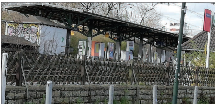
Der S-Bahnhaltepunkt in Angermund. Wie es hier aussehen wird, wenn der RRR kommt, bleibt abzuwarten. Optimisten glauben, dass der Bahnhof barrierefrei wird, mit einem hübschen Dach und Aufzug versehen werden wird. Doch die Deutsche Bahn hat schon oft anders entschieden als versprochen.

Die Bürgerinnen und Bürger in Angermund fühlen sich mehr und mehr von der Stadt im Stich gelassen. Ob es um das Mobilitätskonzept geht, die bessere ÖPNV-Verbindung, besonders mehr Haltestellen für Busse, die für manche Menschen, die etwa an der Bahn wohnen, weit entfernt liegen. Stichwort Bahn. Die Initiative Angermund hat sich zu Wort gemeldet und die Planung für den S-Bahnhaltepunkt kritisiert. Denn der Bahnhof ist gar kein echter Bahnhof, sondern eben nur ein Haltepunkt, ein schäbiger, in die Jahre gekommener dunkler Angstraum, wie viele finden. So ist nun im Zuge der Rhein-Ruhr-Express Vorbereitungsplanungen die Rede von Haltestellen der Linien 728 und 751 auf der