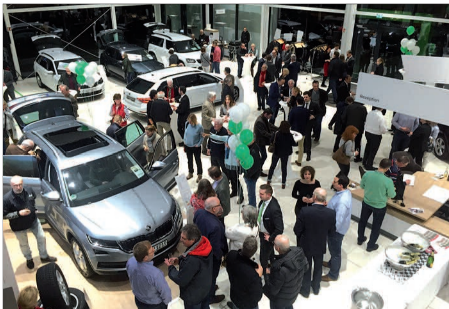
Volles Haus zur Premiere des Skoda Kodiaq und Octavia in Lohausen.

beiden meist schon in der üblichen Serienausstattung enthalten sind. Seit wenigen Wochen können beide Fahrzeugtypen im Showroom auf der Ikarusstraße besichtigt und zu Probefahrten getestet werden. Und die Idee mit dem irischen Lachs hatte einen einfachen Grund: Der Name Kodiaq stammt vom Kodiak-Bären aus Alaska. Dass dort täglich frischer Fisch verzehrt wird, ist üblich. Die Gäste konnten bei der Premiere bestens mit Lachs und Wein von Jacques Weindepot verwöhnt werden. G.S.