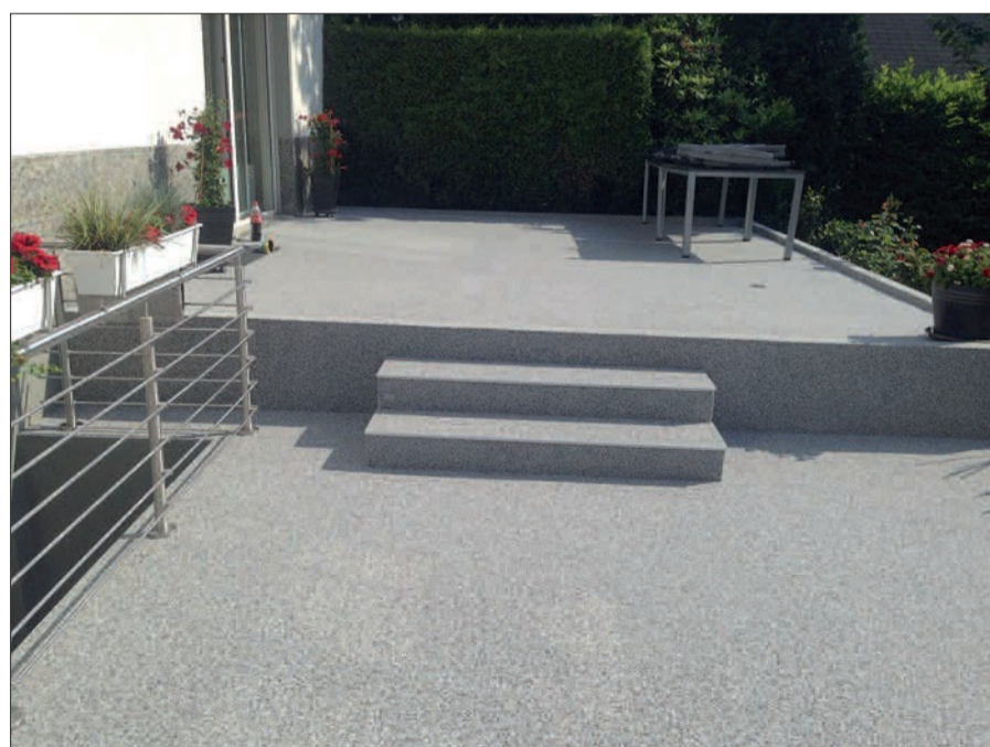
Tolle Alternative zu Parkett, Teppichboden und Fliesen - Steinteppiche vom Feinsten haben eine Fülle an Vorteilen. Hitzebeständig, für Allergiker geeignet, schnell verlegt und attraktiv für sämtliche Innen- und Außenbereiche. Isodo in Angermund ist Spezialist und freut sich auf zahlreiche Interessenten.