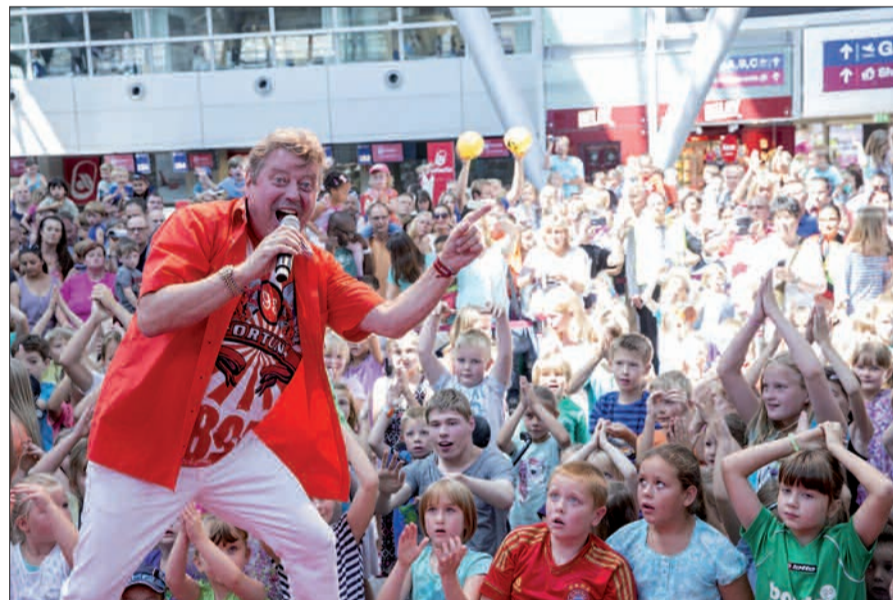
Wenn Volker Rosin auf der Bühne singt und tanzt, sind die Kinder mit Herz und Körpereinsatz dabei.