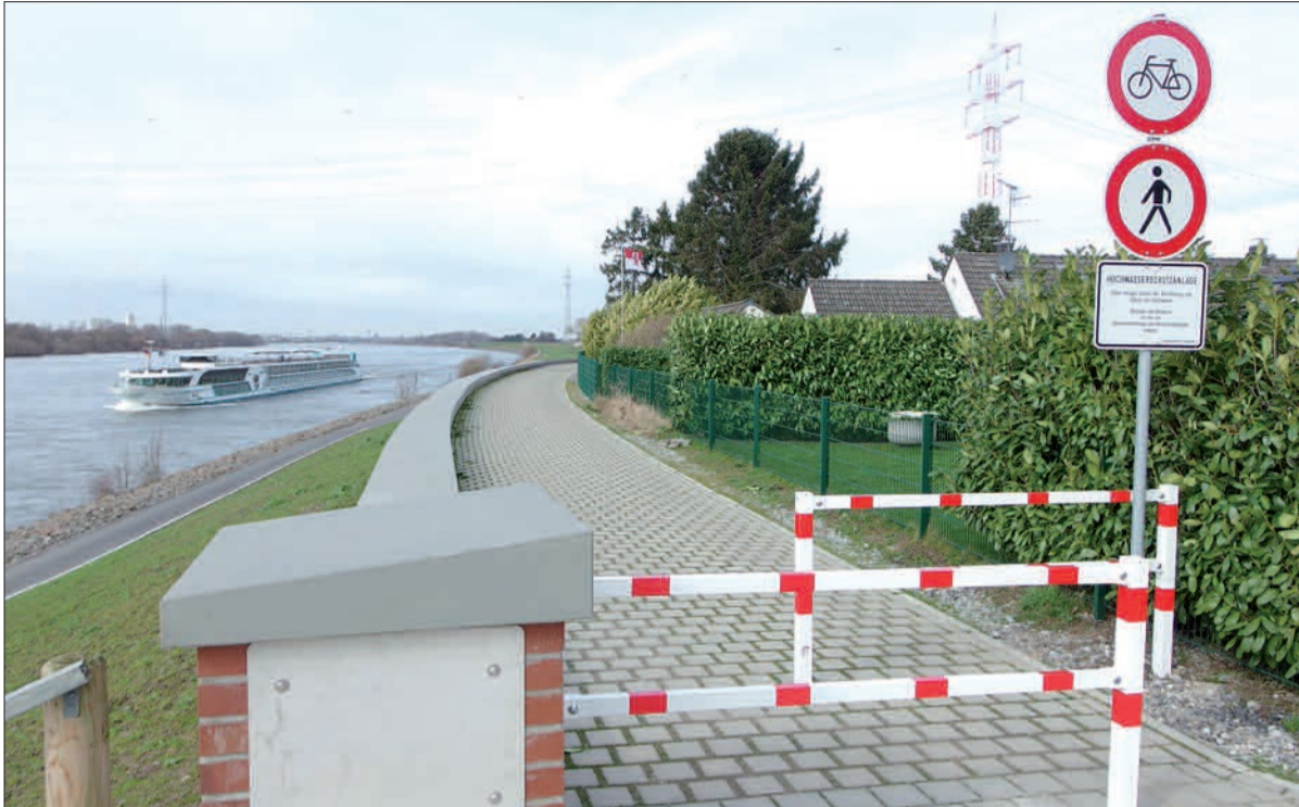
Die in Wittlaer-Bockum auf der Deichkrone als Deichverteidigungsweg angelegte „Promenade“ ist im größeren Teilstück versperrt, ab „Am Kriengarten“ aber zugänglich, wenn auch mit Verbotsschildern versehen. Links der vom Leinpfad zur Deichkrone und dann zum Aschlöksken und nach Rheinheim führende neue Weg.

Die Deichbauarbeiten bei Wittlaer-Bockum sind auf Düsseldorfer Stadtgebiet abgeschlossen. Der Fuß- und Radweg entlang des Rheins ist jetzt bis Rheinheim gut ausgebaut und durchgehend auch für Radler zugelassen. Man kann somit jetzt ohne Verbotsschilder zu missachten, immer dem Rhein entlang, den beliebten Biergarten „Aschlöksken“ erreichen. Auf der Deichkrone führt der Weg aber auch noch weiter bis Rheinheim, mit herrlichem Blick auf den Rhein und die freie Landschaft. Bei Rheinheim fehlt ein kleines Stück Deichkronenweg, weil noch ein Gehöft abgerissen werden muss. Dann geht es aber noch einige hundert Meter weiter auf dem neuen Weg. Der frühere unbefestigte Weg „Am Damm“ in Wittlaer-Bockum ist als Deichverteidigungsweg auf der Deichkrone zu einer wunderbaren „Promenade“ ausgebaut worden, aber versperrt. Der NORDBOTE hatte darüber berichtet. Zugänglich ist diese schöne