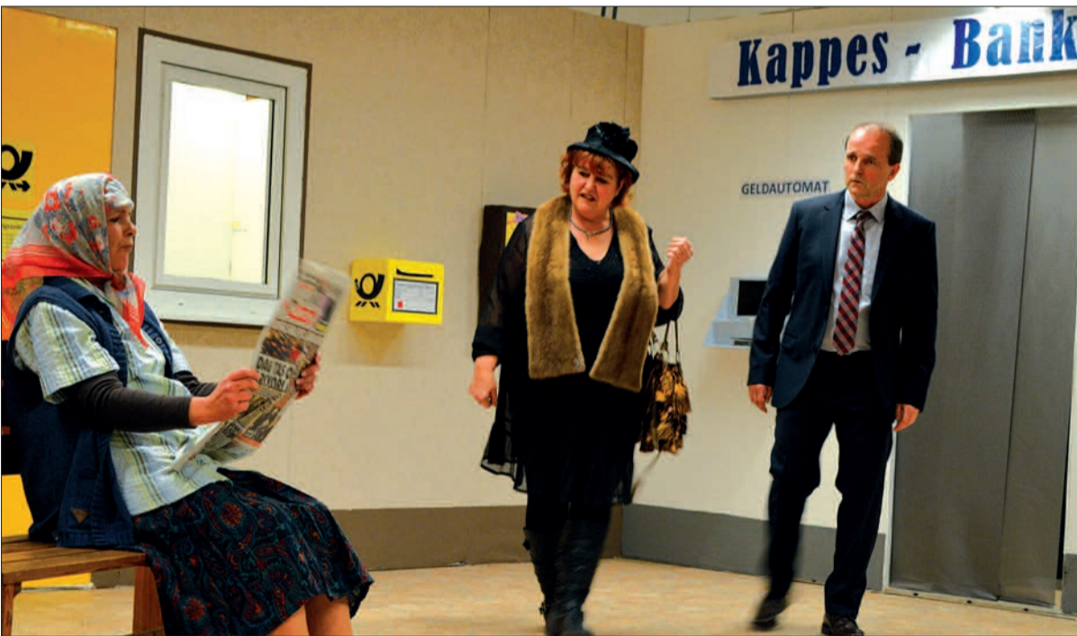
Wie im vergangenen Jahr möchte die Sermer Laienspielgruppe wieder zahlreiche Besucher im örtlichen Pfarrzentrum mit einem lustigen Stück erfreuen.