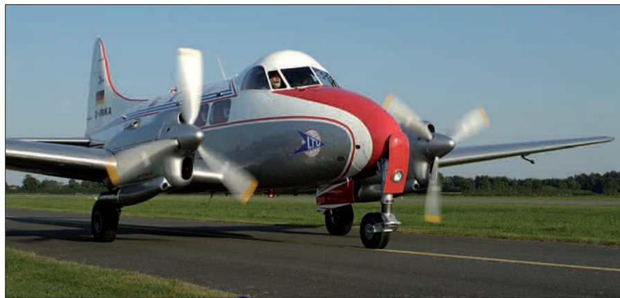
Mit einer solchen „Dove de Havilland“ mit 9 Sitzplätzen begann die Firmengeschichte der „LTU-Lufttransportunternehmen“ bereits in den 1950er Jahren.

• Shopping-Parkspecial: Parken an allen Wochenenden und NRW-Feiertagen für nur 5 Euro bis zu 6 Stun-