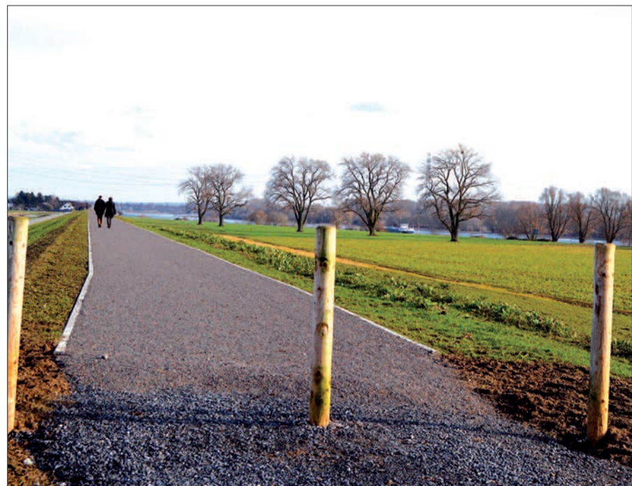
In Richtung Wittlaer kann man vom Sportplatz aus schon herrlich über den neuen Deich spazieren gehen.