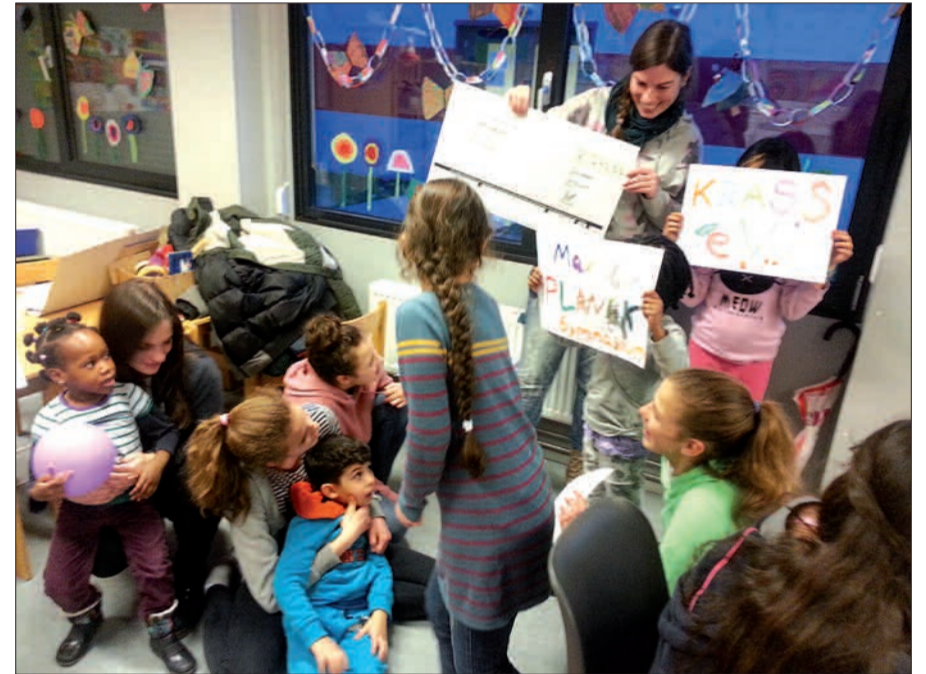
Viel Freude bei der Geldübergabe.