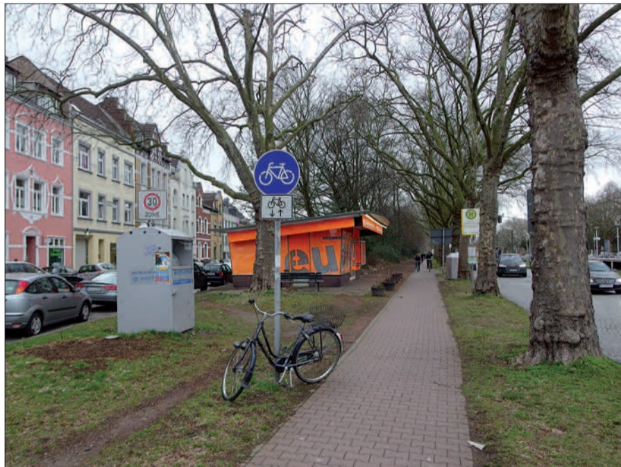
Auf der Fläche zwischen Amsterdamer- und Kaiserswerther Straße in der Stockumer Ortsmitte steht u. a. ein ziemlich heruntergekommener städtischer Pavillon/Kiosk.