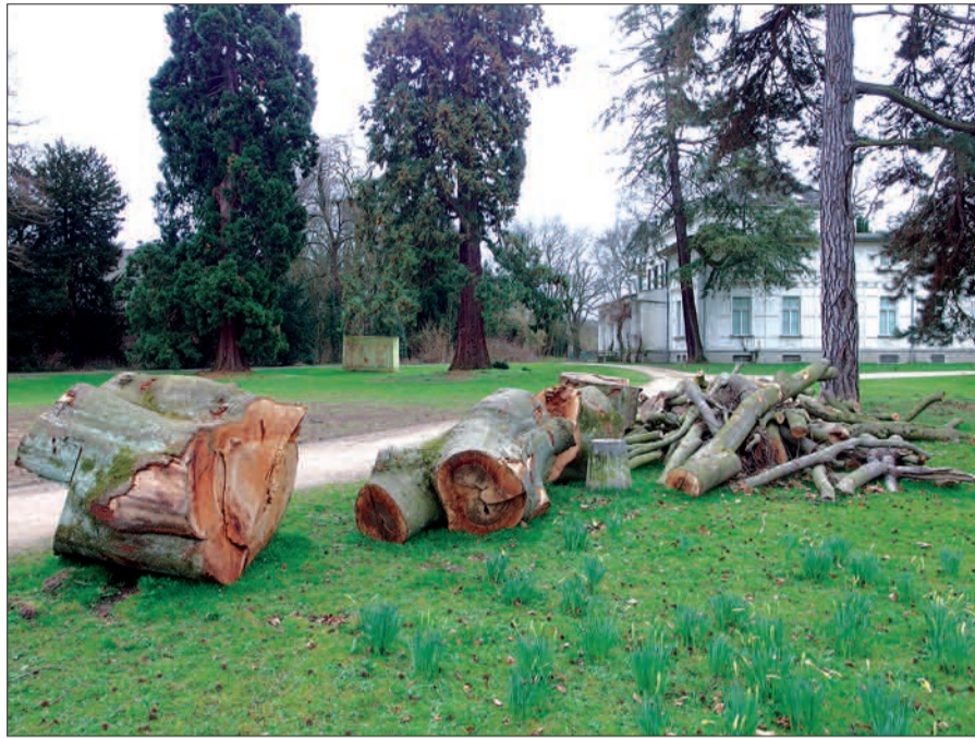
Eine große, wunderbare Buche im Lantz'schen Park musste wegen Pilzbefall (Lackporling) gefällt werden.

Schade, dass eine alte, wunderschöne Buche mit fast 2 m Durchmesser am Fuß wegen Pilzbefall (Lackporling) gefällt werden musste. Unser Foto zeigt die kläglichen Reste. Die Lantz'sche Villa, rechts im Bild, ist leider immer noch ungenutzt. Gefühlt steht sie schon seit Jahrzehnten leer. Stetiger Verfall ist nicht zu übersehen, aber sie ist gut behütet und nicht sichtbar von Vandalismus betroffen (die Dachentwässerung ist z.B. in Ordnung gebracht, im Gegensatz zum Kalkumer Schloss). Die Terrasse ist ein beliebter Sitz- und Picknickplatz, einerseits mit weitem Blick in den Landschaftspark, andererseits auf die startenden und landenden Flugzeuge. Die Lantz'sche Kapelle ist zwar ebenfalls gut behütet, aber hier haben - es ist nicht zu fassen - Baunauten den Türschmuck in Brand gesetzt, was hohen Schaden verursachte. Bekanntlich streifen gelegent-