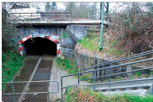
Er sieht nicht gerade einladend aus, ist aber eine ganz wichtige Verbindung zwischen Rahm-West und Rahm beziehungsweise Großenbaum: der Tunnel zwischen „Zur Kaffeehött“ und „An der Huf“.

Lob erhielt die Arbeitsgruppe Lärm im Bürgerverein für das Tempo-80-Limit auf der Autobahn. Auf Nachfrage erklärte Trappmann, dass das Limit wohl nur so lange gelten solle, bis der Lärmschutz vollständig gewährleistet sei. sam