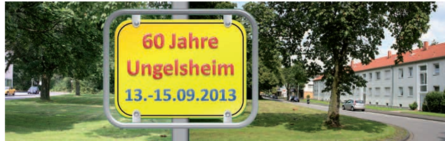
Ungelsheim ist der jüngste Stadtteil Duisburgs. Sein 60. Geburtstag soll im September groß gefeiert werden.

Sabine Lindner würde sich über viele Fotos aus Ungelsheim freuen. Auch für Anekdoten und Geschichten hat sie ein offenes Ohr. Sie ist unter der Rufnummer 0203/752097 oder per E-Mail (sabine@lindner-duisburg.de) zu erreichen. sam