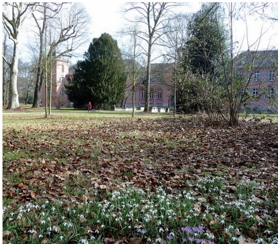
Vorfrühling im Kalkumer Schlosspark.

Auch der Heimatverein „Düsseldorfer Jonges“ hat sich des Themas angenommen. Der Heimatverein hat u. a. zum Ziel, sich für den Erhalt von Düsseldorfer Kulturdenkmälern einzusetzen. Die Bürgerinitiative Schloss Kalkum soll Gelegenheit haben, ihr Anliegen den Düsseldorfer Jonges im Rahmen einer Vollversammlung im Sommer dieses Jahres vorzustellen. H.S.