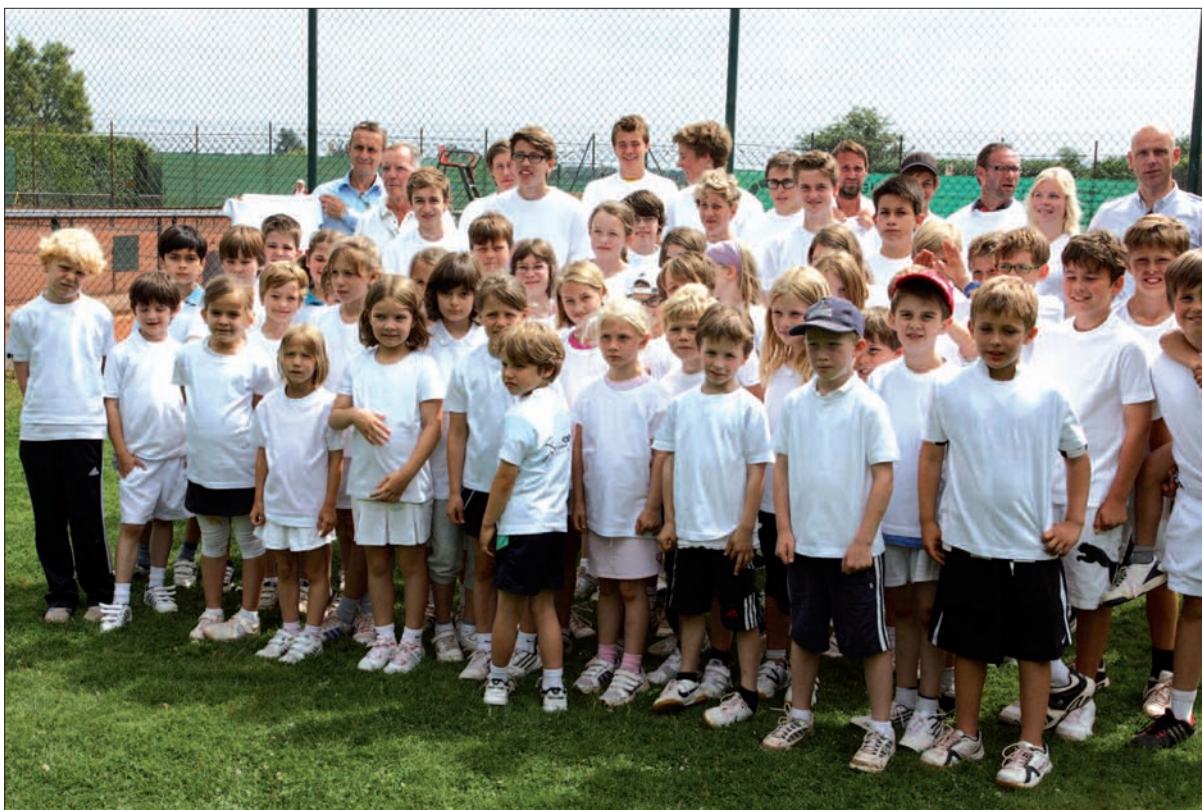
Der Tennish Nachwuchs wird im ATC besonders gefördert, nicht nur wie hier beim Sommercamp von Juli 2012.