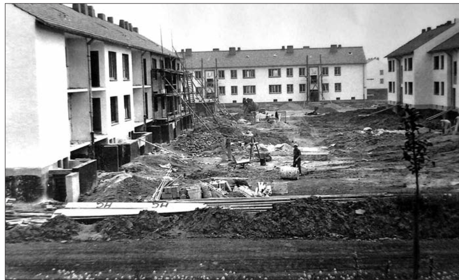
Vom Schlackenbergr (Grüner Hang) aus hatte man einen guten Blick Richtung Goslarer Straße. Links und rechts entstanden Reiheneigenheime, hinten Häuser mit den Mietwohnungen.