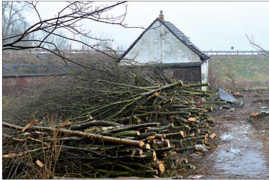
Die Bäume an der Winkelhauser Ölmühle sind schon gefallen. Ob auch das Gebäude selbst abgerissen werden darf, soll bis Ende März entschieden werden.

Braun vom Heimatverein Huckingen hat sich intensiv mit der Geschichte dieses Gebäudes beschäftigt. „Als die Herren von Winkelhausen um 1450 das Erbe von Kalkum antraten“, schreibt Braun bei der Vorstellung dieses Kulturdenkmals, „brachten sie aus ihrem Besitz zwei Wassermühlen mit: die Sandmühle und die be- nachbarte Ölmühle. Beide Mühlen gehörten wie auch Groß Winkelhausen ur- sprünglich zur Honschaft Huckingen.“ 2007 erwarb das Land NRW (Straßen.NRW) das Müh- lengelände, um die Straße ausbauen zu können. 1974 brachte ein Bagger aus dem dauerfeuchten Unter- grund eine große Anzahl sorgfältig bearbeiteter Ei- chenpfähle und –bohlen zum Vorschein. Zugehörige Scherben, so der Heimatfor- scher, lassen sich ins 10. bis 12. Jahrhundert datieren. Die Historiker nehmen an, dass die gefundenen Hölzer von einem Vorläufer der