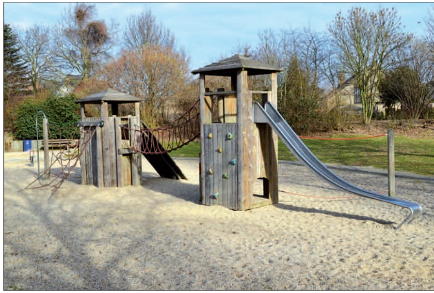
Besonders beliebt ist der Spielplatz Im Haagfeld in Huckingen. Die Spieltürme sollen kurzfristig mit 32.500 Euro aus dem überbezirklichen Topf erneuert werden.

300.000 Euro zur Verfügung. Der Bezirk Süd kann über 32.500 Euro entscheiden. Wie in allen anderen Bezirken auch liegt die Summe um 7.500 Euro unterhalb des Vorjahresniveaus. Die 7.500 Euro aus allen Bezirken kommen in den überbezirklichen Topf. Für den Spielplatz Im Haagfeld werden Gelder aus diesem Topf genommen, in dem sich insgesamt 52.500 Euro befinden. In der Verwaltungsvorlage heißt es zur Begründung: „Die damit gewonnenen Mittel werden prioritär für die Bezirke mit einer geringen Sanierungsquote von Spielplätzen eingesetzt.“ 2004 hat der Rat der Stadt Duisburg die Spielplätze in das Sondervermögen der Wirtschaftsbetriebe (WBD) übertragen (ohne die Plätze auf Schulhöfen und Kindergärten). Das Jugendamt ist weiterhin für alle grundsätzlichen Fragestellungen im Zusammenhang mit den Spielplätzen zuständig, etwa