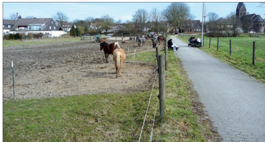
Viel Platz gibt es im Angermunder Ortszentrum, aber er ist dem Hochwasser der Anger vorbehalten (solange es kein Hochwasser gibt, auch den Pferden). Ist eine Bebauung auf Stelzen möglich?

in Kaiserswerth die Niederrheinstraße und der projektierte Supermarkt auf einer Ebene liegen sollen. Der heutige „Dreiecks-Parkplatz“ liegt nach dieser Planung dann im hochwasserfreien Untergeschoss. H.S.