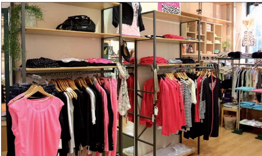
Lust auf Frühling macht die neue Kollektion von Marc Cain.