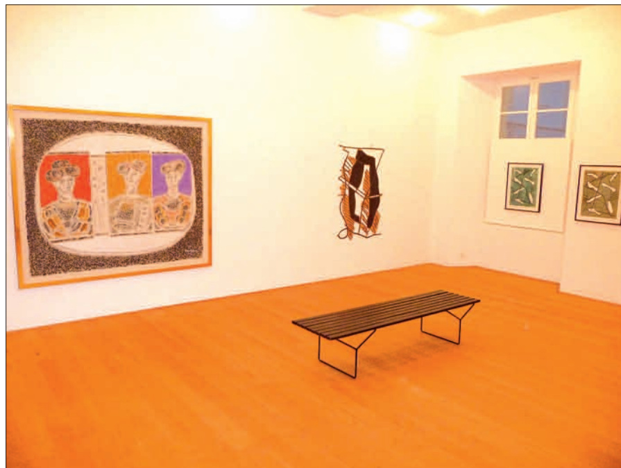
Blick in das Kunstarchiv Kaiserswerth. Links ein Bild von Bruno Goller, rechts Holzschnitte von Pidder Auberger.

Mit dem „Kunstarchiv Kaiserswerth“ verfügt Kaiserswerth über ein Kunstmuseum ersten Ranges. Es ist zwar klein, aber fein und zeigt Werke weltweit anerkannter Künstler. Leider ist es nur wenig bekannt und besucht, und die Öffnungszeiten sind auch nicht gerade üppig, derzeit mittwochs von 16-19 und sonntags von 14-17 Uhr. Der Eintritt beträgt € 3,-. Eingerichtet wurde das Museum im Jahre 2002 aus Anlass des 100. Geburtstages des Malers Bruno Goller (1901-1996). Er war in Gummersbach geboren, ver-