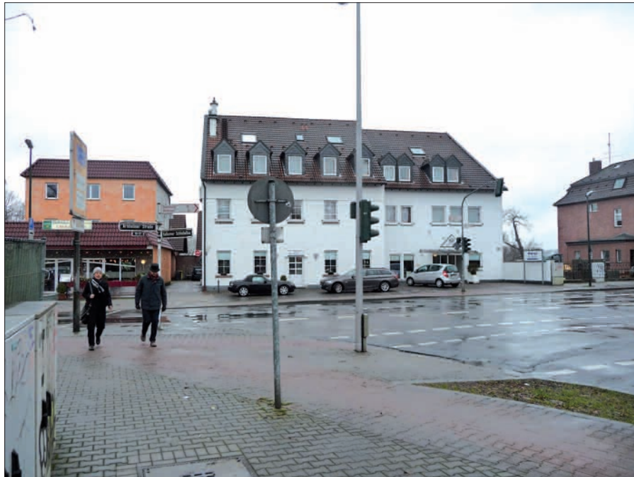
Blick von der Kalkumer Schlossallee in die Arnheimer Straße. Hier ist ein fast 70 m breiter, viergeschossiger Baublock zur Hälfte bereits genehmigt bzw. in Bau, zur anderen Hälfte im Genehmigungsverfahren.