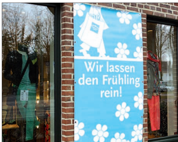
Frühling lässt sein blaues Band munter flattern durch die Lüfte