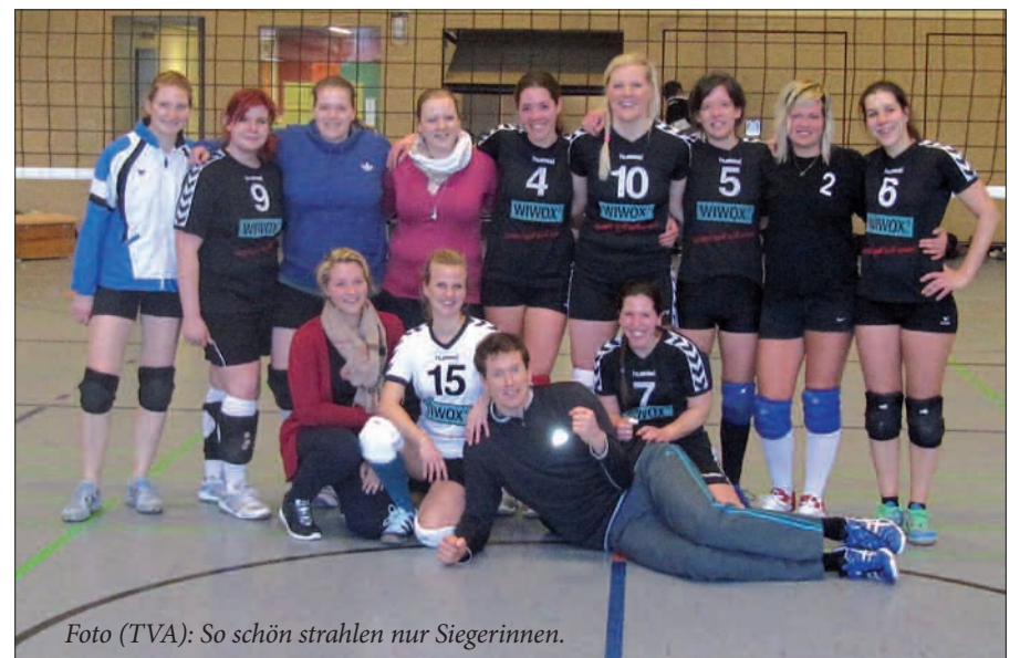
So schön strahlen nur Siegerinnen.