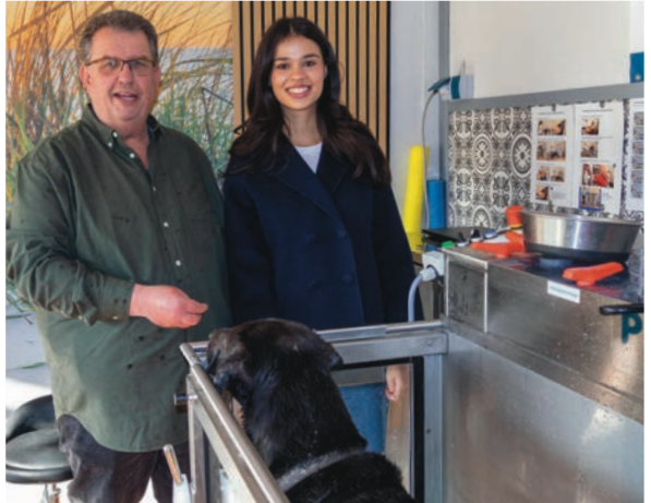
Chuck genießt das gelenkschonende Workout auf dem Unterwasserlaufband.

Buchung: www.huffys-fit.de Das Training steigert Wohlbefinden, Gesundheit und Lebensqualität jedes Vierbeiners nachhaltig. ah