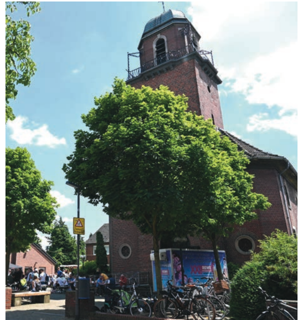
Die Kirche Herz-Jesu in Serm hat einen neuen Eigentümer, ist aber weiterhin ein Gotteshaus.

„Das schaffen wir“, sagt Germ. Anschließend werde eine ähnliche Rücklage für das Gemeindeheim angespart. sam