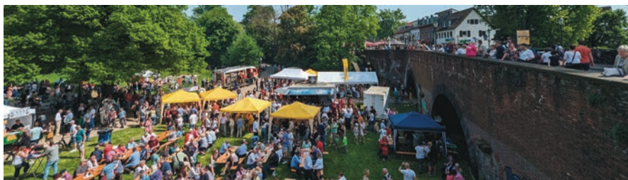
Zahlreiche Besucherinnen und Besucher genießen die fröhliche Atmosphäre beim Brückenfest unter der Klemensbrücke.

Am Donnerstag, 1. Mai, lädt das traditionelle Brückenfest unter der Klemensbrücke zum Mitfeiern ein. Die St. Sebastianus Bruderschaft 1285 Düsseldorf Kaiserswerth richtet das beliebte Familienfest von 11 bis 18 Uhr aus.