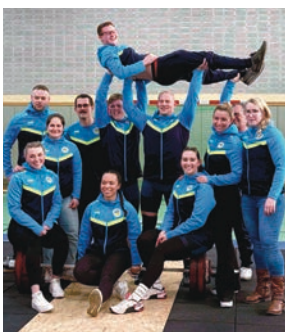
Das Gewichtheber-Team aus Mündelheim schafft Aufstieg in die Regionalliga West.