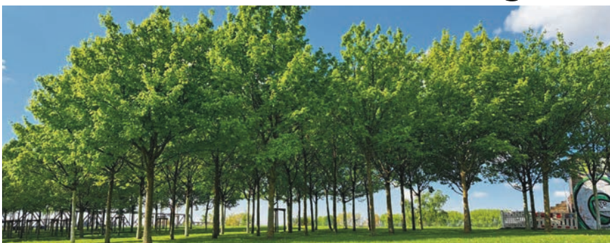
Grüne Idylle im RheinPark Duisburg, einem der Hauptstandorte der IGA 2027, der nachhaltig aufgewertet wird.

Die Internationale Gartenausstellung Metropole Ruhr 2027 wird Duisburgs RheinPark in Hochfeld zu einem zentralen Schauplatz machen. Die Planungen laufen seit Längerem, nun beginnen die Bauarbeiten.