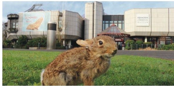
Das Aquazoo Löbbecke Museum lädt während der Osterferien zu verschiedenen Workshops ein.

Am 15. und 16. April lädt das Aquazoo Löbbecke Museum von 11 bis 17 Uhr zu einer Oster-Rallye mit Bastelaktionen ein. Kinder können Ostereier suchen, Rätsel lösen und kleine Überraschungen gewinnen.