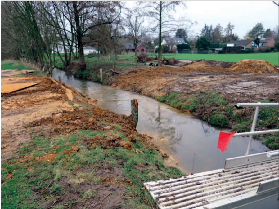
Renaturierungsarbeiten am Schwarzbach in Kalkum-Zeppenheim.

den, um den Schwarzbach anzuheben, um eine höhere Fallhöhe am Mühlenrad zu erreichen. Die Anfang Februar begonnenen Arbeiten werden einige Monate dauern. Die ehemaligen Mühleneiche sind verlandet, liegen trocken und sind völlig verwildert. Nach EU- und Umweltrecht darf der Bach aus Rücksicht für Wanderfische nicht mehr gestaut werden. H.S.