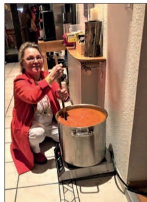
Selbstgekochtes Chilli con Carne - einfach lecker!