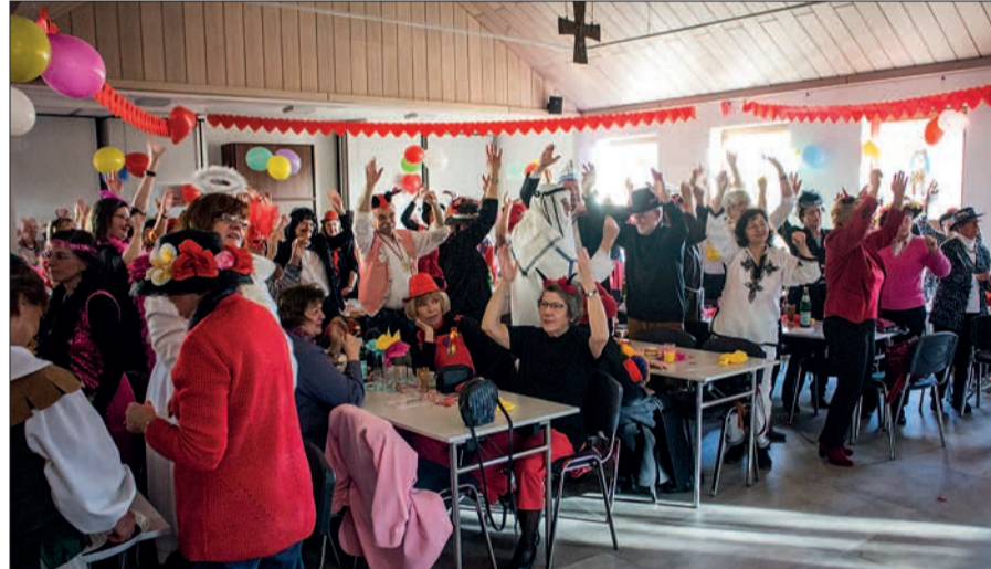
Einen tollen Abschluss bildete die KG De 11 Pille mit dem gemeinsamen Gesang des Pilleschlagers, zu dem der ganze Saal schunkelte.