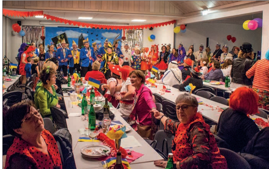
Schon gleich zu Beginn der Veranstaltung „bebt“ der Pfarrsaal.