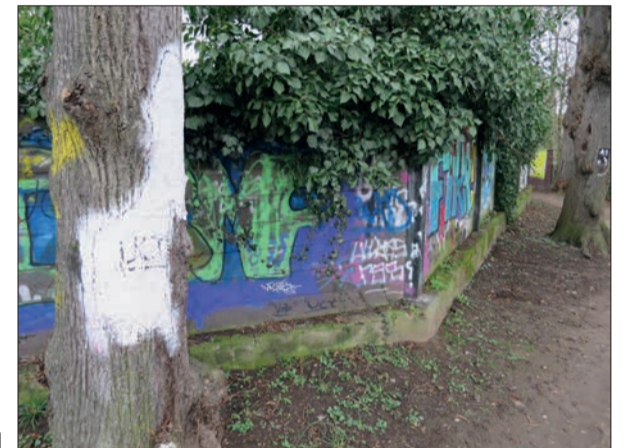
Hier auf dem Barbarossawall stand bis vor kurzem noch die berüchtigte „Kifferbank“.