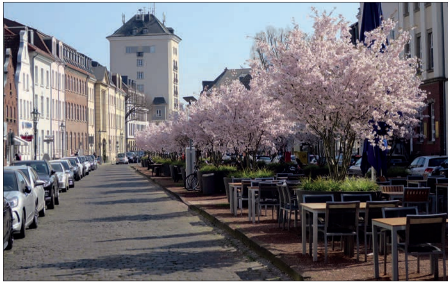
Der Kaiserswerther Markt im Frühjahr 2022. In Kürze wird er sicher wieder so aufblühen.

Aktuell ist von der Bezirksvertretung beantragt und vom Rat der Stadt beschlossen, dass die Parkgebühren in der Kaiserswerther Altstadt auf 1 Euro pro halbe Stunde erhöht werden und auch an Wochenenden zu zahlen sind. Das macht aber nur Sinn, wenn das an der Klemensbrücke ausgeschilderte, generelle Parkverbot an Wochenenden (ausge-