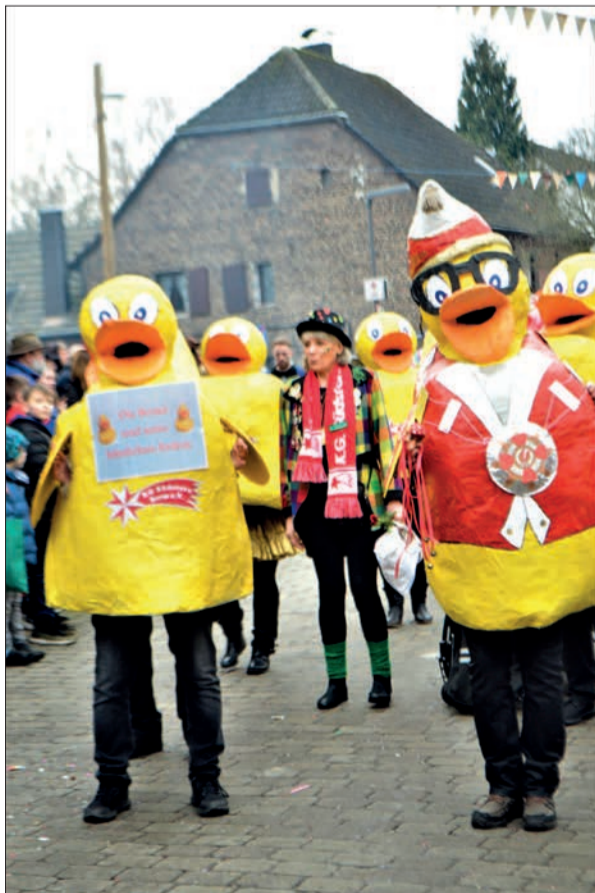
In phantasievollen Kostümen zogen die Narren aus Duisburg-Süd durch Serm. 9.000 Zuschauer waren dabei.

gigen Narren in „Schwarz-Weiß“ durch die Straßen. Auch die anderen Fußgruppen waren mit ihren originellen Kostümen wahre Augenweiden, etwa als Enten, Teufelsgeigen oder Karussells. Zu Ehren von Prinz Kevin fuhr die Tellkompanie auf einem Schiff, das mit folgendem Namen versehen war: „M.S. friendSHIP unsink-BAHR“. Für die musikalischen Töne sorgten das Tambourcorps Serm, die Blaskapelle Krefeld, das Schalmeienorps Wittlaer, die Ruhrpott Guggis und das Tambourcorps Bottrop. Es war eine friedliche Feier, bunt und ausgelassen. sam