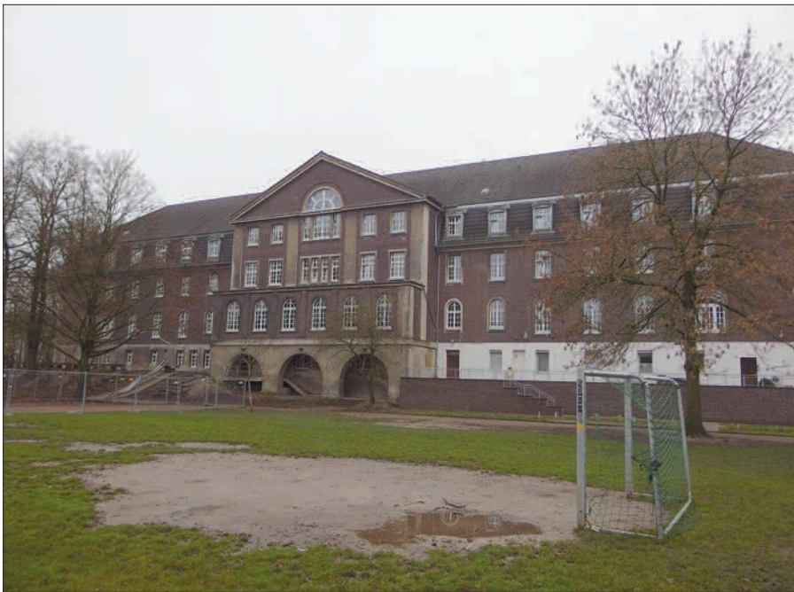
Der Wanderweg nördlich um Kaiserswerth erschließt neue Ausblicke. Hier die Nordfassade der unter Denkmalschutz stehenden Kaiserswerther Grundschule. Text u. Foto: H.S.

Der neue Spazier- und Wanderweg durch den Grünzug im Wallgraben nördlich um Kaiserswerth ist schon seit Wochen fertiggestellt, allerdings noch nicht alle begleitenden Pflanzarbeiten und die Graseinsaat. Außerdem sind noch Arbeiten an der dort verlaufenden Abwasser-Druckleitung zur Pumpstation hinter dem Deich erforderlich. Viele neugierige Spaziergänger machen bereits Gebrauch von dem neuen und letzten Teil des Rundweges, obwohl noch Absperrgitter stehen. Von dem neuen Weg aus, der zunächst wie ein Löwengang die privaten Gärten des ehemaligen Gutshofes und die rückwärtigen Freiflächen der Grundschule und der Kindertagesstätte sichert, wird der Blick frei auf die bisher nicht sichtbare Nordseite des schlossartigen Gebäudes der heutigen Kaiserswerther Grundschule