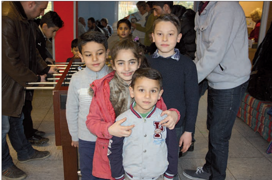
Der Kicker und ein Billardtisch sorgen für Spiel und Spaß. Die Kinder sind immer mit dabei.