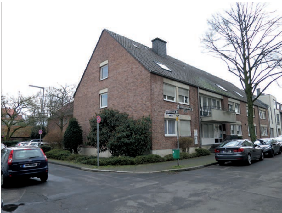
An der Ecke Friedrich-von-Spee-Straße 30/Barbarossawall sollen Neubauten entstehen.

Die Tage des derzeitigen Bürgerbüros an der Friedrich-von-Spee-Str. 30 sind gezählt. Die Bezirksvertretung 5 stimmte in ihrer letzten Sitzung einer Bauvoranfrage zu, die nach Abriss der Gebäude an der Ecke Friedrich-von-Spee-Straße/Barbarossawall ein Mehrfamilienhaus mit 6 Eigentumswohnungen (Front zur Friedrich-von-Spee-Straße), Tiefgarage und 4 zweigeschossige Einfamilien-Reihenhäuser (Front zum Barbarossawall) vorsieht. Es ist erstaunlich, dass ein so solides (zumindest äußerlich) und gar nicht so altes Gebäude schon wieder abgerissen wird. Offensichtlich sind die Kaufpreise in Kaiserswerth so hoch, dass jeder zusätzlich geschaffene qm Wohnfläche zählt. Die Gebäude tangieren das Areal der spätmittelalterlichen Stadtbefestigung (Bodendenkmal Bastion St. Caspar). Bisher sind die Gebäude Eigentum der kath. Kirchengemeinde und beherbergen ein Schwesternwohnheim, das aber bereits geräumt und vorübergehend mit Flüchtlingen belegt ist. Im Erdgeschoss be-