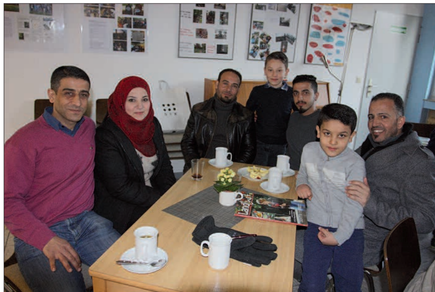
Gemeinschaft macht Freude. Zweimal pro Woche treffen sich viele Menschen aus dem Wohndorf Angermund im Welcome Café an der evangelischen Kirche.