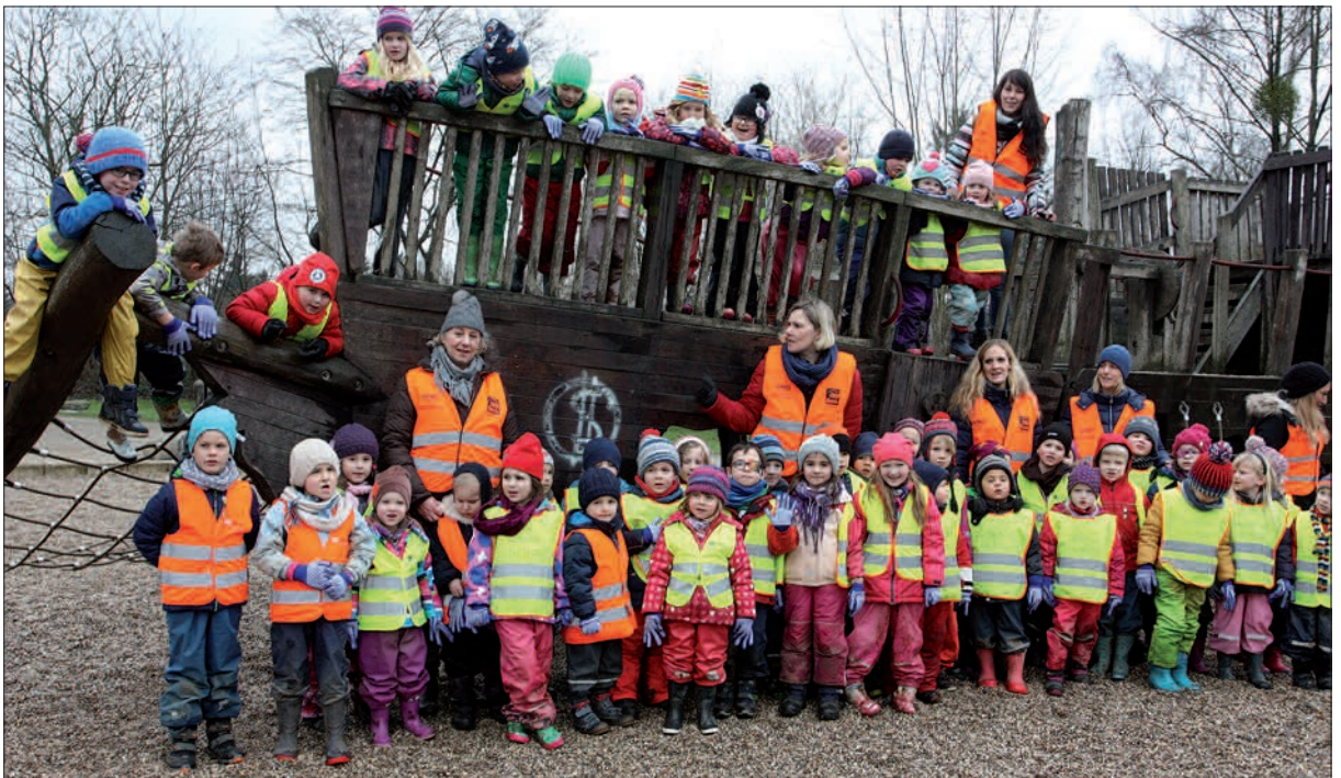
Erst Müll sammeln dann lächeln, so die Devise der städtischen Kita Litzgraben.

Leiterin der Kita. Richtig üppig war die Ausbeute nicht. Chipstüten, Federbälle, ein bisschen Plastikmüll – die Angermunder sind bei der Sauberkeit vorbildlich. Nun strahlt der hübsche Spielplatz in voller Pracht, der Frühling kann kommen! G.S.