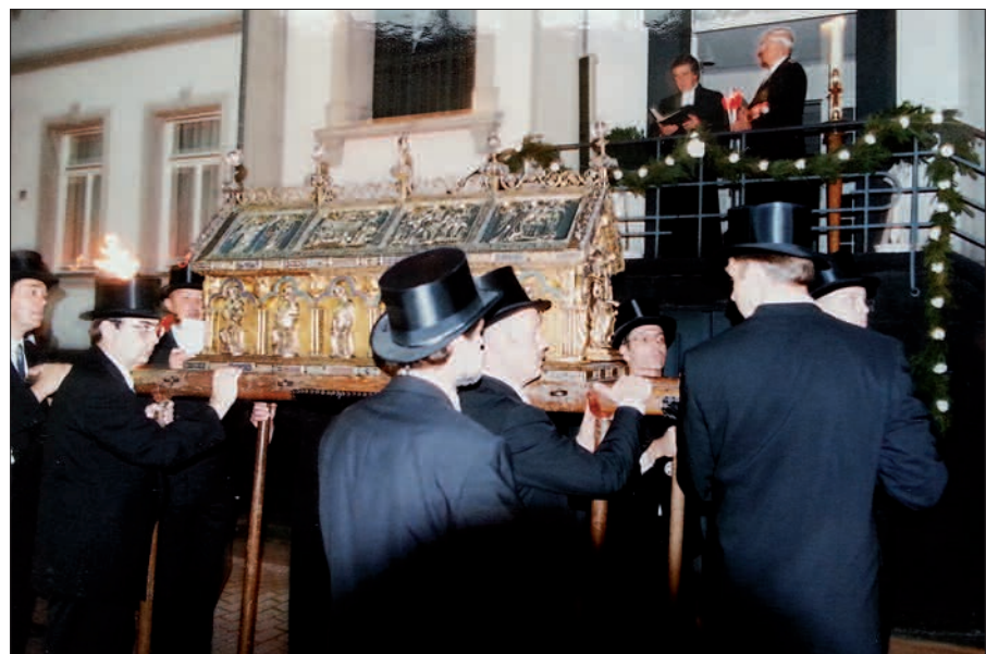
Suitbertus ist der Heilige aller Kaiserswerther. Hier im Jahr 1998 wird noch der vergoldete Schrein in einer Prozession durch die alte Reichsstadt getragen und macht Station vor der ev. Stadtkirche an der Fliegerstraße.