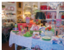
Dekoratives & Kostbares im Stadthäuschen!

Das Stadthäuschen ANTIK Kunst & Liebenswertes