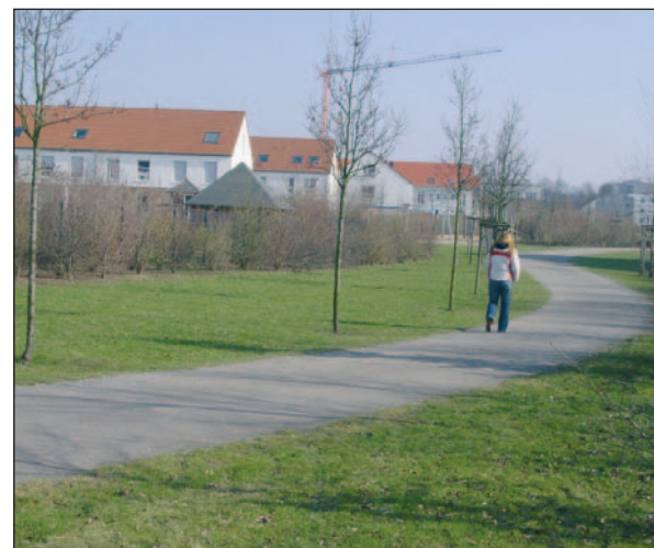
Baukräne im Hintergrund, doch das Grün überwiegt in Einbrungen. Im Hintergrund ist der großzügige Spielplatz.

zählen hätte. Etwa die fehlenden Parkplätze. „Das Konzept war nicht durchdacht“, sagt sie. Oder eine Teestube und Jugendeinrichtung für die Kinder, die irgendwann Jugendliche sein werden. Auch die Kapazitäten der Schulen beäugt