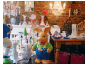
Hase & Co. lassen grüßen!

Royal Scandinavian Ihr Fachgeschäft für nordisches Design