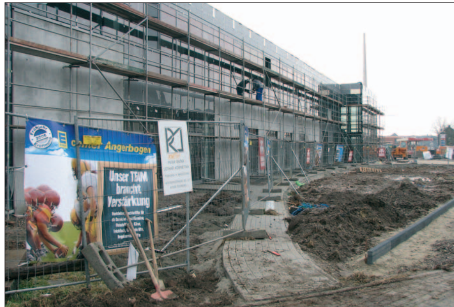
Auch der Außenbereich vom E-Center Angerbogen mit seiner neuen Grünanlage und dem Fußgänger- und Radweg wurde von der Friedrich Tonscheidt KG neu gestaltet