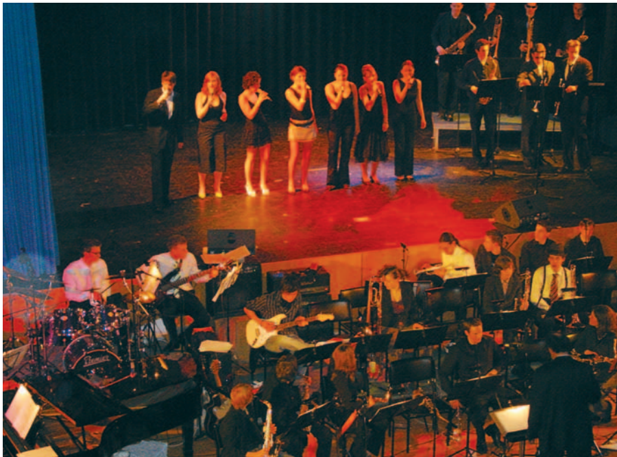
Von oben herab. Eindrucksvolles Bild der Big Band samt Solisten auf der Bühne des Theodor-Fliedner-Gymnasiums Kaiserswerth.