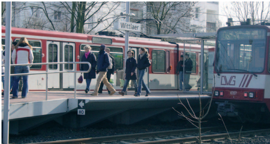
Demnächst fährt die U 79 auch in Wittlaer bis 4 Uhr morgens.