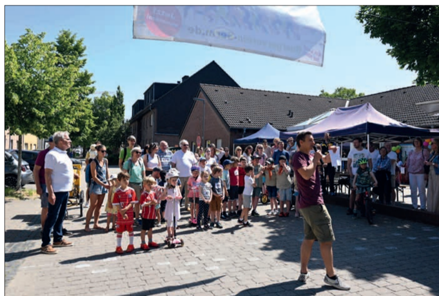
Das Gemeindezentrum wird häufig genutzt – wie hier beispielsweise beim Start des ersten Sponsorenlaufs, zu dem der Bürgerverein aufgerufen hatte.

verein unterschrieben ist, nicht nur die Dorfgemeinschaft ist gespannt und freut sich darauf, dass der Dorfmittelpunkt auch in Zukunft genutzt werden kann, in einem neuen, modernen Gewand.