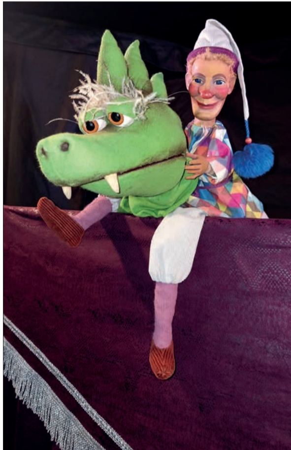
„Die neugierige Prinzessin“ ist am Sonntag in Ungelsheim zu sehen.