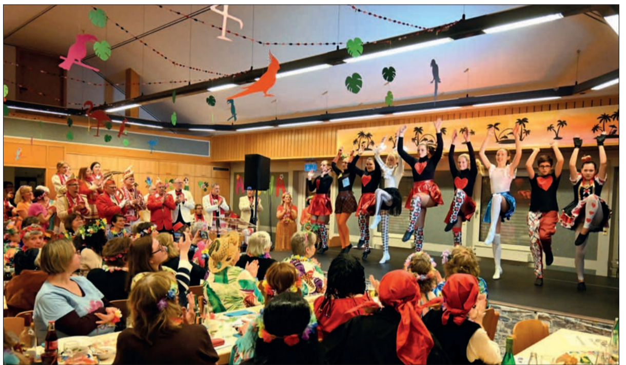
Es war ein tolles, buntes Bild, das alle Mitwirkenden auf und neben der Bühne sowie im Saal zeigten – wie hier beim Tanz der Stellas.