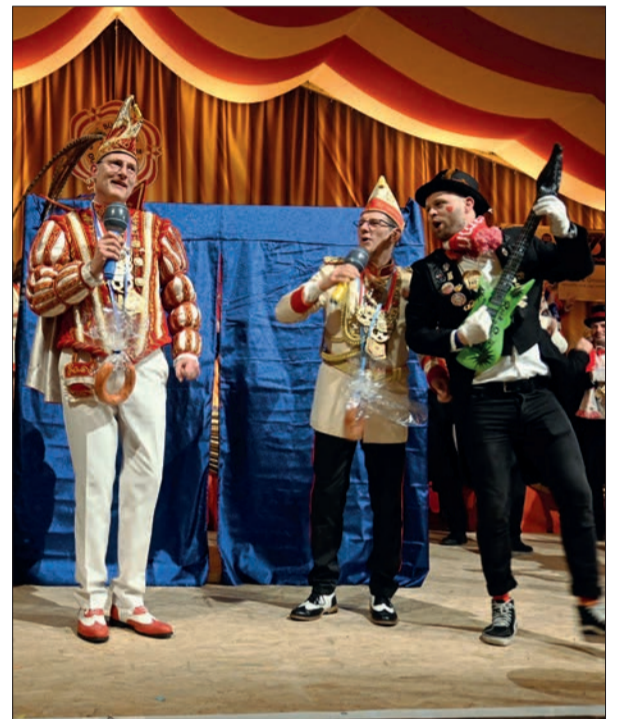
Mit dem Wurstorden um den Hals sangen und tanzten Prinz und Hofmarschall fröhlich beim Narrenkarussell.