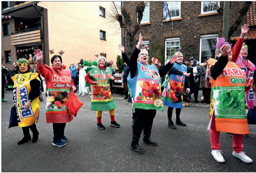
Die Bastifrauen zogen als Hariboknäckchen am Sonntag durch Serm. 7.500 Zuschauer verfolgten bei trockenem Wetter und angenehmen Temperaturen das bunte Treiben.

Mit der Gruppe „Big Maggas“ endete das offizielle Programm. Da die Hamburger, von denen jeder ein Unikat ist und weiß, wie man mit Musik Stimmung macht, ihren letzten Auftritt der Session in Serm hatten, gaben sie mehr Zugaben als gewöhnlich – sehr zur Freude der Narren. Und dann ging die Party noch lange, lange weiter. Nachdem die Sermer Jecken sich am Rosenmontag mit mehreren Wagen und Fußgruppen am Umzug durch Duisburg beteiligt hatten, stieg abends im Zelt noch der Preis-Maschinenball. Die Sieger waren die Amazonas. Mit ihrer Einlage sagten sie der heimischen Freiwilligen Feuerwehr kräftig „Danke!“. „Wenn andere feiern, seid ihr zu Stelle und passt auf uns auf!“