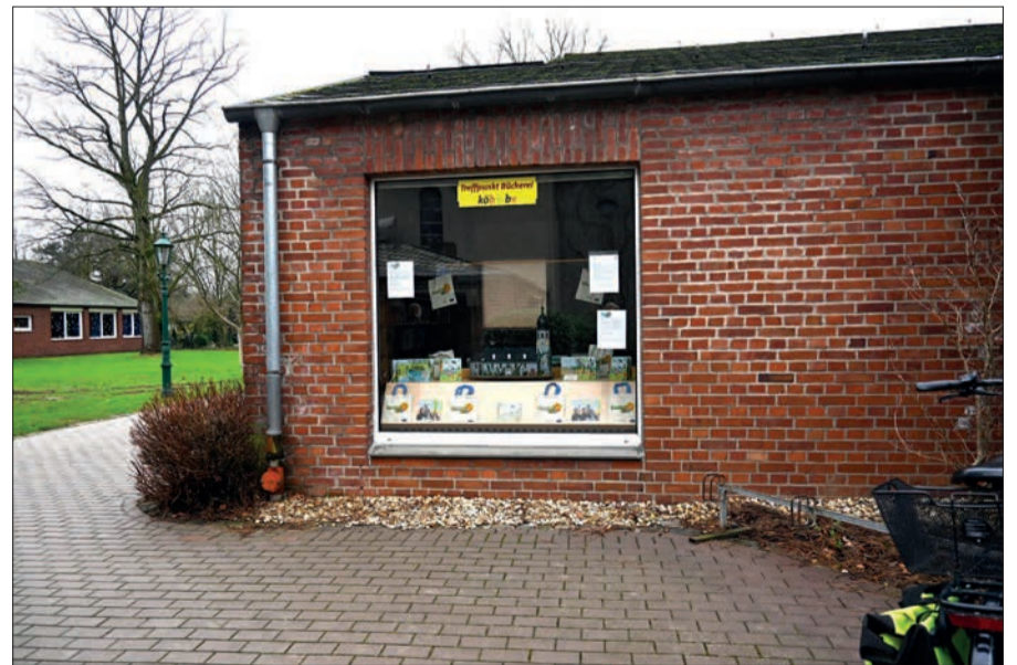
Hinter der Kirche St. Hubertus, im Gemeindehaus, befindet sich die katholische öffentliche Bücherei. Hier können sich Familien mit Kindern ab drei Jahren das Lesestart-Set 3 kostenlos abholen.

Bei „Lesestart 1-2-3“ handelt es sich um ein bundesweites Programm zur frühen Sprach- und Leseförderung für Familien mit Kindern im Alter von einem, zwei und drei Jahren. Es wird vom Bundesministerium für Bildung und Forschung (BMBF) gefördert und von der Stiftung Lesen durchgeführt. Das Büchereiteam freut sich immer mittwochs von