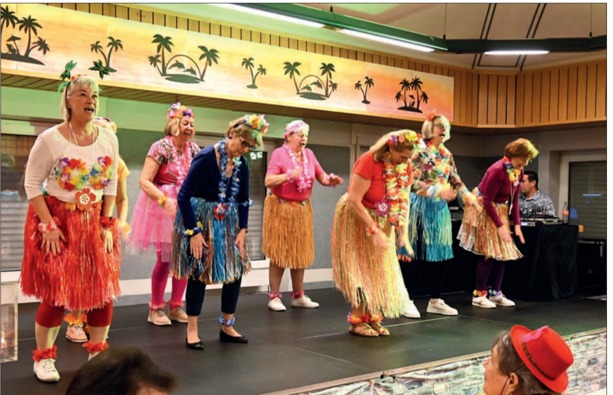
Das Programm der Frauensitzung stand in diesem Jahr unter dem Motto: „In die Südsee aloha he, reist dieses Jahr die kfd“.