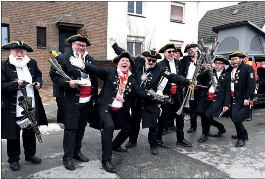
Immer wieder gerne im Nachbarort aktiv und mit fetziger Musik dabei ist das Schalmeiencorps Wittlaer.