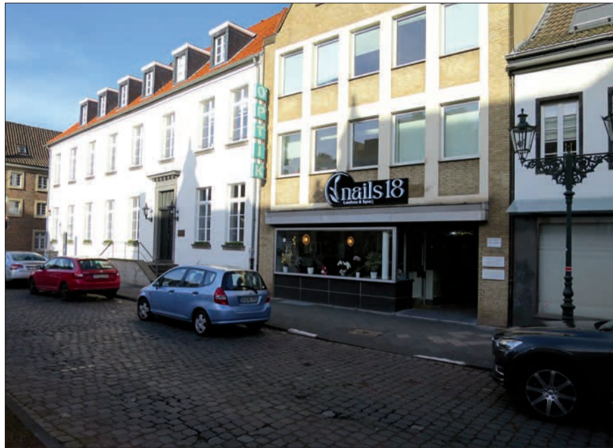
Ein neues Geschäft auf dem Kaiserswerther Markt macht auf sich aufmerksam.

Im Denkmalbereich steht auch die alte Pumpstation auf dem Deich unter dem Mühlenturm, die selbst ein Denkmal ist. Sie ist Eigentum der Stadt Düsseldorf. Das seit Jahrzehnten ungenutzte, in Verbindung mit der Deichsanierung 2009 aufwendig gesicherte Gebäude war jüngst ebenfalls