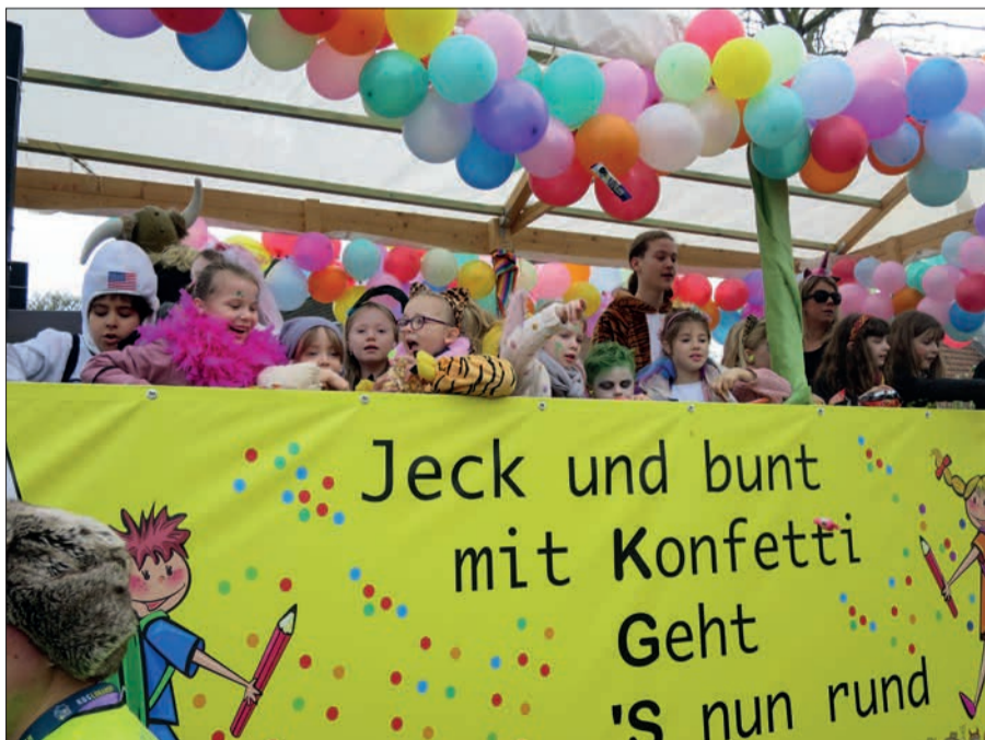
Ein Wagen voller Kinder der Kleinen gelben schule (KGS).