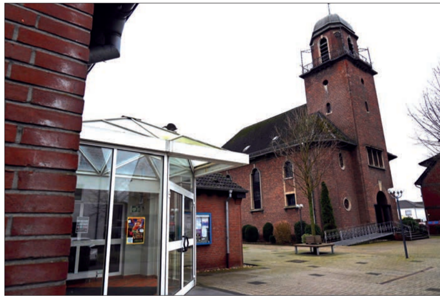
Das Kirchengelände in Serm ist – und bleibt – der Dorfmittelpunkt.

Doch damit rechnet in Serm keiner. Der Vorstand des Fördervereins hofft, dass die Mitgliederzahl noch auf 500 anwächst. Seit ein paar Monaten können die Mitglieder entscheiden, wohin ihr Beitrag – der übrigens frei wählbar ist - fließen soll, ob in die Kirche oder ins Gemeindezentrum. Viele spliten ihr Geld, damit sowohl Kirche als auch Gemeindezentrum unterstützt werden. Sobald der Vertrag zwischen Bistum und Förder-