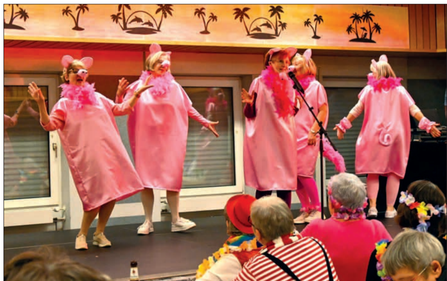
„Die Schweinchen“ brachten mit ihrer Darbietung das Publikum im ausverkauften Sermer Gemeindehaus toll zum Lachen.