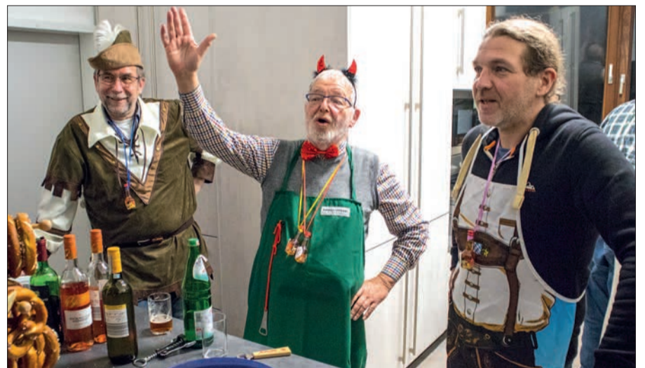
Auch hinter der Theke wurde in den „wenigen“ Pausen kräftig mitgefeiert.