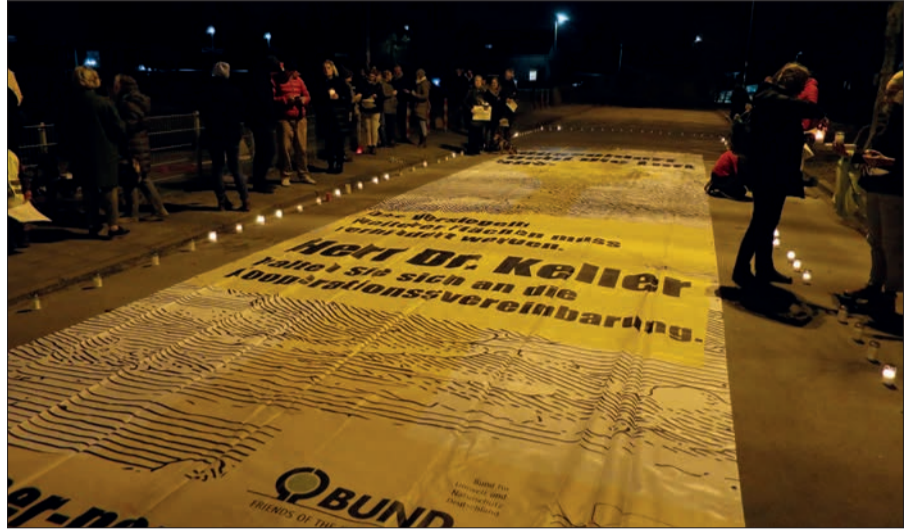
Vor dem Schulgelände des TFG protestierte die Bürgerinitiative „StadtLandFluss e.V.“, während andere Bürger in der Aula konstruktive Anregungen zur Planung gaben. Ob mit Erfolg?

noch nichts festgelegt. Das Bürgerbeteiligungen. Es geschicht erst in dem jetzt kann 2 bis 3 Jahre dauern, je nachdem ob Rechtmittel gern und Bauherren zuführen zu können. Das kann weitere Jahre dauern. Text u. Foto: HS