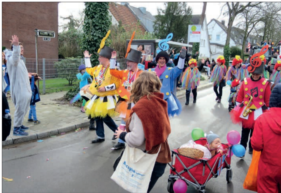
Eine bunte Truppe beim Marsch durch Lohausen.