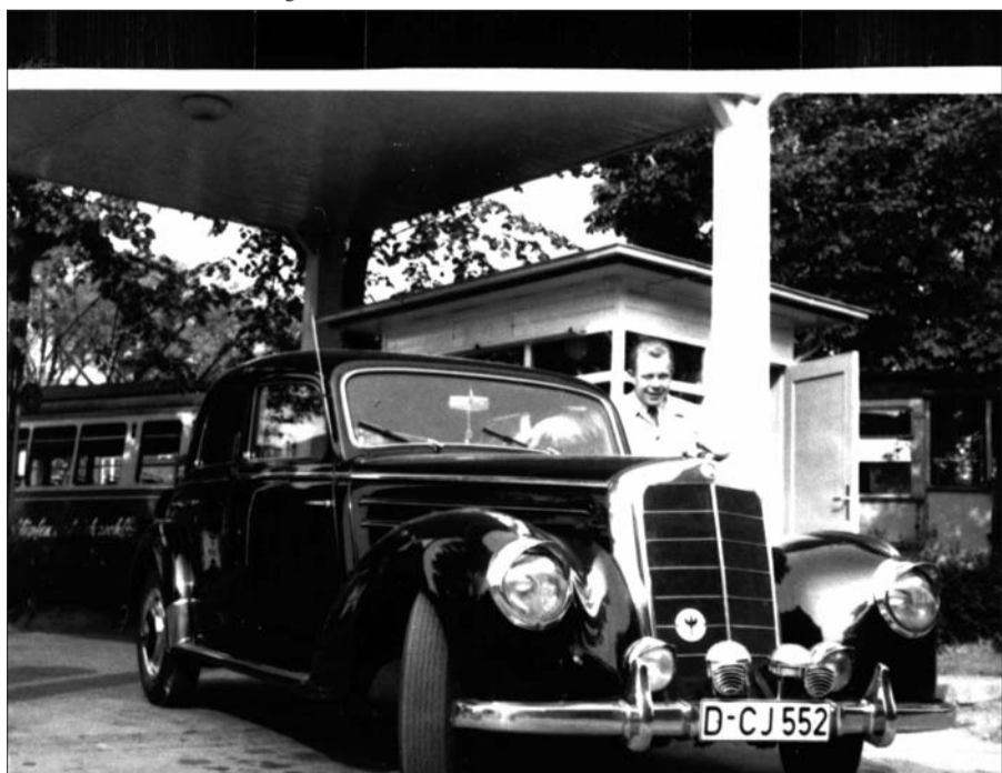
Schon immer standen an der Tankstelle Arnheimer Str. 51 gepflegte Autos im Vordergrund. Hier ein ca. 50 Jahre altes Foto, als die Straßenbahnlinie 11 noch direkt hinter der Tankstelle wendete.