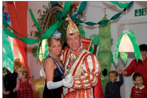
Prinz und Prinzessin ganz nah. Berührungsängste gab es nicht.