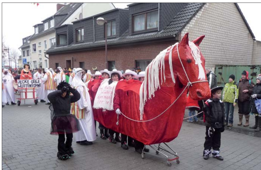
Durch das Dorf zogen weniger stinkende Dieselschlepper, aber umso mehr kleine und große, kreativ kostümierte Gruppen, oft mit hausgemachten Transporthilfen für die Kamelle und wertvolleren Geschenken für das jubelnde, närrische Volk.