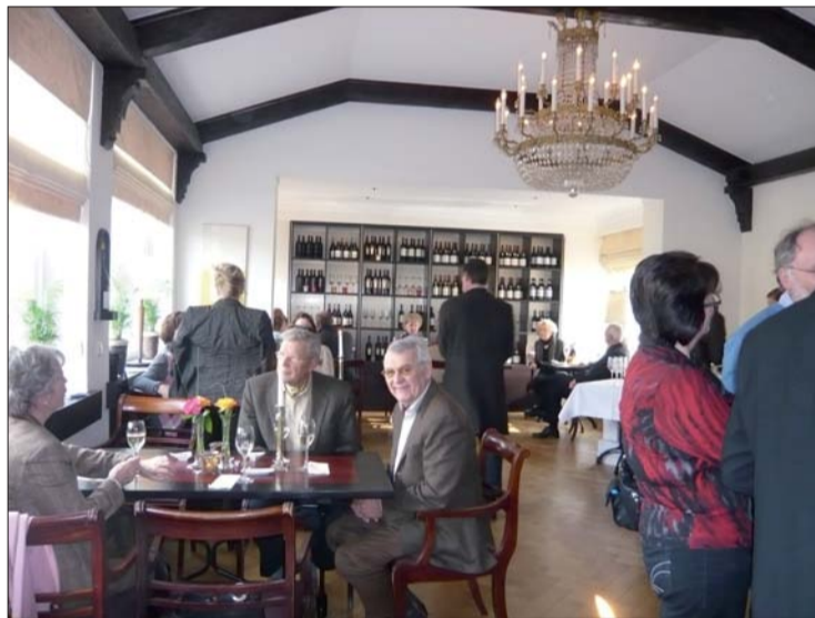
Ein Blick in den großen Speisesaal des Haus Litzbrück zeigt, wie behutsam renoviert wurde. Fotos & Text: Gabriele Schreckenberger