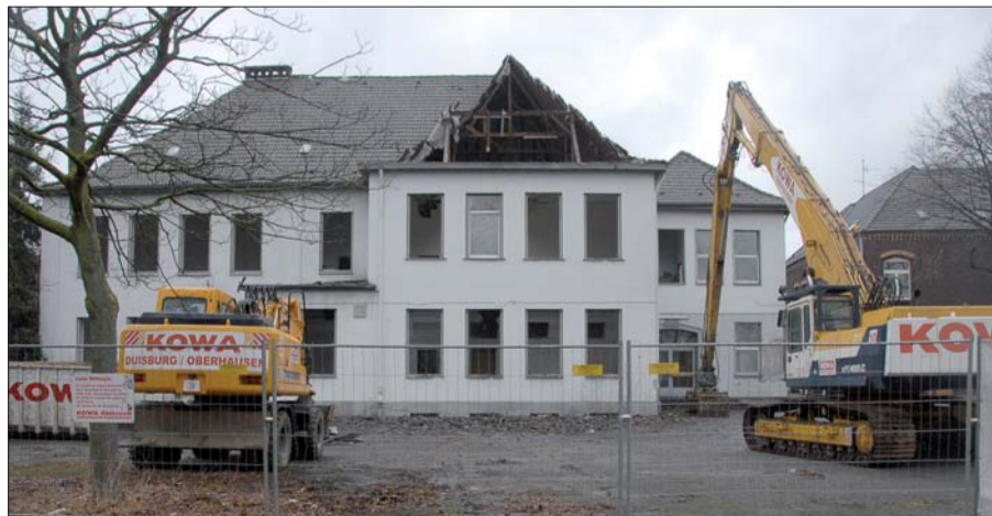
Die Entkernungsarbeiten für den Abriss der alten Hückinger Volksschule von 1876 sind bereits in vollem Gange. Text u. Foto: Horst Mosebach

geländer mit dem hölzernen Handlauf sind ebenfalls erhalten. Das Gebäude dokumentiert die bewegte Hückinger Schulgeschichte und soll für kommende Generationen als die ehemalige Bildungsstätte ihrer Vorfahren oder Eltern erhalten bleiben. Die stattliche Backsteinfassade an der Hauptstraße des Ortes ist für Hückingen prägend und damit erhaltenswert. Auch die alte Backsteinmauer, die das Schulgelände umgibt, möchte der Hückinger Bürgerverein erhalten. Hier soll im Einmündungsbereich der alten Raiffeisenstraße die ursprünglich in die Mauer eingefügte "Pennebank" durch eine Rekonstruktion wieder entstehen.