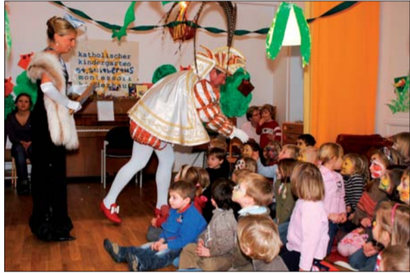
Gespannt erwartet. Der Besuch des Düsseldorfer Prinzenpaares im Montessori-Kinderhaus St. Suitbertus.