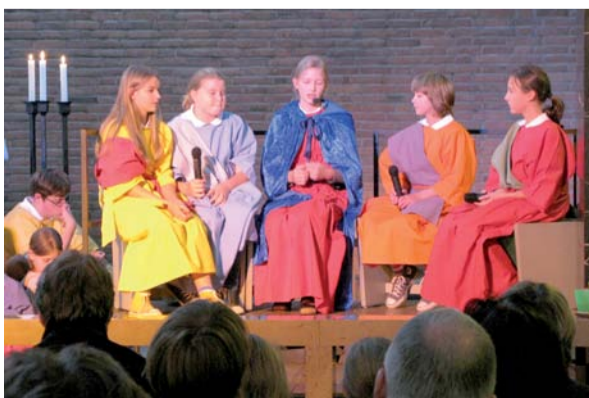
Alle Aufführungen des St. Remigius Chors sind gut besucht, wie hier im vergangenen September in St. Ignatius in Essen.