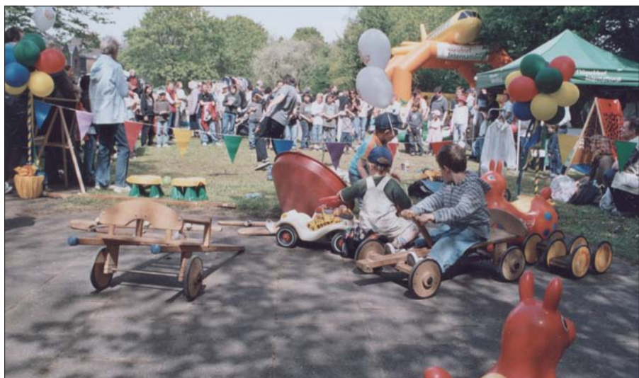
In den Vorjahren hat es mit strahlendem Sonnenschein zum Lohauer Frühlingserwachen immer geklappt. Das ist auch für dieses Jahr am 30. April zu hoffen und zu wünschen. Besonders Kinder, Jugendliche und Familien kommen bei diesem Fest auf ihre Kosten. Die Kleine gelbe Schule wirkt auch eifrig mit.