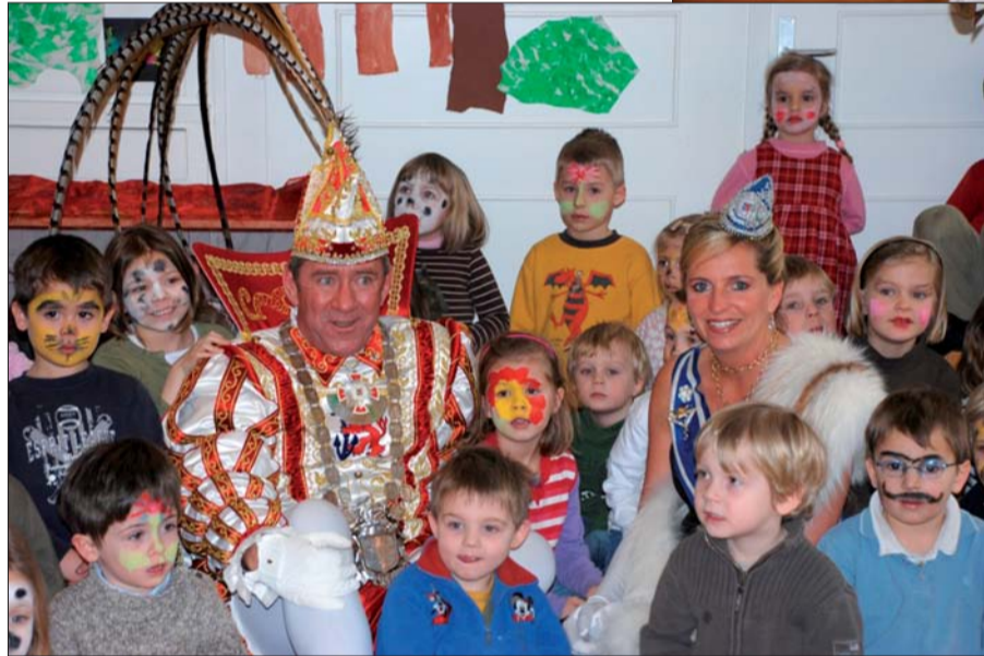
Tanz im Zauberswald. Die Kinder nehmen das Prinzenpaar in ihre Mitte.