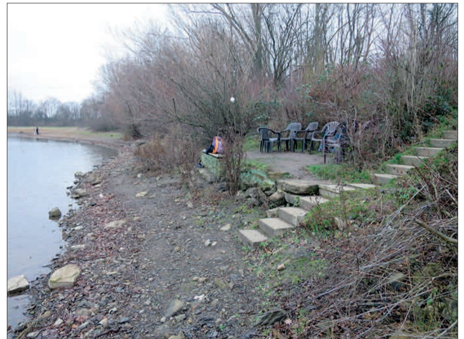
Eine solide, bestuhlte „private“ Seeterrasse der Marke „Eigenbau“ in Angermund.

bieten Sechs-Seen-Platte und Silbersee anders gemeistert. Ob sich Düsseldorf daran ein Beispiel nimmt, es vielleicht noch besser macht? H.S.