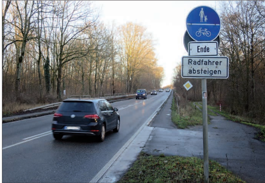
Wer auf kurzem Weg nach Ratingen radelt, wird hier ausgebremst.

Ein schneller Radweg nach Ratingen wird seit Jahren gefordert, auch in der Bezirksvertretung 5. Die Verwaltung verweist auf die Zuständigkeit des Landes