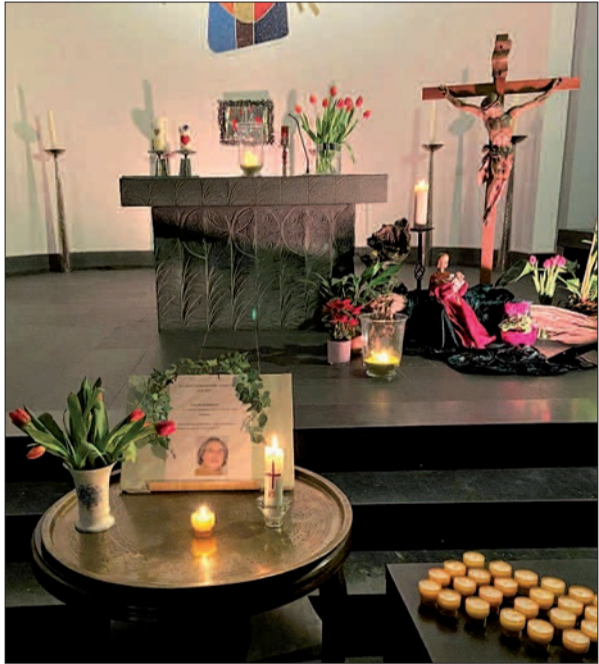
In der Sermer Kirche besteht die Möglichkeit, sich von Gemeindefeferent Christa Blokesch zu verabschieden, für sie zu beten oder eine Kerze zu entzünden.