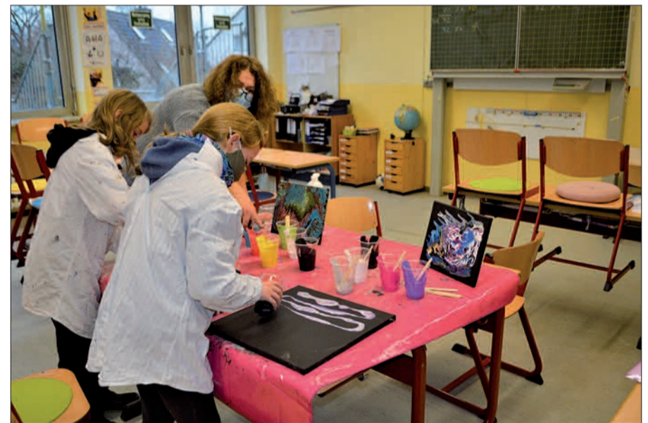
Die Betreuungsangebote nehmen nur wenige Kinder wahr. Hier versuchen die Betreuer, so viel Normalität wie möglich zu vermitteln.

Der Wechsel auf den Distanzunterricht sei für alle in seiner Ausschließlichkeit Neuland: „Es sind feste und verlässliche Strukturen entstanden, die für den Distanzunterricht erst aufgebaut werden mussten. Die Ausgangslage, ob und welche technische oder elterliche Unterstützung zu Hause gewährleistet werden kann, ist sehr unterschiedlich“, führt die Schulleiterin aus. „Die