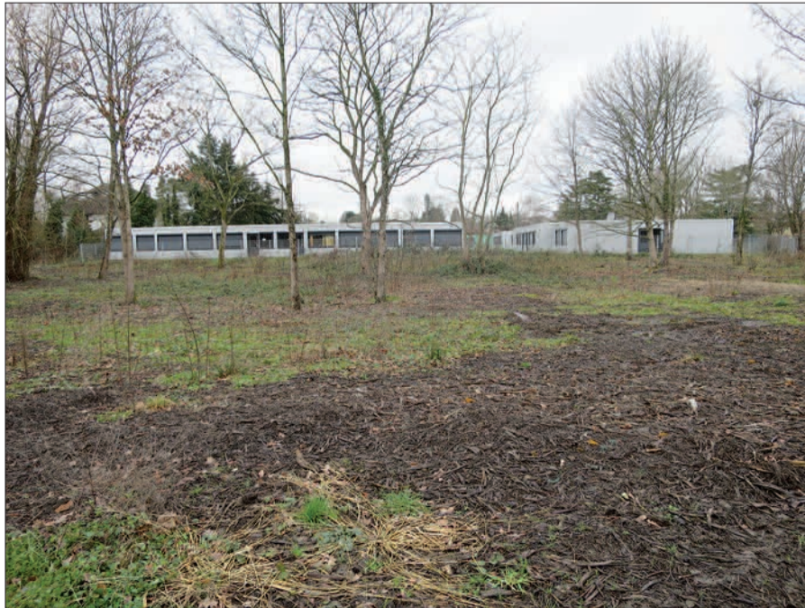
Das Baugebiet „östlich Zur Lindung“ von Osten. Im Hintergrund die temporären Flüchtlingsunterkünfte. Sie sind Teil des Baugebietes.

Fläche umfasst die heutigen Flüchtlingsunterkünfte und die dahinter liegende Fläche zwischen Baumschulenweg und Grundschule. Diese Fläche wurde bereits im vergangenen Jahr von Wildwuchs geräumt, nur größere Bäume blieben stehen (unser Foto). Hier ist vor allem noch Klärungsbedarf zur Verkehrserschließung. H.S.