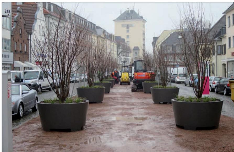
Für den Kaiserswerther Markt sind japanische Brautkirschen in Pflanzkübeln angeliefert worden.

Vergangene Woche wurden die im August 2020 in der Sitzung der Bezirksvertretung vom Garten, Friedhofs- und Forstamt angekündigten „japanischen Brautkirschen mit schirmförmigen Kronen“ für den Kaiserswerther Markt angeliefert, eingepflanzt und auf der Mittelinsel plaziert worden. Es sind jedoch keine Bäume, sondern große Sträucher. Man kann sich schon heute vorstellen, dass die großen Sträucher im Frühjahr zu einer blühenden Pracht und Augenweide werden. Diese Maßnahme ist, wie der NORDBOTE schon im vergangenen September ankündigte, ein befristetes, auf zwei Jahre angelegtes „Klimaschutzprojekt“. Damals hatte die Verwaltung jedoch vier Meter hohe Bäume mit schirmförmigen Kronen vorgestellt. Es soll beobachtet und gemessen werden, ob sich die hohen Temperaturen auf dem in den letzten Jahren fast baumlosen Markt mit dieser Bepflanzung reduzieren lassen. Natürlich soll damit auch die Aufenthaltsqualität erhöht werden.