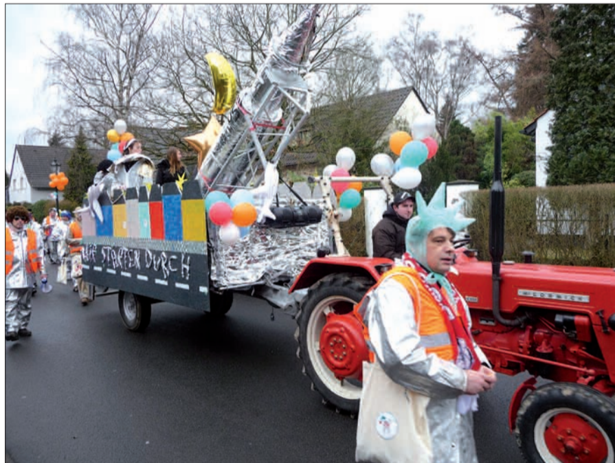
Im vergangenen Jahr starteten die närrischen Lohausener beim Umzug durchs Dorf beim Straßenkarneval durch zum Mars. In diesem Jahr, am 9. Febr., geht es umgekehrt in die Steinzeit.

Anzumerken ist, dass sich die KG „Närrische Lohausener“ 2009 gründete und 2010 schon den ersten Lohausener Straßenkarneval mit Umzug durchs Dorf auf die Beine brachte. Die Aktivitä-