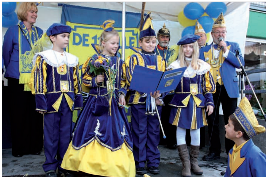
Schon bei Hoppeditz' Erwachen hat Jogi ganze Arbeit geleistet.