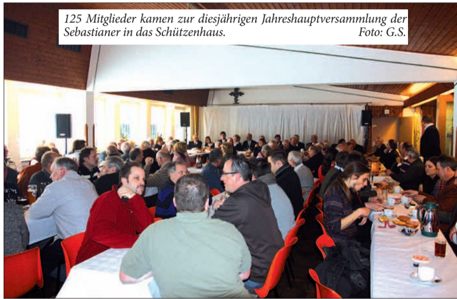
125 Mitglieder kamen zur diesjährigen Jahreshauptversammlung der Sebastianer in das Schützenhaus.