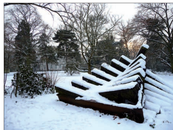
Kunst im Lantz'schen Park.

Im Schnee zeigt Lohausen ein ganz anderes Gesicht. Wir haben ein paar Ansichten fotografisch festgehalten und meinen, obwohl es in Lohausen so flach ist wie auf einem Pfannkuchen, hat die Schneelandschaft hier doch ihre Reize. H.S.