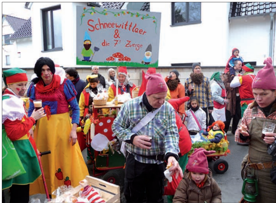
Auch im vergangenen Jahr verschwammen beim Wittlaerer Rosenmontagszug die Grenzen zwischen Zugteilnehmern und Zuschauern. Jeck sind sie alle.

Im Wittlaerer Karneval gibt es erst recht keine Krise. Und wenn es in Wittlaer ansonsten Krisen oder Engpässe gibt, werden sie mit Humor gemeistert. Das wird der Wittlaerer Rosenmontagsumzug am 11. Februar ab 14.11 Uhr, startend am Wasserwerksweg/Ecke Bockumer Straße, wieder einmal zeigen. So kommentieren zum Beispiel jecke Eltern („Jeck El Wis“) die übervollen Kindergärten, Schule und Sportverein (immer noch ohne die versprochene Sporthalle) die Situation mit dem Motto „Wittlaer ist gerammelt voll. Wir Wittlaerer sind jeck und doll“. Sie kostümieren sich als Karnickel, denn die sind ähnlich fruchtbar wie die Wittlaerer.