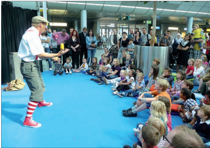
Die Airlebnisse im Flughafen bieten Kindern auf vielfältige Art Spiel, Spaß und Spannung. Besonders beliebt ist der Sauresani-Zirkus/Kindertheater mit speziellem Programm für Kinder.

schicklichkeitsparcours punkten, bei der Flughafenrallye sein Wissen unter Beweis stellen und gewinnen. Auch andere Gewinnspiele sind im Angebot, und zur Flughafenrundfahrt kann man sich anmelden. Das alles ist kostenlos. Mit etwas Glück kann man sogar auch noch einen kostenlosen Urlaubstitel gewinnen, wenn man sich an diesem Tag für eine Urlaubsreise entscheidet im Rahmen der Aktion „Sie buchen – wir zahlen“. Ermäßigt sind an diesem Tag der Eintritt auf die beiden Zuschauerterrassen und das Parken (nicht auf P 11 und 12, Einfahrtskarte am Infopoint umtauschen). Wer durch die Airport-Arkaden schlendert, wird feststellen, dass die Preise gar nicht so hoch sind wie befürchtet, im Wettbewerb mit jedem anderen Einkaufszentrum bestehen, und Gastronomie gibt's im gesamten Terminal in allen Preisklassen, von Fast-Food und bürgerlich bis Luxus/Gourmet.