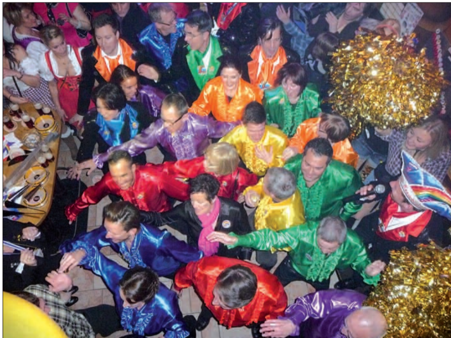
Buntes Treiben und ausgezeichnete Stimmung beim Kneipenkarneval der KG Düsseldorf Nordlichter.