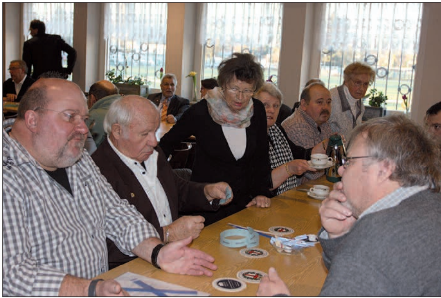
Gut besucht war das Patronatsfest am 21. Januar in Angermund. Es gibt aber noch Luft nach oben!