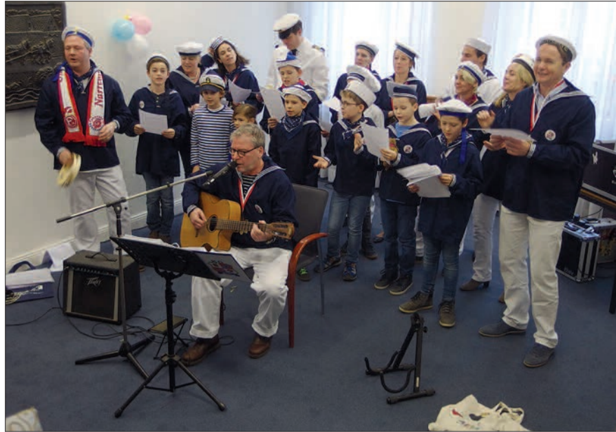
Die Wittlaerer Karnevalisten „ElWis“ bei ihrem musikalischen Vortrag.