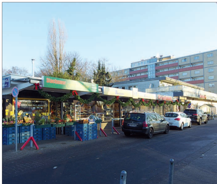
Das Einkaufszentrum in Stockum rund um die Kreuzung Kaiserswerther Straße/Am Hain/Stockumer Kirchstraße wird gut angenommen und kann alles bieten, vom Supermarkt bis zu (zwei) Apotheken, von der Sparkasse bis zum Reisebüro. Hier die Ladenzeile „Süldenfuß“.

men intern priorisiert und dann sukzessive abgearbeitet. Aus den genannten Gründen kann zu diesem Zeitpunkt noch kein konkretes Datum für die Aufnahme der Planung benannt werden.“ Diese unbefriedigende Antwort bedarf keines Kommentars. Wir haben diese häufig verwendete Formulierung der Stadtverwaltung wiederholt zitiert. Tröstlich ist nicht, dass der Oberbürgermeister vor seiner Wahl zugesagt hatte, er würde die Vororte mehr „priorisieren“, sondern dass man in Stockum auch schon jetzt sehr gut einkaufen kann. Die „Inhalte“, die Leistungsfähigkeit der Einzelhändler und Dienstleister ist maßgeblich, weniger die „Äußerlichkeiten“. In zwei Anträgen in der Sitzung am 31. Januar erweitert die Bezirksvertretung ihre Vorstellungen um mehr Verkehrssicherheit (Beleuchtung) und um die Fläche zwischen Kaiserswerther und Amsterdamer Straße.