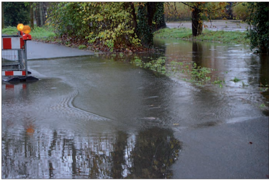
Erst Anfang Dezember war der Rahmer Bach nach langen und heftigen Regenfällen mal wieder über die Ufer getreten. Die Experten haben die Brücken als „ganz klares Abflusshindernis“ ausgemacht - und schlagen nun deren vollständige Entfernung vor.

tigen. Grundversorgung in Rahm Da mehrere Vorlagen den BV-Mitgliedern erst sehr spät zugestellt worden waren, wird es am Donnerstag, 11. Februar, um 17 Uhr eine BV-Sondersitzung im Bezirksratsgebäude geben. Dann sollen die Mandatsträger auch über einen Antrag von SPD, Bündnis 90/Die Grünen und Die Linke entscheiden, in dem es um die Sicherung der Grundversorgung und die Arrondierung des Siedlungsrandes in Rahm-Ost geht. Der Oberbürgermeister soll gebeten werden, alle notwendigen Schritte zur Änderung des Flächennutzungsplanes analog der Ausweisung des Bereiches „Am Rahmerbuschfeld“ in den Teilräumlichen Strategiekonzepten als neue Wohnbaufläche durchzuführen. Die Ausweisung der Flächen östlich der Angermunder Straße sei so zu präzisieren, dass im südlichen Bereich eine Fläche für einen Supermarkt und im nördlichen Bereich eine Wohnbebauung im Einfamilienhaussegment entwickelt werden soll. Um die zukünftige Nahversorgung Rahms zu sichern und eine maßvolle städtebauliche Weiterentwicklung zu gewährleisten, so heißt es in der Begründung, sollen die Voraussetzungen zur Erarbeitung entsprechender Bebauungspläne geschaffen werden.