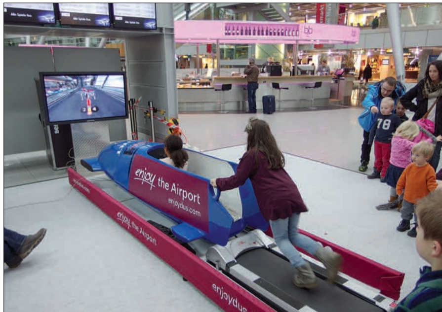
Wenn mangels Schnee das Schlittensfahren versagt bleibt, bringt der Bob-Simulator auf dem Flughafen den Spaß.

nicht verzichten möchte, dem bieten sich zahlreiche Bars und Restaurants mit „Gastro-Spezials“ an diesem Tag und natürlich auch die Shops in den Airport-Arka den zum entspannten Bummel und Einkauf am Sonntag. Eventuell quengelnde Kinder von 2 bis 11 Jahren kann man in der kostenlosen Kinderbetreuung lassen. Wer dann doch ins Freie möchte, kann bei freiem Eintritt auf die Zuschauerterrasse oder eine Flughafen-Rundfahrt mitmachen (begrenzte Teilnehmerzahl, Anmeldung ab 10.45 Uhr an der Airlebnis-Info). Soll es ein richtiger (Winter)urlaub sein, dann ist das mit etwas Glück ebenfalls kostenlos möglich: An diesem Tag buchen, am Gewinnspiel „Sie buchen – wir zahlen“ teilnehmen und dann Glück haben! Parkprobleme gibt es auf dem Flughafen nicht, und am Familien-Event-Sonntag gilt die Parkpauschale in