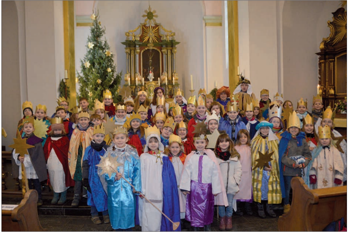
Für die Sternsinger aus Rahm und Großenbaum gab es nach der Messe leckere Waffeln als Dankeschön für ihren fleißigen Einsatz.

schließend gab es ein leckeres Waffelessen gemeinsam mit den Sternsängern aus Großenbaum. sam