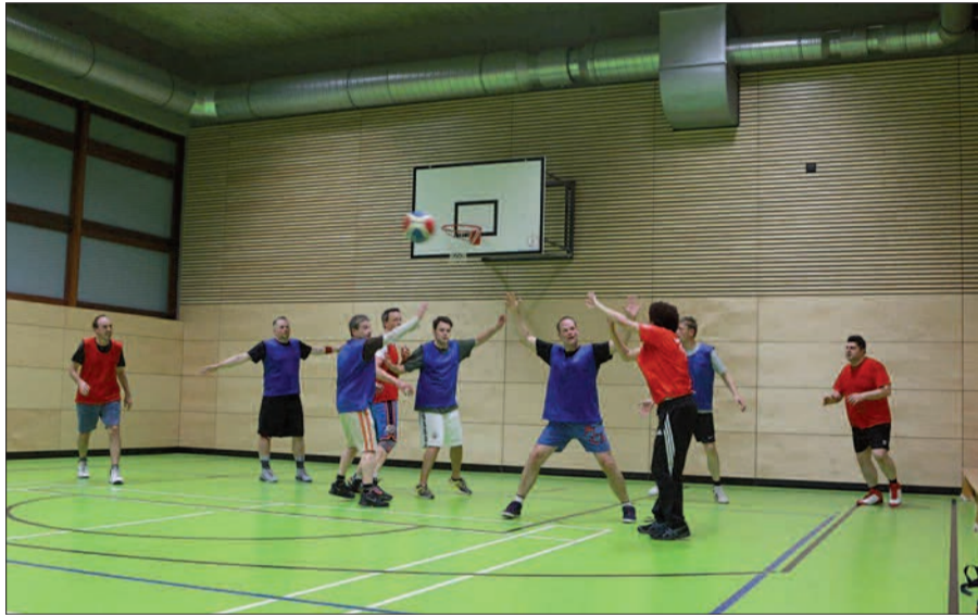
Basketballspieler des Kaiserswerther Sportvereins e.V. (KSV) in der Turnhalle des Theodor-Fliedner-Gymnasiums.