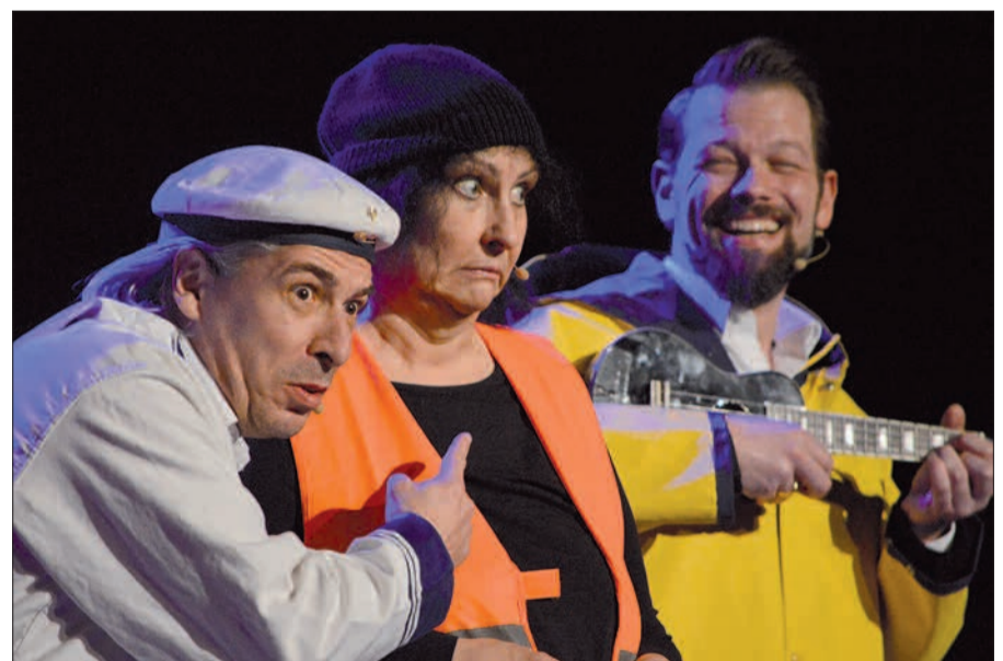
Herrliches Kabarett: „Schlachtplatte. Die Jahresendabrechnung“.