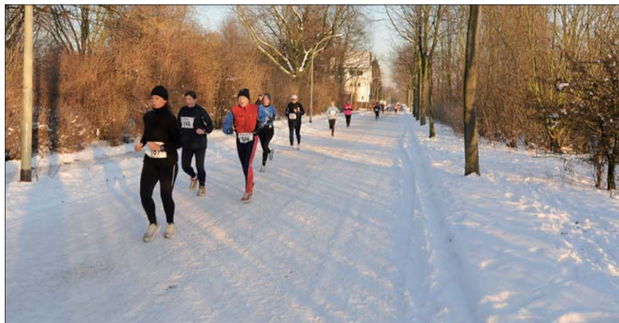
Die erste Laufveranstaltung des Jahres, der 33. Angerlauf, wurde für alle Teilnehmer zu einem Wintersportereignis. Von der Albert-Schweizer-Schule aus führte die Strecke auf verschneite Runden über den Angerdamm und durch eine Winterlandschaft, die für ein sonniges Lauferlebnis sorgte.

eine positive Bilanz: „Wir freuen uns, dass wir die Veranstaltung mit Bambini- und Schülerläufen sowie den Hauptläufen über 5 und 10 km unter diesen schwierigen Bedingungen so problemlos durchführen konnten. Es war sicher für alle Läufer ein einmaliges Wintererlebnis.“