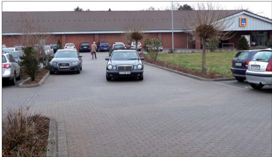
Täglich Hochbetrieb an der Niederrheinstraße. Kundschaft von Golzheim bis Huckingen kommt nach Lohausen. Schädlich für den zentralen Versorgungsbereich an der Alten Flughafenstraße?