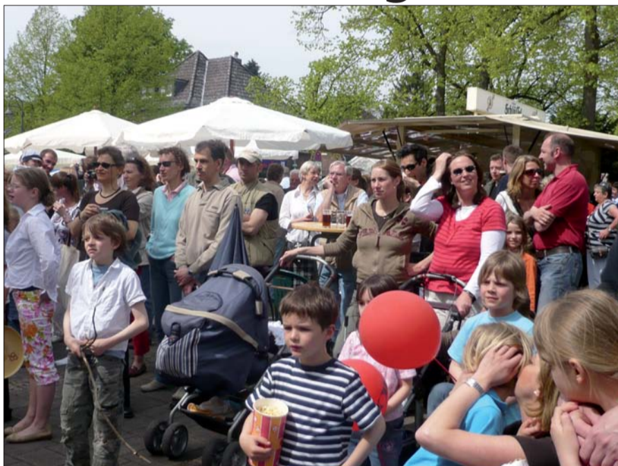
Der Düsseldorfer Norden ist kinderreich. Doch nicht überall gibt es genug Betreuungsplätze. Foto & Text: Gabriele Schreckenberg

Es steht auf der Wunschliste vieler Angermunder Eltern ganz oben, das Familienzentrum neben der Grundschule, welches endlich die nötigen U3-Plätze schaffen soll. Zumal Düsseldorf gerade stadtwweit beschlossen hat, 541 zusätzliche U3-Plätze zum Kindergartenjahr 2009/2010 zu schaffen. Doch was haben die Angermunder in diesem Jahr von den Plänen der Stadtspitze? Sie müssen sich scheinbar in Geduld fassen, denn die CDU-Fraktion lehnt so genannte Übergangslösungen, wie sie von FDP und SPD gefordert werden ab. Damit gemeint sind Container, in denen die Kinder unter drei Jahren vorübergehend untergebracht werden sollen, bis das Familienzentrum am