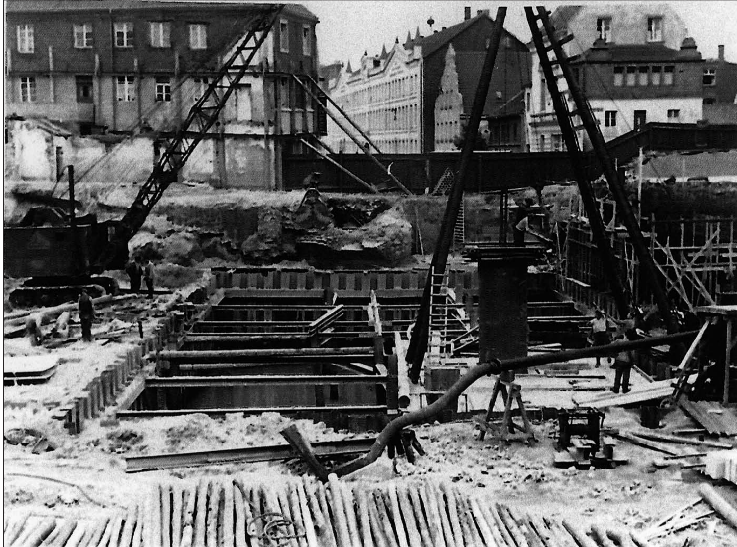
Irrsinniger Bunkerbau 1941/1942 unter dem Kaiserswerther Markt. Rechts der Hochbunker im Rohbau. Vielleicht findet man im 21. Jahrhundert doch noch eine sinnvolle, friedliche Nutzung?