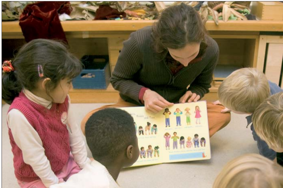
Bilinguale Erziehung in der KITA Fliedner-Straße Text: Sylvia Winkel, Foto: Kaiserswerther Diakonie (Frank Elschner)