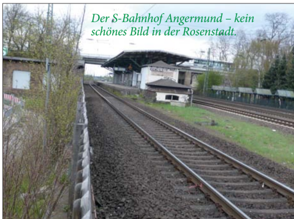
Der S-Bahnhof Angermund - kein schönes Bild in der Rosenstadt.

www.trocknungsservice-wks.de Gebäudethermografie Leckageortung Wasserschadentrocknung Bautrocknung, -beheizung info@trocknungsservice-wks.de Mobil: 0171-270 2437