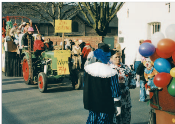
Ein Foto aus früheren Jahren beweist, wenn die Wittlaerer Jecken durchs Dorf ziehen, scheint (meistens) auch die Sonne.