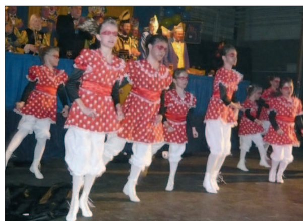
Eingetanz: Die Angersterchen sind nicht zu bremsen.