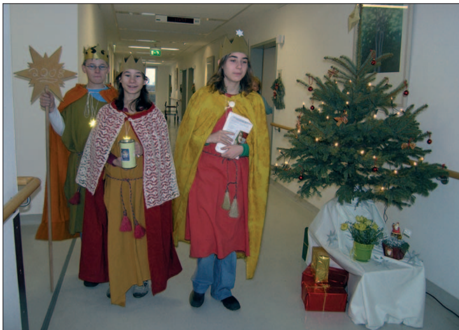
Sternsinger der Pfarrei St. Peter und Paul bei ihrem Besuch im Malteser Krankenhaus St. Anna.

Am Samstag, dem 5. Januar haben die Sternsinger der Pfarrei St. Peter und Paul aus Duisburg-Huckingen das Malteser Krankenhaus St. Anna besucht. Drei Gruppen brachten den Segen „Christus mansionem benedicat – Christus segne dieses Haus“ zu allen Patienten und Mitarbeitern des Krankenhauses.