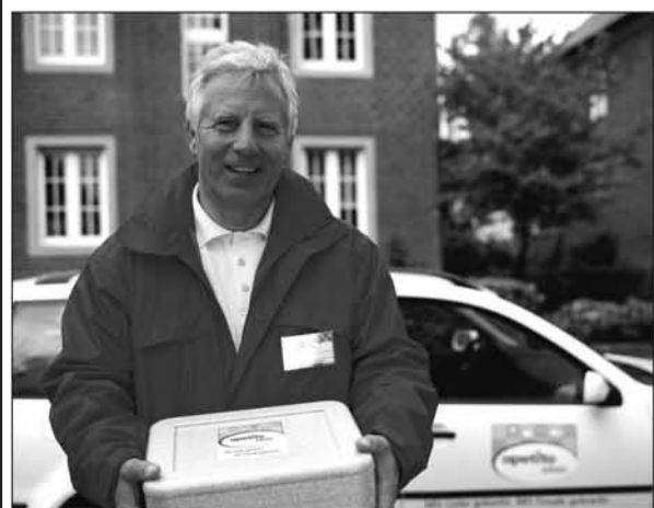
Die Menükuriere bringen das heiße Mittagessen auch bei Wind und Wetter zu den „apetito zuhaus“-Kunden.